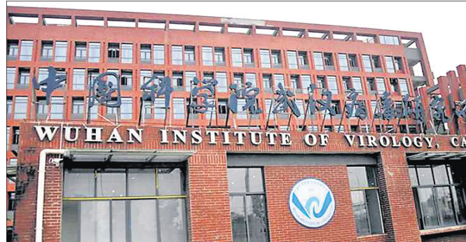
ନୂଆଦିଲ୍ଲୀ/ଓଶିଂଗନ, ୨୮: କରୋନା ଉତ୍ପତ୍ତିର ଖୋଜାଢ଼ି

ମହାମାରୀ କରୋନା ସଂକ୍ରମଣକୁ ବର୍ତ୍ତମାନ ଉତ୍ପତ୍ତିର ଉତ୍ସାହୀନ ନେଇ ଦୈନିକିକମାନେ କୋଭିଡ୍ ନିଷର୍ଷରେ ପହଞ୍ଚିପାରି ନାହାନ୍ତି।