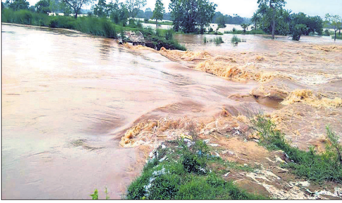
ଦୈତରଣୀ ଶାଖା କାଶୀ ନଦୀର ପଲ୍ଲୀସାହି ନିକଟରେ ହୋଇଥିବା ଘାଇ।

ବାଟ୍ୟା 'ଯାସ୍' ଯୋଗୁଁ ଦୈତରଣୀର ଶାଖା କାଶୀ ନଦୀବନ୍ଧରେ ୩ଟି ଘାଇ କଣ୍ଠପଡ଼ା, ପଲ୍ଲୀସାହି ଓ ନିଉବାକ କାମଦେବମହାରୀଠାରେ ଘାଇ ସୃଷ୍ଟି ହୋଇଛି। ବର୍ଷେ ନ ପୂରୁଣୁ ଦୈତରଣୀ ନଦୀବନ୍ଧରେ ପୁଣି ଘାଇ ସୃଷ୍ଟି ହେବା ସମ୍ଭବ ଅଞ୍ଚଳବାସୀଙ୍କ ଜୀବନଜୀବିକାକୁ ବିପଦ କରିଛି। ଏହା ରାଜ୍ୟ ସରକାରଙ୍କ ଜଳ ସମ୍ପଦ ବିଭାଗର ନିୟୋଜିତ ଅଧିକାରୀଙ୍କ କାର୍ଯ୍ୟଦକ୍ଷତା ଓ ସ୍ୱଚ୍ଛତା ନେଇ ପ୍ରଶ୍ନବାଚୀ ସୃଷ୍ଟି କରିଛି। ତେବେ ଏହି ୩ ଘାଇ ଯୋଗୁଁ ୪ ବ୍ଲକ୍‌ର ୧୦୧ ଗ୍ରାମର ୨୫,୦୩୩ଲୋକ ପ୍ରଭାବିତ ହୋଇଥିବାବେଳେ ୭୬ ଗ୍ରାମର ୧୩,୬୦୫ ଲୋକ ଜଳବନ୍ଦୀ ହୋଇଥିବା ସରକାରୀ ଭାବେ ଜଣାଯାଇଛି। ଗତବର୍ଷ ଅଗଷ୍ଟ ବନ୍ୟାରେ ଜିଲ୍ଲାରେ ୨୫ଟି ଘାଇ ସୃଷ୍ଟି ହୋଇଥିଲାବେଳେ କିଛିଦିନ ବିରୋଧୀଙ୍କ ସ୍ୱର ସତେଜ ରହି ପୁଣି ମଉଜିବିଦାକୁ ଏଭଳି ପରିସ୍ଥିତି ସୃଷ୍ଟି ହୋଇଥିବା ଏବେ ସବୁଠି ଚର୍ଚ୍ଚା ହେଉଛି। ଗତବର୍ଷର ୨୫ଟି ଘାଇର ମରାମତି ପାଇଁ ୧୨ କୋଟି ୩୯ ଲକ୍ଷ ଟଙ୍କା ଅଟକଳ ହୋଇଥିଲା। ଓସିସିଏଲକୁ ଏହାର ଦାୟିତ୍ୱ ଦିଆଯାଇଥିଲା। ସେଥିମଧ୍ୟରୁ ଯାକପୁର ଜଳସେଚନ ଭିଜ୍ଜନ ଅଧୀନରେ ୪ଟି ଘାଇ ବନ୍ଦପୁର,