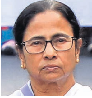
ଉପସ୍ଥିତ ଥିବାରୁ ତୃଣମୂଳ କଂଗ୍ରେସ (ବିଏମ୍‌ସି) ପୁସ୍ତମୋ ଏପରି କରିଥିବା ଆଲୋଚନା ହେଉଛି।