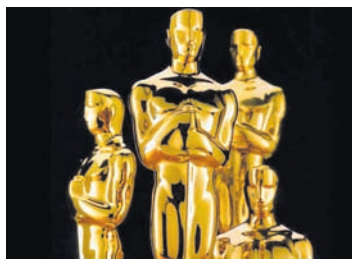
ଦି ସ୍କାନ୍ ମେସିନ୍' ଚଳଚ୍ଚିତ୍ର ପୁରସ୍କାର ଉପରେ ପ୍ରକ୍ରିୟାରେ ସାମିଲ ହୋଇପାରି ନ ଥିଲେ।

କୋଭିଡ୍ ମହାମାରୀ କାରଣରୁ ଓଫିସ୍ ସେକ୍ଟରରେ ୨୦୨୨ରୁ ଗୋଟିଏ ମାସ ଘୁଞ୍ଚିଲା ଦିଆଯାଇଛି। ଏକାଡେମୀ ଅଫ୍ ମୋଶନ ପିକ୍ଚର ଆର୍ଟ୍ ଆଣ୍ଡ୍ ସାଇନ୍ସ (ଏଏମ୍ପିଏଏସ୍) ଏହି ନିଷ୍ପତ୍ତି ନେଇଛି।