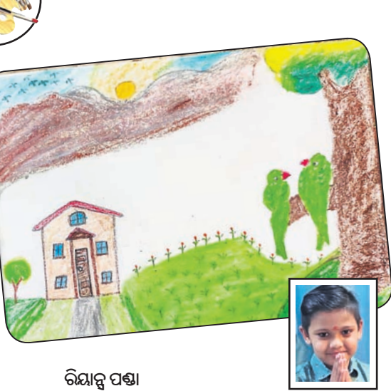
ରିୟାନ୍ସ ପଣ୍ଡା କ୍ୱାସ-୧, ରବୀନ୍ଦ୍ର ଭାରତୀ ଗ୍ଳୋବାଲ୍ ସ୍କୁଲ, ବେଙ୍ଗାଲୁରୁ