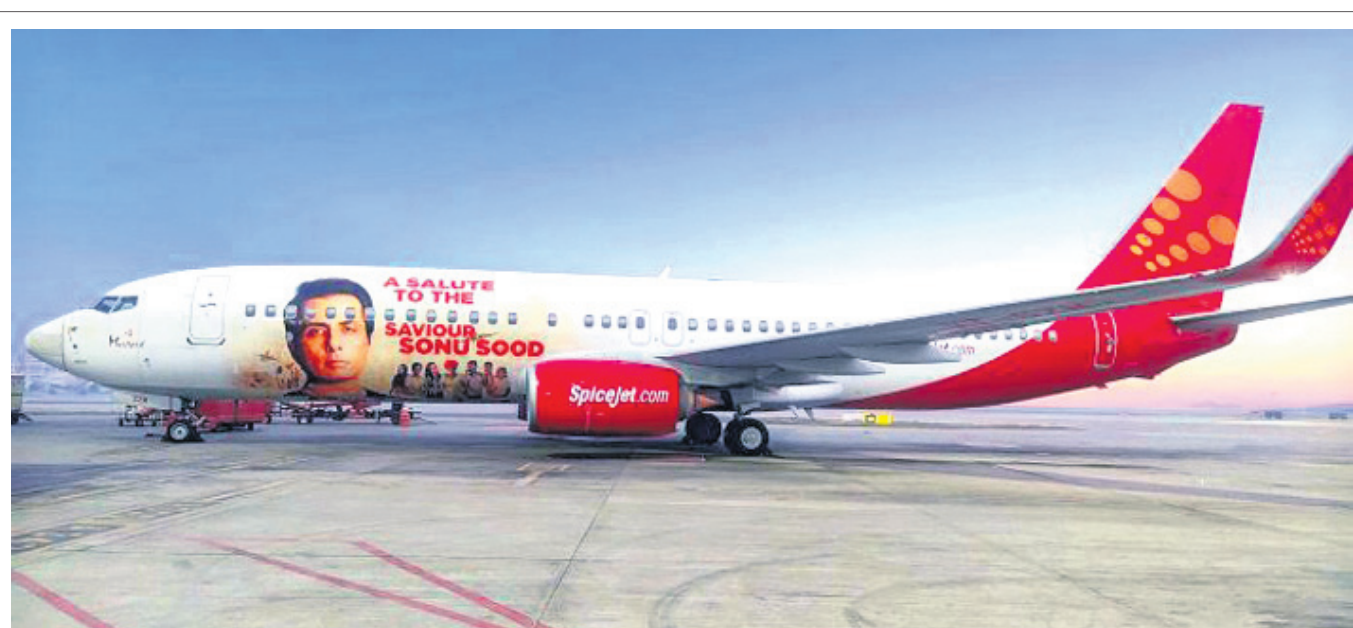
ବାରାଣସୀ ବିମାନବନ୍ଦରରେ ଥିବା ସ୍ପାଇସଜେଟ୍ ଏକ ବିମାନରେ ବଲିଉଡ୍ ଅଭିନେତା ସୋନୁ ସୁଦ୍ଧଙ୍କ ଫଟୋ ରହିଛି। କୋଭିଡ୍-୧୯ ଲକ୍ଷ୍ମୀଭଙ୍ଗ ବେଳେ ସୋନୁଙ୍କ ସମାଜ ସେବାକୁ ସମ୍ମାନ ଜଣାଇ ସ୍ପାଇସଜେଟ୍ ଏପରି କରିଛି।

କୋଲକାତା, ୨୮: ସାମ୍ବିକ ଝଡ଼ 'ୟାସ୍' ପ୍ରଭାବରେ କ୍ଷତିଗ୍ରସ୍ତ ପଶୁମାନଙ୍କ ପାଇଁ ପୁଖ୍ୟମନ୍ତ୍ରୀ ମମତା ବାନାର୍ଜୀ ଶୁକ୍ରବାର ୨୦ ହଜାର କୋଟି ଟଙ୍କାର କେନ୍ଦ୍ରୀୟ ସହାୟତା ଦାବି କରିଛନ୍ତି।