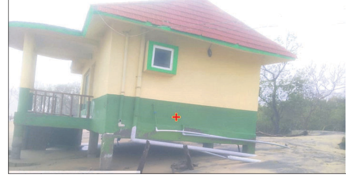
ହାବେଳିଖତିରେ ଥିବା ରେଷୁ ହାଉସ ତଳୁ କୁଆର ବାଲି ଚାଡ଼ି ନେଇଛି।

ଜାତୀୟ ଉଦ୍ୟାନର ହାବେଳିଖତିଠାରେ ସମୁଦ୍ର କୁଳରେ ୨୦୧୮ରେ ପ୍ରାୟ ୧ କୋଟି ଟଙ୍କା ବ୍ୟୟରେ ୪ଟି କଟକେ ନିର୍ମାଣ କରାଯାଇଥିଲା। ଏକକ୍ରମାଠାରେ ଥିବା ଅତିଥୁ ଭବନର ଛପର ଉତ୍ତାର ନେଇଛି। ତାଙ୍ଗମାଳାଠାରେ ଥିବା ପୁଅକିମ୍ପ ଉପରେ ଗଛ ପଡ଼ି ଭାଙ୍ଗି ଯାଇଛି। ନଳିତାପାଟିଆ ବିଟ ହାଉସ ଓ ତାଙ୍ଗମାଳ ଭିତରେ ଥିବା ୨ଟି ରିସର୍ଭ କୁଳରେ ଯୌବର୍ଯ୍ୟ ଉପଭୋଗ କରିବା ପାଇଁ ହାବେଳିଖତିଠାରେ ନିର୍ମାଣ କରାଯାଇଥିବା କଟକେଷୁଡ଼ିକ ବାଟ୍ୟା ପ୍ରଭାବରେ କ୍ଷତି ଘଟିଛି। ତଳିତବାଟ୍ୟାରେ ସମୁଦ୍ର କୁଆର ହାବେଳିଖତିରେ ଡାକ୍ଷେ ରହିଛି। ତଳଫିନ ହାଉସ ଉପରେ ସମୁଦ୍ର କୁଆର ମାଡ଼ ହେବାରୁ କବାଟ ଭାଙ୍ଗି ଯିବା ରହିଥିଲା। ଏଥିସହ ହାଉସ ତଳୁ ୨ ଫୁଟ ଗଭୀର ମାଟି ଓ ବାଲିକୁ କୁଆର ଘୋଲ ହୋଇଥିବା ଗ୍ରାମବାସୀ କହିଛନ୍ତି। ବନ୍ୟା ଜଳଘେରରେ ରହିଥିବା ୧୪୫୩ ଜଣ ଲୋକଙ୍କୁ ଉଦ୍ଧାର କରାଯାଇ ୧୩ଟି ଆଶ୍ରୟସ୍ଥଳୀରେ ରଖାଯାଇଛି। ୩ଟି ଏନ୍‌ଡିଆର୍‌ଏସ୍‌ ଟିଏ ଏହି କାର୍ଯ୍ୟରେ ନିୟୋଜିତ ରହିଛନ୍ତି। ଏଥିରେ ୬ ପ୍ରାଣୀକ ମୃତ୍ୟୁ ହୋଇଥିବାବେଳେ ପ୍ରାୟ ୧୪୦୦ ପ୍ରାଣୀ ପ୍ରଭାବିତ ହୋଇଛନ୍ତି। ପ୍ରାୟ ୧ ହଜାର ହେକ୍ଟର ଗାଈନୀ କ୍ଷତିଗ୍ରସ୍ତ ହୋଇଛି। ଜଳବନ୍ଦୀ ଥିବା ଲୋକଙ୍କୁ ଉଦ୍ଧାର କାର୍ଯ୍ୟ ଜାରି ରହିଛି ବୋଲି ପ୍ରଶାସନ ପକ୍ଷରୁ ସୂଚନା ଦିଆଯାଇଛି।