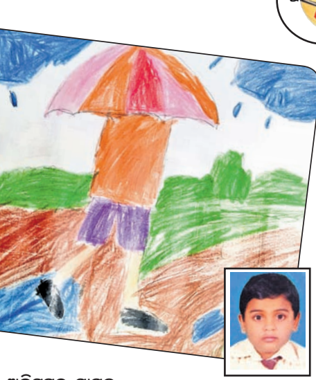
ଅଭିସୁମିତ୍ ସାମଲ କ୍ୱାସ-୧, ପ୍ରଭୁଜୀ ଜ୍ୟୋତି ମିଡ଼ିୟମ୍ ସ୍କୁଲ, ଭୁବନେଶ୍ୱର