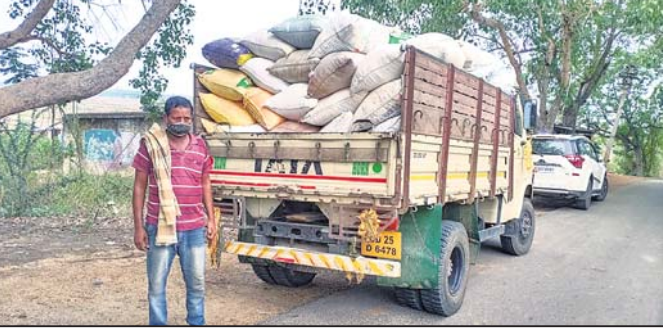
ଜବତ ହୋଇଥିବା ପିଟିଏସ୍ ବୋହେଇ ୪୦୭ ମିଳିତ୍ରକ।