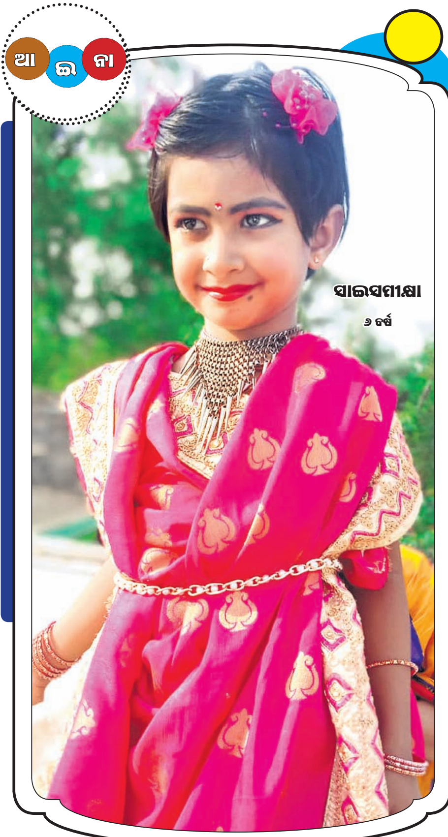
ସାଇସମୀକ୍ଷା ୬ ବର୍ଷ

ଯାଧାରଶତକ ଏହା ଆମ ଦେଶର ବିଭିନ୍ନ ଗ୍ଳାନରେ ଏପ୍ରିଲ ମାସରୁ ଅଗଷ୍ଟ ମାସ ମଧ୍ୟରେ ଏହି ନିର୍ଦ୍ଦିଷ୍ଟ ଗ୍ଳାନର ନିର୍ଦ୍ଦିଷ୍ଟ ମଧ୍ୟାହ୍ନରେ ଛିନ୍ନ ସମୟ ପାଇଁ ଦେଖିହେବ। ଆମେ ସମସ୍ତେ ଏହି ଘଟଣାକୁ ଦେଖିପାରିବା ଓ ଏହାର ମଜା ନେଇପାରିବା। କେବଳ ନିଜେ କାହିଁକି ନିଜ ପରିବାରର ସମସ୍ତଙ୍କୁ ଏହି ବିଜ୍ଞାନର ମଜାଦାର ଘଟଣାରେ ସାମିଲ କରିପାରିବା। ବେଳପୂରା, ପଞ୍ଚମାରୀ, ଝାଟପୁରପୁରା ମୋ: ୯୯୩୭୨୭୧୨୭୩