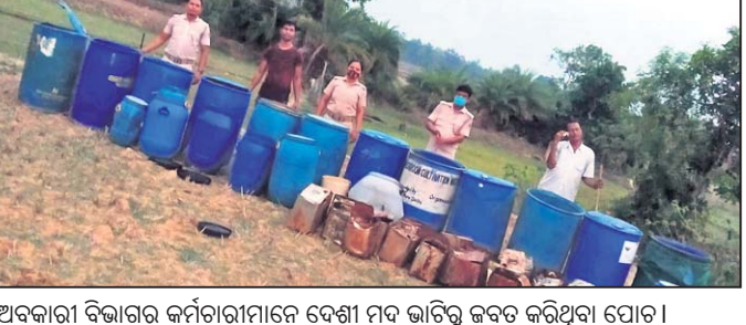
ଅବକାରୀ ବିଭାଗର କର୍ମଚାରୀମାନେ ଦେଶୀ ମଦ ଭାଟିକୁ ଜବତ କରିଥିବା ପୋଟ।