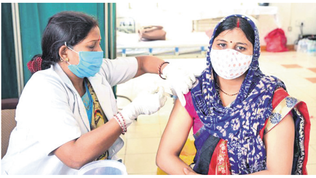
ପ୍ରୟାଗର ଏକ ରେକମ୍ପୋଜିଟରେ କଣ୍ଠେନମେଣ୍ଟ କୋଭିଡ୍ ଚିକା ଦିଆଯାଇଛି।

ଭାରତରେ ଦୈନିକ କରୋନା ସଂକ୍ରମଣ ଚଳିତ ମାସରେ ଦ୍ରୁତ ଧରଣରେ ପାଇଁ ୨ ଲକ୍ଷରୁ କମି ରହିଛି। ଶୁକ୍ରବାର ସକାଳ ସୁଦ୍ଧା ୨୪ ଘଣ୍ଟା ମଧ୍ୟରେ ୧,୮୬,୨୨୪ ପଜିଟିଭ୍ ରିଜ୍ଟ୍ ହୋଇଥିଲା, ଯାହାକି ଗତ ୪୪ ଦିନ ମଧ୍ୟରେ ସର୍ବନିମ୍ନ।