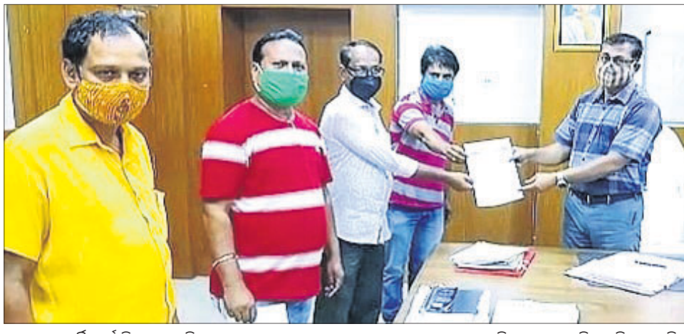
ତାଳଚେର ସ୍ଵାଗତ୍ୟ ଆସୋସିଏସନ୍ ପକ୍ଷରୁ ପୁଖ୍ୟମନ୍ତ୍ରୀଙ୍କ ଉଦ୍ଦେଶ୍ୟରେ ତାଳଚେର ଉପଜିଲ୍ଲାପାଳଙ୍କୁ ଦାବିପତ୍ର ଦିଆଯାଇଛି।