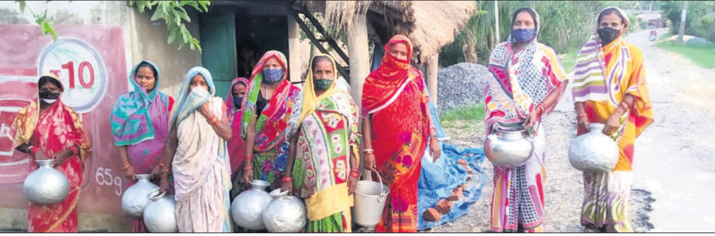
ଗୋଜାବନ୍ଧ ଗାଁର ମହିଳାମାନେ ଗରା,ମାଠିଆ ଧରି ପୋଖରୀକୁ ପାଣି ଆଣିବା ପାଇଁ ଯାଉଛନ୍ତି।