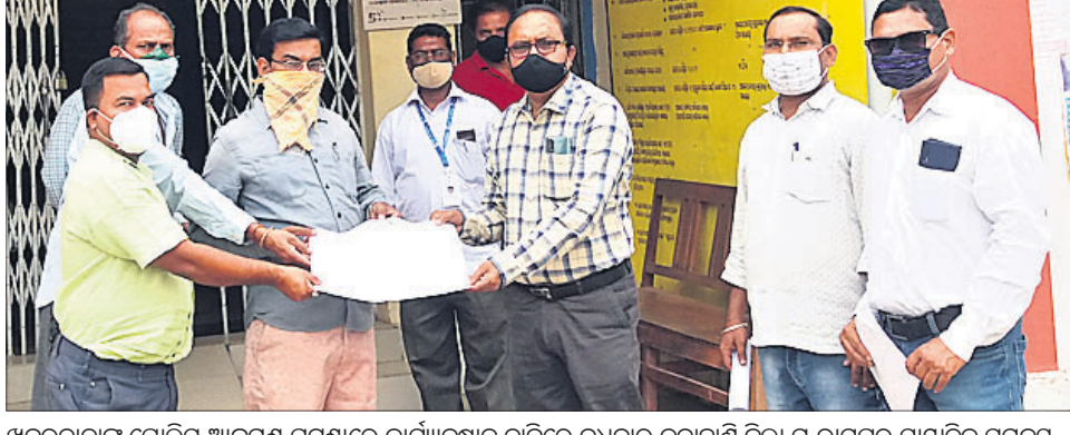
ଝରଦାତାଙ୍କୁ ପୋଲିସ ଆକ୍ରମଣ ଘଟଣାରେ କାର୍ଯ୍ୟାନୁଷ୍ଠାନ ଦାବିରେ ରୁଧିରା କନାହାଡ଼ି ଜିଲ୍ଲା ମ.ରାମପୁର ସାଧ୍ୟବିକା ସମନ୍ଵୟ ସମିତି ଏବଂ ଓଡ଼ିଶା ସାଧ୍ୟବିକା ସଂଘ ପକ୍ଷରୁ ପୁଖ୍ୟମନ୍ତ୍ରୀଙ୍କ ଉଦ୍ଦେଶ୍ୟରେ ମ.ରାମପୁର ତହସିଲଦାରଙ୍କୁ ଦାବିପତ୍ର ଦିଆଯାଇଛି।