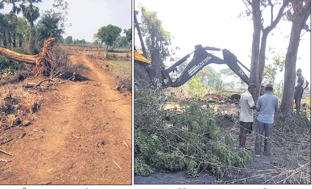
ରାସ୍ତା ପାଇଁ ବଡ଼ତର ଗଛ କଟା ଯାଇଛି।

ଉଡ଼ଗାଁ, ୨୮୫(ସ.ପ୍ର.) ନୟାଗଡ଼ ଜିଲ୍ଲା ଓଡ଼ଗାଁ ବ୍ଲକ୍ ଓ ତହସିଲ ଅନ୍ତର୍ଗତ ଦଣ୍ଡୋର-କୁରାଳ ରାସ୍ତାରେ ମହାତ୍ମା ଗାନ୍ଧୀ ଜାତୀୟ ଗ୍ରାମୀଣ ନିର୍କିତ କର୍ମ ନିୟୁକ୍ତି ଯୋଜନା (ଏମ୍‌ଜିଏନ୍‌ଆର‌ଜିଏସ୍) ରାସ୍ତା ନିର୍ମାଣ ନାମରେ ସରକାରୀ ଅଧିକାରୀଙ୍କ ଅଗୋଚରରେ ପ୍ରଭାବଶାଳୀ ବ୍ୟକ୍ତି ୫୦ରୁ ଉର୍ଦ୍ଧ୍ୱ ଶତାଧିକ ଗଛ କାଟି ନେଇ ଯାଉଥିବା ଅଭିଯୋଗ ହୋଇଛି। କାର୍ଯ୍ୟାଳୟର ଧରୁ ୫ ଦିନ ମଧ୍ୟରେ ୫୦ରୁ ଉର୍ଦ୍ଧ୍ୱ ଗଛ ବଳି ପଡ଼ିଛି। ଅବଶିଷ୍ଟ ୨୦୦ ଠାରୁ ଅଧିକ ଗଛ ବଳି ପଡ଼ିବ।