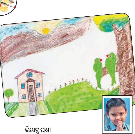
ରିୟାନ୍ତ ପଣ୍ଡା କ୍ୱାସ-୧, ରବୀନ୍ଦ୍ର ଭାରତୀ ଗ୍ଳୋବାଲ୍ ସ୍କୁଲ, ବେଙ୍ଗାଲୁରୁ