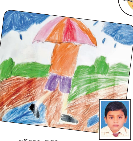
ଅଭିସୁମିତ୍ ସାମଲ କ୍ୱାସ-୧, ପ୍ରଭୁଜୀ ଜ୍ୟୋତି ମିଡ଼ିୟମ୍ ସ୍କୁଲ, ଭୁବନେଶ୍ୱର