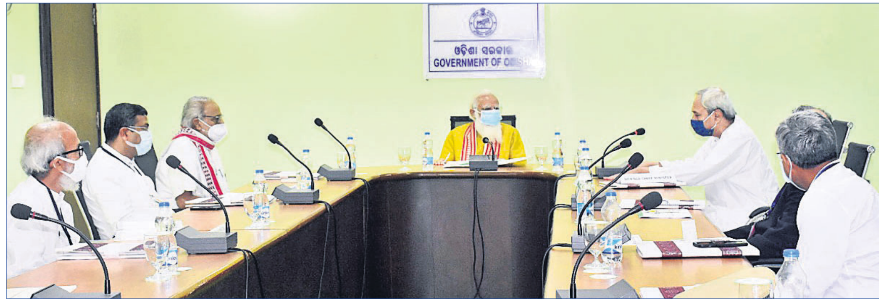
ବିଜୁ ପଟ୍ଟନାୟକ ଅବୃତ୍ତୀୟ ବିମାନବନ୍ଦର କର୍ମଚାରୀଙ୍କୁ ହଲ୍ରେ ପ୍ରଧାନମନ୍ତ୍ରୀ ନରେନ୍ଦ୍ର ମୋଦି, ରାଜ୍ୟପାଳ ପ୍ରଫେସର ରଣେଶୀ ଲାଲ, ମୁଖ୍ୟମନ୍ତ୍ରୀ ନବୀନ ପଟ୍ଟନାୟକଙ୍କ ଉପସ୍ଥିତିରେ ଅନୁଷ୍ଠିତ ସମୀକ୍ଷା ବୈଠକ।