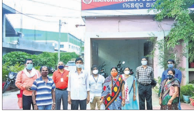
ମଞ୍ଚେଶ୍ୱର ଥାନାରେ ନାବାଳିକା ପରିବାର ଲୋକଙ୍କ ସହ ରାଷ୍ଟ୍ରୀୟ ସମାଜସେବା ପରିଷଦ ସଦସ୍ୟ ।

ମଞ୍ଚେଶ୍ୱର ଥାନା ପୁରୁଷୋତ୍ତମ ବସ୍ତିରୁ ଜଣେ ନାବାଳିକା ଅପହରଣ ହେବାର ୮ମାସ ବିତିଗଲାଣି। ହେଲେ ଏପର୍ଯ୍ୟନ୍ତ ପୋଲିସ୍ ନାବାଳିକାଙ୍କୁ ଉଦ୍ଧାର କରିପାରି ନାହିଁ। କେବଳ ଥାନାରେ ଏକ ମାମଲା ରୁଜୁ କରି ପୋଲିସ୍ ରୁପ ରହିଯାଇଥିବା ଅଭିଯୋଗ ହୋଇଛି। ଏ ନେଇ ନାବାଳିକାଙ୍କ ମା'ବାପା ଥାନାକୁ ବୌଦ୍ଧି ନୟାନ୍ତ ହେବା ପରେ ତିସପି ଓ କମିଶନର ଅଫିସ ଯାଇ ଅଭିଯୋଗ କରିଥିଲେ। ସେଠାରେ ମଧ୍ୟ କେବଳ ପ୍ରତିଶ୍ରୁତି ହିଁ ମିଳିଥିଲା। ଶେଷରେ ନିରୁପାୟ ହୋଇ ନାବାଳିକାଙ୍କ ମାଗାପିତା ରାଷ୍ଟ୍ରୀୟ ସମାଜସେବା ପରିଷଦର ସାହାଯ୍ୟ ଲୋଡ଼ିଛନ୍ତି। ଫଳରେ ଶୁକ୍ରବାର ସେମାନଙ୍କୁ ନେଇ ସଂଗଠନର ସଦସ୍ୟମାନେ ମଞ୍ଚେଶ୍ୱର ଥାନାରେ ପହଞ୍ଚି ଥାନାଧିକାରୀଙ୍କୁ ବାବିପତ୍ର ଦେଇଛନ୍ତି। ଯଦି ୨୪ ଘଣ୍ଟା ମଧ୍ୟରେ