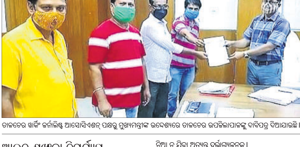
ତାଳଚେର ଖାର୍କି କର୍ମାଳିଷା ଆସୋସିଏଟସ୍ ପକ୍ଷରୁ ପୁଖ୍ୟମନ୍ତ୍ରୀଙ୍କ ଉଦ୍ଦେଶ୍ୟରେ ତାଳଚେର ଉପଜିଲ୍ଲାପାଳଙ୍କୁ ଦାବିପତ୍ର ଦିଆଯାଇଛି।