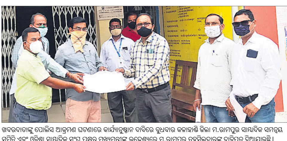
ଖବରଦାତାଙ୍କୁ ପୋଲିସ ଆକ୍ରମଣ ଘଟଣାରେ କାର୍ଯ୍ୟାନୁଷ୍ଠାନ ଦାବିରେ ବୁଧବାର କନାହାଡ଼ି ଜିଲ୍ଲା ମ.ରାମପୁର ସାମ୍ବାଦିକ ସମନ୍ବେ ସମିତି ଏବଂ ଓଡ଼ିଶା ସାମ୍ବାଦିକ ସଂଘ ପକ୍ଷରୁ ପୁଖ୍ୟମନ୍ତ୍ରୀଙ୍କ ଉଦ୍ଦେଶ୍ୟରେ ମ.ରାମପୁର ତହସିଲଦାରଙ୍କୁ ଦାବିପତ୍ର ଦିଆଯାଇଛି।