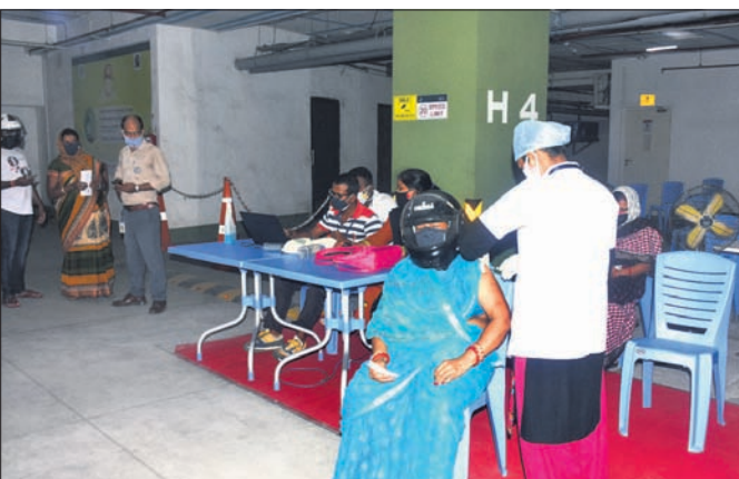
ଉତ୍କଳ କନିକା ଗ୍ୟାଲେରିଆ ପରିସରରେ ଚିକାକରଣ କରାଯାଇଛି।

ଚିକା ଦିଆଯିବ। ଚିକା ନେବା ପରେ ହିଟାଧିକାରୀଙ୍କୁ ୩୦ ମିନିଟ୍ ନିରୀକ୍ଷଣରେ ରଖାଯିବ। ଏହାପରେ ହିଟାଧିକାରୀଙ୍କ ଶରୀରରେ ଚିକାକରଣ କିଛି ପାର୍ଶ୍ୱ ପ୍ରତିକ୍ରିୟା ଥିଲେ ତାହା ଜଣାପଡ଼ିବ। ହେଲେ ଡ୍ରାଇଭ୍ ଇନ୍ ଭାକ୍ସିନେଶନ୍‌ରେ ଏ ସବୁର ଉଲ୍ଲଙ୍ଘନ ହେଉଥିବା ଦର୍ଶାଇ ସ୍ୱାସ୍ଥ୍ୟ ଓ ପରିବାର କଲ୍ୟାଣ ବିଭାଗ ପକ୍ଷରୁ ରୁକ୍ଷ ଏହାକୁ ବନ୍ଦ କରିବାକୁ ଚାହାନ୍ତି କରାଯାଇଥିଲା। ତେବେ ବିଏମସି ପକ୍ଷରୁ ଏହାକୁ ବନ୍ଦ କରାଯିବା ପରିବର୍ତ୍ତେ ଗାଇଡଲାଇନ୍‌କୁ କଡ଼ାକଡ଼ି ପାଳନ କରାଯାଉଥିବା ଦର୍ଶାଇ ଚିକାକରଣ ଚାଲୁ ରଖାଯାଇଛି। ଏପରି କି ଶୁକ୍ରବାରଠାକୁ ଫର୍ଟୁୟନ୍ ଡାକ୍ତର ଓ ବିତ୍ୟ କଲ୍ୟାଣ ମଞ୍ଚପରେ ମଧ୍ୟ ଏହି ଚିକାକରଣ ଆରମ୍ଭ କରିବାକୁ ଉପଦେଶ ଦିଆଯାଇଛି। ପୂର୍ବରୁ ଲୋକମାନେ ଗାଡିରେ ବସି ଚିକା ନେଉଥିବାବେଳେ