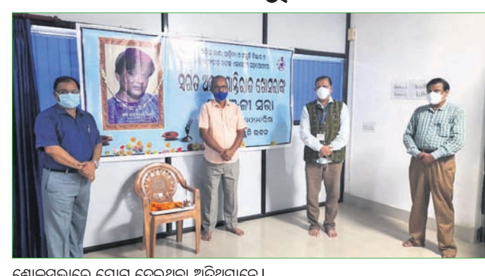
ଶୋକସଭାରେ ଯୋଗ ଦେଇଥିବା ଅଭିଯୋଗୀ ।

ହଜାର ପରେ ପଞ୍ଜୀକରଣ ପାଇଁ ୯୭ ହଜାର ଟଙ୍କା ଦେବାକୁ ପଡ଼ିବ ବୋଲି କହିଥିଲେ। ଏପରିକି ସେଥିରେ ଥିବା ତଥ୍ୟର ୩୭ ଲକ୍ଷ ଟଙ୍କା ହେବ, ଏହି ତଥ୍ୟରୁ ଭାରତୀୟ ମୁଦ୍ରାରେ ରୁପାନ୍ତର ହେବା ପାଇଁ ୨ ଲକ୍ଷ ୬୦ ହଜାର ଦେବାକୁ ପଡ଼ିବ ବୋଲି ଉକ୍ତ ମୁକ୍ତ କହିଥିଲେ। ଏଥିରେ ସର୍ବପ୍ରସନ୍ନ ଲୋଭରେ ପଡ଼ି ଏକ ବ୍ୟାଙ୍କ ଆକାଉଣ୍ଟରେ ଟଙ୍କା ପଠାଇ ଦେଇଥିଲେ। ଏହିପରି ବିଭିନ୍ନ ଆଲଭେ ସର୍ବପ୍ରସନ୍ନ ୩ ଲକ୍ଷ ୯୫ ହଜାର ଦେଇଥିଲେ। ତଥାପି ଉପହାର ପହଞ୍ଚିବା ପାଇଁ ଆଉ ୫ ଲକ୍ଷ ଟଙ୍କା ମାଗିବାରୁ ସେ ସନ୍ଦେହ କରିଥିଲେ। ପରେ ହଠାତ୍ ଫୋନ କରିଥିବାରୁ ସେହି ନମ୍ବରରେ କଲ୍ କରିବା ସତ୍ତ୍ୱେ ନ ଲାଗିବାରୁ ଠକାମିର ଠକଣାରେ ପହଞ୍ଚିବା ପାଇଁ ପ୍ରଥମେ ୩