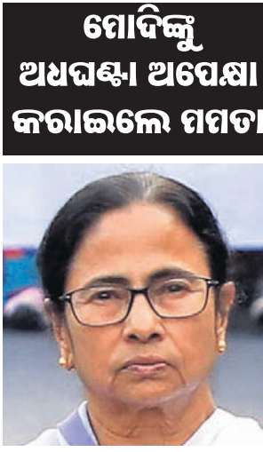
ଉପସ୍ଥିତ ଥିବାବୁ ବୃଣ୍ଡାମୁନି କଂଗ୍ରେସ (ବିଏମସି) ପ୍ରତିନେତା ଏପରି କରିଥିବା ଆଲୋଚନା ହେଉଛି।