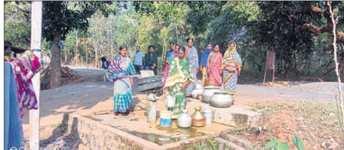
ନଳକୂପରୁ ପାଣି ସଂଗ୍ରହ କରୁଛନ୍ତି ମହିଳା ।

ଖଜୁରିପଡ଼ା ରୁକ୍ଷପାଳିତ ପ୍ରାଣୀମାନଙ୍କ ଚିକିତ୍ସା ପାଇଁ ପ୍ରତ୍ୟେକ ପଞ୍ଚାୟତରେ ସରକାର ପ୍ରାଣୀ ସହାୟକ କେନ୍ଦ୍ର ଖୋଲି ସେଠାରେ ତାତ୍ତ୍ୱ ନିୟୁକ୍ତି ଦେଇଛନ୍ତି । ହେଲେ କାର୍ଯ୍ୟକ୍ରମ ପ୍ରାଣୀ କେନ୍ଦ୍ରରୁ ଚଳାଉଁଥିବା ହେବ ବିପର୍ଯ୍ୟସ୍ତ ଅବସ୍ଥାରେ ପଡ଼ିଛି । ପ୍ରାଣୀ ସହାୟକ କେନ୍ଦ୍ରରୁ ଚିକିତ୍ସା ଆବଶ୍ୟକ ତାତ୍ତ୍ୱ ରହୁ ନ ଥିବାରୁ ଗ୍ରାମାଞ୍ଚଳରେ ଗାଈଗୋରୁ ଉପରେ ନିର୍ଭର କରି ଚଳୁଥିବା ଲୋକମାନେ ବହୁ ଅସୁବିଧାର ସମ୍ମୁଖୀନ ହେଉଛନ୍ତି । ଭାରତ ଏକ କୃଷିପ୍ରଧାନ ଦେଶ । ତେଣୁ ଗ୍ରାମାଞ୍ଚଳରେ ବସବାସ କରୁଥିବା ଲୋକମାନେ ମୁଖ୍ୟତଃ ଓହ୍ଲାଇବେ ବୋଲି ତଥାକାରୀ ମଧ୍ୟ ଦେଖିଛନ୍ତି ।