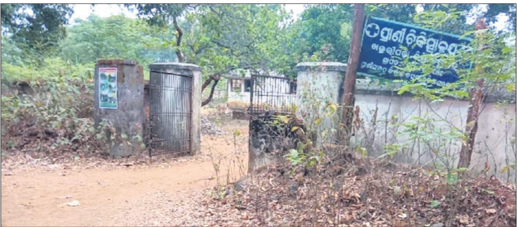
ବିପର୍ଯ୍ୟସ୍ତ ଅବସ୍ଥାରେ ପ୍ରାଣୀ ଚିକିତ୍ସାଳୟ ।