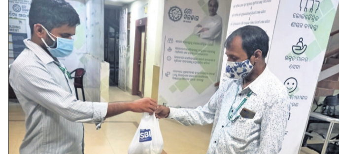
ଏସ୍.ଆଇ ପକ୍ଷରୁ କୋଭିଡ୍ ହସିଚାଲଗୁଡ଼ିକରେ ଖାଦ୍ୟ ବ୍ୟବସ୍ଥା କରାଯାଇଛି।

ପ୍ରାୟ ୮୦୦ ଜଣ କୋଭିଡ୍ କାର୍ଯ୍ୟରେ ନିଯୋଜିତ ଥିବା ଭାରତ, ନର୍ସ ଓ ଅନ୍ୟ ଆରୋଗ୍ୟ କର୍ମଚାରୀଙ୍କୁ ବ୍ୟାଙ୍କ ପକ୍ଷରୁ ଖାଦ୍ୟପୁରୁଷା ପ୍ରଦାନ କରାଯାଇଥିଲା।