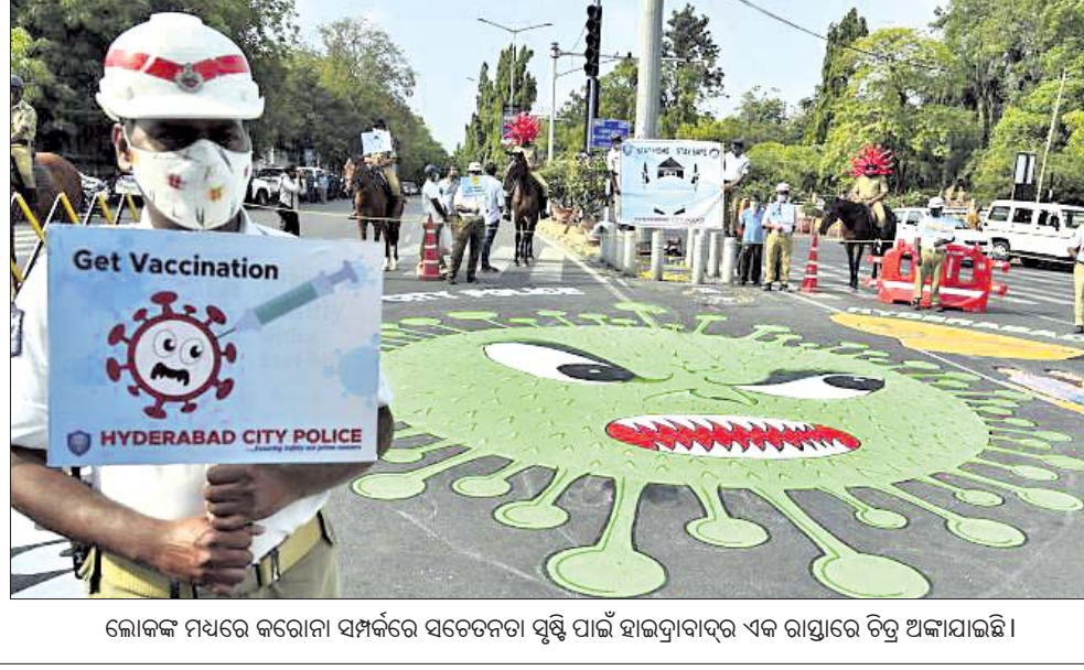
ଲୋକଙ୍କ ମଧ୍ୟରେ କରୋନା ସମ୍ପର୍କରେ ସଚେତନତା ସୃଷ୍ଟି ପାଇଁ ହାଲଡ୍ରାବାଦ୍ ଏକ ଗାଆଁରେ ଚିତ୍ର ଅଙ୍କାଯାଇଛି।

ଭୋପାଳ, ୨୯୮୫ ଏକ ଲାକ୍ଷ ମାମଲାରେ ବଡ଼ କରୁଥିବା ସିପିଆଇ ଶନିବାର ମଧ୍ୟପ୍ରଦେଶରେ ଭୋପାଳରେ ଜଣେ ସରକାରୀ କିରାଣୀଙ୍କ ଘରେ ଚଢ଼ାଇ କରି ୨.୧୭ କୋଟି ଟଙ୍କା ଟଙ୍କା ୮ କିଲୋଗ୍ରାମ ସୁନା ଅଳଙ୍କାର ଜବତ କରିଛି। ଏଥିସହିତ ସେଠାରୁ ଟଙ୍କା ଗଣା ମଣିଷ ମଧ୍ୟ ସିପିଆଇ ଅଧିକାରୀମାନେ ଜବତ କରିଛନ୍ତି। ଭାରତର ଖାଦ୍ୟ ନିମନ୍ତ (ଏଏଫଆଇ) ଲାକ୍ଷ କାରବାର ମାମଲାରେ ପୂର୍ବରୁ ୪ ଜଣ ଅଧିକାରୀଙ୍କୁ ରିମଫ କରାଯାଇଥିଲା। ଶନିବାର ଚଢ଼ାଇ ବେଳେ ଏଏଫଆଇ କିରାଣୀ କିଶୋର ମାମାଙ୍କ ଘରୁ ଏହି ନଗଦ ଟଙ୍କା ଜବତ ହୋଇଛି।