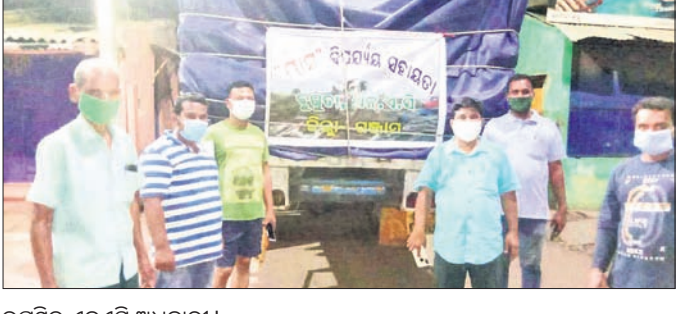
ଉପସ୍ଥିତ ଏନ୍.ଏସି ଅଧିକାରୀ ।