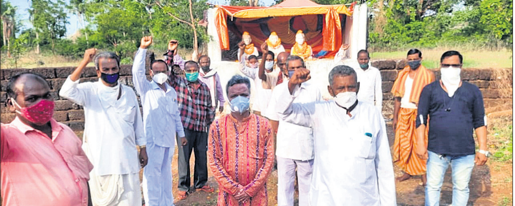
ପ୍ରତିଯୁକ୍ତ ଗୁଲରେ ଉପସ୍ଥିତ ମହାଧନୁ ଚଳାଉଛି ଶହାଦ ଦିବସ କର୍ମକର୍ମୀ ।