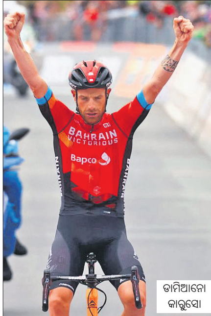
ଡାକ୍ତରୀ ଟିମ୍ କାରୁସୋ ମଧ୍ୟରେ ୩୦.୩ କିଲୋମିଟର ବିଶିଷ୍ଟ ଅତିମ ଷ୍ଟେଜ୍ ୨୧ ଅନୁଷ୍ଠିତ ହେବ। ଯେନ୍ସ ଓ କାରୁସୋ ମଧ୍ୟରୁ ଜଣେ କେହି ବର୍ନାଲକୁ କେନେଡାଲ କ୍ଲବ୍ ଟିମ୍‌ରେ ଟେକ୍ସଟ୍ରେ ପ୍ରଥମ ସ୍ଥାନରୁ ହଟାଇ ପାରୁଛନ୍ତି କି ନା ତାହା ସ୍ପଷ୍ଟ ହେବ।

ରୋମ୍, ୨୯ ମଇ: ଗିରୋ ଡି'ଇଟାଲିଆ ସାଇକେଲ ରେସ୍ ୨୦୨୦ ଫିନାଲ୍ ଶନିବାର ଅନୁଷ୍ଠିତ ହୋଇଯାଇଛି। ଭାରତୀୟ ଡାକ୍ତରୀ ସାଇକେଲ ଟିମ୍ ୧୨୪ କିଲୋମିଟର ବିଶିଷ୍ଟ ଏହି ଷ୍ଟେଜ୍ରେ ଇଟାଲିଆ ଡାକ୍ତରୀ ଟିମ୍ କାରୁସୋ (ବାହାରିନ୍ ଡିକୋରିଅସ୍) ପ୍ରଥମ ସ୍ଥାନ ଅଧିକାର କରିଛନ୍ତି। ସେ ୪ ଘଣ୍ଟା ୨୭ ମିନିଟ୍ ଓ ୫୩ ସେକେଣ୍ଡ ଟାଇମ୍ରେ ଟାଇମ୍ ରେକର୍ଡ୍ ଖେଳି ଚାଲିଯାଇଛନ୍ତି। ଟାଇମ୍ରେ ୨୪ ସେକେଣ୍ଡ ଓ ୩୫ ସେକେଣ୍ଡ ପଛରେ ରେକର୍ଡ୍ ଖେଳି କଲମ୍ବିଆର ଜଗାନ ବର୍ନାଲ ଗୋମେଜ୍ (ଇନୋଏ ପ୍ରେନାଡିଅର୍) ଓ କଲମ୍ବିଆର ଡାକ୍ତରୀ ଟିମ୍ ମାର୍ଟିନେଜ୍ ପୋଲେଟା (ଇନୋଏ ପ୍ରେନାଡିଅର୍) ଦ୍ୱିତୀୟ ଓ ତୃତୀୟ ହୋଇଥିଲେ। ରେସ୍ ଚ୍ୟୁ ଟେକ୍ସଟ୍ରେ ରହିଥିବା ଅନ୍ୟ ରାଇଡର୍ମାନେ ଯଥାକ୍ରମେ ହେଲେ ପ୍ରାନ୍ସର, ରୋମେନ ବାଡେଟ୍ (ଟିଏ ଡିଏସ୍‌ଏମ୍), ପର୍ଟୁଗାଲର ଗୋଥାଓ ଅଲ୍ମିଡା (ଡେସିଡିନିଜ୍ କ୍ଲବ୍ ଷ୍ଟେସ୍), ଗ୍ରେଟ୍ ବ୍ରିଟେନର ସିମନ୍ ଯେନ୍ସ (ଟିଏ ବାଲ୍ଡ ଏକ୍ସପ୍ରେସ୍), ରୁଷିଆର ଆଲେକ୍ସାଣ୍ଡର ଲାସୋଭ (ଅଷ୍ଟ୍ରିଆ ପ୍ରିମିୟର ଟେକ୍), ଗ୍ରେଟ୍ ବ୍ରିଟେନର ହର୍ବ କାର୍ଡି (ଇଏସ୍ ଏକ୍ସପ୍ରେସ୍ ନିଷ୍ପା), ଇଟାଲିଆର ଲରେନ ସମୟ (କୋମେଟା ସାଇକ୍ଲିଂ ଟିମ୍) ଓ ସ୍ପେନର ଆଷ୍ଟିନିଓ ପେଡ୍ରେରୋ (ମୋଲିକ୍ସା ଟିମ୍)। ୨୦୨୦ ଷ୍ଟେଜ୍ ପରେ କେନେଡାଲ କ୍ଲବ୍ ଟିମ୍‌ରେ କଲମ୍ବିଆର ଜଗାନ ବର୍ନାଲ ଗୋମେଜ୍, ଇଟାଲିଆର ଡାକ୍ତରୀ ଟିମ୍ କାରୁସୋ ଓ ସିମନ୍ ଯେନ୍ସ ଯଥାକ୍ରମେ ପ୍ରଥମ, ଦ୍ୱିତୀୟ ଓ ତୃତୀୟ ସ୍ଥାନ ବଜାୟ ରଖିଛନ୍ତି। ଫଳରେ ବର୍ନାଲ ଟାଇମ୍ ପିକ୍‌ଉପ୍ ବଜାୟ ରଖିଛନ୍ତି। ରବିବାର ସେନାଗୋ ଓ ମିଲାନୋ