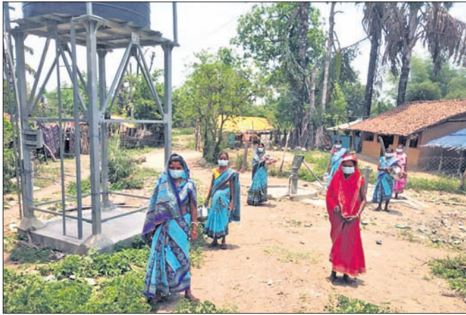
ପାନୀୟ ଜଳ ଆଣିବାକୁ ଯାଉଥିବା ଗ୍ରାମବାସୀ।

ମାଲକାନଗିରି ଜିଲ୍ଲାରେ କରୋନା ଲୋକଙ୍କ ମନରେ ଭୟ ସୃଷ୍ଟି କରିଥିବା ବେଳେ ଏନେଇ ସମସ୍ତେ ଚିନ୍ତାରେ ଅଛନ୍ତି। ଏପରି ସମୟରେ ପାନୀୟ ଜଳ ସଙ୍କଟ ଲୋକଙ୍କୁ ଅତିଷ୍ଠ କରୁଛି। ଜିଲ୍ଲାର ଅନେକ ଅଞ୍ଚଳରେ ଜଳ ସଙ୍କଟ ଦେଖାଦେଇଛି। ଏ ସମ୍ପର୍କରେ ବିଭିନ୍ନ ସମୟରେ ଖବର ପ୍ରକାଶ ପାଇଥିଲେ ମଧ୍ୟ ପ୍ରଶାସନ ସମସ୍ୟାର ସ୍ଥାୟୀ ସମାଧାନ କରୁନାହିଁ। ଜିଲ୍ଲାରେ ଜଳକଣ୍ଠ ଦୂର ପାଇଁ ଜିଲ୍ଲା ବାହାରର କେତେକ କମ୍ପାନୀ ଯୋଗାଣ ପ୍ରକଳ୍ପ ମାଧ୍ୟମରେ ପାନୀୟ ଜଳ ଯୋଗାଣ ଲାଗି ପ୍ରତି ପଞ୍ଚାୟତରେ ସୌରଚାଳିତ ପ୍ରକଳ୍ପ କରିଥିଲେ ମଧ୍ୟ କେତେକ ସ୍ଥାନରେ ଏହା ୨/୩ ସପ୍ତାହ ମଧ୍ୟରେ ଅଟକି ହୋଇପାରୁଥିବା ଗ୍ରାମବାସୀ ଅଭିଯୋଗ କରୁଛନ୍ତି। ପରବର୍ତ୍ତୀ ସମୟରେ ପ୍ରକଳ୍ପ ଦାୟିତ୍ୱରେ ଥିବା ଠିକାଦାରମାନେ ନିମ୍ନମାନର କାର୍ଯ୍ୟ କରି ଅର୍ଥ ହାତେଇ ନେଉଛନ୍ତି। ଏପରି ଦେଖିବାକୁ ମିଳିଛି