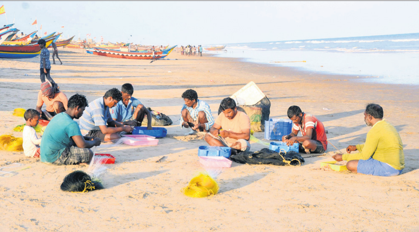
ସାମୁଦ୍ରିକ ଝଡ଼ 'ଧାବ' ଯିବା ପରେ ପୁରୀ ବେଳାଭୂମିରେ ଜୀବିକା ପାଇଁ ପୁଣି ପ୍ରସ୍ତୁତି ଆରମ୍ଭ କରିଛନ୍ତି ମତ୍ସ୍ୟଜୀବୀ ।

ନୂଆଦିଲ୍ଲୀ/ଭୁବନେଶ୍ୱର, ୨୯।୫ ଦେଶରେ କ୍ରମାଗତ ତୈଳ ଦର ବୃଦ୍ଧି ପାଇ ଚାଲିଛି । ଦିନକର ବିରତି ପରେ ଶନିବାର ପୁଣି ଥରେ ଯେତେବେଳେ ୨୬ ପଇସା ଏବଂ ତିଜେଲ ୩୦ ପଇସା ବଢ଼ିଛି । ଫଳରେ ଭୁବନେଶ୍ୱରରେ ଯେତେବେଳେ ଲିଟର ୯୪.୬୬ ଟଙ୍କା ଏବଂ ତିଜେଲ ୯୨.୪୯ ଟଙ୍କା ହେବ ପହଞ୍ଚିଛି । ଦେଶର ପ୍ରମୁଖ ତୈଳ ବିପଣନ କମ୍ପାନୀ ଇଣ୍ଡିଆନ ଅଏଲ କର୍ପୋରେଶନ ଲିମିଟେଡ୍ (ଆଇଓପିଏଲ୍) ପକ୍ଷରୁ ମିଳିଥିବା ସୂଚନା ଅନୁସାରେ ଶନିବାର ନୂଆଦିଲ୍ଲୀରେ ଯେତେବେଳେ ଉପରେ ୨୬ ପଇସା ଏବଂ ତିଜେଲ ଫ୍ଲୁସ୍ତା-୪