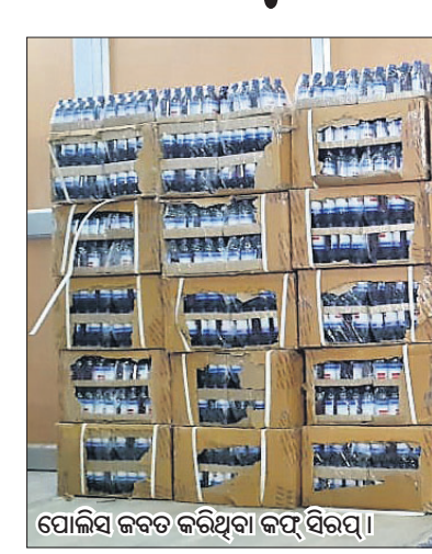
ପୋଲିସ୍ ଜବତ କରିଥିବା କର୍ମ ସିରସ୍।

କର୍ମାଗାର ଅଫିସ, ୨୯।୫ କର୍ମାଗାର ଅଫିସ ଓଡ଼ିଶାକୁ ଲମ୍ବିଛି ନିଶା ବେପାର। ଏହି ଘାଟଣାରେ ଏକ ଗୋଷ୍ଠୀରୁ ବଳାଙ୍ଗୀର ଜିଲ୍ଲା ଗୁରୁକେଲାଠାରେ ଶୁକ୍ରବାର ରାତିରେ ପୋଲିସ୍ କାବୁ କରିବା ପରେ ଏହି ଆକ୍ରମଣରାଜ୍ୟ ନିଶା କାରବାର ଘାଟଣା ସମ୍ପର୍କରେ ଜଣାପଡ଼ିଛି। ଏକ ଗୁରୁତ୍ୱପୂର୍ଣ୍ଣ ପୋଲିସ୍ ଦଳ ପରିମାଣର କର୍ମ