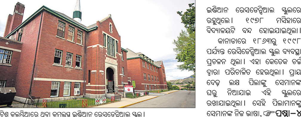
ବ୍ରିଟିଶ କଲନିଆରେ ଥିବା କମ୍‌ଲୁସ୍ ଇଣ୍ଡିଆନ୍ ରେସିଡେନ୍ସିଆଲ ସ୍କୁଲ ।

କାନାଡାର ଏକ ରେସିଡେନ୍ସିଆଲ ବା ଆବାସିକ ସ୍କୁଲ ପରିସରରୁ ୨୧୫ ପିଲାଙ୍କ ଦେହାବଶେଷ ମିଳିଛି । ସେମାନଙ୍କ ମଧ୍ୟରୁ ମୃତ୍ୟୁବେଳେ କେତେକଶତକ ବୟସ ମାତ୍ର ୩ ବର୍ଷ ହୋଇଥିଲା । ଟେମ୍‌ଲୁସ୍ ସି କ୍ଲେମେନ୍ସି ଫାଷ୍ଟ ନେଶନର ମୁଖ୍ୟ ଏହି କବର ଠାଏ ହୋଇଥିବା ନେଇ ଗୁରୁବାର ଘୋଷଣା କରିଥିଲେ । ଭୂମି ଭେଦକ ବା ଗ୍ରାଉଣ୍ଡ ପେନେଟ୍ରିଟ୍ ରାଡାର୍ ସ୍କେଣିଆଲିଷ୍ ଟିମ୍ କବରକୁ ଖୋଜି ପାଇଥିବା ଫାଷ୍ଟ ନେଶନ