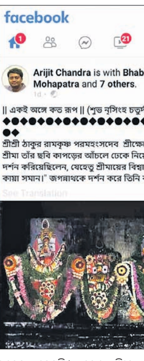
ରତ୍ନବେଦି ଫଟୋ ଭାଇରାଲ୍