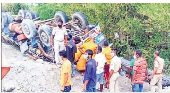
ଓଲଟି ପଡ଼ିଥିବା ଟ୍ରକ୍ ଭିତରୁ ଡ୍ରାଇଭର ଓ ହେଲ୍ପରଙ୍କ ମୃତଦେହ ବାହାର କରାଯାଇଛି।

ଭଦ୍ରକ ଜିଲ୍ଲା ଭଞ୍ଜରପୋଖରୀ ଥାନା ୧୬ ନଂ. କାଟାୟ ରାଜପଥର ପାକଦାବାଙ୍କଠାରେ ଶନିବାର ଅପରାହ୍ନରେ ଏକ ପାଇପ୍ ବୋହେଇ ଟ୍ରକ୍ ଓଲଟି ୨ ଜଣଙ୍କ ମୃତ୍ୟୁ ଘଟିଛି। ସେମାନେ ଟ୍ରକ୍ ଡ୍ରାଇଭର ଓ ହେଲ୍ପର ଆନ୍ତ୍ର ଅଞ୍ଚଳର ନିଜିର ଖାଁ, ଡି. ପୁରୀପ ବୋଲି ଜଣାପଡ଼ିଛି। ସୂଚନା ଅନୁସାରେ, ଉକ୍ତ ୧୨ ଟନିଆ ଆନ୍ତ୍ର ଟ୍ରକ୍ ବାଲେଶ୍ୱର ପଟୁ କଟକ ଆଡ଼କୁ ଟ୍ରକ୍ ଗତିରେ ଯାଉଥିବା ବେଳେ ପାକଦାବାଙ୍କଠାରେ ଭାରସାମ୍ୟ ହରାଇ ରାସ୍ତାକଡ଼କୁ ଓଲଟି ପଡ଼ିଥିଲା। ଗାଡ଼ିଟି ଓଲଟି ପଡ଼ିବାରୁ ବୋହେଇ ହୋଇଥିବା ପାଇପ୍ ଟ୍ରକ୍ ଡ୍ରାଇଭର ଓ ହେଲ୍ପରଙ୍କ ଉପରେ ଲାଦି ହୋଇଯାଇଥିଲା।