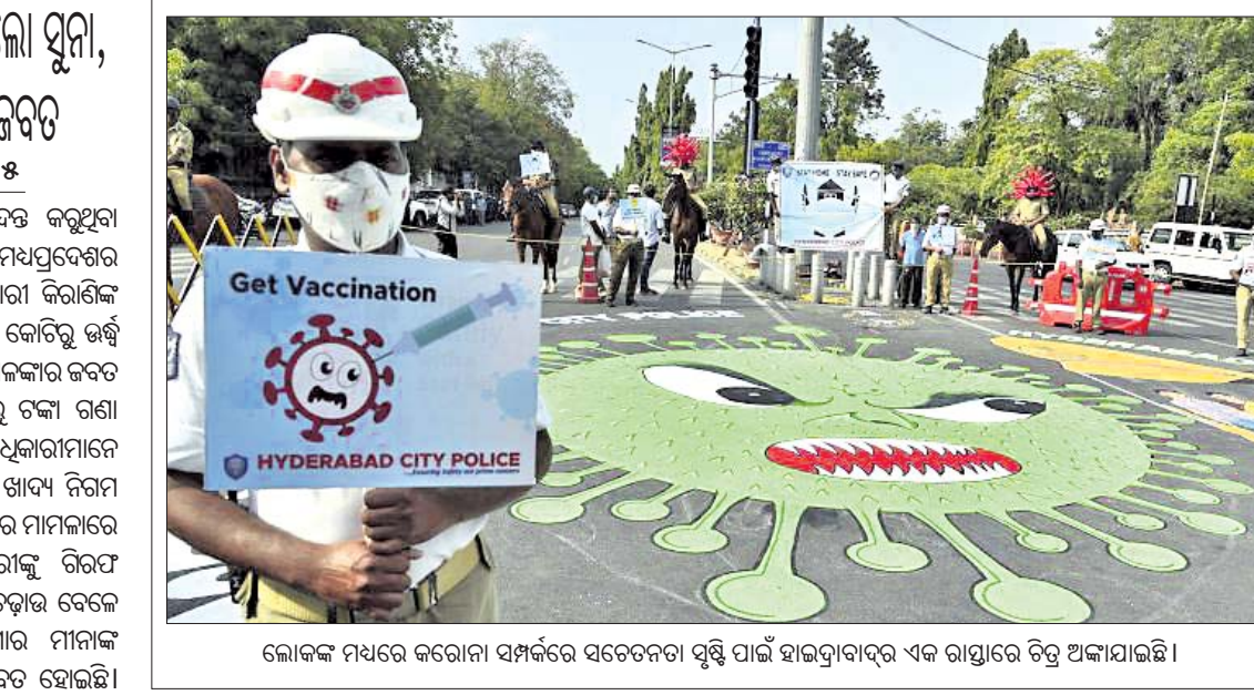
ଲୋକଙ୍କ ମଧ୍ୟରେ କରୋନା ସମ୍ପର୍କରେ ସଚେତନତା ସୃଷ୍ଟି ପାଇଁ ହାଇଦ୍ରାବାଦ୍ ଏକ ରାସ୍ତାରେ ଚିତ୍ର ଅଙ୍କାଯାଇଛି।

ଏକ ଲାଞ୍ଚ ମାମଲାରେ ତଡ଼ କରୁଥିବା ସିଆଇ ଶନିବାର ମଧ୍ୟପ୍ରଦେଶର ଭୋପାଳରେ ଜଣେ ସରକାରୀ କିରାଣିଙ୍କ ଘରରୁ ୮ କିଲୋ ଗ୍ରାମ୍ ସୁନା ଓ ୨.୧୭ କୋଟି ଟଙ୍କା ଜବତ କରାଯାଇଛି। ଏଥିରେ ୩୨ ଜଣଙ୍କ ମୃତ୍ୟୁ ଘଟିବା ସହ ପ୍ରାୟ ୨ ହଜାରରୁ ଅଧିକ ଘର ନଷ୍ଟ ହୋଇଛି।