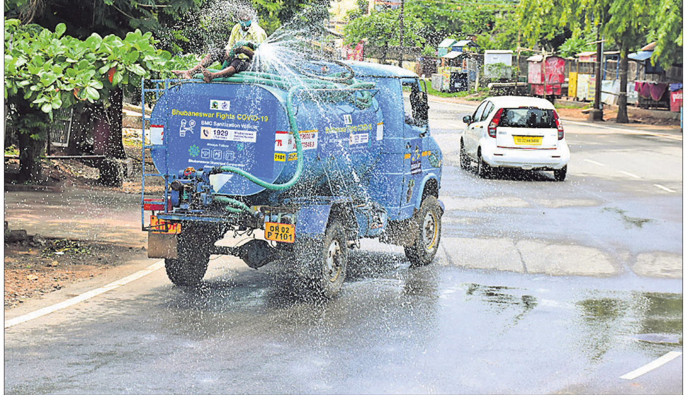
ପୁରୁଣା ଭୁବନେଶ୍ୱର ମାଉସା ମା' ଛକରେ ଶିବପୁର ବିଏଫ୍ସି ପକ୍ଷରୁ ସାନିଟାଇଜ୍ କରାଯାଇଛି।