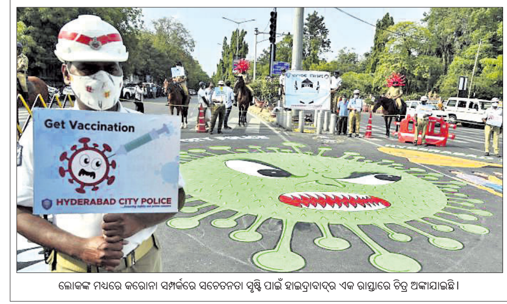
ଲୋକଙ୍କ ମଧ୍ୟରେ କରୋନା ସମ୍ପର୍କରେ ସଚେତନତା ସୃଷ୍ଟି ପାଇଁ ହାଇଦ୍ରାବାଦ୍ ଏକ ରାସ୍ତାରେ ଚିତ୍ର ଅଙ୍କାଯାଇଛି।

ଏକ ଲାଞ୍ଚ ମାମଲାରେ ଚଢ଼ି କରୁଥିବା ସିଆଇ ଶନିବାର ମଧ୍ୟପ୍ରଦେଶର ଭୋପାଳରେ ଜଣେ ସରକାରୀ କିରାଣିକ ଘରେ ଚଢ଼ାଉ କରି ୨.୧୭ କୋଟି ଟଙ୍କା ଟଙ୍କା, ୮ କିଲୋଗ୍ରାମ ସୁନା ଅଳଙ୍କାର ଜବତ କରିଛି। ଏଥିସହିତ ସେଠାରୁ ଟଙ୍କା ଗଣା ମଶିନ ମଧ୍ୟ ସିଆଇ ଅଧିକାରୀମାନେ ଜବତ କରିଛନ୍ତି। ଭାରତର ଖାଦ୍ୟ ନିରାମ (ଏଫସିଆଇ) ଲାଞ୍ଚ କାରବାର ମାମଲାରେ ପୂର୍ବରୁ ୪ ଜଣ ଅଧିକାରୀଙ୍କୁ ରିଲିଫ କରାଯାଇଥିଲା। ଶନିବାର ଚଢ଼ାଉ ବେଳେ ଏଫସିଆଇ କିରାଣିକ ଗୋମା ମାମଲା ଘରୁ ଏହି ନଗଦ ଟଙ୍କା ଜବତ ହୋଇଛି।