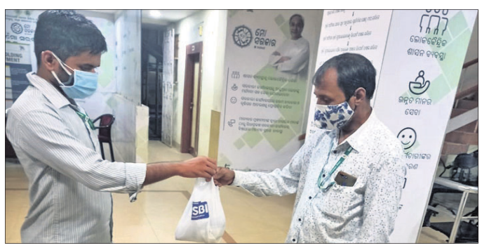
ଏସ୍‌ବିଆଇ ପକ୍ଷରୁ କୋଭିଡ୍ ସେକ୍ଟରରୁଟିକରେ ଖାଦ୍ୟ ବ୍ୟବସ୍ଥା କରାଯାଇଛି।

ପ୍ରାୟ ୮୦୦ ଜଣ କୋଭିଡ୍ କାର୍ଯ୍ୟରେ ନିୟୋଜିତ ଥିବା ଡାକ୍ତର, ନର୍ସ ଓ ଅନ୍ୟ ଆରାଧିତ କର୍ମଚାରୀଙ୍କୁ ବ୍ୟାଙ୍କ ପକ୍ଷରୁ ଖାଦ୍ୟପୁରୁଷା ପ୍ରଦାନ କରାଯାଇଥିଲା। ଏହି ମହତ୍ତ୍ୱ କାର୍ଯ୍ୟ ବ୍ୟାଙ୍କର ପୂଣ୍ୟ ମହାପ୍ରବନ୍ଧକ ରୁମା ଦେବ ଚକ୍ରାବର୍ତ୍ତୀଙ୍କ ଅନୁମୋଦନ ହୋଇଥିଲା। ବ୍ୟାଙ୍କର ବହୁ ଅଧିକାରୀ ଓ କର୍ମଚାରୀ ଦାୟିତ୍ୱ ସମ୍ପୂର୍ଣ୍ଣ ଭାବେ ପରିଚାଳନା କରିଥିଲେ।