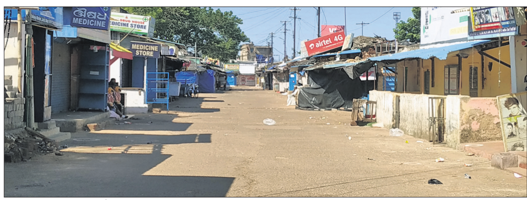
ସମ୍ପାଦକ ଶତ୍ରୁଘ୍ନ ପାଇଁ ଶନିବାର ଜଟଣୀ ରେକ୍ ଷ୍ଟେଶନ ନିକଟ ଗୋଲେଇ ମାକେଟ୍ ରାସ୍ତା ଶୁନଶାନ ରହିଛି।

ଜେଲ ଡିଭି ସନ୍ତୋଷ ଉପାଧ୍ୟକ୍ଷ ନିର୍ଦ୍ଦେଶକ୍ରମେ ବିଭାଗ ପକ୍ଷରୁ ଚାଲିଛି 'ଅପରେଶନ କ୍ଲିନ୍ ଅପ୍'। ଜେଲକୁ ନିଶ୍ଚା କାରବାର ଓ ମୋବାଇଲ୍ ଫୋନ୍ ମୁକ୍ତ କରିବା ପର୍ଯ୍ୟନ୍ତ ଏପରି ଅଭିଯାନ ଚାଲୁ ରହିବ ବୋଲି ପୁଣ୍ୟାଳୟ ପକ୍ଷରୁ ଏକ ପ୍ରେସ ବିଜ୍ଞପ୍ତିରେ କୁହାଯାଇଛି। ହେଲେ ଝାରପଡ଼ା ଜେଲରୁ କେବଳ ମାସକ ଭିତରେ ୨୧ ମୋବାଇଲ୍ ଫୋନ୍, ନିଶ୍ଚାନ୍ତ୍ୟ ମିଳିଥିଲେ ମଧ୍ୟ ଏସବୁ ଭିତରକୁ କିପରି ଗଲା ତାହାର ଉତ୍ତର ବିଭାଗୀୟ ଅଧିକାରୀଙ୍କ ପାଖରେ ନାହିଁ। ଜବତ ମୋବାଇଲ୍ ଫୋନ୍ରେ ବାରମ୍ବାର ଭଏସ୍ କଲ୍, ମେସେଜ୍, ଭିଡିଓ କଲ୍ ହୋଇଛି।