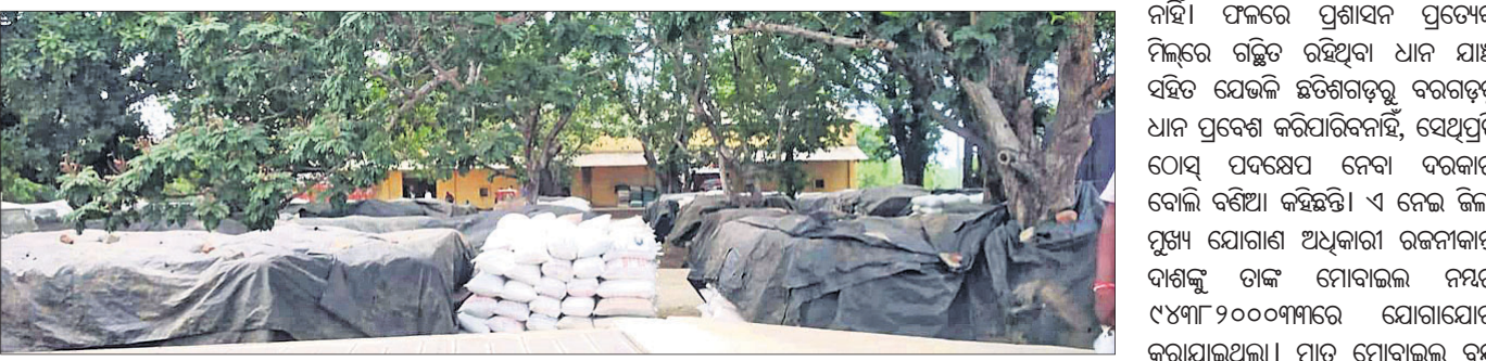
ବରଗଡ଼ ଜିଲ୍ଲା ଖାରବନ୍ଧ ମଣ୍ଡଳରେ ଚିକିତ୍ସା ପ୍ରଦାନ ପଡ଼ିଥିବା ଧାନ।

ଭୁବନେଶ୍ଵର, ୩୦।୫ (ଭ୍ୟୁରୋ): ବରଗଡ଼ ଜିଲ୍ଲାରେ ଧାନ କିଣାବିକା ପ୍ରକ୍ରିୟାରେ ଏଯାବତ୍ ସୁଧାର ଆସିନାହିଁ। ଖେତିଆର ଯୋଗାଣ ନିରୀକ୍ଷକ ସୁନୀତା ଦେବଦାସୀ, ଗୋବିନ୍ଦ କଟକଟା ଗୋଷ୍ଠୀଙ୍କ ଧାନ ଚିକିତ୍ସା ଗ୍ରାମରେ ଧାନ ଚିକିତ୍ସା କରାଯାଇଛି।