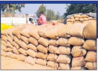
ବରଗଡ଼ରୁ ସର୍ବାଧିକ ୨ ଲକ୍ଷ ୮ ହଜାର ୮୯ ମେଟ୍ରିକ୍ ଟନ୍ ଖୁବ୍‌ଶୀଘ୍ର କୋରାପୁଟ, ଖୋର୍ଦ୍ଧା, ଯାଜପୁରରେ ଆରମ୍ଭ ହେବ

ଯେପରି ସହଜରେ ମଣିରେ ଧାନ ବିକ୍ରି କରିପାରିବେ ସେ ନେଇ ସମସ୍ତ ପଦକ୍ଷେପ ଗ୍ରହଣ କରିବାକୁ ବିଭାଗୀୟ ମନ୍ତ୍ରୀ ରଣେନ୍ଦ୍ର ପ୍ରତାପ ସାଲ୍ ଯାତ୍ରା ଓ କ୍ଷେତ୍ର ଅଧିକାରୀଙ୍କୁ ନିର୍ଦ୍ଦେଶ ଦେଇଛନ୍ତି।