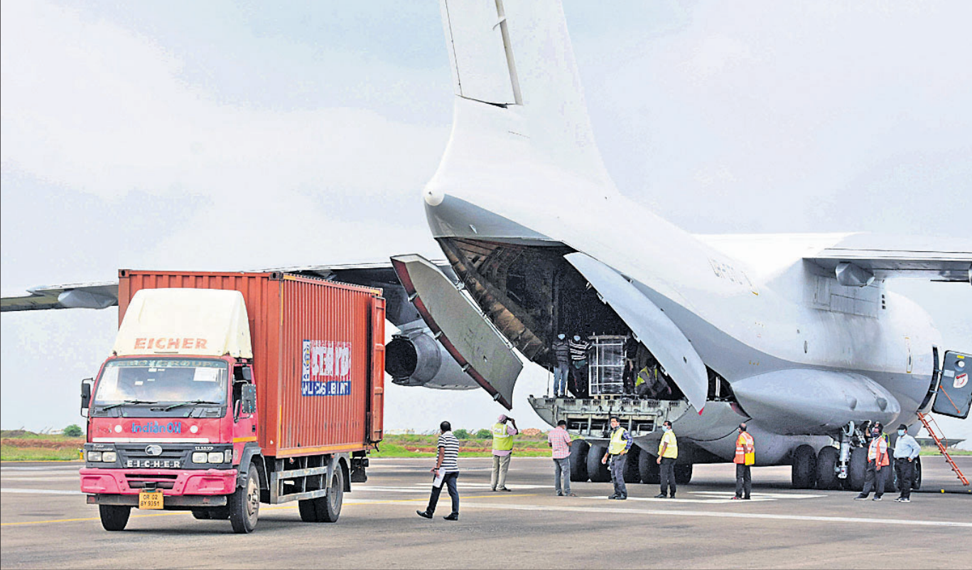
ଭୁବନେଶ୍ଵର ବିଜୁ ପଟ୍ଟନାୟକ ଆନ୍ତର୍ଜାତୀୟ ବିମାନବନ୍ଦରରେ ରବିବାର ଚାଇନାରୁ ଆସିଥିବା ଖାଲି ଅକ୍ଟୋବର ସିଲିଣ୍ଡର ବୋହେଇ ବିମାନ।

୨୨୨୭୦୦୦୦) ଜାରି କରାଯାଇଛି। ସରକାର ନିର୍ଦ୍ଧାରିତ ଦରରେ ଅକ୍ଟୋବର ସିଲିଣ୍ଡର ରିଫିଲ୍ କରିବା ବାଧ୍ୟତାମୂଳକ।