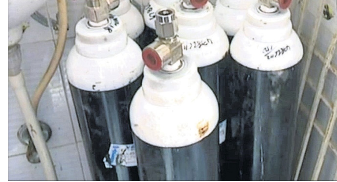
ଜବତ ଅକ୍ଟୋବର ସିଲିଣ୍ଡର।