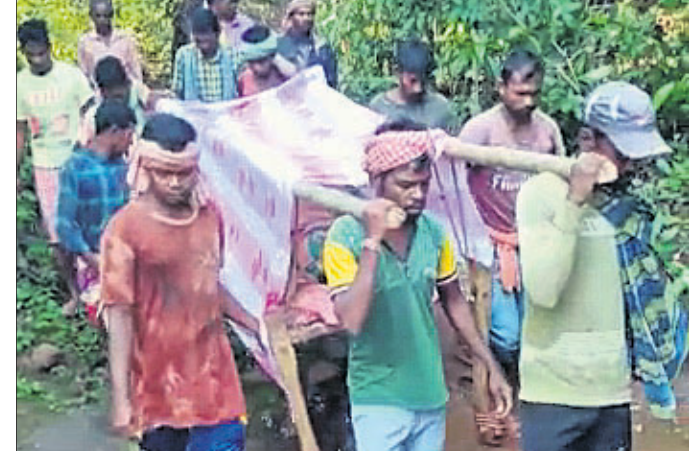
ଗ୍ରାମବାସୀ ଗର୍ଭବତୀଙ୍କୁ ଖଟିଆରେ ନେଇ ତାହୁଣ୍ଡାଖାନାକୁ ଯାଉଛନ୍ତି।

ପନ୍ଥରଭଞ୍ଜ ଜିଲ୍ଲା କରଞ୍ଜିଆ ବ୍ଲକ୍ ଅଧୀନ ରୁଥୀଶି ପଞ୍ଚାୟତର ବଡ଼ବାରହାଳାପୁର ଗ୍ରାମର ଜଣେ ଗର୍ଭବତୀଙ୍କୁ ୫ କିଲୋମିଟର ଖଟିଆରେ ବୋହି ତାହୁଣ୍ଡାଖାନାକୁ ନେଇ ପହଞ୍ଚାଯାଇଛି।