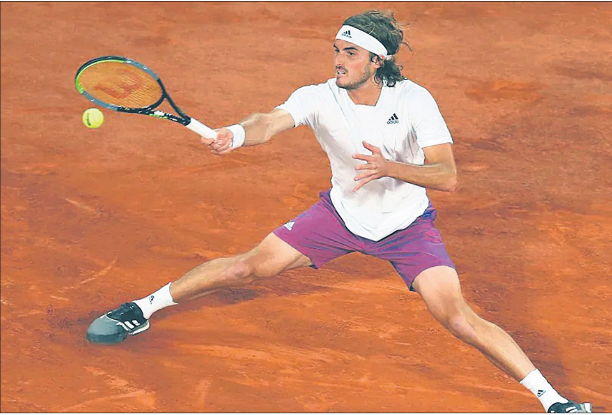
ଫ୍ରେଣ୍ଡ୍ ଓପନ ଗ୍ରାଣ୍ଡସ୍ଲାମ ଚେନିସ ପୁରୁଷ ସିଙ୍ଗଲ ପ୍ରଥମ ରାଉଣ୍ଡ ଅବସରରେ ଚିଟ୍ଟଂ ଶର୍ ଖେଳୁଛନ୍ତି ଗ୍ରାପ୍ଟର ଷ୍ଟ୍ରିମୋସ୍ ସିଦ୍ଧିପାସ୍ୟ ।