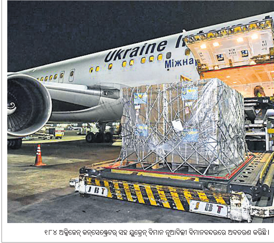
୧୮୪ ଅକ୍ଟୋବର କନ୍‌ସେଣ୍ଟ୍ରର ସହ ଯୁକ୍ତେନ ଦିନ ନୂଆଦିଲ୍ଲୀ ବିମାନବନ୍ଦରରେ ଅବତରଣ କରିଛି।

କେନ୍ଦ୍ରକେନ୍ଦ୍ରୀୟ, ୩୧।୫: ଉପ୍ରାଧିକାରୀ ପ୍ରଧାନମନ୍ତ୍ରୀ ପଦ ହରାଇପାରନ୍ତି ବେଶ୍‌ଆସିନ ନେତାମାନଙ୍କୁ ବିରୋଧୀ ଦଳଗୁଡ଼ିକ ସହଯୋଗରେ ସରକାର ଗଢ଼ିବା ପାଇଁ ଚାହୁଁଛନ୍ତି।