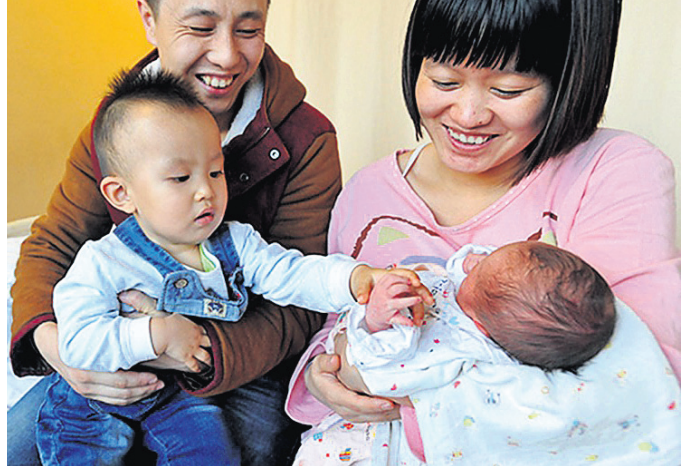
ବିଶ୍ୱର ସର୍ବାଧିକ ଜନସଂଖ୍ୟା ବିଶିଷ୍ଟ ଦେଶ ୧୦ ବର୍ଷ ମଧ୍ୟରେ ଲୋକସଂଖ୍ୟା ୫.୩୮ ଗଜନାରେ ଜନସଂଖ୍ୟା ବୃଦ୍ଧି ଧିମେଇଛି।