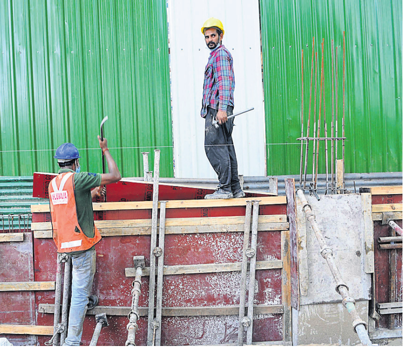
ଲକ୍ଷ୍ମୀପୁର କୋହଲ ପରେ ସୋମବାର ଦିଲ୍ଲୀରେ ନିର୍ମାଣ କାର୍ଯ୍ୟ ଆରମ୍ଭ ହୋଇଛି।

କରୋନା ମହାମାରୀର ଦ୍ୱିତୀୟ ଲହରୀ ଗତ କିଛି ସପ୍ତାହ ହେଲା ଉଦ୍‌ବେଗଜନକ ଭାବେ ବଢ଼ିଚାଲିବାରୁ ଦେଶର ସ୍ୱାସ୍ଥ୍ୟସେବା ବ୍ୟବସ୍ଥା ଏକପ୍ରକାର ଘାଣ୍ଟି ପାଇଛି।