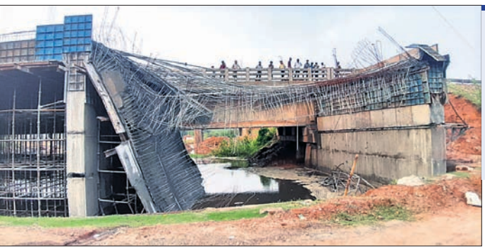
ଭୁଗୁଣ୍ଡି ପଡ଼ିଥିବା ନିର୍ମାଣାଧୀନ ପୋଲ।

ଯାକପୁର ଜିଲ୍ଲା ପାଣିକୋଇଲି ଥାନା ଅଧୀନ ବ୍ରଜନଗର ପାଖରେ ୧୬ ନମ୍ବର ଜାତୀୟ ରାଜପଥରେ ନିର୍ମାଣାଧୀନ ବ୍ରିଜ୍ ସୋମବାର ଅପରାହ୍ଣ ପ୍ରାୟ ସାଢ଼େ ୩ଟାରେ ଭୁଗୁଣ୍ଡି ପଡ଼ିଛି।