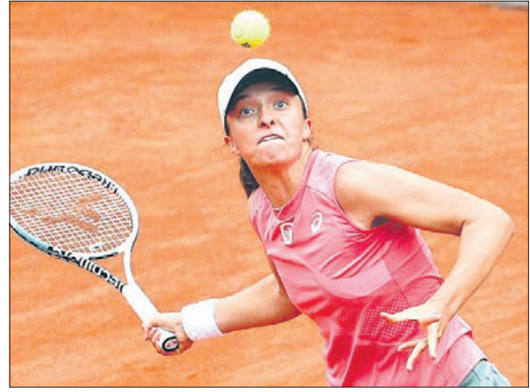
ମହିଳା ସିଙ୍ଗଲ ପ୍ରଥମ ରାଉଣ୍ଡ ବିଜୟୀ ଇରା ସ୍ୱିଡେନ ।

ଫ୍ରେଣ୍ଡ୍ ଓପନ ଗ୍ରାଣ୍ଡସ୍ଲାମ ଚେନିସ ପୁରୁଷ ସିଙ୍ଗଲ ପ୍ରଥମ ରାଉଣ୍ଡ ଅବସରରେ ଚିଟ୍ଟଂ ଶର୍ ଖେଳୁଛନ୍ତି ଗ୍ରାପ୍ଟର ଷ୍ଟ୍ରିମୋସ୍ ସିଦ୍ଧିପାସ୍ୟ ।