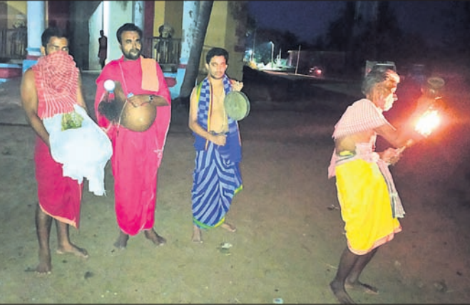
ଠାକୁରକୁ ବିନା ପରିବେଶେ ଖଟୁଳିରେ ନିଆଯାଉଛି।