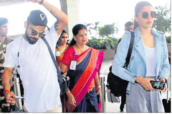
ସ୍ତ୍ରୀ ଅନୁଷ୍ଠାନ ଶର୍ମିଳା ସହ ବିରାଟ କୋହଲି।

କ୍ରୀଡ଼ାବିତ୍, ୧୫ (ପି.ଟି.): ଭାରତର ଉତ୍ତର ପୁରୁଷ ଓ ମହିଳା କ୍ରିକେଟ ଟିମ୍‌ର ଖେଳାଳି ଏବଂ ସପୋର୍ଟର ଷ୍ଟାଫ୍ ନିଜ ପରିବାରକୁ ନେଇ ଇଂଲଣ୍ଡ ଚୁର୍ରେ ଯିବା ଲାଗି ଅନୁମତି ମିଳିବ। ଭାରତୀୟ କ୍ରିକେଟ କଣ୍ଟ୍ରୋଲ ବୋର୍ଡ (ବିସିଆଇ)ର ଜଣେ ବରିଷ୍ଠ କର୍ମଚାରୀଙ୍କ ପୃଷ୍ଠା ମଙ୍ଗଳବାର ଏହା ଜଣାପଡ଼ିଛି। ଆୟୋଜକ ଦେଶର କଠୋର କ୍ୱାରାଣ୍ଟାଇନମେଣ୍ଟ ନିୟମ ଦୃଷ୍ଟିରୁ ବିଶେଷ ଚାମ୍ପିୟନଶିପ୍ (ଡକ୍ସ୍‌ସି) ଫାଇନାଲରେ ବିସିଆଇର କୌଣସି ଅଧିକାରୀ ଉପସ୍ଥିତ ରହିପାରିନାହାନ୍ତି। କ୍ରିକେଟର ବିପକ୍ଷ ଡକ୍ସ୍‌ସି ଫାଇନାଲ ଜୁନ୍ ୧୮ରୁ ୨୨ ପର୍ଯ୍ୟନ୍ତ ସାଉଥାମ୍ପଟନରେ ହେବ। ଏପରିକି ବିସିଆଇ ସହାୟତା ପାଇଁ ଗାଳ୍ପିକ ଏବଂ ସମ୍ପାଦକ ଜୟ ଶାହାଙ୍କୁ ମଧ୍ୟ ଅନୁମତି ମିଳିବନାହିଁ। ସାଧାରଣତଃ ଚେଷ୍ଟା ମ୍ୟାଚ୍ ପୂର୍ବରୁ ଯଦି କୌଣସି ପ୍ରଶାସକ ଯାଆନ୍ତି ସେ ଖେଳାଳି