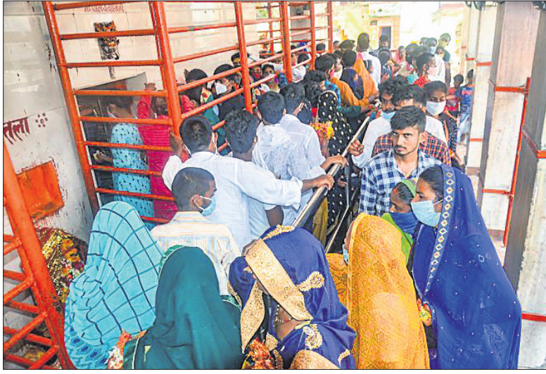
ଉତ୍ତର ପ୍ରଦେଶର ନିର୍ବାହୀମାନଙ୍କ ଦ୍ୱାରା ପରିଚାଳିତ ଭିଡ଼।