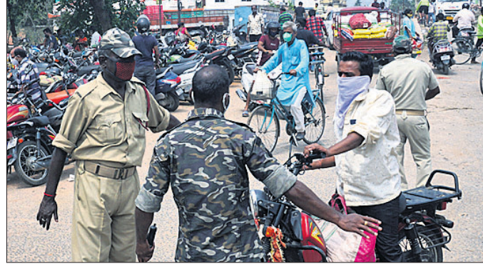
ମାଲ୍‌ଗୋଦାମ ଭିଡ଼ରୁ ନ ଯିବା ପାଇଁ ପୋଲିସ୍ ଗାଡ଼ି ବାଳକଙ୍କୁ ଅଟକାଇଛି।

କଟକ ଅଫିସ୍, ୧୬ କଟକ ସହରର ଦୋକାନ ବଜାରରେ ଲୋକଙ୍କ ଗହଳ ଲାଗିରହିଛି। ବିଶେଷକରି ବ୍ୟବସାୟିକ ପେଣ୍ଠସ୍ଥଳ ମାଲଗୋଦାମରେ ନାହିଁ ନ ଥିବା ଭିଡ଼ ଦେଖିବାକୁ ମିଳୁଛି। ଏଠାରେ ଭିଡ଼ ନିୟନ୍ତ୍ରିତ ପାଇଁ କଟକ ବଣିକ ସଂଘ ପକ୍ଷରୁ ମଙ୍ଗଳବାରଠାରୁ ସ୍ଵତନ୍ତ୍ର ବ୍ୟବସ୍ଥା କରାଯାଇଛି। ପୋଲିସ୍ ସହାୟତାରେ ସଂଘ ପକ୍ଷରୁ ମାଲଗୋଦାମରେ ଯାନବାହନ ପ୍ରବେଶ ଉପରେ କଟକଣା ଲାଗୁ କରାଯାଇଛି। କେବଳ ସକାଳ ୭ଟାରୁ ୯ଟା ପର୍ଯ୍ୟନ୍ତ ଦୁଇଟିକିଆ ଗାଡ଼ିକୁ ପ୍ରବେଶ ପାଇଁ ଅନୁମତି ମିଳିବ। ବାଇକ୍ ନେଇ ଗୋଦାମ ଆସୁଥିବା