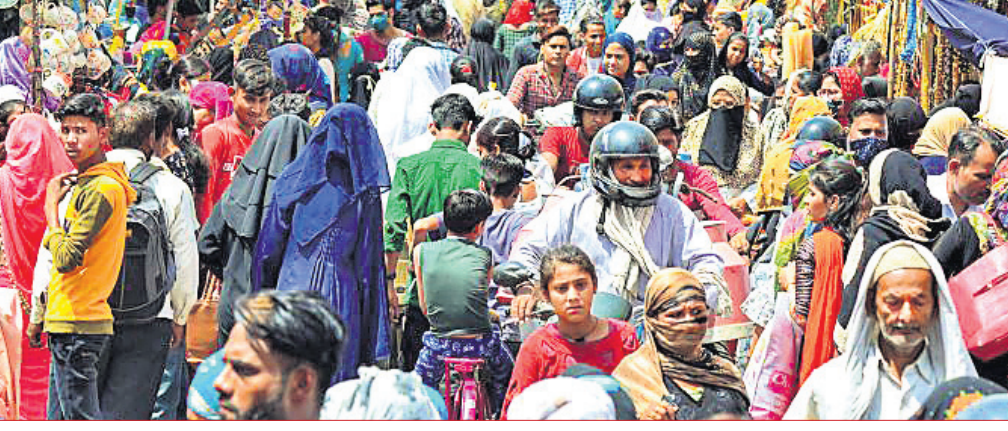
ଆଗ୍ରାରେ ଲକ୍ଷ୍ମଣ ନିୟମ କୋହଳ ହେବା ପରେ ଏକ ବଜାରରେ ଭିଡ଼ ଜମାଇଛନ୍ତି ଲୋକେ।

■ ଦିନକରେ ୨,୭୯୫ ମୃତ ■ ୧.୨୭ ଲକ୍ଷ ପଜିଟିଭ୍ ଚିହ୍ନିତ ସର୍ବନିମ୍ନ ରହିଛି। ସେହିପରି ୪୩ ଦିନ ପରେ ସକ୍ରିୟ ମାମଲା ୨୦ ଲକ୍ଷ ତଳେ ରହିଥିବା ମନ୍ତ୍ରଣାଳୟ ପକ୍ଷରୁ ଅପେକ୍ଷା କରାଯାଇଛି। ଏବେ ଆକ୍ଟିଭ୍ କେସ୍ ୧୮,୯୫,୫୨୦ ରହିଛି, ଯାହା କି ମୋଟ ସଂକ୍ରମଣର ୬.୬୩%। ସୋମବାର ୧୯,୨୫,୩୭୪ ନମୁନା ଚେଷ୍ଟା କରାଯାଇଥିଲା। କ୍ରମାଗତ