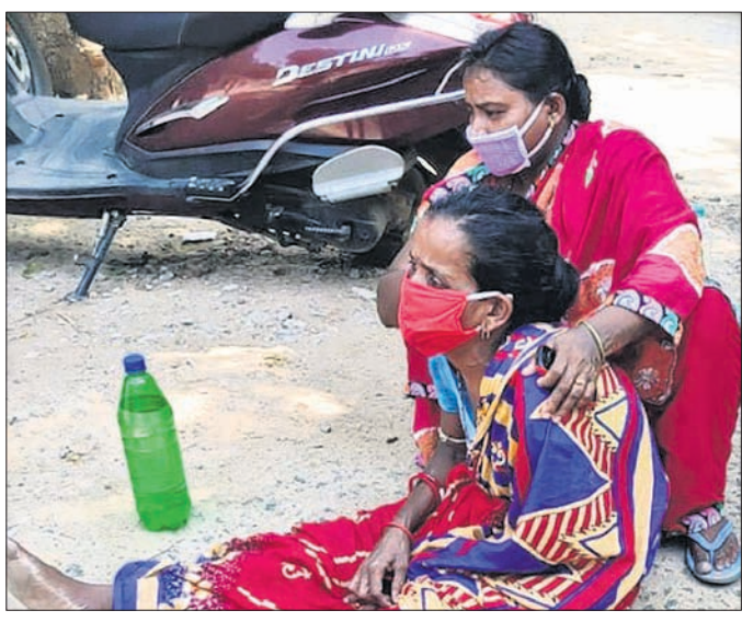
ବାଳକଙ୍କ ମୃତ୍ୟୁକୁ ନେଇ ଦୁଃଖରେ ଭାଙ୍ଗିପଡ଼ିଥିବା ପରିବାର ସଦସ୍ୟ।