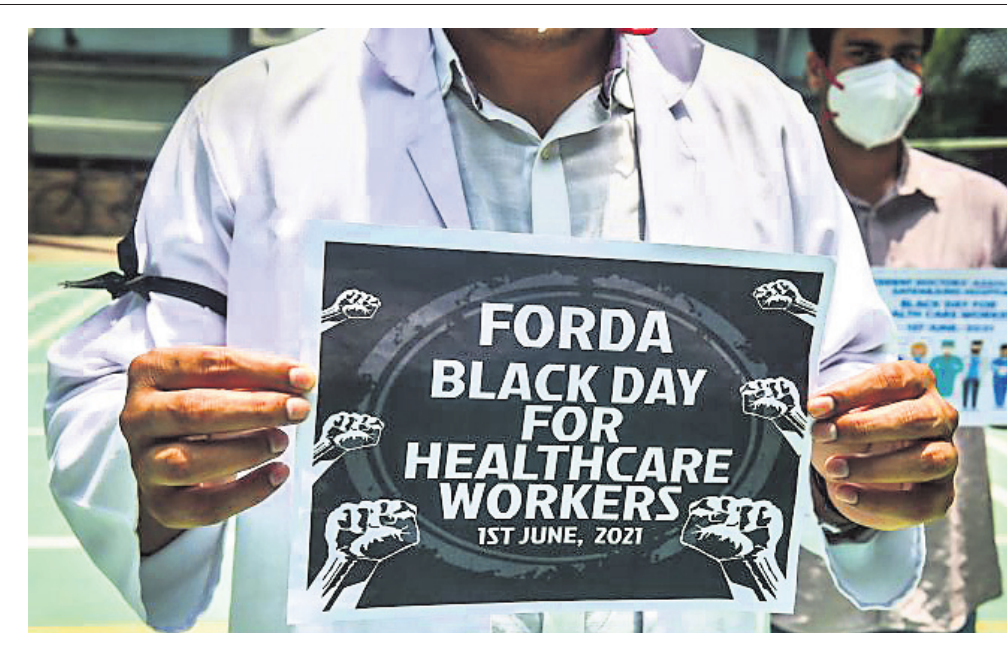
ନୂଆଦିଲ୍ଲୀ: ଏଲୋପାଥି ଉପରେ ଯୋଗରୁ ରାମଦେବଙ୍କ ବିବାଦୀୟ ମତବ୍ୟ ପ୍ରତିବାଦରେ ଫେଡେରେସନ୍ ଅଫ୍ ରେଭିଡେଣ୍ଟ ଡକ୍ଟର୍ସ ଆସୋସିଏସନ (ଏଫ୍‌ଓଆର୍‌ଡିଏ) ଏବଂ ରେଭିଡେଣ୍ଟ ଡକ୍ଟର୍ସ ଆସୋସିଏସନ (ଡିଆର୍‌ଏ) ପକ୍ଷରୁ ଦେଶବ୍ୟାପୀ କଳାଦିବସ ପାଳନ କରାଯାଇଛି। ଏହି ଅବସରରେ ନୂଆଦିଲ୍ଲୀସ୍ଥିତ ସଫରଜନ ହସ୍ପିଟାଲରେ ଜଣେ ତାତ୍କାଳୀନ ପ୍ଲାକାର୍ଟ ଧରି ବିଶୋଭ ପ୍ରଦର୍ଶନ କରୁଛନ୍ତି।

ରାମଦେବ: ଆଇଏମ୍‌ଏସ୍ ନୂଆଦିଲ୍ଲୀ, ୧୨: ଦେଶରେ ମହାମାରୀ କରୋନା ସଂକ୍ରମଣ ରୋକିବା ପାଇଁ କେନ୍ଦ୍ର ସରକାର ଚଳାଇଥିବା ଉଦ୍ୟମକୁ ଯୋଗରୁ ରାମଦେବ ବ୍ୟର୍ଥ କରିଛନ୍ତି ବୋଲି ମଙ୍ଗଳବାର ଉତ୍ତରାଧିକାରୀ ମେଡିକାଲ ଆସୋସିଏସନ (ଆଇଏମ୍‌ଏସ୍) ପକ୍ଷରୁ ଅଭିଯୋଗ ଅଣାଯାଇଛି। ତାତ୍କାଳୀନ ସଂଘ ନାଗରିକମାନଙ୍କ ଉଦ୍ଦେଶ୍ୟରେ ଲେଖିଥିବା ଏକ ଖୋଲାପତ୍ରରେ ରାମଦେବଙ୍କ ପଦବ୍ୟବସ୍ଥା ଦେଖିବିରୋଧୀ ଏବଂ ଜନବିରୋଧୀ ଭାବେ ଅଭିଯୋଗ କରିଛି। ଦେଶ ପାଇଁ ୧,୩୦୦ ତାତ୍କାଳୀନ ଡାକ୍ତର ଯାଇଥିବାବେଳେ ଏଲୋପାଥିକୁ ରାମଦେବଙ୍କ ସମାଲୋଚନା ନିହତାୟ। ଏଭଳି ଲୋକଙ୍କୁ ଦୟା କରିବା ଅନୁଚିତ ବୋଲି ଆଇଏମ୍‌ଏସ୍ କହିଛି।