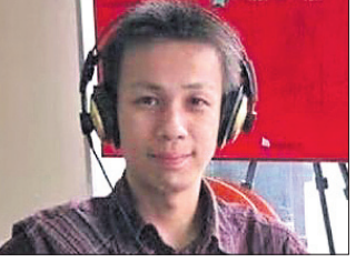
ଗାଲ୍‌ଫ୍ରିନରେ ଚାଇନା ସୈନ୍ୟଙ୍କ ମୃତ୍ୟୁ ବାରଦରେ ପୋଷ୍ଟ କରିଥିଲେ

କେନ୍ଦ୍ର, ୧୨: ଚାଇନା ଦ୍ୱିତୀୟ କରୋନା ଟିକା ସିନୋଭାଜକୁ କରୁରିକାଳୀନ ବ୍ୟବହାର ପାଇଁ ବିଶ୍ୱ ସ୍ୱାସ୍ଥ୍ୟ ସଙ୍ଘଟନ ମଣ୍ଡଳୀ ଦେଇଛି। ଏହି ଟିକା ଉପାଦାନ କାର୍ଯ୍ୟକାରୀ ଏବଂ ସୁରକ୍ଷା ସମ୍ପନ୍ନ ସମସ୍ତ ଅନ୍ତର୍ଜାତୀୟ ମାନକ ପୂରଣ କରୁଥିବା ନେଇ ଡିପ୍ଲୋମାଟିକ୍ ମିଶ୍ଟିରୀ ପଦକ୍ଷେପ ନିଶ୍ଚିତ ହୋଇଛି। ଗତ ମାସରେ ଚାଇନା ଟିକା ସିନୋଭାଜକୁ ଡିପ୍ଲୋମାଟିକ୍ କରୁରିକାଳୀନ ବ୍ୟବହାର ପାଇଁ ମଣ୍ଡଳୀ ଦେଇଥିଲା।