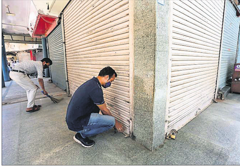
ଭୋପାଳରେ ଅନୁଲୋଚନା ପରେ ପରେ ବୋକାଳୀମାନେ ନିଜ ନିଜ ବୋକାଳୀ ତାଲା ଖୋଲୁଛନ୍ତି।