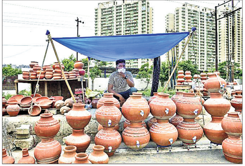
ଗ୍ରେଟର ନୋଏଡାର ରାଷ୍ଟ୍ରାକୃତ ଗ୍ରାହକଙ୍କ ଅପେକ୍ଷାରେ ଜଣେ କୁସକାର।