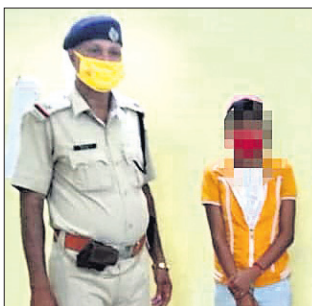
ଉଦ୍ଧାର ହୋଇଥିବା ଶିଶୁ।

କୋଭିଡ଼ ସମୟରେ ପୁରୀରେ ବର୍ତ୍ତମାନ ସୁଦ୍ଧା ୨୯ ଶିଶୁ ଉଦ୍ଧାର ହୋଇଛନ୍ତି। କୋଭିଡ଼ ପ୍ରଥମ ଲହରରେ ୩୮ ଜଣ ଓ ୨ୟ ଲହରରେ ଏଯାବତ୍ ୩୧ଜଣ ଶିଶୁ ପୁରୀ ରେକର୍ଡ଼େଶନରୁ ଉଦ୍ଧାର ହେଲେଣି।