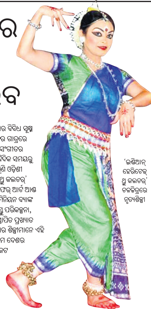
'ଇଣ୍ଡିଆନ୍ ହେରିଟେଜ ଥ୍ରୁ କଲଚର୍' ଚଳଚ୍ଚିତ୍ରରେ ନୃତ୍ୟଶିଳ୍ପୀ