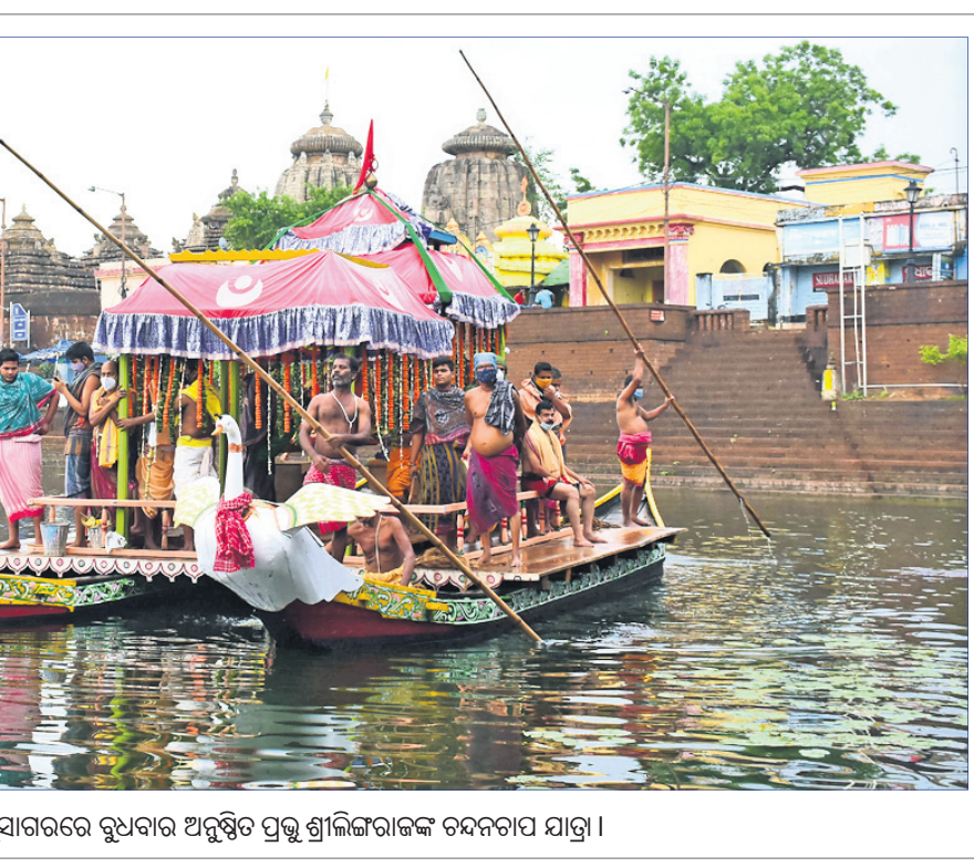
ଭୁବନେଶ୍ୱର ବିନ୍ଦୁସାଗରରେ ବୁଧବାର ଅନୁଷ୍ଠିତ ପ୍ରଭୁ ଶ୍ରୀଲିଙ୍ଗରାଜଙ୍କ ଚନ୍ଦନଚାପ ଯାତ୍ରା।

କେନ୍ଦୁଝର, ୨୬ (ସ.ପ୍ର.): ଘର ଅଗଣାରେ ବସିଥିବା ଜେଜେମା' ଓ ନାତିଙ୍କ ମୃତ୍ୟୁ ହୋଇଛି।