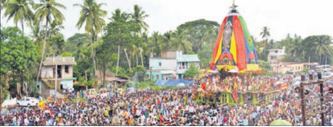
କେନ୍ଦ୍ରାପଡ଼ା ଅଫିସ, ୨୬

ଭୁବନେଶ୍ୱର, ୨୬ (ସ.ପ୍ର.) ବାତ୍ୟା 'ସ୍ୱାସ୍' କାରଣରୁ ୨୧୦ କୋଟି ଟଙ୍କାର କ୍ଷୟକ୍ଷତି ହୋଇଛି।