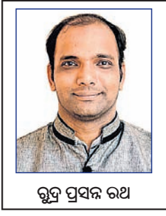
ଗୁପ୍ତ ପ୍ରସବ ରଥ