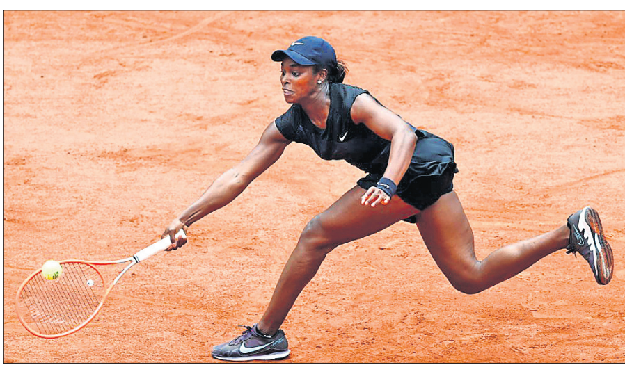
ମହିଳା ସିଙ୍ଗଲ୍ ବିଜୟୀ ତୃତୀୟ ରାଉଣ୍ଡରେ କାରୋଲିନ୍ ପ୍ଲୁଟିକୋଭାଙ୍କ ବିପକ୍ଷରେ ଶର୍ ଖେଳୁଛନ୍ତି ସ୍ଲୋଆନେ ସ୍ପେଡେସ୍।