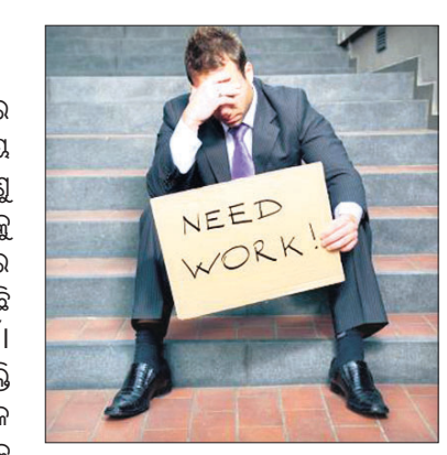
ବୁଧବାର ଆଶଙ୍କା ପ୍ରକଟ କରାଯାଇଛି। ଆଇଏଲଏ ପକ୍ଷରୁ କୁହାଯାଇଛି ଯେ, ମହାମାରୀ ଯୋଗୁ ଯେମାନେ ନିୟୁତ୍ତ ହରାଇଛନ୍ତି ସେମାନଙ୍କ ଲାଗି ପୁଣି ଥରେ ପର୍ଯ୍ୟାପ୍ତ ସୁଯୋଗ ସୃଷ୍ଟି ହେବା କଷ୍ଟକର।

ବେରୋଜଗାରୀ ମାଲବାର ପକ୍ଷରୁ ମାଗଣା ଟିକା କାର୍ଯ୍ୟକ୍ରମ ପ୍ରସ୍ତାବିତ ହୋଇ ରହିଛି। ତୃତୀୟ ଲକ୍ଷର ଏବଂ କରୋନାର ନୂଆ ବର୍ଗର ଭୂତାଣୁ ଚିହ୍ନ ହୋଇଛି। ମହାମାରୀ ସଂକ୍ରମଣକୁ ନିୟନ୍ତ୍ରଣ କରିବା ଲାଗି ଯେଉଁ ହାରରେ ଟିକାକରଣ ହେବାର ଆବଶ୍ୟକତା ରହିଛି ତାହା ଆଶା ପୂର୍ତ୍ତାବକ ହୋଇପାରୁନାହିଁ। ଫଳରେ ଏହା ସାରା ବିଶ୍ଵରେ ନିୟୁତ୍ତ ଷ୍ଟେଟ୍ରୁରେ ସୁଧାର ଆଣିବା ଦିଗରେ ସହାୟକ ହୋଇପାରୁନାହିଁ। କାରଣ ରୋଗ ନିୟନ୍ତ୍ରଣକୁ ଆସୁ ନ ଥିବାରୁ ବଜାର ବ୍ୟବସ୍ଥା ପୂର୍ବ ସ୍ଥିତିକୁ ଫେରିପାରୁନାହିଁ। ଚଳିତ ବର୍ଷ ଏବଂ ୨୦୨୨ ଯାଏ ଏଭଳି କାରଣ ଯୋଗୁ ବେରୋଜଗାରୀ ଉଚ୍ଚ ପ୍ରସାରରେ ରହିବ ବୋଲି ଅନୁମାନ କରାଯାଇଛି। ଟିକା କାର୍ଯ୍ୟକ୍ରମ (ଆଇଏଲଏ) ପକ୍ଷରୁ