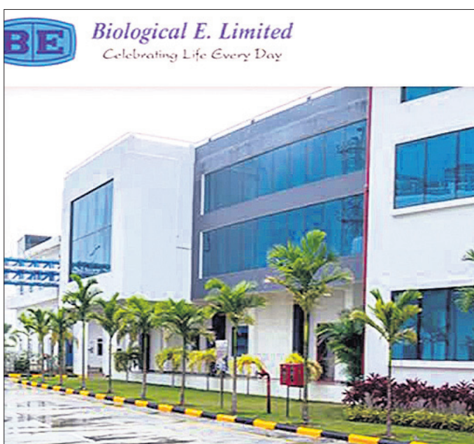
Biological E. Limited Celebrating Life Every Day

ମିଳିତ ଭାବେ ବାୟୋଲୋଜିକାଲ-ଇ ଏହି ଚିକାକୁ ବିକଶିତ କରିଛି। ଭାରତୀୟ ଭେଷଜ ଉଦ୍ୟୋଗ ପରିଷଦ (ଆଇଏଏଏଏ) ଏବଂ ଭାରତ ବାୟୋଟେକ୍ ପକ୍ଷରୁ ମିଳିତ ଭାବେ ପ୍ରସ୍ତୁତ କୋଭାକ୍ସିନ୍ ପରେ କର୍ବେଭାକ୍ସ ହେଉଛି ସ୍ୱଦେଶୀ ଜ୍ଞାନକୌଶଳରେ ପ୍ରସ୍ତୁତ ଭାରତର ଦ୍ୱିତୀୟ କୋଭିଡ୍ ଚିକା। ଅଗଷ୍ଟର ତିନିମସିହା ମଧ୍ୟରେ ଆବଶ୍ୟକ ଟୋଲ୍ ଉତ୍ପାଦନ ହୋଇଥିବ ଏବଂ ଆଗାମୀ କିଛି ମାସରେ ଏହା ଉପଲବ୍ଧ ହେବ ବୋଲି ମନ୍ତ୍ରାଳୟ କହିଛି। ଚିକା ଅଭାବକୁ ନେଇ କେନ୍ଦ୍ର ସରକାର ସମାଲୋଚିତ ହୋଇଥିବାବେଳେ ଏହି ଦ୍ୱିତୀୟ ଦେଶୀ ଭାକ୍ସିନ୍ ଚିକାର ଉତ୍ପାଦନକୁ ଆଗେଇ ନେବାରେ ସହାୟକ ହେବ ବୋଲି କୁହାଯାଇଛି। ମନ୍ତ୍ରାଳୟ ସୂଚନା ଅନୁଯାୟୀ ବାୟୋଟେକ୍ନୋଲୋଜି ବିଭାଗ ବାୟୋଲୋଜିକାଲ-ଇକୁ