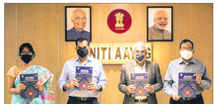
ଏସ୍ତିତି ରିପୋର୍ଟ ଉନ୍ମୋଚନ ଅବସରରେ ନୀତି ଆୟୋଗ ଉପାଧ୍ୟକ୍ଷ ରାଜୀବ କୁମାର (ତାହାଣରୁ ଦ୍ୱିତୀୟ), ସିଇଓ ଅମିତାଭ କାନ୍ତ (ତାହାଣରୁ ତୃତୀୟ) ଓ ଅନ୍ୟମାନେ।

୧୦୦ କୋଟି ଟଙ୍କା ଆର୍ଥିକ ସହାୟତା ଯୋଗାଇଦେଇଥିଲା। ନୂଆ କୋଭିଡ୍ ଭାକ୍ସିନ୍କୁ ସହାୟତା ପାଇଁ ଏହା ସରକାରଙ୍କ ନିଶ୍ଚିତ ଅଂଶଦାନ। ଉଚ୍ଚ ଚିକାକୁ ଭାକ୍ସିନ୍ ଆଡମିନିଷ୍ଟ୍ରେସନ୍ ଜାତୀୟ ବିଶେଷଜ୍ଞ ଗୋଷ୍ଠୀର ଅନୁମୋଦନ ପାଇଁ ସୁଯୋଗ ଦିଆଯାଇଛି। ଏହା ବ୍ୟତୀତ ବାୟୋଲୋଜିକାଲ-ଇ ଜନ୍ମଦାନ ଆଣ୍ଡ ଜନ୍ମଦାନ କମ୍ପାନୀ ଚିକା ବାର୍ଷିକ ୬୦ କୋଟି ଟୋଲ୍ ପ୍ରସ୍ତୁତ କରିବା ଲାଗି ଅନ୍ୟ ଏକ ଚୁକ୍ତି ସ୍ୱାକ୍ଷର କରିଛି। ଭାରତରେ ସମ୍ପୂର୍ଣ୍ଣ ଅଭାବକୁ କୋଭିଡ୍-୧୯ ଚିକା ଉତ୍ପାଦନ ପାଇଁ ଉଚ୍ଚ କମ୍ପାନୀ ପ୍ରୋଭିଡେନ୍ସ ପୋର୍ଟାଲ୍ସଟିକୁ ହେଲ୍ପିୟ ସହ ଚୁକ୍ତି ସ୍ୱାକ୍ଷର କରିଥିଲା। ପ୍ରକାଶ ଯେ ବର୍ତ୍ତମାନ ମୁକ୍ତ ଭାବରେ ୩ ପ୍ରକାର କୋଭିଡ୍ ଚିକା ଉପଲବ୍ଧ ହେଉଛି। କୋଭିଡିଲି ବ୍ରିଟେନରେ ବିକଶିତ ହୋଇଥିବାବେଳେ ପୁଣି ସିରମ୍ ଲିମିଟେଡ୍ ଅଫ୍ ଇଣ୍ଡିଆ (ଏସ୍ଆଇଆଇ) ଏହାକୁ ଉତ୍ପାଦନ କରୁଛି। ସେହିପରି ରୁଷିଆରେ ବିକଶିତ 'ସ୍ପୁର୍ବିକ-ଭି'ର ଭାରତୀୟ ଉତ୍ପାଦନକାରୀ କମ୍ପାନୀ ହେଉଛି ହାଇଡ୍ରୋକ୍ସିକ୍ୱିନିନ୍ ଉତ୍ପାଦକ।