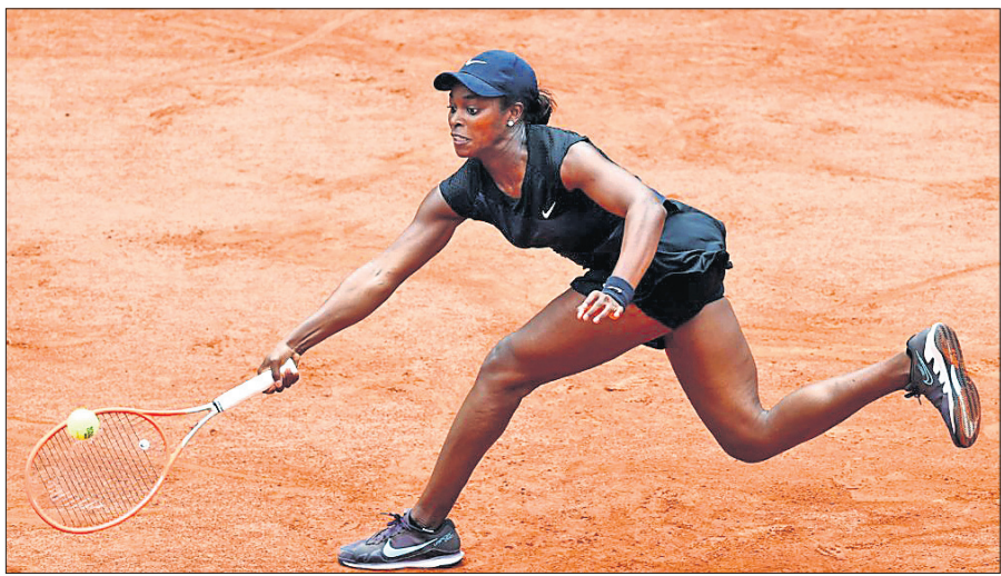
ମହିଳା ସିଙ୍ଗଲ୍ସ ବିତାଣୀ ରାଉଣ୍ଡରେ କାରୋଲିନ୍ ପ୍ଲିସ୍କୋଭାଙ୍କ ବିପକ୍ଷରେ ଶର୍ଦ୍ଧା ଖେଳୁଛନ୍ତି ସ୍ଲୋଆନେ ସ୍ଟିଫେନ୍ସ।