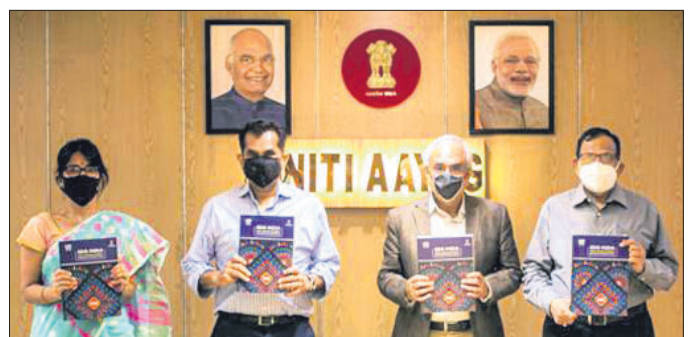
ଏସ୍‌ଡିଜି ରିପୋର୍ଟ ଉନ୍ମୋଚନ ଅବସରରେ ନୀତି ଆୟୋଗ ଉପାଧ୍ୟକ୍ଷ ରାଜୀବ କୁମାର (ତାହାଣରୁ ଦ୍ୱିତୀୟ), ସିଇଓ ଅମିତାଭ କାନ୍ତ (ତାହାଣରୁ ତୃତୀୟ) ଓ ଅନ୍ୟମାନେ।

୧୦୦ କୋଟି ଟଙ୍କା ଆର୍ଥିକ ସହାୟତା ଯୋଗାଇଦେଇଥିଲା। ନୂଆ କୋଭିଡ୍ ଭାକ୍ସିନ୍‌କୁ ସହାୟତା ପାଇଁ ଏହା ସରକାରଙ୍କ ମିଶନ୍‌ର ଅଂଶବିଶେଷ। ଉକ୍ତ ଚିକାକୁ ଭାକ୍ସିନ୍ ଆଡ଼ମିନିଷ୍ଟ୍ରେସନ୍ ଜାତୀୟ ବିଶେଷଜ୍ଞ ଗୋଷ୍ଠୀର ଅନୁମୋଦନ ପାଇଁ ସୁଯାଗିତ କରାଯାଇଛି। ଏହା ବ୍ୟତୀତ ବାୟୋଲୋଜିକାଲ-ଇ ଜନ୍‌ସନ ଆଣ୍ଡ ଜନ୍‌ସନ କମ୍ପାନୀ ଚିକା ବାର୍ଷିକ ୬୦ କୋଟି ଟୋଲ୍ ପ୍ରସ୍ତୁତ କରିବା ଲାଗି ଅନ୍ୟ ଏକ ଚୁକ୍ତି ସ୍ୱାକ୍ଷର କରିଛି। ଭାରତରେ ଏମ୍‌ଆର୍‌ଏଏଏଏ କୋଭିଡ୍-୧୯ ଚିକା ଉତ୍ପାଦନ ପାଇଁ ଉକ୍ତ କମ୍ପାନୀ ପ୍ରୋଜିକ୍ଟ୍‌ସ୍‌ ଥିରାପୁଟିକ୍ ହେଲ୍ଥ୍‌ସ୍‌ ସହ ଚୁକ୍ତି ସ୍ୱାକ୍ଷର କରିଥିଲା। ପ୍ରକାଶ ଯେ ବର୍ତ୍ତମାନ ସୁଦ୍ଧା ଭାରତରେ ୩ ପ୍ରକାର କୋଭିଡ୍ ଚିକା ଉପଲବ୍ଧ ହେଉଛି। କୋଭିଡିଲି ବ୍ରିଟେନରେ ବିକଶିତ ହୋଇଥିବାବେଳେ ପୁଣି ସିରମ୍ ଇନ୍‌ଷ୍ଟିଚ୍ୟୁଟ୍ ଅଫ୍ ଇଣ୍ଡିଆ (ଏସ୍‌ଆଇଆଇ) ଏହାକୁ ଉତ୍ପାଦନ କରୁଛି। ସେହିପରି ରୁଷିଆରେ ବିକଶିତ 'ସ୍ପୁର୍ଟିନିକ୍-ଭି' ଭାରତୀୟ ଉତ୍ପାଦନକାରୀ କମ୍ପାନୀ ହେଉଛି ହାଇଦ୍ରାବାଦର ଡକ୍‌ଟର ରେଡ୍‌ସ୍‌।