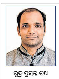
ଗୁପ୍ତ ପ୍ରସବ ରଥ