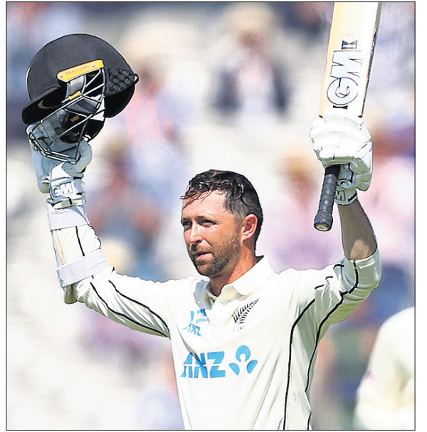
ଦ୍ୱିଶତକ ହାସଲ ପରେ ଡେଭିଡ୍ କନ୍ଦେ।

ଲଣ୍ଡନ, ୩୬ ପଦାର୍ପଣ ଟେଷ୍ଟରେ ଡେଭିଡ୍ କନ୍ଦେଙ୍କ ଦ୍ୱିଶତକ ସତ୍ତ୍ୱେ ନ୍ୟୁଜିଲାଣ୍ଡ ବଡ଼ ଷ୍ଟୋର କରିବାରେ ବିଫଳ ହୋଇଛି। ଏଠାରେ ଚାଲିଥିବା ଇଂଲଣ୍ଡ ବିପକ୍ଷ ପ୍ରଥମ ଟେଷ୍ଟରେ ନ୍ୟୁଜିଲାଣ୍ଡ ପ୍ରଥମ ଇନିଂସରେ ୩୭୮ ରନରେ ଅଲଆଉଟ ହୋଇଛି। କନ୍ଦେ ୨୦୦ ରନ ଷ୍ଟୋର କରି ନିଜ ଇନିଂସକୁ ସ୍ୱରାଣ୍ୟ କରିଥିବାବେଳେ ହେନରି ନିକୋଲ୍ସ ବିତାଣୀ ସର୍ବାଧିକ ୬୧ ରନ କରିଥିଲେ। ଶେଷ ଭାଗରେ ୫ ଜଣ ନ୍ୟୁଜିଲାଣ୍ଡ ବ୍ୟାଟ୍ସମ୍ୟାନ ବୁଲୁଥିବା ସ୍ଥିତିରେ ଇଂଲଣ୍ଡର ବ୍ୟାଟ୍ସମ୍ୟାନମାନେ ରନଆଉଟ ହୋଇଥିବା କନ୍ଦେ ୩୪୭ ବଲ୍ରେ ସମ୍ପୂର୍ଣ୍ଣ ରନ ହାସଲ କରି ଇନିଂସ ମଧ୍ୟରେ ୨୨ ଟୋକା ଓ ୧ ଛକା ମାରିଥିଲେ। ନେଲ୍ ଆଗନର ୧୧ ବଲ୍ରେ ୬୪ (୩ ଟୋକା, ୧ ଛକା) ରନକରି ଅପରାଜିତ ରହିବାରୁ ଅଜିତ ଉତ୍ତରୀ ଯୋଡିରେ ୪୦ ରନ ସଂଗ୍ରହ ହୋଇଥିଲା। ଇଂଲଣ୍ଡ ପକ୍ଷରୁ ପଦାର୍ପଣକାରୀ ବୁଟ୍ଟ ବୋଲର ଓଲିଭିରସନ ସର୍ବାଧିକ ୪ଟି, ମାର୍କ ଉଡ୍ ଶର୍ଦ୍ଧା ୩ଟି ଏବଂ ଜେମ୍ସ୍ ଆଣ୍ଡରସନ ୨ଟି ଉତ୍ତରୀ ଯୋଡିରେ ନେଇଥିଲେ।