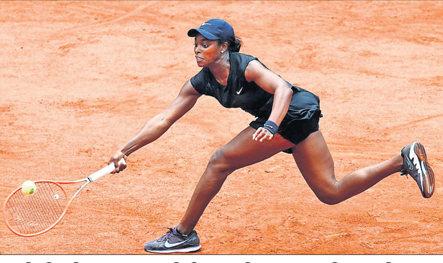
ମହିଳା ସିଙ୍ଗଲ୍ସ ବିଦ୍ୟାଳୀୟ ଟେନିସ୍ ପ୍ରତିଯୋଗିତାରେ ଲାଠି ମାରିବା ଉପରେ ସମର୍ଥନ ଦେଖାଇବା ପାଇଁ ନିମ୍ନଲିଖିତ ନୂଆପଲେଟ୍ ସ୍ପୋନ୍ସର କର୍ମଚାରୀଙ୍କୁ ସମର୍ଥନ ଦେଖାଇବା ପାଇଁ ଖେଳାଳିଙ୍କୁ ନୂଆପଲେଟ୍ ସ୍ପୋନ୍ସର କରିବାକୁ ପ୍ରୋତ୍ସାହନ ଦିଆଯାଇଛି।