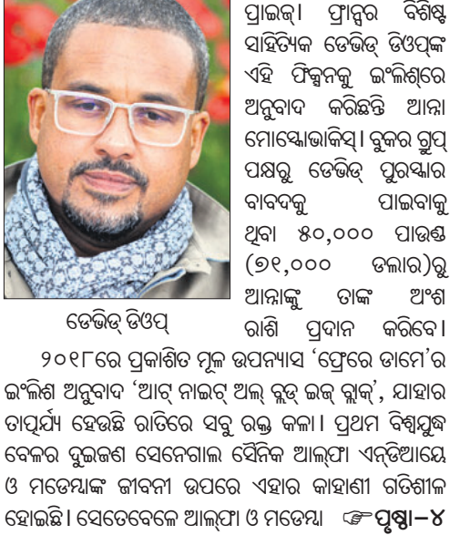
ତେଜିତ୍ ଡିଓପା ୨୦୧୮ରେ ପ୍ରକାଶିତ ମୂଳ ଉପନ୍ୟାସ 'ଫ୍ରେସ୍ରେ ଡାମେ'ର ଇଞ୍ଜିନିୟର ଅନୁବାଦ 'ଆର୍ ନାଇଟ୍ ଅଲ୍ ରୁଟ୍ ଇଜ୍ ବ୍ଲୁ', ଯାହାର ଚାପ୍ଟର୍ସ ହେଉଛି ରାତିରେ ସବୁ ରକ୍ତ କଳା। ପ୍ରଥମ ବିଶ୍ୱଯୁଦ୍ଧ ବେଳର ବୁଇଜିଗ ସେନେରାଲ ସୈନିକ ଆଲଫୋ ଏନ୍ଡିଆରେ ଓ ମଡେଲ୍ କାବନୀ ଉପରେ ଏହାର କାହାଣୀ ରଚିତ ହୋଇଛି। ସେତେବେଳେ ଆଲଫୋ ଓ ମଡେଲ୍ ପୃଷ୍ଠା-୪