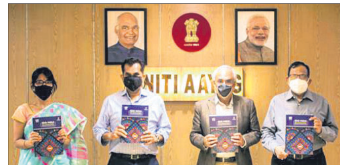
ଏସ୍ତିତି ରିପୋର୍ଟ ଉନ୍ନତନ ଅବସରରେ ନୀତି ଆୟୋଗ ଉପାଧ୍ୟକ୍ଷ ରାଜୀବ କୁମାର (ଡାହାଣରୁ ଦ୍ୱିତୀୟ), ସିଇଓ ଅମିତାଜ କାନ୍ତ (ଡାହାଣରୁ ତୃତୀୟ) ଓ ଅନ୍ୟମାନେ।

ମିଳିତ ଭାବେ ବାୟୋଲୋଜିକାଲ-ଇ ଏହି ଚିକାକୁ ବିକଶିତ କରିଛି। ଭାରତୀୟ ଭେଷଜ ଉଦ୍ୟୋଗ ପରିଷଦ (ଆଇଏଏଏଏ) ଏବଂ ଭାରତ ବାୟୋଟେକ୍ ପକ୍ଷରୁ ମିଳିତ ଭାବେ ପ୍ରସ୍ତୁତ କୋଭାକ୍ସିନ୍ ପରେ କର୍ବେଭାକ୍ସ ହେଉଛି ସ୍ୱଦେଶୀ ଜ୍ଞାନକୌଶଳରେ ପ୍ରସ୍ତୁତ ଭାରତର ଦ୍ୱିତୀୟ କୋଭିଡ୍ ଚିକା। ଅଗଷ୍ଟର ତିନିମସିରା ମଧ୍ୟରେ ଆବଶ୍ୟକ ଡୋଜ୍ ଉତ୍ପାଦନ ହୋଇଥିବ ଏବଂ ଆଗାମୀ କିଛି ମାସରେ ଏହା ଉପଲବ୍ଧ ହେବ ବୋଲି ମନ୍ତ୍ରାଳୟ କହିଛି। ଚିକା ଆଭାବକୁ ନେଇ କେନ୍ଦ୍ର ସରକାର ସମାଲୋଚିତ ହୋଇଥିବାବେଳେ ଏହି ଦ୍ୱିତୀୟ ଦେଶୀ ଭାକ୍ସିନ୍ ଚିକାକରଣ ଅଭିଯାନକୁ ଆଗେଇ ନେବାରେ ସହାୟକ ହେବ ବୋଲି ଜଣାଯାଇଛି। ମନ୍ତ୍ରାଳୟ ସୂଚନା ଅନୁଯାୟୀ ବାୟୋଟେକ୍ନୋଲୋଜି ବିଭାଗ ବାୟୋଲୋଜିକାଲ-ଇକୁ