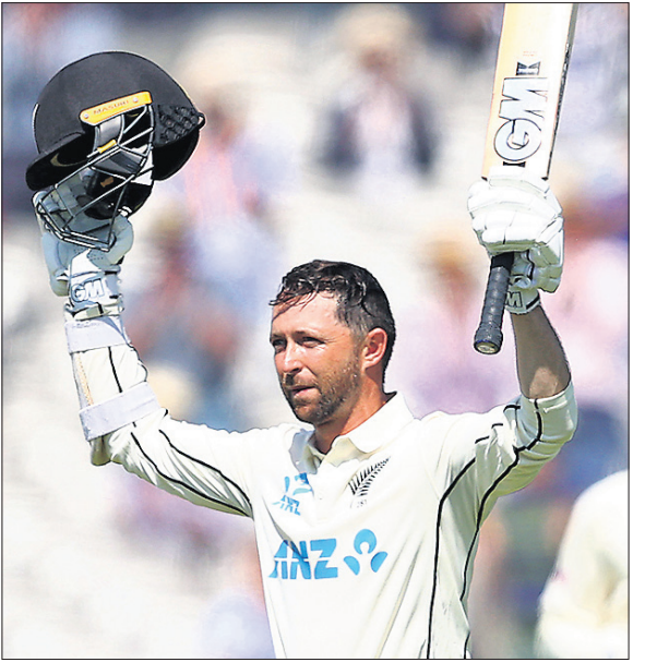
ବିଶେଷତା ହାସଲ ପରେ ଡେଭିଡ୍ କମ୍ବ୍ଲେକ୍ଟ୍।

ଲଣ୍ଡନ, ୩୧ (ଧି.ବି.) ପଦାର୍ପଣ ଚେଷ୍ଟାରେ ଡେଭିଡ୍ କମ୍ବ୍ଲେକ୍ଟ୍ ବିଶେଷତା ପୂର୍ଣ୍ଣ ରୂପରେ ଲାଭ କରିବାରେ ସକ୍ଷମ ହୋଇଛନ୍ତି। ଏଠାରେ ଚାଳିଥିବା ଲ୍ୟାଣ୍ଡ ଡବଲ୍ସ ପ୍ରଥମ ଚେଷ୍ଟାରେ ନ୍ୟୁଜିଲ୍ୟାଣ୍ଡ ପ୍ରଥମ ଇନିଂସରେ ୩୭୮ ରନରେ ଆକ୍ରମଣ ହୋଇଛି। କନ୍ୱେ ୨୦୦ ରନ ହାର କରି ନିଜ ଇନିଂସକୁ ସୁରକ୍ଷା ଦେଇଥିବା ବେଳେ ଡେଭିଡ୍ କମ୍ବ୍ଲେକ୍ଟ୍ ବିଶେଷତା ସର୍ବାଧିକ ୬୧ ରନ କରିଥିଲେ। ଶେଷ ଭାଗରେ ୫ ଜଣ ନ୍ୟୁଜିଲ୍ୟାଣ୍ଡ ବ୍ୟାଟ୍ସମ୍ୟାନ ଉପକ୍ରମ କରି ପାରନ୍ତି ନଥିଲେ। ୨୦୦ ରନ ପୂରଣ ପରେ ଶେଷ ବ୍ୟାଟ୍ସମ୍ୟାନ ଆଡମ୍ ଜେକ୍ସ ଓ ଡେଭିଡ୍ କମ୍ବ୍ଲେକ୍ଟ୍ ହୋଇଥିବା କନ୍ୱେ ୩୪୭ ବଲ୍ରେ ସମାପ୍ତ ହୋଇ ନିଜ ଇନିଂସ ମଧ୍ୟରେ ୨୨ ଟୋକା ଓ ୧ ଛକା ମାରିଥିଲେ। ନେଲ୍ ଖାତାରେ ୧୧ ବଲ୍ରେ ୬୪ (୩ ଟୋକା, ୧ ଛକା) ରନ କରି ଅପରାଜିତ ରହିବାକୁ ଅଜ୍ଞାନ ଭାଇକେଟ୍ ଯୋଡ଼ିରେ ୪୦ ରନ ସଂଗ୍ରହ ହୋଇଥିଲା। ଲ୍ୟାଣ୍ଡ ପକ୍ଷରୁ ପଦାର୍ପଣକାରୀ ବ୍ରୁକ୍ ବୋଲର ଓଲିଭିଆ ଡିଭିନିଓ ସର୍ବାଧିକ ୪ଟି, ମାର୍କ ଉଡ୍ ଗତି ଏବଂ ଜେସ୍ ଆଣ୍ଡରସନ ୨ଟି ଭାଇକେଟ୍ ନେଇଥିଲେ।