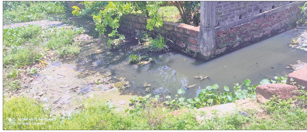
କଳିଙ୍ଗନଗର ଶିଳ୍ପାଞ୍ଚଳ ମୁଖ୍ୟାଳୟ ବ୍ୟାସନଗର ପୂର୍ବପାର୍ଶ୍ୱରେ ନଗର ବସ୍ତ୍ର ମଝିରେ ବର୍ଜ୍ୟଜଳ

ରାଜ୍ୟର ବିଭିନ୍ନ ସହରରୁ ନିର୍ଗତ ବର୍ଜ୍ୟଜଳକୁ ବୈଜ୍ଞାନିକ ପଦ୍ଧତିରେ ବିଶୋଧନ ଓ ପ୍ରକ୍ରିୟାକରଣ ନ କରି ବାହାରକୁ ଛଡ଼ାଯାଉଥିବାରୁ ତାହା ପୁଣ୍ୟ ପରିବେଶ ପାଇଁ ବିପଦ ହୋଇଛି । ରାଜ୍ୟ ଗୃହ ଓ ନଗର ଉନ୍ନୟନ ବିଭାଗରୁ ପ୍ରାୟ ୧୨୮୦ କୋଟି ଟଙ୍କା ୧୧୪୪ ସହରାଞ୍ଚଳକୁ ଦୈନିକ ୨୧୦୩.୧୪ ଟନ କଠିନ ବର୍ଜ୍ୟବସ୍ତୁ ନିର୍ଗତ ହେଉଛି । ଏହାବାଦ୍ ୧୪୨୫ କିଲୋଲିଟର ପର୍ଯ୍ୟନ୍ତ (କେଏଲିଟି) ସେପ୍ଟିକ ଟ୍ୟାଙ୍କର ମଜୁତୁ (ସେପ୍ଟେଜ୍) ସୁପରିଚାଳନା ନିମନ୍ତେ ଦୈନିକ ୨୦୨୭ କିଲୋଲିଟର କ୍ଷମତା ବିଶିଷ୍ଟ ୧୧୮ ସେପ୍ଟେଜ୍ ଟ୍ରିଟମେଣ୍ଟ ପ୍ଲାଣ୍ଟ (ଏସ୍ଟିପି) ନିର୍ମାଣ କରାଯାଉଛି । ଏଥିମଧ୍ୟରୁ ୧୪ଟି ଏସ୍ଟିପି କାର୍ଯ୍ୟକ୍ରମ କରାଯାଇଛି ବୋଲି କୁହାଯାଉଛି । ଦୀର୍ଘଦିନ ହେଲା ଅବଶିଷ୍ଟ ପ୍ରକଳ୍ପଗୁଡ଼ିକର କାର୍ଯ୍ୟ ସମ୍ପୂର୍ଣ୍ଣ ହୋଇପାରୁନାହିଁ । ଏଭଳି ଅବସ୍ଥାରେ ଯୋଗୁଁ ସହରବାସୀ ହ୍ରଦସାନ୍ତ ହେଉଛନ୍ତି । ସମ୍ପୂର୍ଣ୍ଣ ସ୍ୱାଚ୍ଛତାପାଇଁ ଓ ଏକ-ସିସ୍ଟମ୍ କେବଳ ଅବହେଳା କରୁନାହାନ୍ତି, ରାଜ୍ୟ ପ୍ରକୃତିବନ୍ଧୁ ନିୟନ୍ତ୍ରଣ ବୋର୍ଡ୍ (ଏସ୍ଟିପି)ର