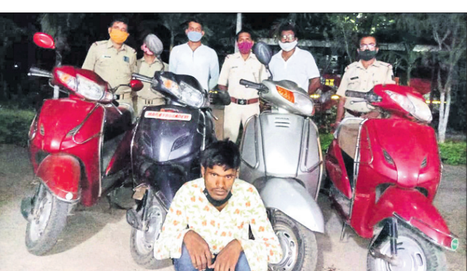
ଗିରଫ ଅଭିଯୁକ୍ତଙ୍କ ସହ ଜବତ କରାଯାଇଥିବା ୪ ଷ୍ଟ୍ରିଟ୍।