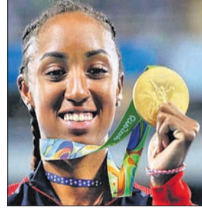
ତାଙ୍କ କ୍ୟାରିୟରରେ ବିତୀୟ ଥର ବାସସ ହୋଇଥିବା ଆଥଲେଟିକ୍ ଇଣ୍ଡିଗ୍ରିଟି ଯୁନିର୍ (ଏଆଇୟୁ)

ଗୋଲ୍ଡେନା, ୪୬ (ଏସି) ଅଲିମ୍ପିକ୍ ହର୍ଡଲ୍ ଚାମ୍ପିୟନ ବ୍ରାଏନା ରୋଲିଣ୍ଡମ୍ୟାକ୍‌ନିଲ ଏକ ତୋପି ମାମଲାରେ ୫ବର୍ଷ ବାସସ ହୋଇଛନ୍ତି। ଫଳରେ ସେ ଚଳିତବର୍ଷର ଚୋକିଓ ଗେମ୍ ଓ ୨୦୨୪ ପ୍ୟାରିସ ଗେମ୍‌ରେ ଅଂଶଗ୍ରହଣ କରିପାରିବେ ନାହିଁ। ତୋପି କଣ୍ଠୋଳ ସାମ୍ବଲ୍‌ର ରୋଜଲ୍ ମ୍ୟାକ୍‌ନେଲମେଣ୍ଟ ଆମେରିକାର ଏହି ଆଥଲେଟ