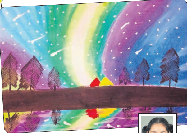
ଭାଷ୍ୱତୀ ବିଶୋଇ କ୍ଲାସ-୨, କେନ୍ଦ୍ରୀୟ ବିଦ୍ୟାଳୟ, ନଂ- ୩, ଭୁବନେଶ୍ୱର