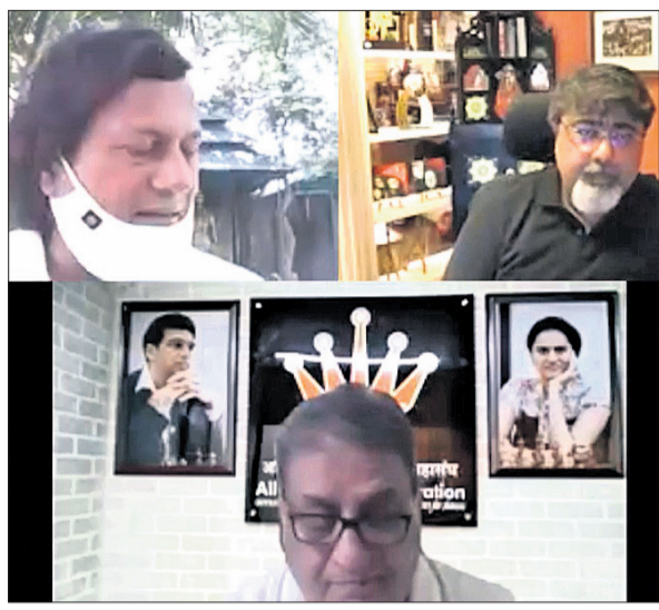
ଭର୍ତ୍ତୁଆଲରେ ଆୟୋଜିତ ଉଦ୍‌ଘାଟନା ଉତ୍ସବରେ ଭାଗ ନେଇଥିବା ଅତିଥିମାନେ।