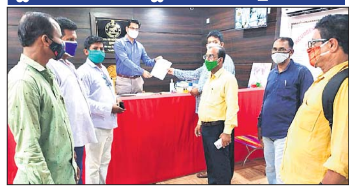
ମୁଖ୍ୟମନ୍ତ୍ରୀଙ୍କ ଉଦ୍ଦେଶ୍ୟରେ ତହସିଲଦାରଙ୍କୁ ସ୍ମାରକପତ୍ର ପ୍ରଦାନ କରାଯାଇଛି ।

କରାଯାଇଛି । ଖବରଦାତା ସୁରେନ୍ଦ୍ରନାଥ ମହାନ୍ତି, ସଦାଶିବ ପଣ୍ଡା, ସାମାଜିକ ମିତ୍ରି, ଲିଙ୍ଗରାଜ ଦାଶ, ଅଶୋକ କୁମାର ମହାନ୍ତି, ପ୍ରଶାନ୍ତ କୁମାର ଦାଶ,