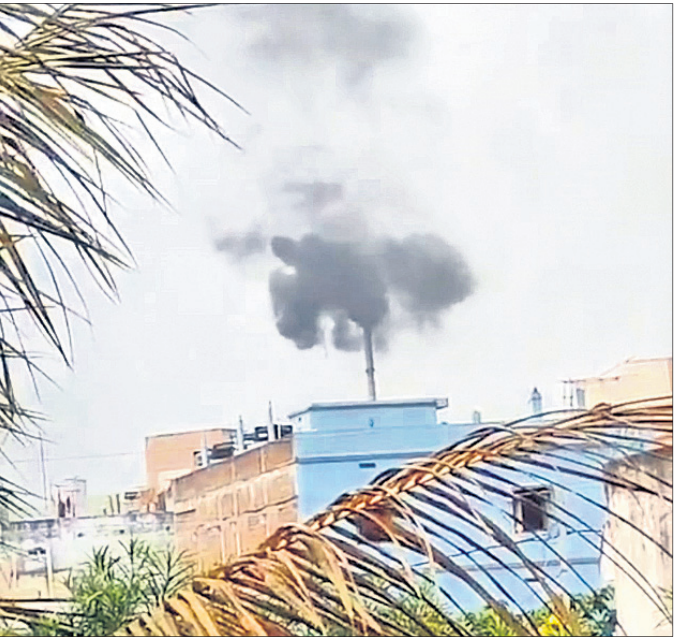
ଏମ୍ବେସିଡି ବର୍ଜ୍ୟବସ୍ତୁ ପ୍ଲାଷ୍ଟିକ୍ ନିର୍ଗତ ଧୂଆଁ।

ବ୍ରହ୍ମପୁର ବଡ଼ ମେଡିକାଲ ଜ୍ୟେସ୍ ବର୍ଜ୍ୟବସ୍ତୁ ପରିଚାଳନା ପ୍ଲାଷ୍ଟିକ୍ ବାହାରୁଥିବା ଧୂଆଁ ଲୋକଙ୍କ ଘରେ ପଶୁଛି, ଯାହାକୁ ନେଇ ଏବେ ଅସନ୍ତୋଷ ସହ ଅଭିଯୋଗ ମଧ୍ୟ ଦିନକୁ ଦିନ ବଢ଼ିବାରେ ଲାଗିଛି। ଏମ୍ବେସିଡିର ବିଭିନ୍ନ ବିଭାଗରୁ ଦୈନିକ ୧ କୁଇଣ୍ଟାଲ ଜୈବ ବର୍ଜ୍ୟବସ୍ତୁ ବାହାରୁଛି। ଏହାକୁ ଭସ୍ମାଭୂତ କରିବା ପାଇଁ ଆଜକୁ ୧୫ ବର୍ଷ ତଳେ ୮୦ ଲକ୍ଷ ଟଙ୍କା ବ୍ୟୟରେ ଏମ୍ବେସିଡିରେ ଗ୍ଳାପନ ହୋଇଥିଲା ଜୈବ ବର୍ଜ୍ୟବସ୍ତୁ ପରିଚାଳନା ପ୍ଲାଷ୍ଟିକ୍। ଏହି ପ୍ଲାଷ୍ଟିକ୍ ଭିତରେ ଥିବା ଜନସିନେରଟର ଜରିଆରେ ଦୈନିକ ବାହାରୁଥିବା ବର୍ଜ୍ୟବସ୍ତୁକୁ ଭସ୍ମାଭୂତ କରାଯାଉଛି। ସେଥିରୁ ଦିନରାତି ବିଷାକ୍ତ ଧୂଆଁ ବାହାରୁଛି। ଏହି ଧୂଆଁ ହିଁ ଅଞ୍ଚଳରେ ଅସନ୍ତୋଷ ବଢ଼ାଇବାରେ ଲାଗିଛି। ଜନସିନେରଟର ସହ ସଂଯୁକ୍ତ ଥିବା ଚିମିନି ଉଚ୍ଚତା ଆଖିପାଖି ଅଞ୍ଚଳ ଲୋକଙ୍କ ଘରର ଉଚ୍ଚତା ଠାରୁ କମ୍ ହୋଇଥିବାରୁ ସେଥିରୁ ବାହାରୁଥିବା ଧୂଆଁ କିଛି ଲୋକଙ୍କ ଘର ତଥା ଛାତ ଉପରେ ବଢ଼ାଇବାରେ ଲାଗିଛି। ଜନସିନେରଟର ସହ ସଂଯୁକ୍ତ ଥିବା ଚିମିନି ଉଚ୍ଚତା ଆଖିପାଖି ଅଞ୍ଚଳ ଲୋକଙ୍କ ଘରର ଉଚ୍ଚତା ଠାରୁ କମ୍ ହେବାର ଆଶଙ୍କା ବଢ଼ିବାରେ ଲାଗିଛି। ଅନ୍ୟପଟେ ଏହି ପ୍ଲାଷ୍ଟିକ୍ ଚିମିନି ଉଚ୍ଚତା ବୃଦ୍ଧି କରିବାକୁ ସ୍ଥାନୀୟ ଅଞ୍ଚଳର ଏକାଧିକ ବ୍ୟକ୍ତି ବଡ଼ ତାଲୁରଖାନା କର୍ତ୍ତୃପକ୍ଷ ସହ ଜିଲା ପ୍ରଶାସନର ଦୃଷ୍ଟି ଆକର୍ଷଣ କରିଛନ୍ତି।