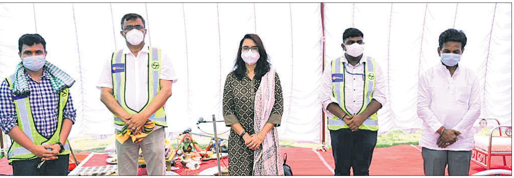
ବିର୍ସା ମୁଣ୍ଡା ଅନ୍ତର୍ଜାତୀୟ ହକି ଷ୍ଟାଡ଼ିୟମର ଭୂମିପୂଜା କାର୍ଯ୍ୟକ୍ରମରେ ଉପସ୍ଥିତ ଅତିଥି ।