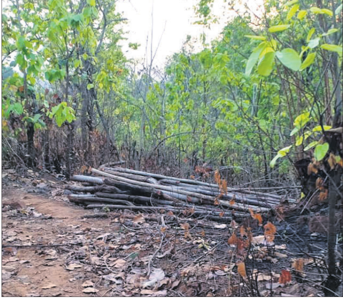
ନୟାଗଡ଼ ଜିଲ୍ଲା ବନ୍ୟପଲ୍ଲୀ ବ୍ଲକ୍ କୁଳାମେଣ୍ଡି ପଞ୍ଚାୟତ ବଣିଆଁ ନିକଟସ୍ଥ ଝୁଡ଼ି ଜଙ୍ଗଲରେ ଶାଳ ଗଛ କାଟି ନେବା ପାଇଁ ପକା ଯାଇଛି ।