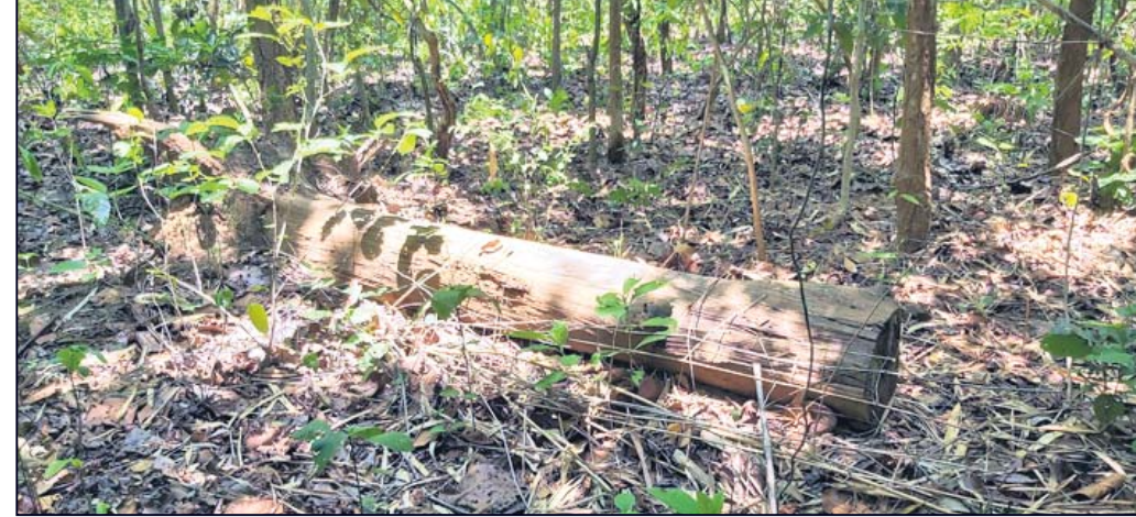
ଗାଲେରୀ ସଂରକ୍ଷିତ ଜଙ୍ଗଲ ଭାଗ ନଂ ୭ରେ ବାଟ୍ୟାରେ ଭାଙ୍ଗି ପଡ଼ିଥିବା ଗଛ ।

ଜନସଂଖ୍ୟା, କଳକାରଖାନା ବୃଦ୍ଧି ଓ ଜଙ୍ଗଲ କ୍ଷୟ ଆଦି କାରଣରୁ ପରିବେଶ ପ୍ରଦୂଷଣ ବୃଦ୍ଧି ପରିବେଶ ସୁରକ୍ଷା ପାଇଁ ଜନସଚେତନତା ସୃଷ୍ଟି କରିବା ଲକ୍ଷ୍ୟ ନେଇ ପ୍ରତିବର୍ଷ ଜୁନ ୫ ତାରିଖକୁ ବିଶ୍ୱ ପରିବେଶ ଦିବସ ଭାବେ ପାଳନ କରାଯାଇଛି । ଜଙ୍ଗଲ ବୃଦ୍ଧି କରିବା, ନଦୀ କଳକୁ ସଫା ରଖିବା, ସ୍ୱଚ୍ଛ ପରିବେଶ ସୃଷ୍ଟି କରିବା ଏହି ଦିବସ ପାଳନର ମୂଳ ଲକ୍ଷ୍ୟ । ଚଳିତବର୍ଷ କୋଭିଡ଼ କଟକଣା ଯୋଗୁ ବିଶ୍ୱ ପରିବେଶ ଦିବସ ପାଳନ ଫିକା ପଡ଼ିଯିବ । ଦୁମୁସର ଉତ୍ତର ବନଖଣ୍ଡରେ କୌଣସି ବଡ଼ କାର୍ଯ୍ୟକ୍ରମ ହେବନାହିଁ । ପ୍ରତ୍ୟେକ ରୋଜି ପକ୍ଷରୁ ଗୋଟିଏ ସ୍ଥାନରେ ୧୦ ଜଣଙ୍କୁ ନେଇ ଚାରାଚୋରୀକରଣ କରାଯାଇପାରେ । ଦୁମୁସର ଉତ୍ତର ବନଖଣ୍ଡରେ ବିଭିନ୍ନ ଜଙ୍ଗଲରେ କାଠ ଚୋରିବଡ଼ିଛି । ଫାଇଲିଙ୍ଗ, ଡିଙ୍ଗି, ଫିନିଶିଙ୍ଗି ଆଦି ଆନେକ ବଡ଼ ବଡ଼ ଗଛକୁ ଏ ଯାଏ ଡିପୋକୁ ଅଣାଯାଇ ପାରିନାହିଁ । ଏହାର ସୁଯୋଗ ନେଇ ସୁବର୍ତ୍ତମାନେ ମୂଲ୍ୟବାନ କାଠ ଚୋରାଇ ନେଉଛନ୍ତି । କେତକ ସ୍ଥାନରେ