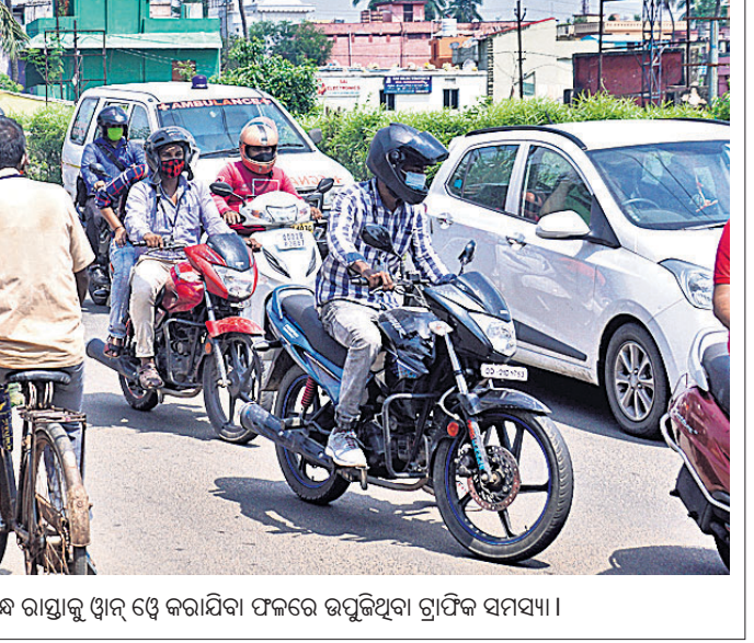
ଲକ୍ଷତାର୍ତ୍ତ ଯୋଗୁ କଟକ ରାଜବାଗିଚା ରିଏକ୍ସ ରାସ୍ତାକୁ ଓଡ଼ି ଓଡ଼ି କରାଯିବା ଫଳରେ ଉପସ୍ଥିତ ଗ୍ରାମିକ ସମସ୍ୟା।