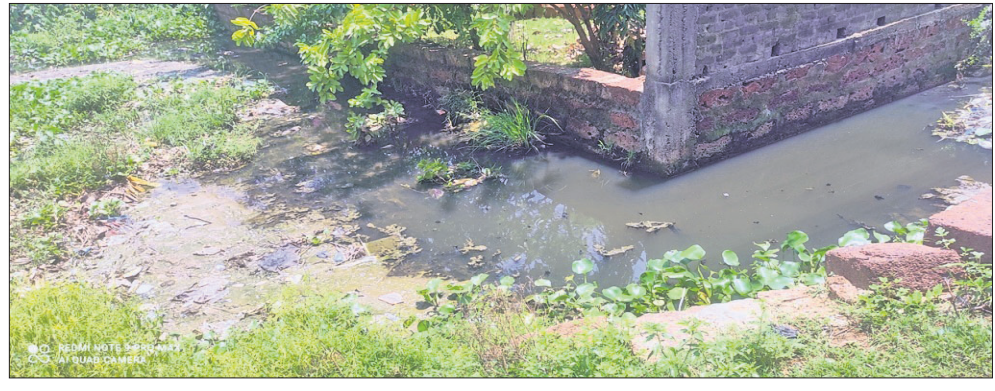
କଳିଙ୍ଗନଗର ଶିଳ୍ପାଞ୍ଚଳର ମୁଖଶାଳା ବ୍ୟାସନଗର ପୁାନିସିପାଲିଟିର ମହତାବ ନଗର ବସ୍ତି ମଝିରେ ବର୍ଜ୍ୟଜଳ।

ରାଜ୍ୟର ବିଭିନ୍ନ ସହରରୁ ନିର୍ଗତ ବର୍ଜ୍ୟଜଳକୁ ବୈଜ୍ଞାନିକ ପଦ୍ଧତିରେ ବିଶୋଧନ ଓ ପ୍ରକ୍ରିୟାକରଣ ନ କରି ବାହାରକୁ ଛଡ଼ାଯାଉଥିବାରୁ ତାହା ସ୍ତର ପରିବେଶ ପାଇଁ ବିପଦ ହୋଇଛି। ରାଜ୍ୟ ଗୃହ ଓ ନଗର ଉନ୍ନୟନ ବିଭାଗରୁ ପ୍ରାୟ ତଥ୍ୟ ଅନୁଯାୟୀ ୧୧୪୪ ସହରାଞ୍ଚଳକୁ ଦୈନିକ ୨୧୦୩.୧୪ ଟନ ଜଠିନ ବର୍ଜ୍ୟବସ୍ତୁ ନିର୍ଗତ ହେଉଛି। ଏହାବାଦ୍ ୧୪୨୫ କିଲୋଲିଟର ପର୍ (କେଏଲିଟି) ଯେମିତି ଟ୍ୟାଙ୍କର ମଳପତ୍ତ (ସେପ୍ଟେଜ୍) ପୁରୁଷୋତ୍ତମ ନିମନ୍ତେ ଦୈନିକ ୨୦୩୭ କିଲୋଲିଟର କ୍ଷମତା ବିଶିଷ୍ଟ ୧୧୮ ସେପ୍ଟେଜ୍ ଟ୍ରିଟମେଣ୍ଟ ପ୍ଲାଣ୍ଟ (ଏସ୍ଟିପି) ନିର୍ମାଣ କରାଯାଉଛି। ଏଥିମଧ୍ୟରୁ ୧୪ଟି ଏସ୍ଟିପି କାର୍ଯ୍ୟକ୍ରମ କରାଯାଇଛି ବୋଲି କୁହାଯାଉଛି। ଦୀର୍ଘଦିନ ହେଲା ଅବଶିଷ୍ଟ ପ୍ରକଳ୍ପଗୁଡ଼ିକର କାର୍ଯ୍ୟ ସମ୍ପୂର୍ଣ୍ଣ ହୋଇପାରୁନାହିଁ। ଏଭଳି ଅବହେଳା ଯୋଗୁଁ ସହରବାସୀ ହ୍ରଦସନ୍ତ ହେଉଛନ୍ତି। ସମ୍ପୂର୍ଣ୍ଣ ପୁାନିସିପାଲିଟି ଓ ଏନ୍-ଏସ୍ଟିପି କେବଳ ଅବହେଳା କରୁନାହାନ୍ତି, ରାଜ୍ୟ ପ୍ରଦୂଷଣ ନିୟନ୍ତ୍ରଣ ବୋର୍ଡ (ଏସ୍ଟିପି)ର