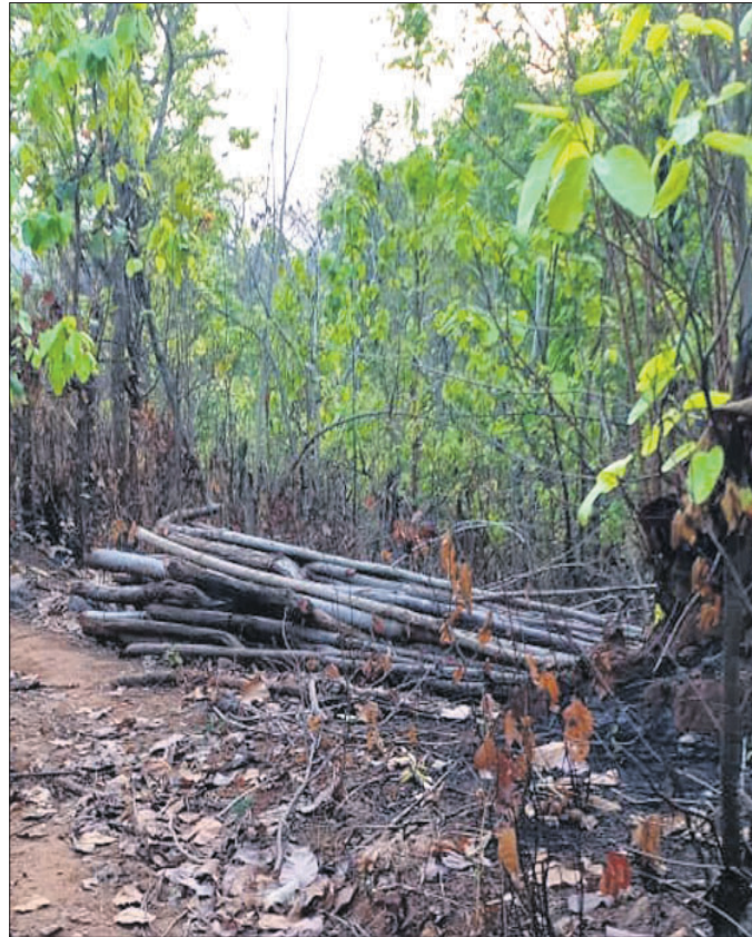
ନୟାଗଡ଼ ଜିଲ୍ଲା ବନଖଣ୍ଡରୁ କୁଳମେଣ୍ଡି ପଞ୍ଚାୟତ ବଣିଗାଁ ନିକଟସ୍ଥ ଭୃତ୍ତି ଜଙ୍ଗଲରେ ଶାଳ ଗଛ କାଟି ନେବା ପାଇଁ ପକା ଯାଇଛି।

ତିଏଫଓ ଧନରାଜ ଏକ୍ସିକ୍ୟୁଟିଭ ନୟାଗଡ଼ ବନଖଣ୍ଡରେ ୩୭ ପ୍ରତିଶତ ଜଙ୍ଗଲ ରହିଛି। ବନବିଭାଗ ସହ ୩୩୬ ବନସୁରକ୍ଷା ସମିତି କଙ୍ଗଲ ସୁରକ୍ଷା କାମରେ ନିଯୋଜିତ ଅଛନ୍ତି। ବୃକ୍ଷରୋପଣକୁ ବୃଦ୍ଧି ସହ କାଠଚୋରଙ୍କୁ ଦମନ ପାଇଁ ପଦକ୍ଷେପ ନିଆଯାଉଛି।