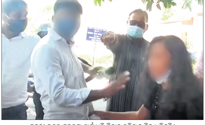
ମୁବତ୍ତା ଜଣକ ମୁବତ୍ତାଙ୍କ ଶାର୍ଡ ଧରି ବିବାହ କରିବାକୁ ଭିକ୍ଷା କରିବାକୁ ଚାହୁଁଛନ୍ତି।

ଭୁବନେଶ୍ୱର, ୪୧ (ବୁଧବେଳା) 'ତୋତେ ବାହା ହେବି ବୋଲି ଘର ଛାଡ଼ି ଦେଲୁ କେହି ଆସିବି। ଆଉ ଘରକୁ ଫେରିବିନି। ତୁ ଯୋଉଠି କହିବୁ ସେଇଠି ରହିବି।