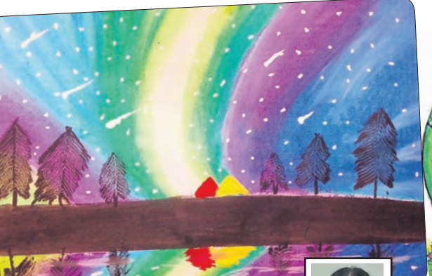
ଭାସ୍ୱତୀ ବିଶୋଇ କ୍ଲାସ-୬, କେନ୍ଦ୍ରୀୟ ବିଦ୍ୟାଳୟ, ନଂ- ୩, ଭୁବନେଶ୍ୱର