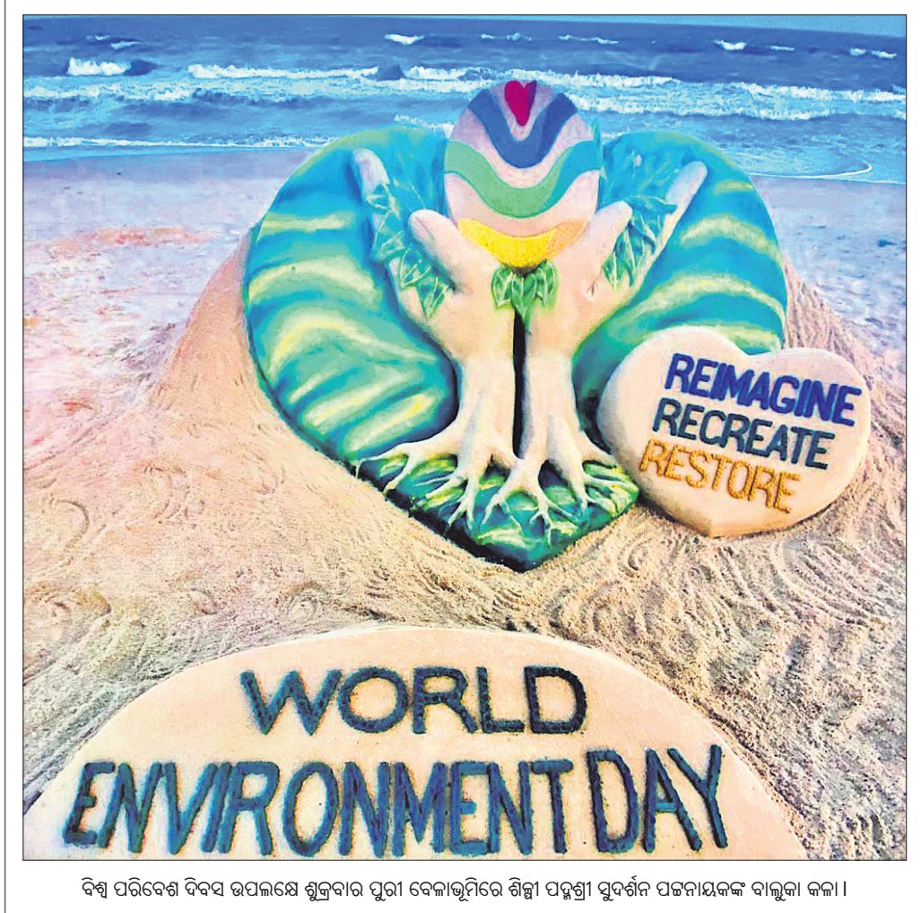
ବିଶ୍ୱ ପରିବେଶ ଦିବସ ଉପଲକ୍ଷେ ଶୁକ୍ରବାର ପୁରୀ ବେଳାଭୂମିରେ ଶିଶୁ ପଦ୍ମଶ୍ରୀ ସୁବର୍ଣ୍ଣନ ପଟ୍ଟନାୟକଙ୍କ ବାଲୁକା କଳା।

ଭୁବନେଶ୍ୱର, ୪୧ (ବୁଧବେଳା): ପ୍ରଥମେ ଜଣେ ମୁବତ୍ତାଙ୍କ ସହ ମିତ୍ରତା କରି ତାଙ୍କୁ ବିବାହ ପ୍ରସ୍ତାବ ଦେଲେ। ପରେ ତାଙ୍କ ଠାରୁ ୩ଲକ୍ଷ ୨୦ହଜାର ଟଙ୍କା ଠିକନେଲେ।