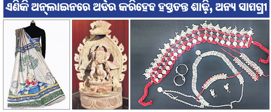
ଉତ୍କଳିକା ପକ୍ଷରୁ ବିକ୍ରି ପାଇଁ ଥିବା ହସ୍ତଶିଳ୍ପ ସାମଗ୍ରୀ।

ଭୁବନେଶ୍ୱର, ୪୧ (ବୁଧବେଳା) କରୋନା ପରିସ୍ଥିତି ପାଇଁ ବର୍ଷେ ହେବ ଓଡ଼ିଶାର ବିଭିନ୍ନ ହସ୍ତତନ୍ତ, ବୟନଶିଳ୍ପ ଏବଂ ହସ୍ତଶିଳ୍ପ ଆଧାର କରି କାବିକା ନିର୍ବାହ କରୁଥିବା ବ୍ୟବସାୟୀମାନେ ବିଶେଷ ଭାବରେ କ୍ଷତିଗ୍ରସ୍ତ ହୋଇଛନ୍ତି।