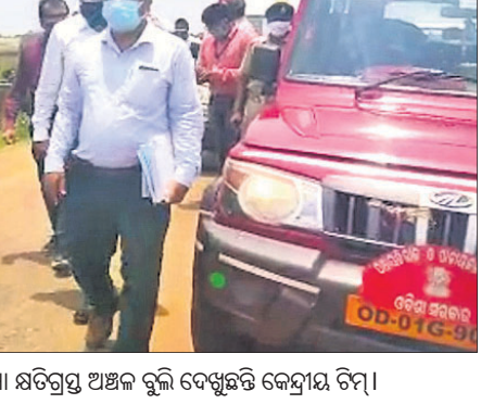
ବାଲେଶ୍ୱର ସଦର ବ୍ଲକ୍ ଅଧୀନ ସାଥୀ ବାତ୍ୟା କ୍ଷତିଗ୍ରସ୍ତ ଅଞ୍ଚଳ ବୁଲି ଦେଖିଛନ୍ତି କେନ୍ଦ୍ରୀୟ ଟିମ୍।