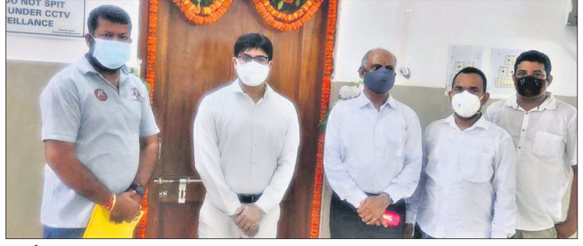
କୋର୍ଟ ଉଦଘାଟନ ଅବସରରେ ଉପସ୍ଥିତ ଅତିଥିମାନେ। ଭୁବନେଶ୍ଵର, ୭୧୬ (ସୁ.ପ୍ର.)