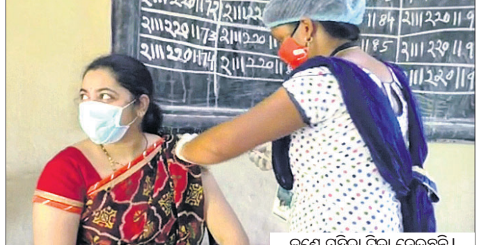
ଜଣେ ମହିଳା ଟିକା ନେଉଛନ୍ତି।