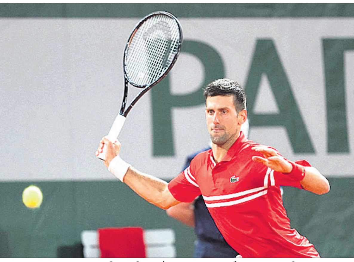
ଫ୍ରେଞ୍ଚ୍ ଓପନ ଗ୍ରାଣ୍ଡସ୍ଲାମ ଟେନିସ ପୁରୁଷ ସିଙ୍ଗଲ୍‌ସ୍ ଚତୁର୍ଥ ରାଉଣ୍ଡ ମ୍ୟାଚ ଅବସରରେ ସର୍ବିୟାର ନୋଭାକ୍ ଜୋକୋଭିଚ୍ ।

କୃଆସିଲା, ୭/୬ (ପି.ଟି.): ଭାରତୀୟ କ୍ରିକେଟ ଦଳର ଶ୍ରୀଲଙ୍କା ଟୁର ଜୁଲାଇ ୧୩ରୁ ୨୫ ମଧ୍ୟରେ ହେବ । ଦଳ ସେଠାରେ ୩ ଅନ୍ତର୍ଜାତୀୟ ଦିନିକିଆ ଓ ସମାନ ସଂଖ୍ୟକ ଟି୨୦ ଖେଳ ବୋଲି ପ୍ରସାରଣକାରୀ ସଂସ୍ଥା ସେନି ସୋମବାର ପ୍ରକାଶ କରିଛି । ଦଳର ଅଧିନାୟକ ଦୌଡ଼ରେ ଶିଖର ଧାଞ୍ଜନ, ହାର୍ଦିକ ପାଣ୍ଡ୍ୟ ଏବଂ ସମ୍ପୂର୍ଣ୍ଣ ପିଟ୍ ଥିବା ଶ୍ରେୟାସ ଆୟାୟ ରହିଛନ୍ତି । ଅନ୍ତର୍ଜାତୀୟ ଦିନିକିଆ ମ୍ୟାଚରୁ ଜୁଲାଇ ୧୩, ୧୬ ଓ ୧୮ରେ ଖେଳାୟିତାଙ୍କୁ ବେଳେ ୧୨୦ରୁଜିକ ଜୁଲାଇ ୨୧, ୨୩ ଓ ୨୫ରେ ଖେଳାୟିତା । ମ୍ୟାଚରୁଜିକ ଲାଗି ଭେଲ୍‌ସି ଏସିଆନ ଟୁର ହୋଇନାହିଁ । ଭାରତର ଟୁଇଟ୍ ଦଳ ଏକସଙ୍ଗରେ ଅଲଗା ଅଲଗା ଦେଶରେ ଖେଳିବା ଏକ ବିରଳ ଦୃଶ୍ୟ । ସମାନ ସମୟରେ ବିରାଟ କୋହଲିଙ୍କ ନେତୃତ୍ଵାଧୀନ ଦଳ ଇଂଲଣ୍ଡ ବିପକ୍ଷ ୫ ମ୍ୟାଚବିଷୟ ସିରିଜ ପାଇଁ ପ୍ରସ୍ତୁତ ହେଉଛନ୍ତି । ଜୁନ୍ ୧୮ରେ ଫୁଲିଆଣ୍ଡ ବିପକ୍ଷ ବିଷୟ ଟେଷ୍ଟ ମ୍ୟାଚରେ ଫାଇନାଲ ଖେଳିବା ଲାଗି ଟେଷ୍ଟ ଦଳ ଇତିମଧ୍ୟରେ ଯୁନାଇଟେଡ୍ କିଙ୍ଗଡମ୍ (ୟୁକେ)ରେ ପହଞ୍ଚିସାରିଛି । ଇଂଲଣ୍ଡ ବିପକ୍ଷ ସିରିଜ ଅଗଷ୍ଟ ୪ରୁ ଆରମ୍ଭ ହେବ ।