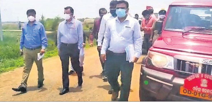
ବାଲେଶ୍ଵର ସଦର ବ୍ଲକ୍ ଅଧୀନ ସାଥୀ ବାତ୍ୟା କ୍ଷତିଗ୍ରସ୍ତ ଅଞ୍ଚଳ ବୁଲି ଦେଖିଛନ୍ତି କେନ୍ଦ୍ରୀୟ ଟିମ୍।