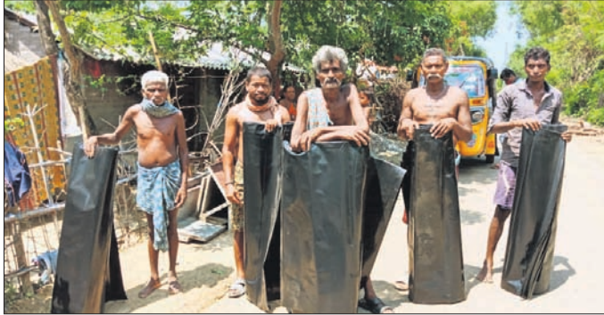
ଗଣଗୋଳ ରାଜସ୍ୱ କ୍ଷେତ୍ରରେ ବନ୍ୟାଦିପନଙ୍କୁ ପଲିଥିନ ବ୍ୟବନ କରାଯାଇଛି।

ବାଲେଶ୍ୱର ଜିଲ୍ଲା ଖଇରା ତହସିଲ ଗଣଗୋଳ ରାଜସ୍ୱ କ୍ଷେତ୍ରରେ ବାତ୍ୟା ଯାଏଲ ସହିତ ଧଳାକାଳୁ ଥାନାରେ ଅଟକ ରଖି ଘଟଣାର ତଦନ୍ତ ଆରମ୍ଭ କରିଛି। ସେମାନଙ୍କ ନିକଟରୁ ଏକ ବାବୁ ଭିତରେ ବିଶ୍ୱୋରକ ଦ୍ରବ୍ୟ, ୨ଟି ବାଲକ୍ ଜବତ ହୋଇଛି। ଏହି ଦ୍ରବ୍ୟ ବୋମା ତିଆରିରେ ବ୍ୟବହାର ହୁଏ ବୋଲି ସୂଚନା ମିଳିଛି। ଗୁଡ଼ିଗଡ଼ିଆ ଅଞ୍ଚଳରୁ ୨ଜଣ ମୃଦକ ଏକ ବାଲକ୍ରେ ଆସିଥିବା ବେଳେ ସିପୁଲିଆ ଅଞ୍ଚଳରୁ ଅନ୍ୟ ୨ଜଣ ଏକ ବାଲକ୍ରେ ପହଞ୍ଚି ବିଶ୍ୱୋରକ ଦ୍ରବ୍ୟ ବିକ୍ରି ନେଇ ଡିଲ୍ କରିଥିଲେ। ଦରଦାମ୍ଭୁ ନେଇ ସେମାନଙ୍କ ମଧ୍ୟରେ କଥା କଟାକଟି ୧୯୦ଜଣଙ୍କୁ ଟିକା ପ୍ରଦାନ କରାଯାଇଛି।