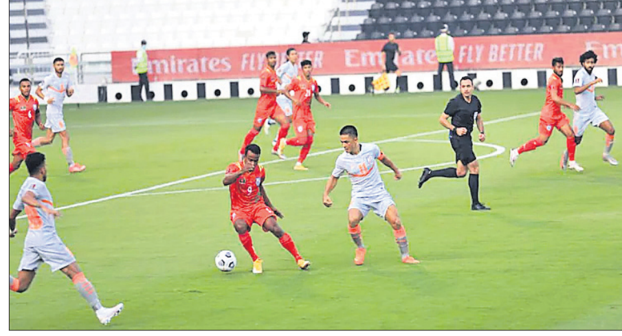
ଭାରତ ଓ ବାଂଲାଦେଶ ମଧ୍ୟରେ ଅନୁଷ୍ଠିତ ମ୍ୟାଚ ।

୭ଟି ମ୍ୟାଚରୁ ୩ ଡ୍ର, ୩ ପରାଜୟ ଓ ଗୋଟିଏ ବିଜୟରୁ ୬ ପଏଣ୍ଟ୍ ଅର୍ଜନ କରି ଗ୍ରୁପ୍ ଇଂ ଦ୍ଵିତୀୟ ରାଉଣ୍ଡ ପଏଣ୍ଟ୍ ଟେବୁଲର ଚତୁର୍ଥ ସ୍ଥାନ ଅଧିକାର କରିଛି । କାତାର ସମାନ ସଂଖ୍ୟକ ମ୍ୟାଚରୁ ୧୯ ପଏଣ୍ଟ୍ ସହ ଟେବୁଲର ଶୀର୍ଷରେ ରହିଥିବାବେଳେ ଓମାନ ୫ଟି ମ୍ୟାଚରୁ ୧୨ ପଏଣ୍ଟ୍ ସହ ଦ୍ଵିତୀୟ ସ୍ଥାନରେ ରହିଛି । ଆଫଗାନିସ୍ତାନ ୬ଟି ମ୍ୟାଚରୁ ୫ ପଏଣ୍ଟ୍ ସହ ଚତୁର୍ଥ ଏବଂ ବାଂଲାଦେଶ ୬ଟି ମ୍ୟାଚରୁ ମାତ୍ର ୨ ପଏଣ୍ଟ୍ ହାସଲ କରି ୫ମ ତଥା ସର୍ବନିମ୍ନ ସ୍ଥାନରେ ରହିଛି । ଅନ୍ୟପକ୍ଷରେ ସୋମବାର ବାଂଲାଦେଶକୁ ପରାସ୍ତ କରିବା ଦ୍ଵାରା ଭାରତ ଗତ ୬ ବର୍ଷ