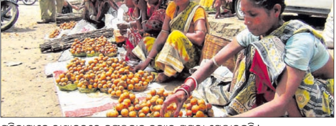
ବିକଳମାନେ ରାସ୍ତାକଡ଼ରେ ଜଙ୍ଗଲଜାତ ଦ୍ରବ୍ୟର ପକ୍ଷା ମୋକାଇଛନ୍ତି।

କାଳିକେନ୍ଦୁ, କଇଁସ, ଯଉଁ, କାମୁ ଆଦି ଫଳ ଗଛ ଥିବାବେଳେ ଖରାଦିନେ ଏହି ଫଳ ଗୁଡ଼ିକ ପାଟିଆଏ। ଆଗ୍ରହର ସହିତ କନସାଧାରଣ ଏହି ସିକିନାଳ ଫଳ କିଣିବା ପାଇଁ ଆଗ୍ରହୀ ହେଉଥିବାବେଳେ ଆଦିବାସୀ ପରିବାରବର୍ଗଙ୍କ ପେଟ ପୋଷିବା ପାଇଁ ସହଜସାଧ୍ୟ ହୋଇ ବାଣିଜ୍ୟ, ଚେଳକୋଇ, ଖୁସ୍ତୁରୀ ଭୃତ୍ୟା ଆଦି ହେଲେ ବେପାରୀ ଜଙ୍ଗଲ ଧ୍ୟସ ଯୋଗୁଁ ପୂର୍ବରୁ ଫଳଗଛ ଧ୍ୟସ ପାଇବାରେ ଲାଗିଥିଲେ ସୁଦ୍ଧା