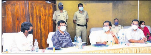
ଭଦ୍ରକ ଜିଲ୍ଲା ଧାମରା ବନ୍ଦର ସଂଖାରୁହରେ ଅନୁକୃତ ବୈଠକରେ କେନ୍ଦ୍ରୀୟ ଚିମ୍ବ ସମୀକ୍ଷା କରୁଛନ୍ତି।

ଆଲୋଚନା କରିବା ପରେ ସଦର ଚଳୁ ଅଧୀନ ସାଥୀ ଅଞ୍ଚଳ ପରିବର୍ତ୍ତନ କରିଥିଲେ। ସେଠାରେ ଭାଙ୍ଗିଥିବା ନଦୀବନ୍ଧ, ଗ୍ରାମ୍ୟ, ବିଦ୍ୟୁତ୍ ସ୍ତମ୍ଭ, ବାସସୁର, ଗ୍ୟାସ୍‌ଲିନ ପରିବର୍ତ୍ତନ ସହ ଗ୍ଲାନାୟ ବିପଜ୍ଜଳ ପରିସ୍ଥିତି ଅନୁଧ୍ୟାନ କରିଥିଲେ। ପରେ କ୍ୟାମ୍ପ୍, ଗାଦିପୁର, ବନଗାମଗଡ଼ି ସହିତ ବାହାନଗା ଚଳୁ ଅଧୀନ ଅନୁପୁର, ସୋର ଚଳୁର କ୍ଷତ୍ରିଗ୍ରସ୍ତ ବିଭିନ୍ନ ଅଞ୍ଚଳକୁ ଯାଇ ପ୍ରିତି ପରଖୁଥିଲେ। ଏହି ଚିମ୍ବରେ ବର୍ଷାକାଳ ସହ ଗ୍ରାମ୍ୟ ଉନ୍ନୟନ ମନୁଶାଳୟର