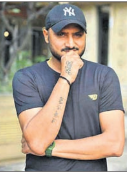
ନୂଆଦିଲ୍ଲୀ, ୭/୬ (ପି.ଟି.): ହରଭଜନ ସିଂ ସୋମବାର ନିଃସର୍ତ୍ତ କ୍ଷମା ପ୍ରାର୍ଥନା କରିଛନ୍ତି । ଏହି ଭେଟେରାନ ଭାରତୀୟ ଅଫ୍ ଫିଲ୍ଡ ଖିଳାଳୀ ସମ୍ଭାବନାବାଦୀ ଜର୍ନେଲ ସିଂ ଭିନ୍ନଭିନ୍ନ ପ୍ରତି ଶ୍ରଦ୍ଧାଞ୍ଜଳି ଛାପନ କରି ସୋସିଆଲ ମିଡିଆରେ ଏକ ଫଟୋ ଶେୟାର କରିଥିଲେ । ଭିନ୍ନଭିନ୍ନଭିନ୍ନ ୧୯୮୪ ରୁଷ୍ଟର ଅପରେଶନ ବେଳେ ମୃତ୍ୟୁବରଣ କରିଥିଲେ । ୪୦ ବର୍ଷୀୟ ଅଫ୍ ଫିଲ୍ଡର କହିଛନ୍ତି ରୁଷ୍ଟର ଅପରେଶନର ୩୭ତମ ବାର୍ଷିକ ପୂର୍ତ୍ତି ଅବସରରେ ସେ ଏକ ସ୍ଵାସ୍ଥ୍ୟାୟ ଫରାଓର୍ଡ ପୋଷ୍ଟ କରିଥିଲେ । ଫଟୋରେ ଗ୍ଲାନିଟ ବ୍ୟକ୍ତି ଜଣକ ଭିନ୍ନଭିନ୍ନଭିନ୍ନ ବୋଲି ଚାକର ଧାରଣା ନ ଥିଲା । ଏହି ଇନ୍‌ଷ୍ଟାଗ୍ରାମ ପୋଷ୍ଟ ପାଇଁ ସେ କ୍ଷମାପ୍ରାର୍ଥନା କରୁଛନ୍ତି । ସେ ଜଣେ ଶିଖି । ଭାରତ ବିରୋଧରେ ନୁହେଁ ଭାରତ ସପକ୍ଷରେ ସେ ଲଢ଼ିବେ ।