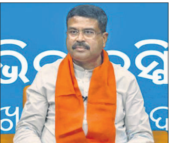
କୋଭିଡ଼ ହସ୍ପିଟାଲ ଲୋକାର୍ପଣ ଉତ୍ସବରେ କେନ୍ଦ୍ରମନ୍ତ୍ରୀଙ୍କ ସହ ରାଜ୍ୟ ସରକାରଙ୍କ ମନ୍ତ୍ରୀ, ପ୍ରଶାସନିକ ଅଧିକାରୀ ଓ ଶିଳ୍ପସଂସ୍ଥା ଅଧିକାରୀମାନେ