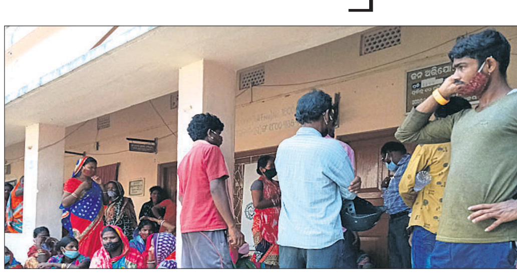
ବ୍ଲକ୍ ସମ୍ମୁଖରେ ଗ୍ରାମବାସୀ ଧାରଣାରେ ବସିଛନ୍ତି।

'ସ୍ୱାସ୍ଥ୍ୟ' ବାତ୍ୟାରେ ବାଲେଶ୍ୱର ଜିଲ୍ଲା ସହର ବ୍ଲକ୍ ଅଧୀନ ବହୁ ପଞ୍ଚାୟତ ପ୍ରଭାବିତ ହୋଇଛି। ସରକାରଙ୍କ ନିର୍ଦ୍ଦେଶ ମୁତାବକ ବ୍ଲକ୍ ପ୍ରଶାସନ, ସହର ତହସିଲଦାର ଏବଂ କୃଷି ବିଭାଗ ପକ୍ଷରୁ ପ୍ରଭାବିତ ଅଞ୍ଚଳ ବୁଲି କ୍ଷୟକ୍ଷତି ଆକଳନ କରିବିଆଯାଇଥିଲେ ହେଁ ଏପର୍ଯ୍ୟନ୍ତ ସରକାରୀ ସହାୟତା ମିଳିନାହିଁ। ସହର ବ୍ଲକ୍ ଗୋପିନାଥପୁର ପଞ୍ଚାୟତର କାଠପାଳ ଗ୍ରାମର ଲୋକେ ଏଥିରୁ ବଞ୍ଚିତ ରହିଛନ୍ତି। ଏହାର ପ୍ରତିବାଦ କରି ସୋମବାର ଗ୍ରାମର ଶତାଧିକ ମହିଳା, ପୁରୁଷ ସହାୟତା ପାଇଁ ବ୍ଲକ୍ କାର୍ଯ୍ୟକ୍ରମରେ ଧାରଣା ଦେଇଥିଲେ। ତେବେ ବିଡିଓ କାର୍ଯ୍ୟକ୍ରମରେ ଅନୁପସ୍ଥିତ ଥିବାରୁ ଅପରାହ୍ଣ ୨ଟା ପର୍ଯ୍ୟନ୍ତ ଲୋକେ ଭୋକ ଉପାସରେ ବସିଥିଲେ। ସେମାନଙ୍କ ମଧ୍ୟରେ ଉଭେକଦା ପ୍ରକାଶ