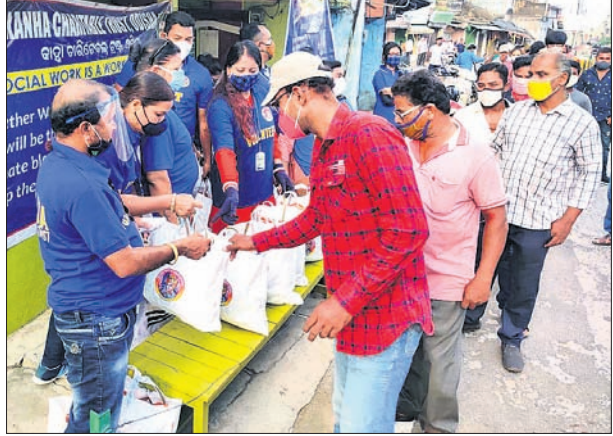
ରାଶନ ସାମଗ୍ରୀ ବଣ୍ଟନ କରାଯାଇଛି।

ବିଏମ୍ପିରେ ପ୍ରକ୍ରିୟା ଆରମ୍ଭ ହୋଇଛି। କୋଭିଡ଼ ନିୟମ କଡ଼ାକଡ଼ି ପାଳନ ହେଉଛି ଏବଂ ସାମାଜିକ ଦୂରତାକୁ ସର୍ବାଧିକ ରୁଖି ଦିଆଯାଇଛି। ଏଭଳି ସ୍ଥିତିରେ ନୂଆ ହିତାଧିକାରୀ କିଭଳି ଏକାଠି ହେବେ ଲୋକ ପ୍ରତିନିଧି ଭଉ ବାଣ୍ଟିବେ ସେନେଇ ପ୍ରଶ୍ନବାଚୀ ସୃଷ୍ଟି ହୋଇଛି। ସେମାନଙ୍କ ଯୋଗାଣରେ ବେଳେ ଏମ୍ପି ପକ୍ଷରୁ ସାହୁ କହିଛନ୍ତି, ଭଉ ବଣ୍ଟନ ପାଇଁ ସମାବେଶ ନ କରି ଦୂରତା ହିତାଧିକାରୀଙ୍କୁ ପେନ୍ସନ ପ୍ରଦାନ ଲାଗି ବିଏମ୍ପି କମିଶନରଙ୍କୁ କୁହାଯାଇଛି। ଖୁବ୍ ଶୀଘ୍ର ସମସ୍ତେ ଅନୁଲବ୍ଧରେ ଚଳା ପାଇବେ।