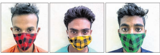
ଗିରଫ ୩ ଅଭିଯୁକ୍ତ।

କମିଶନରେଟ୍ ପୋଲିସର ସ୍ନେହାଲ ଷ୍ଟାଡ୍ ଓ କଟକ ସିଡିଏ ଫୋର୍-୨ ଆନା ପୋଲିସ୍ ମିଳିତ ଚଢ଼ାଉ କରି ମଧ୍ୟସୂଦନ ସେତୁ ନିକଟରୁ କୋଟିଏ ଟଙ୍କାର ବ୍ରାଉନସୁଗାର ଜବତ କରିଛି। ଏହି ଘଟଣାରେ ପ୍ରାୟ ୨୦୦୦ ଟଙ୍କାର ବ୍ରାଉନସୁଗାର ଆୟୁଥିବା ବ୍ୟବସାୟୀଙ୍କୁ ଗିରଫ କରାଯାଇଛି। ସେମାନଙ୍କ ନିକଟରୁ ୧ କେଜି ୩୮ ଗ୍ରାମର ବ୍ରାଉନସୁଗାର, ଏକ ବାଇଲ୍ (ଓଡ଼ି-୧୯୩-୨୯୭୮), କାର୍ (ଓଆର୍-୦୧ଏ-୦୧୨୦)କୁ ଜବତ କରାଯାଇଛି। ଅଭିଯୁକ୍ତମାନେ