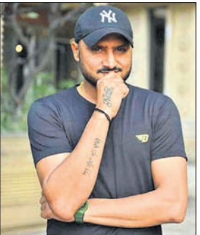
ନୂଆଦିଲ୍ଲୀ, ୭୬ (ପି.ଟି.):