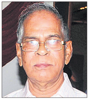
ସୁଧକ୍ଷିତ ପାଣି କନ୍ଦ: ୨୮୦୮୧୯୪୦ ବିରୋଧୀନ: ୦୫୦୬୨୦୨୧ ଧରିତ୍ରୀ ପରିବାର ପକ୍ଷରୁ ଅଶୁଳ ଶ୍ରଦ୍ଧାଞ୍ଜଳି