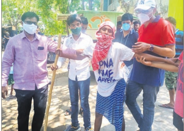
ବିଧାୟକଙ୍କ ପକ୍ଷରୁ ଭିନିଷମଙ୍କୁ ସହାୟତା ପ୍ରଦାନ କରାଯାଇଛି।