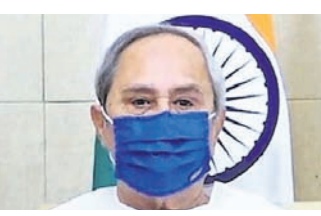
ଲଢ଼େଇ କରୁଛନ୍ତି। ଟିକାକରଣକୁ ଜାତୀୟ ମିଶନ ଭାବେ ଗ୍ରହଣ କରିଥିବାରୁ ସେ ପ୍ରଧାନମନ୍ତ୍ରୀଙ୍କୁ ଧନ୍ୟବାଦ ଦେଇଛନ୍ତି।

ଭୁବନେଶ୍ୱର, ୭।୬(ବୁଧବେ): ମାଗଣାରେ ଟିକା ଯୋଗାଣ ଯୋଷଣା ପରେ ମୁଖ୍ୟମନ୍ତ୍ରୀ ନବୀନ ପଟ୍ଟନାୟକ ଏଥିପାଇଁ ପ୍ରଧାନମନ୍ତ୍ରୀ ନରେନ୍ଦ୍ର ମୋଦିଙ୍କୁ ଧନ୍ୟବାଦ ଦେଇଛନ୍ତି। ମୁଖ୍ୟମନ୍ତ୍ରୀ ରୁଜୁ କରି କହିଛନ୍ତି ଯେ ପ୍ରତ୍ୟେକ ଜୀବନ ମୂଲ୍ୟବାନ। ଟିକା ନ ନେବା ଯାଏ କେହି ବି ସୁରକ୍ଷିତ ନୁହେଁ। ଦେଶ ପାଇଁ କୋଭିଡ୍-୧୯ ବିରୋଧରେ ଆମେ ଏକ ହୋଇ