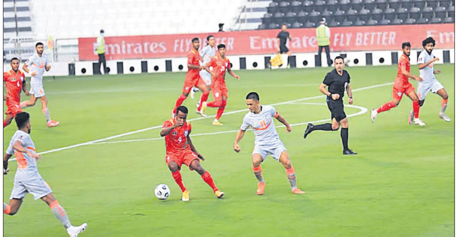
ଭାରତ ଓ ବାଂଲାଦେଶ ମଧ୍ୟରେ ଅନୁଷ୍ଠିତ ମ୍ୟାଚ ।

ମଧ୍ୟରେ ବିଶ୍ୱକପ୍ କ୍ୱାଲିଫାୟର୍ରେ ପ୍ରଥମ ବିଜୟ ହାସଲ କରିଛି । ପୂର୍ବରୁ ଭାରତ ଶେଷଥର ପାଇଁ ୨୦୧୫ ନଭେମ୍ବରରେ ବିଜୟ ହାସଲ କରିଥିଲା । ବେଙ୍ଗାଲୁରୁରେ ୨୦୧୮ ବିଶ୍ୱକପ୍ ପାଇଁ କ୍ୱାଲିଫାୟର୍ ରାଉଣ୍ଡ ମ୍ୟାଚରେ ଭାରତ ୧-୦ ଗୋଲରେ ଗୁଆମକୁ ହରାଇଥିଲା । ଗତ ଗୁରୁବାର ଭାରତ ଏସିଆନ ଚାମ୍ପିୟନ କାତାରଠାରୁ ୧-୦ ଗୋଲରେ ପରାଜିତ ହୋଇଥିଲା । ବିଶ୍ୱକପ୍ ପାଇଁ ଯୋଗ୍ୟତା ହାସଲ ଦୌଡ଼ରୁ ଭାରତ ବାଦ୍ ପଡ଼ିସାରିଛି । ତେବେ ୨୦୨୩ ଏସିଆନ କପ୍ ପାଇଁ ଯୋଗ୍ୟତା ହାସଲ ସମ୍ଭାବନା ରଜାବିତ ରହିଛି ।