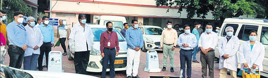
ବ୍ରହ୍ମପୁରରେ ଜିଲ୍ଲାପାଳ ଅକ୍ଟୋବର କନ୍ୟାନ୍ତ୍ରେତର ସେବା ଶୁଭାରମ୍ଭ କରୁଛନ୍ତି।