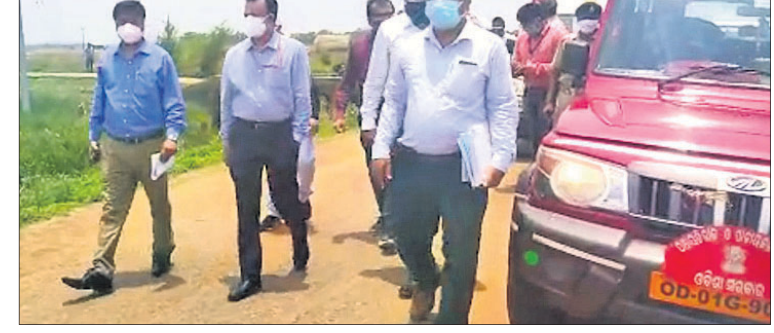
ବାଲେଶ୍ୱର ସଦର ବ୍ଲକ୍ ଅଧୀନ ସାଥୀ ବାନ୍ଦାଲି କ୍ଷତିଗ୍ରସ୍ତ ଅଞ୍ଚଳ ବୁଲି ଦେଖିଛନ୍ତି କେନ୍ଦ୍ରୀୟ ଟିମ୍।