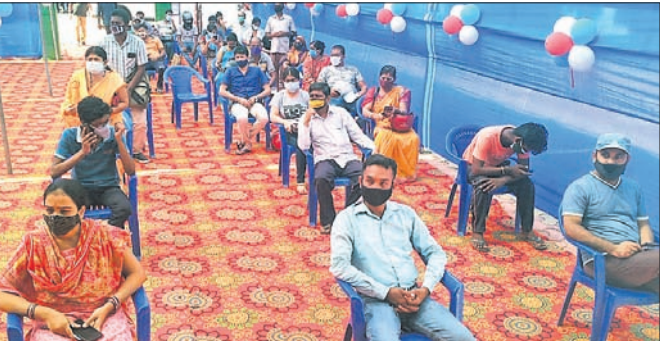
ଛତ୍ରପୁରରେ ଟିକା ନେବାକୁ ଆସିଥିବା ୧୮୭ ୪୪ ବର୍ଷ ବର୍ଗର ଲୋକେ।