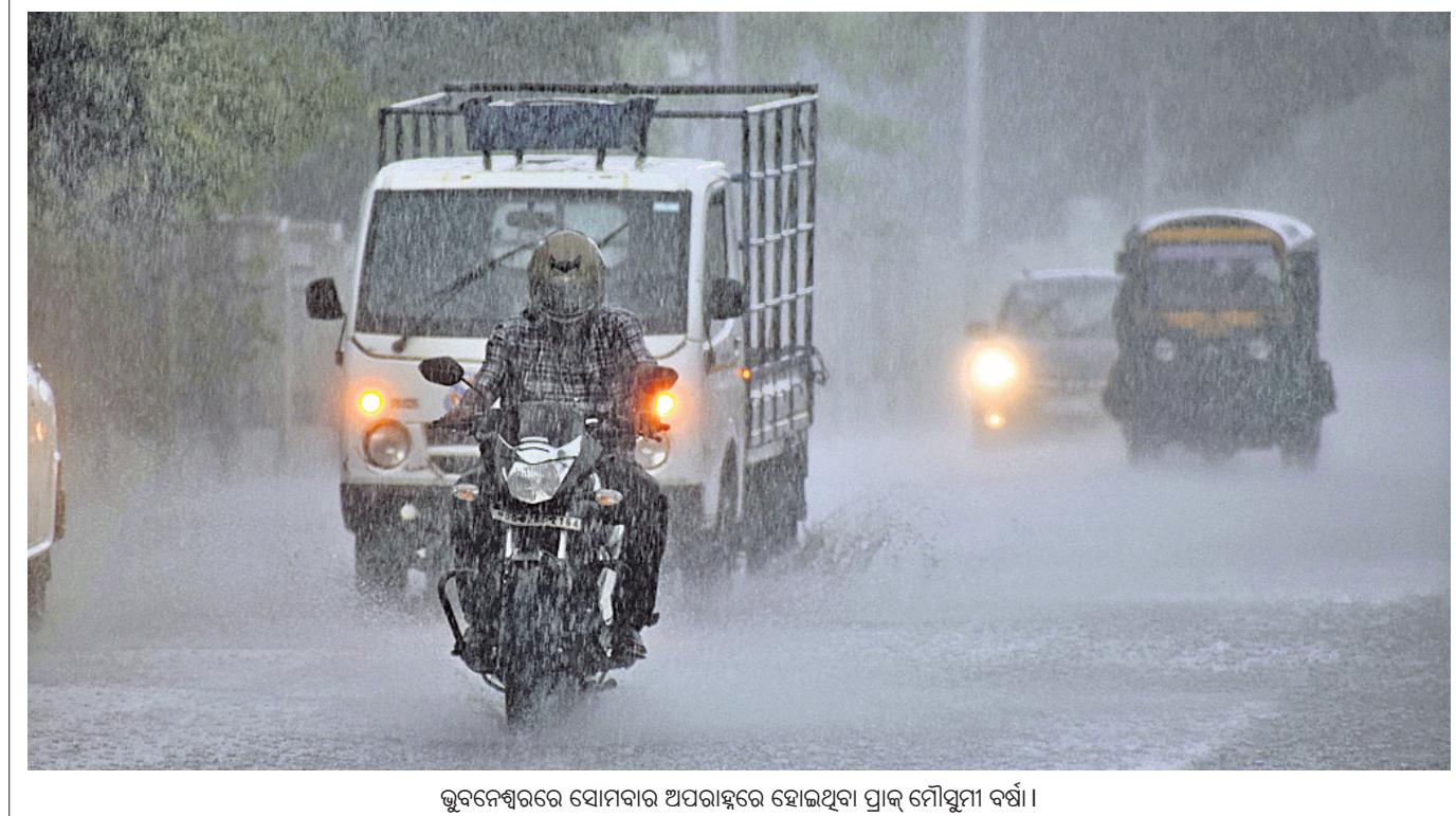
ଭୁବନେଶ୍ୱରରେ ସୋମବାର ଅପରାହ୍ନରେ ହୋଇଥିବା ପ୍ରାକ୍ ମୌସୁମୀ ବର୍ଷା।

ଭୁବନେଶ୍ୱର, ୭।୬(ବୁଧବେ): ଦେଶବାସୀଙ୍କ ଆବଶ୍ୟକତାକୁ ଦୃଷ୍ଟିରେ ରଖି ପ୍ରଧାନମନ୍ତ୍ରୀ ନରେନ୍ଦ୍ର ମୋଦି ସମସ୍ତଙ୍କୁ ମାଗଣା ଟିକା ପ୍ରଦାନ ଏବଂ ପ୍ରଧାନମନ୍ତ୍ରୀ ଗରିବ କଲ୍ୟାଣ ଯୋଜନାର ସମ୍ପ୍ରସାରଣ ଯୋଷଣା କରିଛନ୍ତି। ଏହି ନିଷ୍ପତ୍ତିକୁ କେନ୍ଦ୍ରମନ୍ତ୍ରୀ ଧର୍ମେନ୍ଦ୍ର ପ୍ରଧାନ ସ୍ୱାଗତ କରିଛନ୍ତି। ସେ ତୁରନ୍ତ କରିଛନ୍ତି ଯେ କୋଭିଡ୍ ମହାମାରୀ ବିରୋଧୀ ଲଢ଼େଇରେ ପ୍ରଧାନମନ୍ତ୍ରୀ ଜନକଲ୍ୟାଣ ପାଇଁ ନେଇଥିବା ନିଷ୍ପତ୍ତି ତାଙ୍କ ଦୂରଦର୍ଶୀ ନେତୃତ୍ୱରେ ପରିଚୟ ଦେଉଛି। କରୋନା ବିରୋଧୀ ଦେଶର ଲଢ଼େଇକୁ ଅଧିକ ସୁଦୃଢ଼ କରିବା ପାଇଁ ତାଙ୍କ ଦ୍ୱାରା ନିଆଯାଇଥିବା ଗୁରୁତ୍ୱପୂର୍ଣ୍ଣ ନିଷ୍ପତ୍ତି ପାଇଁ କୃତଜ୍ଞତା ଜ୍ଞାପନ କରିଛନ୍ତି। ସମସ୍ତଙ୍କୁ ମାଗଣା ଟିକା ଉପଲବ୍ଧ କରାଇବା ଦିଗରେ ସରକାର ଟିକାକରଣ ସହ ଜଡ଼ିତ ରାଜ୍ୟମାନଙ୍କ ଦ୍ୱାରା କରାଯାଇଥିବା ୨୫ ପ୍ରତିଶତ କାର୍ଯ୍ୟକୁ ଭାରତ ସରକାର ନିଜ ଦାୟିତ୍ୱରେ ନେବା ପାଇଁ ନିଷ୍ପତ୍ତି ନେଇଛନ୍ତି। ଭାରତ ସରକାର ଟିକା ଉତ୍ପାଦନକାରୀଙ୍କ ଠାରୁ ମୋଟ ଟିକା ଉତ୍ପାଦନ ମଧ୍ୟରୁ ୨୫ ପ୍ରତିଶତ ଟିକା ରାଜ୍ୟ ସରକାରଙ୍କୁ ମାଗଣାରେ ଯୋଗାଇ ଦେବେ। ବାକି ୨୫ ପ୍ରତିଶତ ଟିକା ଘରୋଇ ହସିଡାଲ ଗୁଡ଼ିକୁ ଦିଆଯିବ। ଆସନ୍ତା ଜୁନ ୨୧ରୁ ଭାରତ ସରକାର ଦେଶର ସବୁ ରାଜ୍ୟରେ ଥିବା ୧୮ ବର୍ଷରୁ ଅଧିକ ନାଗରିକଙ୍କ ପାଇଁ ମାଗଣା ଟିକା ପ୍ରଦାନ କରିବେ। ଦୁର୍ଭିକ୍ଷ ଏବଂ ଗରିବ ଶ୍ରେଣୀର ଲୋକଙ୍କ ପ୍ରତି ସମ୍ବେଦନଶୀଳତା ଏବଂ ଗରିବଙ୍କ କଲ୍ୟାଣ ପାଇଁ ନିଜର ପ୍ରତିବଦ୍ଧତାକୁ ଦର୍ଶାଇ ପ୍ରଧାନମନ୍ତ୍ରୀ ମୋଦି ଦେଶର ୮୦ କୋଟି ଜନସାଧାରଣଙ୍କ ପାଇଁ ଗରିବ କଲ୍ୟାଣ ଅଭିଯୋଗର ଅବଧୂକୁ ଦାପାଦଳି ପର୍ଯ୍ୟନ୍ତ ବଢ଼ାଇବା ପାଇଁ ନିଷ୍ପତ୍ତି ନେଇଛନ୍ତି। ଏହା ଦ୍ୱାରା ଦେଶର କର୍ମେ ଗରିବ ଉପାସରେ ରହିବ ନାହିଁ ବୋଲି ପ୍ରଧାନ ମନ୍ତ୍ରୀ କହିଛନ୍ତି।