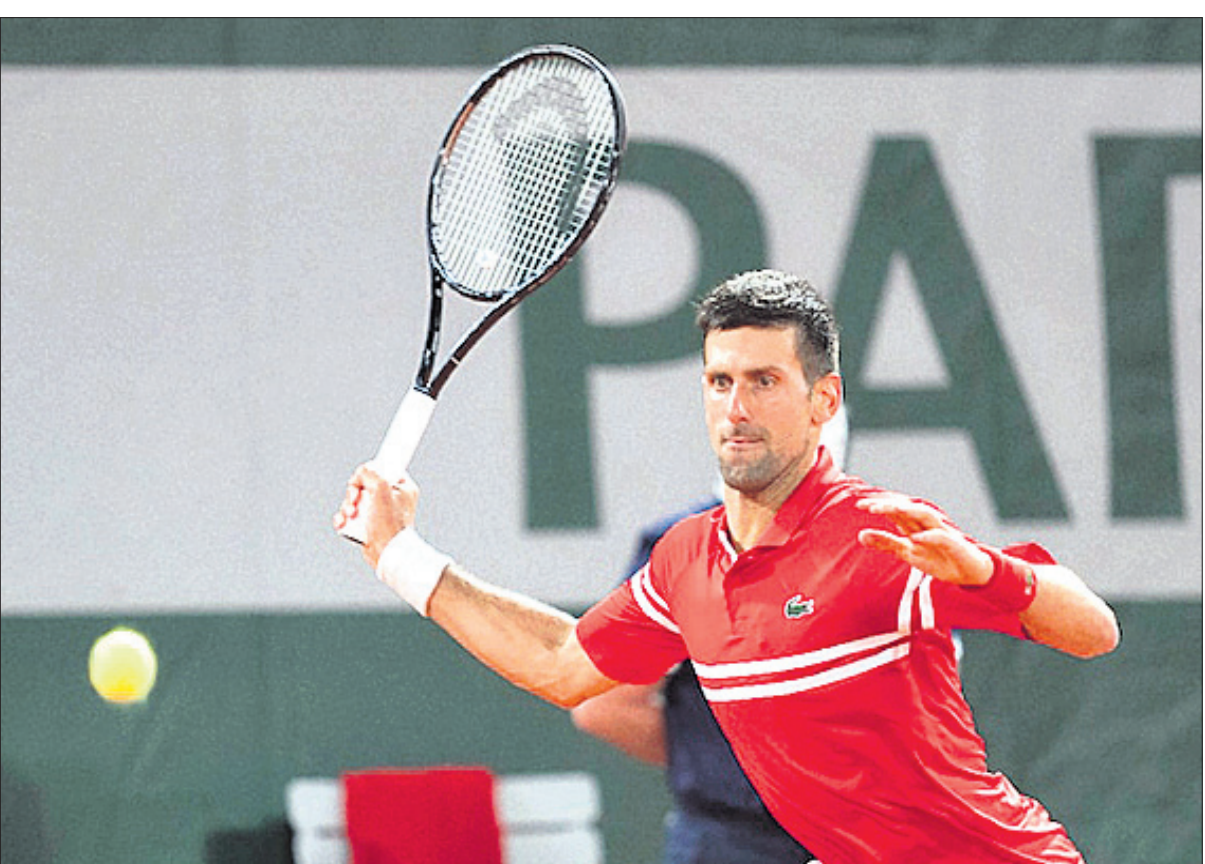
ଫ୍ରେଜ୍ ଓପନ ଗ୍ରାଣ୍ଡସ୍ଲାମ ଚେନିସ ପୁରୁଷ ସିଙ୍ଗଲ୍ସ ଚତୁର୍ଥ ରାଉଣ୍ଡ ମ୍ୟାଚ ଅବସରରେ ସର୍ବିୟାର ନୋଭାକ୍ ଜୋକୋଭିଚ୍ ।