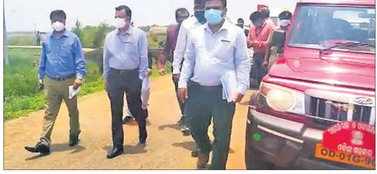
ବାଲେଶ୍ୱର ସଦର ବ୍ଲକ୍ ଅଧୀନ ସାଥୀ ବାତ୍ୟା କ୍ଷତିଗ୍ରସ୍ତ ଅଞ୍ଚଳ ବୁଲି ଦେଖିଛନ୍ତି କେନ୍ଦ୍ରୀୟ ଟିମ୍।