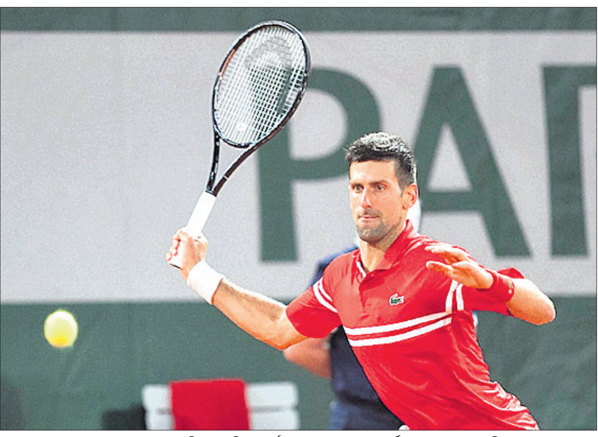
ଫ୍ରେଞ୍ଚ ଓପନ ଗ୍ରାଣ୍ଡସ୍ଲାମ ଟେନିସ ପୁରୁଷ ସିଙ୍ଗଲ୍ସ ଚତୁର୍ଥ ରାଉଣ୍ଡ ମ୍ୟାଚ ଅବସରରେ ସର୍ବିୟାର ନୋଭାକ୍ ଜୋକୋଭିଚ୍ ।