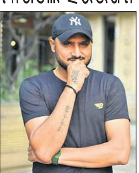
ନୂଆଦିଲ୍ଲୀ, ୭/୬ (ପି.ଟି.): ହରଭଜନ ସିଂ ସୋମବାର ନିସର୍ଭ କ୍ଷମା ପ୍ରାର୍ଥନା କରିଛନ୍ତି । ଏହି ଭେଟେରାନ ଭାରତୀୟ ଅଫ୍ ସ୍ପିନର ଖଲିଲ୍ଲାହୀ ସମ୍ଭାଷଣାଦୀ ଜର୍ନେଲ ସିଂ ଭିନ୍ନଭିନ୍ନ ପ୍ରତି ଶ୍ରଦ୍ଧାଞ୍ଜଳି ଜ୍ଞାପନ କରି ସୋସିଆଲ ମିଡିଆରେ ଏକ ଫଟୋ ଶେୟାର କରିଥିଲେ । ଭିନ୍ନଭିନ୍ନ ୧୯୮୪ ନୁଷ୍ଟର ଅପରେଶନ ବେଳେ ମୃତ୍ୟୁବରଣ କରିଥିଲେ । ୪୦ ବର୍ଷୀୟ ଅଫ୍ ସ୍ପିନର କହିଛନ୍ତି ନୁଷ୍ଟର ଅପରେଶନର ୩୭ତମ ବାର୍ଷିକ ପୂର୍ତ୍ତି ଅବସରରେ ସେ ଏକ ସ୍ଵାସ୍ଥ୍ୟ ଆଫ୍ ଫରାଓର୍ଡ ପୋଷ୍ଟ କରିଥିଲେ । ଫଟୋରେ ଘ୍ରାନିତ ବ୍ୟକ୍ତି ଜଣକ ଭିନ୍ନଭିନ୍ନଭିନ୍ନ ବୋଲି ତାଙ୍କର ଧାରଣା ନ ଥିଲା । ଏହି ଇନଷ୍ଟାଗ୍ରାମ ପୋଷ୍ଟ ପାଇଁ ସେ କ୍ଷମାପ୍ରାର୍ଥନା କରୁଛନ୍ତି । ସେ ଜଣେ ଶିଖି । ଭାରତ ବିରୋଧରେ ନୁହେଁ ଭାରତ ସପକ୍ଷରେ ସେ ଲଢ଼ିବେ ।