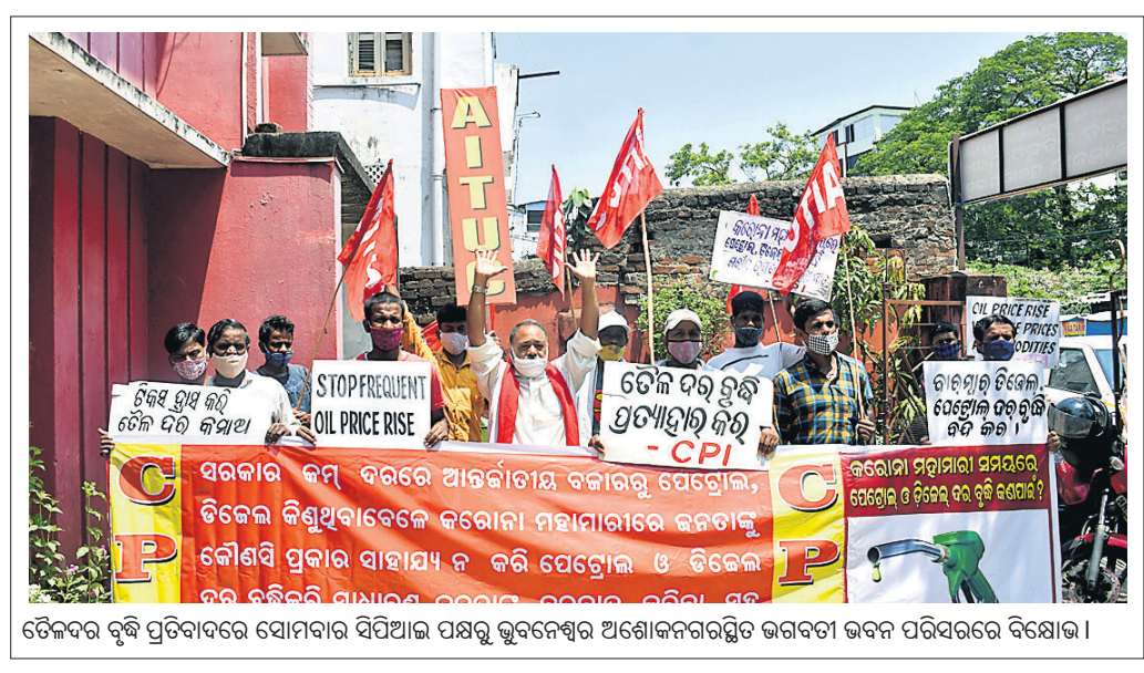
ଟିକେଦର ବୃଦ୍ଧି ପ୍ରତିବାଦରେ ସୋମବାର ସିପିଆଇ ପକ୍ଷରୁ ଭୁବନେଶ୍ୱର ଅଶୋକନଗରସ୍ଥିତ ଭଗବତୀ ଭବନ ପରିସରରେ ବିକ୍ଷୋଭ।