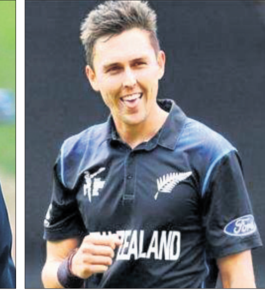
ଡମ୍ ବେସ୍ ଟ୍ରେଣ୍ଡ ବୋଲ୍

ଲଣ୍ଡନ୍ ଗ୍ରାଉଣ୍ଡରେ ଅନୁଷ୍ଠିତ ଇଂଲଣ୍ଡ-ସ୍କଟଲଣ୍ଡ ପ୍ରଥମ ଟ୍ରଜେକ୍ଟ ଟେଷ୍ଟ ଟ୍ରା ଉଦ୍‌ଘାଟନ ପ୍ରଥମ ଇନିଂସରେ ଲଣ୍ଡନ୍ ଗ୍ରାଉଣ୍ଡରେ ୩୭୮ ଏବଂ ଇଂଲଣ୍ଡ ୨୭୫ ରନ କରିଥିଲା। ଲଣ୍ଡନ୍ ଗ୍ରାଉଣ୍ଡରେ ୩୭୮ ଏବଂ ଇଂଲଣ୍ଡ ୨୭୫ ରନ କରିଥିଲା। ଲଣ୍ଡନ୍ ଗ୍ରାଉଣ୍ଡରେ ୩୭୮ ଏବଂ ଇଂଲଣ୍ଡ ୨୭୫ ରନ କରିଥିଲା।