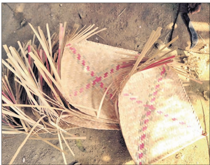
ବାଉଁଶରେ ତିଆରି କୁଳା ।