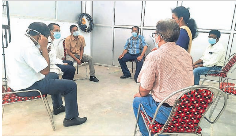
ଜିଲ୍ଲାରରେ ଅନୁଷ୍ଠିତ ବୈଠକରେ ଜିଲାପାଳ ଓ ଅନ୍ୟ ଅଧିକାରୀ।