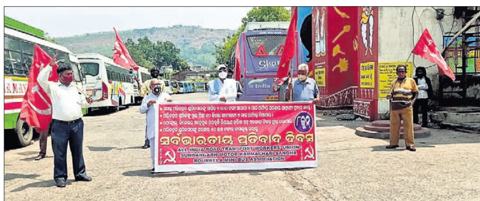
ରାଉରକେଲା ନୂଆ ବ୍ୟବସ୍ଥାରେ ପ୍ରତିବାଦ କରାଯାଇଛି।

ଏମ୍ପିଏଲ୍ ଓ ବର୍ଷା ଜଳ ଉପଯୋଗର ବ୍ୟବସ୍ଥା ରହିବ। ଏହି କୋଠା ପାଇଁ ୨୫.୯୨ କୋଟି ଟଙ୍କାର ବ୍ୟୟ ଅନୁଦାନ କରାଯାଇଛି।