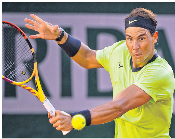
କ୍ଲେ କୋର୍ଟର ରାଜା ଭାବେ ପରିଚିତ ଫ୍ରେଞ୍ଚିସ ରାଫାଲ ନାଡ଼ାଲ।

ପ୍ୟାରିସ, ୯।୬ କ୍ଲେ କୋର୍ଟର ରାଜା ଭାବେ ପରିଚିତ ଫ୍ରେଞ୍ଚିସ ରାଫାଲ ନାଡ଼ାଲ ଏବଂ ଗ୍ରୀସ୍ମାନ୍ ଷ୍ଟିଫାନୋସ ସିଡ଼ସିପାସ ଚଳିତ ଫ୍ରେଞ୍ଚିସ ଓପନ ଗ୍ରାଣ୍ଡସ୍ଲାମ ଚେମ୍ପିୟନ ପୁରୁଷ ସିଙ୍ଗଲ୍ ସେମିଫାଇନାଲରେ ପ୍ରବେଶ କରିଛନ୍ତି। ସେମିଫାଇନାଲରେ ସିଡ଼ସିପାସ ଜର୍ମାନୀର ଆଲେକ୍ସାନ୍ଦର ଜେକ୍ରେଭେଙ୍କୁ