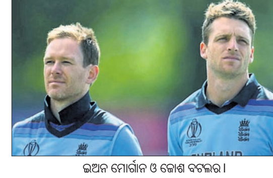
ଇଅନ ମୋର୍ଗାନ ଓ କୋଶି ବଟଲର।

ଭାରତୀୟ ବିରୋଧରେ ବର୍ଷଦିଶ୍ୟମ୍ୟ ଆକ୍ସେସ କରି ଇଂଲଣ୍ଡ ସାମିତ ଓଭର ଅଧିନାୟକ ଇଅନ ମୋର୍ଗାନ ଓ ଉଇଲିୟମସନଙ୍କୁ ପରିହାସ କରି ଏହି ଦୁଇ କ୍ରିକେଟର ରୁଇର୍ କରିଥିଲେ। ଏହି ଦୁଇଜଣର ବର୍ଷଦିଶ୍ୟମ୍ୟ ଆକ୍ସେସ କରାଯାଇଥିବାର ଅଭିଯୋଗ ହୋଇଛି। ଏବେ ଏହି ଦୁଇ ଚାରକା କ୍ରିକେଟର ଇଂଲଣ୍ଡ ଓ ଫ୍ରେଜ୍ କ୍ରିକେଟ ବୋର୍ଡ (ଇସିବି)ର ତଦନ୍ତ ପରିସରଭୁକ୍ତ ହୋଇଛନ୍ତି। ଏମାନଙ୍କ ବିରୋଧରେ ଉଚିତ ତଥା ପ୍ରାସଙ୍ଗିକ କାର୍ଯ୍ୟାନୁଷ୍ଠାନ ଗ୍ରହଣ କରାଯିବ ଓ ପ୍ରତ୍ୟେକ ମାମଲା ବ୍ୟକ୍ତିଗତ ଅଧିକାର ବିଚାର କରିଥିଲା। ଏହାକୁ ଭିତ୍ତିକରି ଏହି ଦୁଇ କ୍ରିକେଟର ରୁଇର୍ କରି ଭାରତୀୟଙ୍କୁ ପରିହାସ କରିବାକୁ ପ୍ରୟାସ କରିଥିଲେ। ବଟଲର ଓ ମୋର୍ଗାନ ଉଭୟ ଇଣ୍ଡିଆନ୍ ପ୍ରିମିୟର ଲିଗ୍ (ଆଇପିଏଲ୍)ରେ ଖେଳିଛନ୍ତି। ଇତିମଧ୍ୟରେ ୨୦୧୦ରେ ଅଭିଜ୍ଞ ଦୁତ ବୋଲର କେପ୍ ଆଣ୍ଡରସନ ସମାଲିଙ୍ଗୀକୁ ନେଇ କରିଥିବା ଏକ ରୁଇର୍ସକୁ ନେଇ ମଧ୍ୟ ତଦ୍ଦି ସୃଷ୍ଟି ହୋଇଛି।