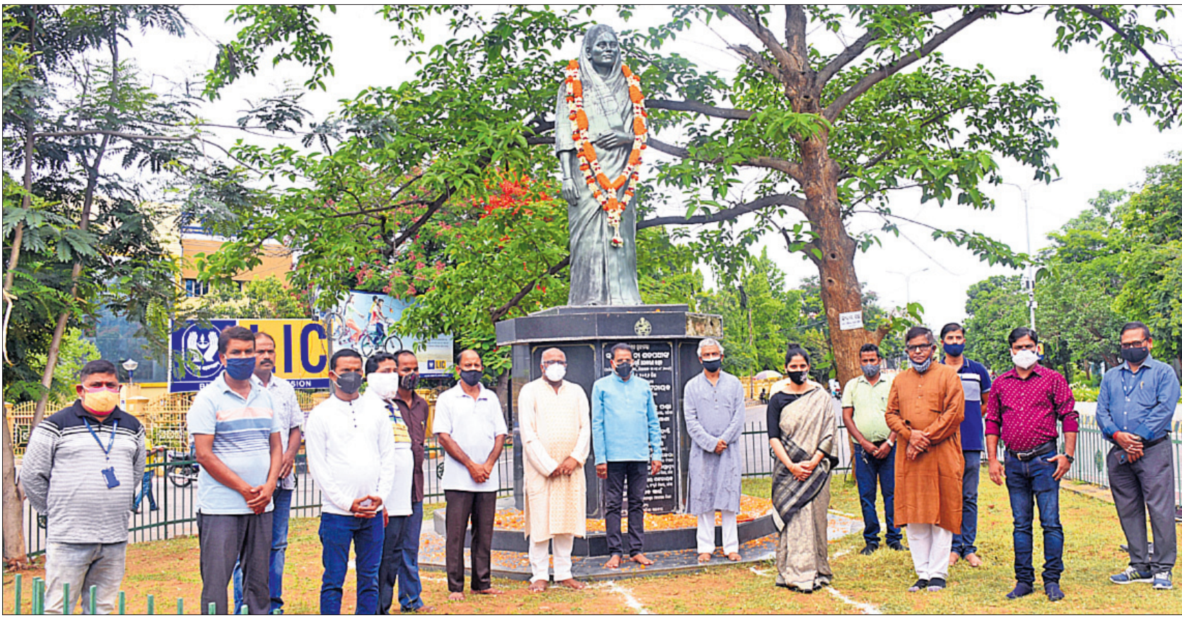
ଓଡ଼ିଶାର ଏକମାତ୍ର ମହିଳା ମୁଖ୍ୟମନ୍ତ୍ରୀ ନନ୍ଦିନୀ ଶତପଥୀଙ୍କ ୯୦ତମ ଜନ୍ମଦିନ ଅବସରରେ ଭୁବନେଶ୍ୱର ରାଜ୍ୟସରକାରଙ୍କ ଦ୍ୱାରା ତାଙ୍କ ପ୍ରତିମୂର୍ତ୍ତିର ରୂପସଂସ୍କରଣ ଆରମ୍ଭ କରାଯାଇଛି।