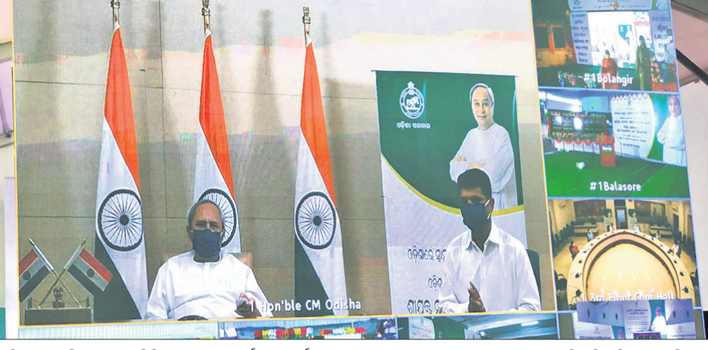
୭ ଜିଲ୍ଲାରେ ଅକ୍ଟୋବର ପୁଣ୍ୟ ଭିଡିପ୍ରସାର ସ୍ଥାପନ କରାଯାଇଛି।

ଭୁବନେଶ୍ୱର, ୯।୬(ଭୁସଙ୍ଗର) ମୁଖ୍ୟମନ୍ତ୍ରୀ ନନ୍ଦିନୀ ଶତପଥୀଙ୍କ ଦ୍ୱାରା ୭ ଜିଲ୍ଲାରେ ଅକ୍ଟୋବର ପୁଣ୍ୟ ଭିଡିପ୍ରସାର ସ୍ଥାପନ କରାଯାଇଛି। ଏହା ପ୍ରତିଷ୍ଠାପନ ପାଇଁ ୨୯ କୋଟି ୮୭୧ କୋଟି ଟଙ୍କା ମଧ୍ୟରେ ଯୋଜନା କରାଯାଇଛି।