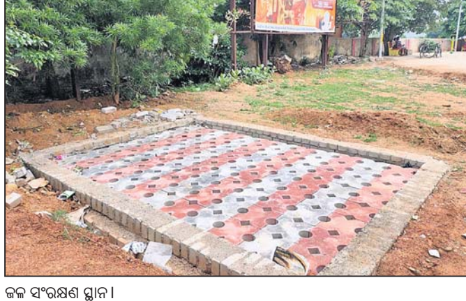
ଜଳ ସଂରକ୍ଷଣ ସ୍ଥାନ ।

ବ୍ରହ୍ମପୁର, ୧୧୬(ଡି.ଏନ.ଏ.) ଜନସଂଖ୍ୟା ବଢ଼ିବା ସାଙ୍ଗକୁ ଜଳର ଆବଶ୍ୟକତା ମଧ୍ୟ ବଢ଼ୁଛି । ପ୍ରତିବର୍ଷ ବର୍ଷା ହେଉଥିଲେ ହେଁ ଅଧିକାଂଶ ଜଳ ନଦୀ ନାଳ ମାଧ୍ୟମରେ ସମୁଦ୍ରକୁ ଚାଲି ଯାଉଥିବାରୁ ଦିନକୁ ଦିନ ଭୂତଳ ଜଳ ସ୍ତର କମିବାରେ ଲାଗିଛି । ଫଳରେ ବର୍ଷା ଜଳକୁ ସଂରକ୍ଷଣ କରି ଭୂତଳ ଜଳ ସ୍ତର ବୃଦ୍ଧି କରିବା ପାଇଁ ଯୋଜନା ଆରମ୍ଭ ହୋଇଛି । ବ୍ରହ୍ମପୁର ସହରର ବିଭିନ୍ନ