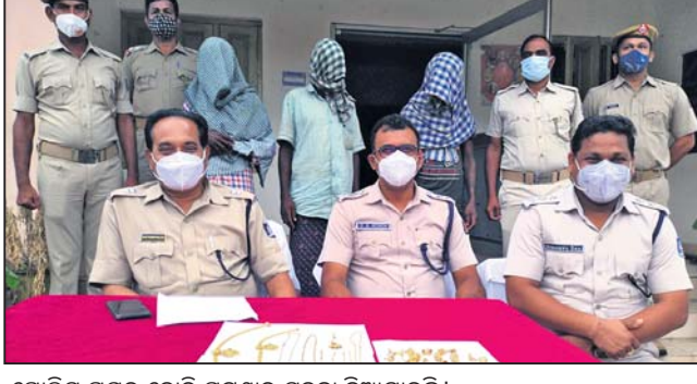
ପୋଲିସ୍ ପକ୍ଷରୁ ଚୋରି ଘଟଣାର ସୂଚନା ଦିଆଯାଇଛି ।