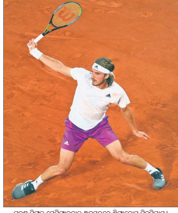
ପୁରୁଷ ସିଙ୍ଗଲ୍ ସେମିଫାଇନାଲ ଅବସରରେ ଷ୍ଟିଫାନୋସ ସିଡ୍‌ସିପାସ।

ଚଳିତ ଫ୍ରେଣ୍ଡ୍‌ସ୍ ଓପନ ଗ୍ରାଣ୍ଡସ୍ଲାମ ଟେନିସ୍ ପୁରୁଷ ସିଙ୍ଗଲ୍ ଫାଇନାଲରେ ପ୍ରବେଶ କରିଛନ୍ତି ଗ୍ରୀସର ଷ୍ଟିଫାନୋସ ସିଡ୍‌ସିପାସ। ଶୁକ୍ରବାର ଅନୁଷ୍ଠିତ ୫ ସେଣ୍ଟ ବିଗିଷ୍ଟ ପ୍ରଥମ ସେମିଫାଇନାଲରେ ସେ କର୍ମାନୀର ଆଲେକଜାଣ୍ଡର ଜେଭରେଭଙ୍କୁ ୬-୩, ୬-୩, ୪-୬, ୪-୬, ୬-୩ ସେଟ୍‌ରେ ପରାସ୍ତ କରିଛନ୍ତି।