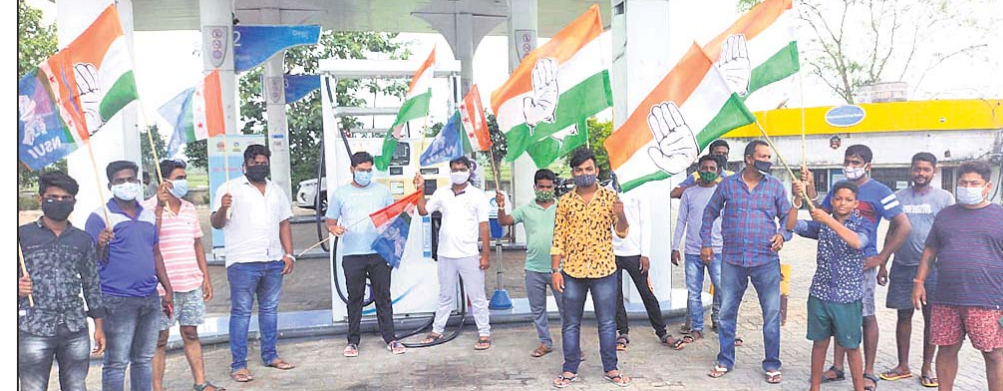
ଦିଗପହଣ୍ଡି ପୁଲବାଣୀ ଚାରି ଛକ ନିକଟ ପେଟ୍ରୋଲ ପମ୍ପ ପରିସରରେ ଯୁବ-ସ୍ତ୍ରୀ କଂଗ୍ରେସ ପକ୍ଷରୁ ବିକ୍ଷୋଭ ପ୍ରଦର୍ଶନ ।

ବ୍ରହ୍ମପୁର,ଆସିକା/ଦିଗପହଣ୍ଡି/ଭଞ୍ଜନଗର(ଡି.ଏନ.ଏ.): ପୁଲବାଣୀ ଅଫିସ୍, ୧୧୬: