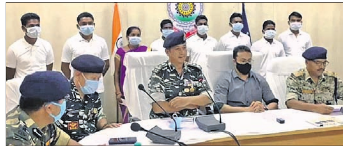
ଆତ୍ମସମର୍ପଣ କରିଥିବା ମାଓବାଦୀମାନେ ।