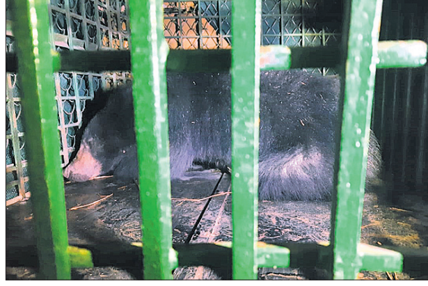
ଉଦ୍ଧାର ଭାଲୁ ।