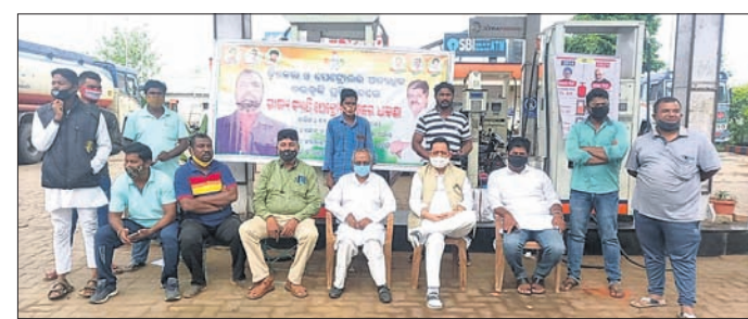
ମାଝିଗୁଡ଼ାରେ ପେଟ୍ରୋଲ ପମ୍ପରେ ଜିଲା କଂଗ୍ରେସ ପକ୍ଷରୁ ବିକ୍ଷୋଭ ପ୍ରଦର୍ଶନ କରାଯାଇଛି।

ଡୋଳ ଓ ପେଟ୍ରୋଲ ଦରବୃଦ୍ଧି ପ୍ରତିବାଦରେ ଓଡ଼ିଶା ପ୍ରଦେଶ କଂଗ୍ରେସ କମିଟି ତାଙ୍କରା କ୍ରମେ ଶୁକ୍ରବାର ବିଭିନ୍ନ ପେଟ୍ରୋଲ ପମ୍ପରେ ଧାରଣା ଦିଆଯାଇଛି।