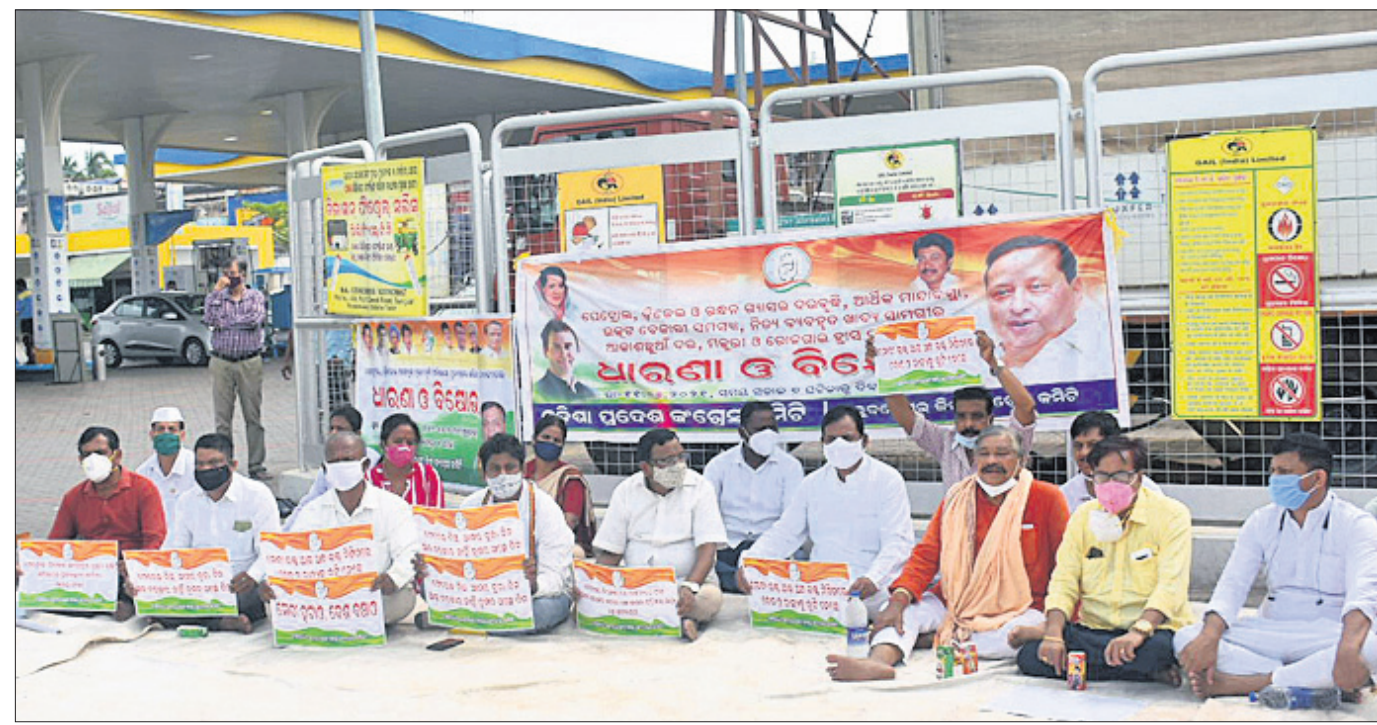
ଟିକ ଦର ବୃଦ୍ଧି ପ୍ରତିବାଦରେ ଶୁକ୍ରବାର ଭୁବନେଶ୍ୱର ସୁନି-୨ ପେଟ୍ରୋଲ ପମ୍ପ ସମ୍ମୁଖରେ କଂଗ୍ରେସ ପକ୍ଷରୁ ଧାନା ବିଆଯାଇଛି । (ରିପୋର୍ଟ: ପୃଷ୍ଠା-୩)