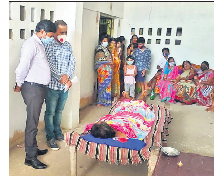
ଘଟଣାସ୍ଥଳରେ ଗୋଷ୍ଠୀ ସ୍ୱାସ୍ଥ୍ୟକେନ୍ଦ୍ର ଅଧିକାରୀ, ମାଜିଷ୍ଟ୍ରେଟ୍ ପହଞ୍ଚି ଚଢ଼ି ଧରି କରୁଛନ୍ତି।