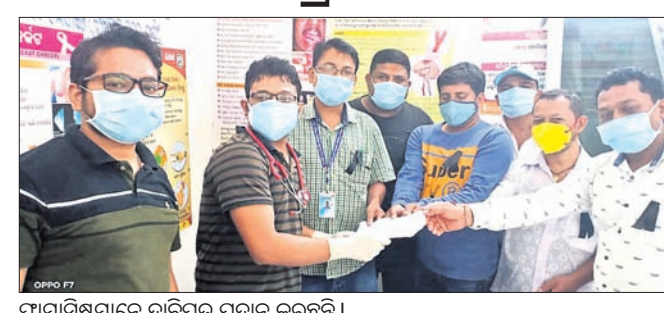
ପାର୍ମାଣିକମାନେ ଦାବିପତ୍ର ପ୍ରଦାନ କରୁଛନ୍ତି।

ରାଜ୍ୟ ସଂଘର ନିଷ୍ପତ୍ତି କ୍ରମେ ନବରଙ୍ଗପୁର ଜିଲା ଚନ୍ଦ୍ରହାସ ଗୋଷ୍ଠୀ ସାମ୍ବାଦକମାନଙ୍କୁ କାର୍ଯ୍ୟରେ ସମସ୍ତ ପାର୍ମାଣିକ କଳା ବ୍ୟାଜ ପରିଧାନ କରି ନିଜ କର୍ତ୍ତବ୍ୟ ସମ୍ପାଦନ କରୁଛନ୍ତି।