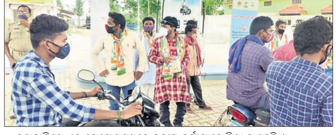
ଚନ୍ଦ୍ରହାସରେ ଏକ ପେଟ୍ରୋଲପମ୍ପରେ ଦକ୍ଷିଣ କର୍ମୀମାନେ ମିଠା ବାହୁଛନ୍ତି ।