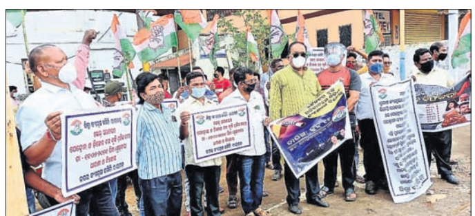
ରାୟଗଡ଼ାଠାରେ କଂଗ୍ରେସ ନେତା ଓ କର୍ମୀମାନେ ବିକ୍ଷୋଭ ପ୍ରଦର୍ଶନ କରୁଛନ୍ତି ।

ରାୟଗଡ଼ା ଅଫିସ/ଗୁଣପୁର/ବିଷମକଟକ/ ପୁନିଗୁଡ଼ା, ୧୧।୬(ଡି.ଏନ୍.ଏ.)