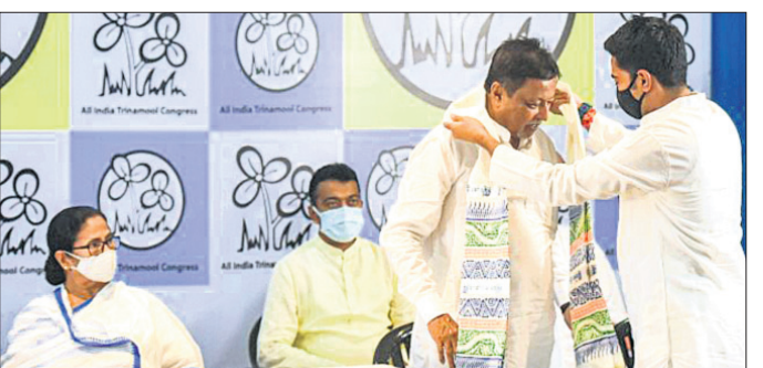
ମୁକୁଳ ରୟ ଭାଙ୍ଗିପା ଛାଡ଼ି ଟିଏମ୍‌ସିକୁ ଫେରିବା ପରେ ଅଭିନେତା ବାନାର୍ଜୀ ତାଙ୍କୁ ସ୍ୱାଗତ କରୁଛନ୍ତି। କୋଲକାତାରେ ଆୟୋଜିତ ଏହି କାର୍ଯ୍ୟକ୍ରମରେ ପଶ୍ଚିମବଙ୍ଗ ମୁଖ୍ୟମନ୍ତ୍ରୀ ମମତା ବାନାର୍ଜୀ ମଞ୍ଚାଧୀନ ଅଛନ୍ତି।