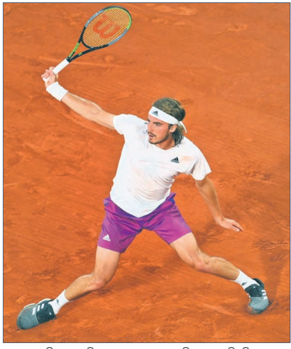
ପୁରୁଷ ସିଙ୍ଗଲ୍ ସେମିଫାଇନାଲ ଅବସରରେ ଷ୍ଟିଫାନୋସ ସିଡ଼ସିପାସ।

ମହିଳା ଡବଲ୍ ପାଇନାଲରେ ପ୍ରବେଶ କରିଛନ୍ତି ଚେରି ରିପଲ୍ଡିକ ଯୋଡ଼ି ବର୍ବରା କ୍ରେଜିକୋଭା ଏବଂ କାଟରିନା ସିନିକୋଭା। ପ୍ରଥମ ସେମିଫାଇନାଲରେ ଏହି ଯୋଡ଼ି ପୋଲାଣ୍ଡର ମାରକା ଲିନେଟି ଏବଂ କ୍ରୋଏସିଆର ବେନିତା ପେରାଙ୍କୁ ୬-୧, ୬-୨ ସେଟ୍ରେ ପରାସ୍ତ କରିଛନ୍ତି। କ୍ରେଜିକୋଭା ପାଇଁ ଚଳିତ ଟୁର୍ନାମେଣ୍ଟରେ ଦକ୍ଷ ଟାଇଟଲ ହାସଲର ସୁଯୋଗ ରହିଛି। କାରଣ ଏହି ଟେକ୍ସଟିଲିକ ମହିଳା ସିଙ୍ଗଲ୍ ପାଇନାଲରେ