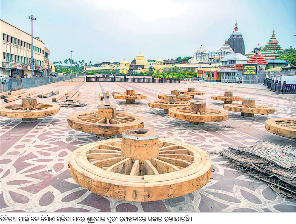
ଚିନିରଥ ପାଇଁ ଚକ ନିର୍ମାଣ ସରିବା ପରେ ଶୁକ୍ରବାର ପୁରୀ ରଥଖଳାରେ ସଜାଇ ରଖାଯାଇଛି।

ପିସିସି ସଭାପତି ନିରାଶନ ପଚନାୟକ କହିଛନ୍ତି ଯେ, ସାରା ଦେଶବାସୀ ଅତି ସଙ୍କଟରେ ପଡ଼ିଛନ୍ତି। ୧୬ ମାସ ଧରି