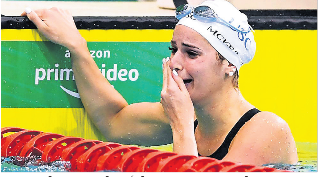
୧୦୦ ମିଟର ବ୍ୟାକ୍ସ୍ଟୋକରେ ବିଶ୍ୱରେକର୍ଡ଼ କରିବାପରେ ଅଷ୍ଟ୍ରେଲିଆ ସହରଣକାରୀ କୋଲି ମ୍ୟାକ୍‌କେଓନ ।

ଅତିଳେଉ, ୧୩।୬ (ଏପି): ଅଷ୍ଟ୍ରେଲିଆ ସହରଣକାରୀ କୋଲି ମ୍ୟାକ୍‌କେଓନ ୧୦୦ ମିଟର ବ୍ୟାକ୍ସ୍ଟୋକ ଇଭେଣ୍ଟରେ ବିଶ୍ୱ ରେକର୍ଡ଼ ଭାଙ୍ଗିଛନ୍ତି । ରବିବାର ଅନୁଷ୍ଠିତ ଅଷ୍ଟ୍ରେଲିଆ ଅଲିମ୍ପିକ ଗ୍ରାମକୁରେ ୧୯ ବର୍ଷୀୟ ମ୍ୟାକ୍‌କେଓନ ନୂଆ ରେକର୍ଡ଼ ସୃଷ୍ଟି କରିଛନ୍ତି । ସାତଥୁ ଅଷ୍ଟ୍ରେଲିଆନ ଆକୃତିକ ସେକ୍ଟରରେ ସେ ୫୭.୪୫ ସେକେଣ୍ଡ ନେଇ ଏହି ସଫଳତା ପାଇଛନ୍ତି । ପୂର୍ବରୁ ଆମେରିକାର ରେଗାନ