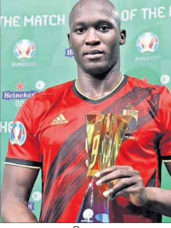
ପ୍ଲେୟର ଅଫ୍ ଦି ମ୍ୟାଚ୍ ରୋମେଲୁ ଲୁକାକୁ ।

ୟୁରୋକପ୍‌ରେ ରବିବାର ଖେଳାଯାଇଥିବା ପ୍ରଥମ ମ୍ୟାଚ୍‌ରେ ବେଲ୍‌ଜିୟମ ଘରୋଇ ରୁଷିଆକୁ ୧-୦ ଗୋଲରେ ପରାସ୍ତ କରିଛି । ଗ୍ଲାନାୟ ବ୍ରେଷ୍ଟୋଭିକ୍ ସ୍ତାଡ଼ିୟମରେ ଅନୁଷ୍ଠିତ ଏହି ମୁକାବିଲାରେ ବିଶ୍ୱର ୧ ନମ୍ବର ଦଳ ବେଲ୍‌ଜିୟମ ଦମ୍ଭାପୂର୍ଣ୍ଣ ପ୍ରଦର୍ଶନ କରି ବିଜୟ ହାସଲ କରିବା ସହ ଅଭିଯାନ ଆରମ୍ଭ କରିଛି । ତାରକା ଷ୍ଟାଇକର ରୋମେଲୁ ଲୁକାକୁ ଡବଲ୍ ଝୋର କରି ବିଜୟରେ ମୁଖ୍ୟ ଭୂମିକା ଗ୍ରହଣ କରିଥିଲେ । ଏହି ବିଜୟ ସହ କୋର୍ ରୋବେର୍ଟୋ