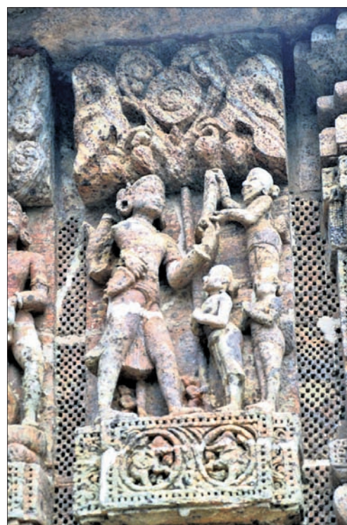
କୋଣାର୍କର ଲାଳିତ୍ୟମୟ ଲଳନା ।

୫୩୦ ଜଣ ଶିଳ୍ପୀଙ୍କର ଭେଦିଆ ସାମରିକ ବାହିନୀରେ ଯୋଗଦେବାକୁ ଯାଇଥିଲେ, ଯାହା ଆମେ ବାୟା ଚକଡ଼ା ପୋଥିକୁ ଜାଣୁଛେ । ତେଣୁକୁ ଭାଷାରେ 'କୋଣାର୍କ'ର ଅର୍ଥ ପର୍ବତ । ବିକ୍ରମକୋଣା ଗୋଟିଏ ପାର୍ବତୀୟ ଦୁର୍ଗ ଥିଲା ଏବଂ ଏହି ଦୁର୍ଗଟି ନିଶ୍ଚିତ ଭାବରେ ସେତେବେଳେ କଳିଙ୍ଗ ସାମ୍ରାଜ୍ୟ ଅନ୍ତର୍ଭୁକ୍ତ ଥିଲା । ଠିକ୍ ଯେପରି ତେଲେଙ୍ଗାନାର ନାଲଗୋଣା ଜିଲାର କୃଷ୍ଣା ନଦୀକୂଳରେ 'ଦେବରକୋଣା' ଆମର ବିକିତ ଦୁର୍ଗ ଥିଲା । ବିକ୍ରମକୋଣାକୁ ଯାଇଥିବା ଶିଳ୍ପୀମାନେ ବଙ୍ଗଳା ଆକ୍ରମଣ କାଳରେ ମୁକ୍ତବାହିନୀରେ ସାମିଲ ହୋଇ ମୁକ୍ତ କରିଥିବା ଅସମ୍ଭବ ବୁଝାନ୍ତି । ୧୨୪୩ ମସିହାରେ ଗଜପତି 'କଟାସିଂହ'ଠାରେ ମୁସଲମାନ ସୈନ୍ୟଙ୍କୁ ପରାସ୍ତ କରି ଲକ୍ଷ୍ମଣାବତୀ ଆକ୍ରମଣ