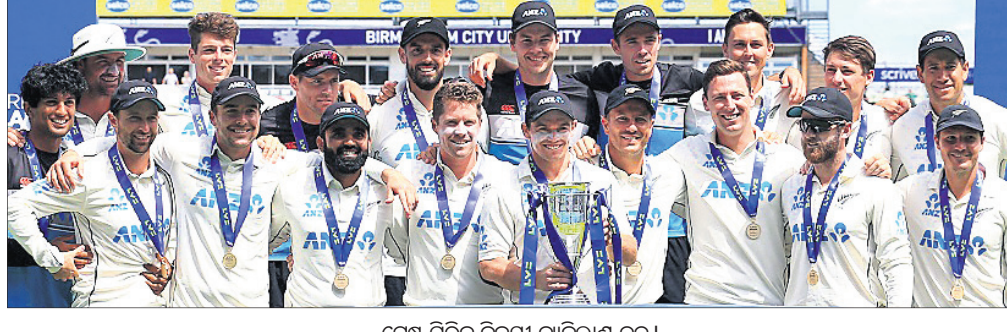
ଟେଷ୍ଟ ସିରିଜ୍ ବିଜୟୀ ନ୍ୟୁଜିଲାଣ୍ଡ ଦଳ ।

ଇଂଲଣ୍ଡ ବିପକ୍ଷ ବିତାଣ ତଥା ଅକ୍ଟିମ୍ କ୍ରିକେଟ ଟେଷ୍ଟ ମ୍ୟାଚ୍‌ରେ ଭ୍ରମଣକାରୀ ନ୍ୟୁଜିଲାଣ୍ଡ ରବିବାର ଚତୁର୍ଥ ଦିବସରେ ୮ ଉଇକେଟରେ ବିଜୟୀ ହୋଇଛି । ଫଳରେ ଦୁଇ ମ୍ୟାଚ୍ ବିଶିଷ୍ଟ ଏହି ସିରିଜ୍‌ରେ ନ୍ୟୁଜିଲାଣ୍ଡ ୧-୦ରେ ବିଜୟ ହାସଲ କରିଛି । ମ୍ୟାଚ୍‌ରେ ପ୍ରଭାବା ବୋଲି କରି ବିଜୟରେ ମୁଖ୍ୟ ଭୂମିକା ଗ୍ରହଣ କରିଥିବା ନ୍ୟୁଜିଲାଣ୍ଡ ବୁଟ ବୋଲର ମ୍ୟାଚ୍‌ହେନେରୀ ପ୍ଲେୟର ଅଫ୍ ଦି ମ୍ୟାଚ୍ ଭାବେ ପୁରସ୍କୃତ ହୋଇଛନ୍ତି । ସେହିପରି ଇଂଲଣ୍ଡ ଓପନର ରୋରି ବର୍ଡ୍‌ଓ ନ୍ୟୁଜିଲାଣ୍ଡ ଓପନର ତେଜନ କନ୍‌ସ୍‌ଟ୍ରେ ମିଳିତ ଭାବେ ପ୍ଲେୟର ଅଫ୍ ଦି ସିରିଜ୍ ବିବେଚିତ ହୋଇଛନ୍ତି । ଗ୍ଲାନାୟ ଏକ୍‌ବାସ୍‌ସନ ଗ୍ରାଉଣ୍ଡରେ ଖେଳାଯାଇଥିବା ଏହି ମୁକାବିଲା କିଛି ନ୍ୟୁଜିଲାଣ୍ଡ ବିଶ୍ୱ ଟେଷ୍ଟ ଚାମ୍ପିୟନଶିପ୍ ଫାଇନାଲ ଖେଳିବା ପୂର୍ବରୁ ତା'ର ପ୍ରସ୍ତୁତିକୁ ଆହୁରି ଜୋରଦାର କରିଛି । ଲଫ୍‌ଟିମ୍ ପ୍ରଥମ ଟେଷ୍ଟ ତ୍ର ହୋଇଥିଲା । ମଧ୍ୟ ନ୍ୟୁଜିଲାଣ୍ଡ ଆଧିପତ୍ୟ ବିସ୍ତାର କରି ଖେଳିଥିଲା । ପ୍ରଥମ ଟେଷ୍ଟର ବୃତ୍ତୀୟ ଦିନ ବର୍ଷା ଯୋଗୁ ଖେଳ ଧୋଇଯାଇଥିଲା । ଚତୁର୍ଥ ଇଂଲଣ୍ଡ ପ୍ରଥମ ଇନିଂସରେ ୧୦୧ ଓଭରରେ ୩୦୩ ରନ୍ କରି ଅକ୍‌ଆଉଟ୍ ହୋଇଥିଲା । ଜବାବରେ