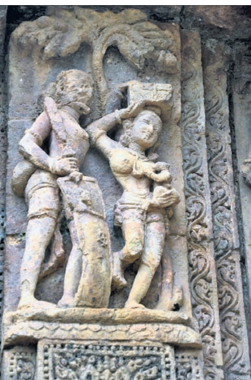
କୋଣାର୍କର ଲାଳିତ୍ୟମୟ ଲଳନା ।

କରିଥିଲେ । ସେଠାରୁ ବଙ୍ଗ ନଦୀ ଦ୍ୱାରା ଗଞ୍ଜାମ ପ୍ରାଣ ରକ୍ଷା କରିବାକୁ ଅନ୍ୟତ୍ର ପଳାୟନ କଲେ ଏବଂ ଦିଲ୍ଲୀର ସୁଲତାନଙ୍କ ସାହାଯ୍ୟ ଭିକ୍ଷା କରିଥିଲେ । ଦିଲ୍ଲୀ ସୁଲତାନ ଆଲାଉଦ୍ଦିନ ଅୟୋଧ୍ୟର