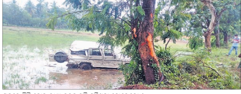
ଗଛରେ ପିଟି ହୋଇ ରାସ୍ତା ତଳକୁ ଖସି ପଡ଼ିଥିବା ବୋଲେରୋ।

ଗୋପ ଥାନା ଅନ୍ତର୍ଗତ କୁନ୍ଦୁରା ଛକ ନିକଟରେ ରବିବାର ଅପରାହ୍ନରେ ଏକ ମର୍ମହୀନ ଦୁର୍ଘଟଣା ଘଟିଛି। ରଜ ପର୍ବ ଛୁଟି ଥିବାରୁ ଏକ ପରିବାର ବୋଲେରୋ ଯୋଗେ ବୁଲିବାକୁ ଯାଉଥିବାବେଳେ ରାସ୍ତାରେ ଗାଡ଼ିଟି ଭାଗସାମ୍ୟ ହରାଇ ଏକ ଗଛରେ ପିଟି ହୋଇ ନିକଟସ୍ଥ ଏକ ଜମିକୁ ଓଲଟି ପଡ଼ିଥିଲା।