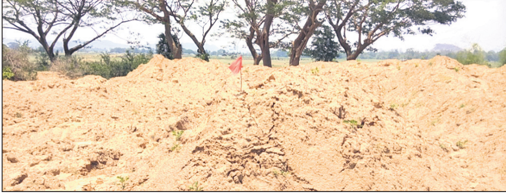
ମାଟିଗଦାରେ ନାଲି ପତାକା ଲଗାଯାଇଛି ।

ଗଞ୍ଜାମ ଜିଲା ଛତ୍ରପୁର ତହସିଲ ଆଞ୍ଚଳିକରେ ଦୀର୍ଘ ବର୍ଷ ଧରି ବେଆଇନ ଇଟା, ବାଲି, ମାଟି ବେପାର ବୁଦ୍ଧି ପାଉଛି । ସେହିପରି ପୋଟଳାମାପୁର ରାଜସ୍ୱ ନିରୀକ୍ଷକଙ୍କ କାର୍ଯ୍ୟାଳୟରୁ ୧ କି.ମି. ଦୂରରେ ବହୁ ଦିନ ଧରି ବେଆଇନ ଭାବେ ଇଟାଭାଟି ଛତ୍ର ପୁଟିଲା ପରି ବଢ଼ି ଚାଲିଛି । ସେଠାକାର ଆଞ୍ଚଳିକରେ ବେଆଇନ ଭାବେ ଗଞ୍ଜାମ ମାଟି ଡାଢ଼ି ନେଇଯାଉଛି । ଫଳରେ ଜମିର ଉର୍ଦ୍ଧରତା ହ୍ରାସ ପାଉଛି । ରାତିଅଧରେ କେହିବି ମେଶିନ ଦ୍ୱାରା ମାଟି ଡାକୁଛନ୍ତି । ଏ ସମ୍ପର୍କରେ ପଠେଟା ସହ ଏକ ଖବର ଧରିଣ୍ଡାରେ ପ୍ରକାଶ ପାଇଥିଲା ।