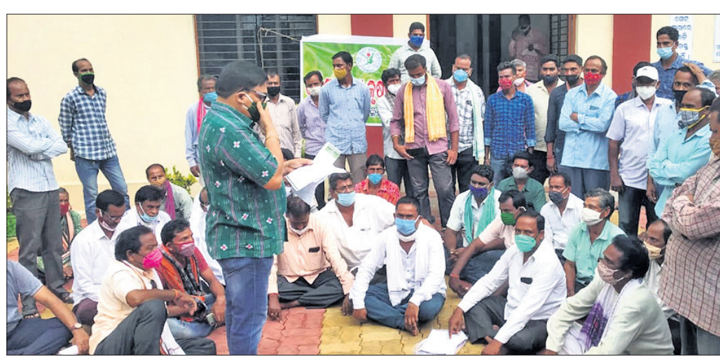
ମୁଖ୍ୟ ଯୋଗାଣ ଅଧିକାରୀଙ୍କ ଅଫିସ୍ ଆଗରେ ଗଜାଧାନ ଗଦା କରି ଚାଷୀଙ୍କ ଧାରଣା।