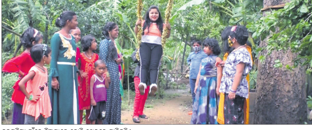
ଭୁବନେଶ୍ୱର ଗାଁରେ ଝିଅମାନେ ବୋଲି ଖେଳରେ ମାତିଛନ୍ତି।

ଧର୍ମଶାଳା, ୧୫୬(ଡି.ଏନ.ଏ.) ଧର୍ମଶାଳା ବ୍ଲକର ବିଭିନ୍ନ ଗ୍ରାମାଞ୍ଚଳରେ ରଜ ଉତ୍ସବକୁ ନିରାଡ଼ମ୍ବର ଭାବେ ପାଳନ କରାଯାଇଛି। ବୁଦ୍ଧିଜୀବୀ ଟ୍ରିପାଠା ନିଆଯାଇଛି। ଧର୍ମଶାଳା ଥାନା ଅଧିକାରୀ