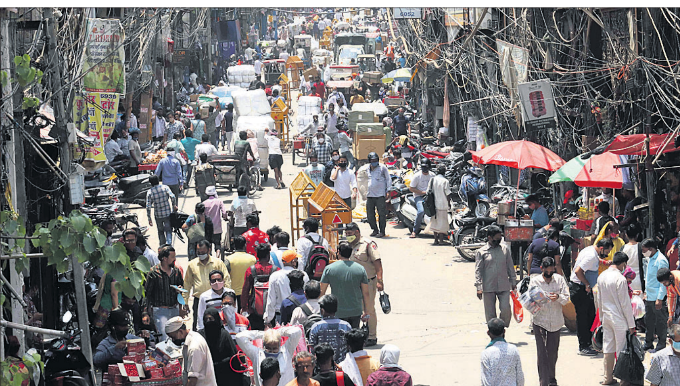
ଲକ୍ଷ୍ମୀଭଣ୍ଡର କଟକଣା କୋହଳ ହେବା ପରେ ସୋମବାର ଦୁଆଦିଲ୍ଲୀର ସଦର ବଜାର ମାର୍କେଟରେ କିଣାବିକା ଲାଗି ଲୋକଙ୍କ ଗହଳ।

ଓଡ଼ିଶାରେ ଏସ୍‌ଆଇ ଦ୍ୱାରା ସଂରକ୍ଷିତ ପ୍ରାୟ ୮୦ଟି ଐତିହ୍ୟସ୍ଥଳୀ ରହିଛି। ଏଗୁଡ଼ିକ ମଧ୍ୟରେ ପୁରୀ ଶ୍ରୀମନ୍ଦିର, କୋଣାର୍କର ପୂର୍ଣ୍ଣମନ୍ଦିର ଓ ଭୁବନେଶ୍ୱରର ଶ୍ରୀଲିଙ୍ଗରାଜ ମନ୍ଦିର ରହିଛି। ଏହା ସହିତ ୩ଟି ମ୍ୟୁଜିୟମ ଲଳିତଗିରି, ରଘୁଗିରି ଓ କୋଣାର୍କଠାରେ ରହିଛି। ଏସ୍‌ଆଇ ଭୁବନେଶ୍ୱର ସରକାର ଅଧୀନରେ ଆସୁଛି। ଐତିହ୍ୟସ୍ଥଳୀ ଖୋଲିବା ପାଇଁ କେନ୍ଦ୍ର ସରକାରଙ୍କ ନିର୍ଦ୍ଦେଶ ରହିଥିଲେ ସୁଦ୍ଧା କୋଭିଡ୍ ଗାଇଡ୍‌ଲାଇନ୍ ଅନୁସାରେ କେଉଁ ଐତିହ୍ୟସ୍ଥଳୀ ଖୋଲିବ ସେ ନେଇ ରାଜ୍ୟ ସରକାର ନିଷ୍ପତ୍ତି ନେବେ। ବିଶେଷ କରି ରାଜ୍ୟରେ ଲକ୍ଷ୍ମୀଭଣ୍ଡର ଉଦ୍‌ଘାଟନା ପରେ ଐତିହ୍ୟ ସ୍ଥଳୀଗୁଡ଼ିକୁ ପର୍ଯ୍ୟଟକଙ୍କୁ ବୁଲିବାକୁ ଅନୁମତି ମିଳିବ ବୋଲି କୁହାଯାଇଛି।