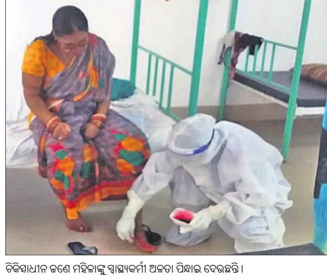
କୋଭିଡ୍ ହସ୍ପିଟାଲରେ ରୋଗୀଙ୍କ ସହ ରକ୍ତପର୍ବ ପୂଜା କରାଯାଇଛି।

ବାରିପଦା ଅଫିସ, ୧୪।୬: ମୟୂରଭଞ୍ଜ ଜିଲ୍ଲା ବାରିପଦାଠାରେ ବାଲିଗୋଳ କୋଭିଡ୍ ହସ୍ପିଟାଲ କର୍ମଚାରୀମାନେ ରୋଗୀଙ୍କ ସହ ରକ୍ତପର୍ବ ପୂଜା କରିଛନ୍ତି।