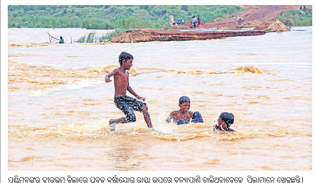
ପଶ୍ଚିମବଙ୍ଗର ବାଉଁଶ ଜିଲ୍ଲାରେ ପ୍ରବଳ ବର୍ଷାଯୋଗୁଁ ରାସ୍ତା ଉପରେ ବନ୍ୟାପାଣି ଚାଲିଥିବାବେଳେ ପିଲାମାନେ ଖେଳୁଛନ୍ତି।

ନୂଆଦିଲ୍ଲୀ, ୧୫୬: ଆସପାଠକ ହେବାକୁ ଥିବା ଗୁଜରାଟ ବିଧାନସଭା ନିର୍ବାଚନରେ ଆମ୍ ଆଦମୀ ପାର୍ଟି (ଏଏପି) ସବୁ ଆସନରେ ପ୍ରାର୍ଥୀ ଦେବ ବୋଲି ଘୋଷଣା କରିଛନ୍ତି।