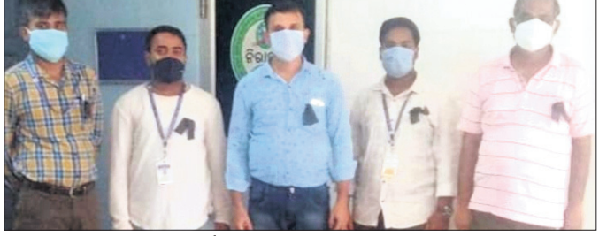
ଜଗନ୍ନାଥପ୍ରସାଦ ଅଞ୍ଚଳରେ ଫାର୍ମାସିଷ୍ଟଙ୍କ କଳା ବ୍ୟାଜ୍ ପରିଧାନ ।

ଖଜୁରିପଡ଼ା/ବଳସକୁମ୍ଭା/ ଜଗନ୍ନାଥପ୍ରସାଦ, ୧୪୬(ଡି.ଏନ.ଏ.)