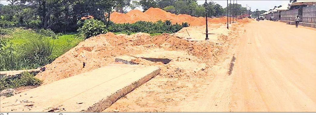
ନିର୍ମାଣାଧୀନ ସରକାରୀ ଜମି।

ଯାଜପୁରରେ ହେବାକୁ ଯାଉଛି ଆର୍ଡ଼ିନିଷ୍ଟେଟିଭ୍ ଏକ୍ସପ୍ରେସ୍ ବା ମିନି ସଟିବାଳୟ। ଏଥିପାଇଁ ୧୨୨.୦୯ କୋଟି ଟଙ୍କା ଖର୍ଚ୍ଚ କରି ୩୮.୮୬୬ ଏକର ବେସରକାରୀ ଜମି ଅଧିଗ୍ରହଣ କରାଯାଇଛି। ଅନ୍ୟପକ୍ଷରେ କୋଠା ନିର୍ମାଣ ନିମନ୍ତେ ୭୧.୩୩ କୋଟି ଟଙ୍କା ହିସାବରେ ପ୍ରକଳ୍ପ ପାଇଁ ସମୁଦାୟ ୧୯୩.୪୨ କୋଟି ଟଙ୍କା ଅଟକଳ ହୋଇଛି। ଅର୍ଥାତ୍ କୋଠା ନିର୍ମାଣଠାରୁ ବେସରକାରୀ ଜମି ପାଇଁ ଖର୍ଚ୍ଚ ଦେଖିବାକୁ ଅଧିକାଂଶ ଲିମ୍ବାର ବିଭିନ୍ନ ଗ୍ଲାନରେ ବିଶେଷକରି ୨୦ ଓ ୧୬ ନମ୍ବର ଜାତୀୟ ରାଜପଥ କଡ଼ରେ ବହୁ ସରକାରୀ ଜମି ଥିବାବେଳେ ସରକାର ପ୍ରକଳ୍ପ ଜମି କିଣୁଛନ୍ତି। ଅର୍ଥାତ୍ କୋଠା ନିର୍ମାଣ ଓ ବିକାଶ ନେଇ ପ୍ରଶ୍ନାବଳୀ ସୃଷ୍ଟି ହେଉଛି। କେବଳ ସେତିକି ନୁହେଁ, ଜଳ ନିଷ୍କାସନ ଓ ଜଳାଶୟ ଜମିରେ କେତେକାଂଶ ନିର୍ମାଣ ହେଉଥିବାରୁ ଯାଜପୁର ସହରର ଅଧିକାଂଶ ଗ୍ଲାନ ଜଳମଗ୍ନ ହେବ ଏବଂ ବିକାଶ ନାମରେ ସହରବାସୀଙ୍କୁ ଜଳଯୋଗରେ ରଖାଯିବ ବୋଲି ବୁଦ୍ଧିଜୀବୀ ମହଲରେ ଆଶଙ୍କା ପ୍ରକାଶ ପାଇଛି।