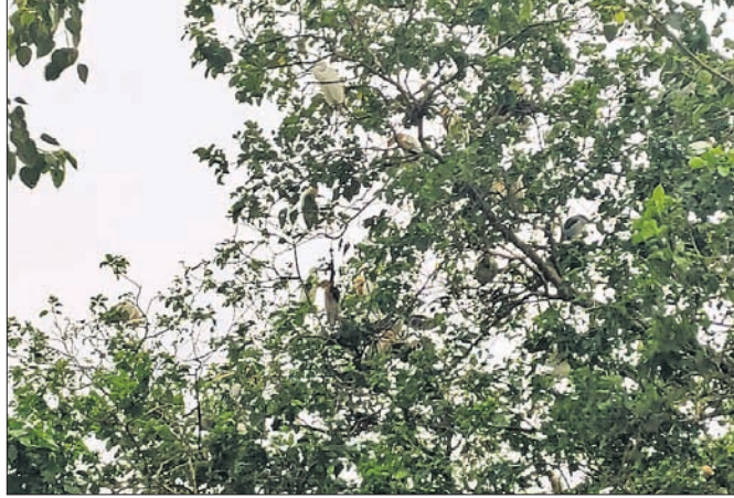
ଗଛରେ ବସା ବାହିଥିବା ବିଦେଶୀ ପକ୍ଷୀ।