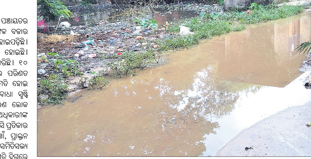
ରାସ୍ତାରେ ବର୍ଷାପାଣି ଜମି ରହିଛି।