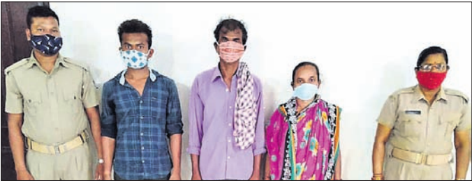
ଗିରଫ ୩ ଅଭିଯୁକ୍ତ ।