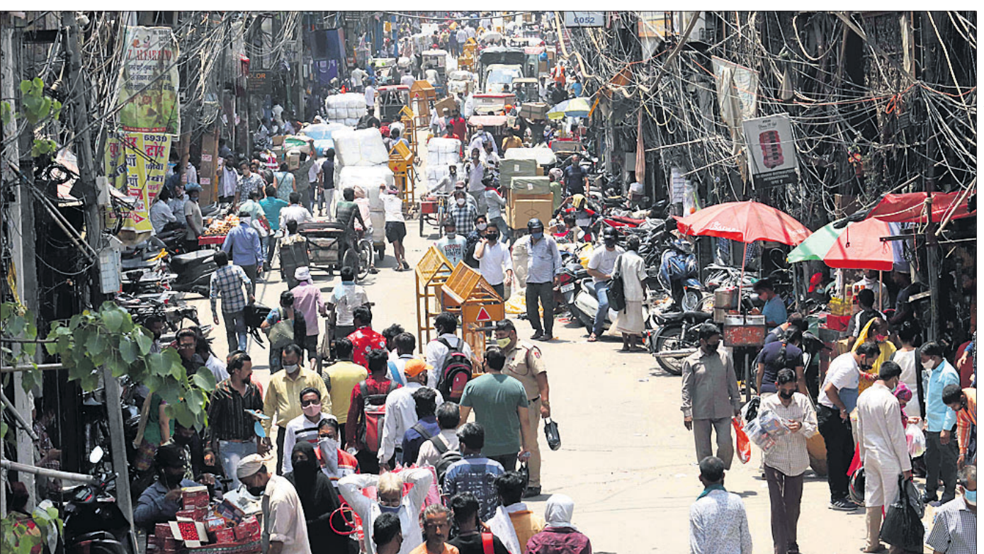
ଲକ୍ଷ୍ମୀରାଜ କଟକଣା କୋହଳ ହେବା ପରେ ଯୋଗଦାନ ଦୁଆଦିଲ୍ଲୀର ସଦର ବଜାର ମାର୍କେଟରେ କିଣାବିକା ଲାଗି ଲୋକଙ୍କ ଗହଳି।

ଓଡ଼ିଶାରେ ଏସ୍‌ଆଇ ଦ୍ଵାରା ସଂରକ୍ଷିତ ପ୍ରାୟ ୮୦ଟି ଐତିହ୍ୟସ୍ଥଳୀ ରହିଛି। ଏଗୁଡ଼ିକ ମଧ୍ୟରେ ପୁରୀ ଶ୍ରୀମନ୍ଦିର, କୋଣାର୍କର ସୂର୍ଯ୍ୟମନ୍ଦିର ଓ ଭୁବନେଶ୍ଵରର ଶ୍ରୀଲିଙ୍ଗରାଜ ମନ୍ଦିର ରହିଛି। ଏହା ସହିତ ୩ଟି ମୁଖ୍ୟମନ୍ତ୍ରୀ ଲଳିତଗିରି, ରଢ଼ଗିରି ଓ କୋଣାର୍କଠାରେ ରହିଛି। ଏସ୍‌ଆଇ ଐତିହ୍ୟସ୍ଥଳୀ ଓ ମୁଖ୍ୟମନ୍ତ୍ରୀ ଏସ୍‌ଆଇ ଭୁବନେଶ୍ଵର ସରକାର ଅଧୀନରେ ଆସୁଛି। ଐତିହ୍ୟସ୍ଥଳୀ ଖୋଲିବା ପାଇଁ କେନ୍ଦ୍ର ସରକାରଙ୍କ ନିର୍ଦ୍ଦେଶ ରହିଥିଲେ ସୁଦ୍ଧା କୋଭିଡ୍ ଗାଇଡ୍‌ଲାଇନ୍ ଅନୁସାରେ କେଉଁ ଐତିହ୍ୟସ୍ଥଳୀ ଖୋଲିବ ସେ ନେଇ ରାଜ୍ୟ ସରକାର ନିଷ୍ପତ୍ତି ନେବେ। ବିଶେଷ କରି ରାଜ୍ୟରେ ଲକ୍ଷ୍ମୀରାଜ ଉଠିବା ପରେ ଐତିହ୍ୟ ସ୍ଥଳୀଗୁଡ଼ିକ ପର୍ଯ୍ୟଟକଙ୍କୁ ବୁଲିବାକୁ ଅନୁମତି ମିଳିବ ବୋଲି କୁହାଯାଇଛି।