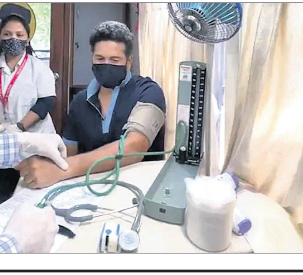
ତେନ୍ଦୁଲକର ରକ୍ତଦାନ କଲେ।

ଏଥି ସହିତ ଚେଷ୍ଟା ଚାମ୍ପିୟନଶିପ୍ ଗଦା ମଧ୍ୟ ଦିଆଯିବ ବୋଲି ଅନ୍ତର୍ଜାତୀୟ କ୍ରିକେଟ ପରିଷଦ (ଆଇସିସି) ପକ୍ଷରୁ ଘୋଷଣା କରାଯାଇଛି।