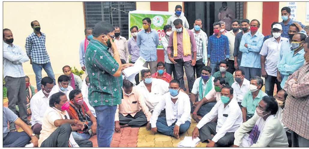
ମୁଖ୍ୟ ଯୋଗାଣ ଅଧିକାରୀଙ୍କୁ ଅଧିକାରୀ ଗଜା ଧାନ ଗଦା କରି ଚାଷୀଙ୍କ ଧାରଣା।

କଟକର ଅଧିକାରୀଙ୍କୁ ଘେରାଇ ଧାନ ବିକ୍ରି ସମୟା ଅସମାହିତ ହେବାରୁ ଚାଷୀମାନେ ଗଜା ଧାନ ଗଦା କରି ପ୍ରତିବାଦ କରିଛନ୍ତି। ଏହା ପରେ ଗଜା ଧାନ ଗଦା କରିବା ପାଇଁ ଚାଷୀମାନଙ୍କୁ ଉପାଦେୟ ପଦକ୍ଷେପ ଗ୍ରହଣ କରିବାକୁ ଅନୁରୋଧ କରାଯାଇଛି।