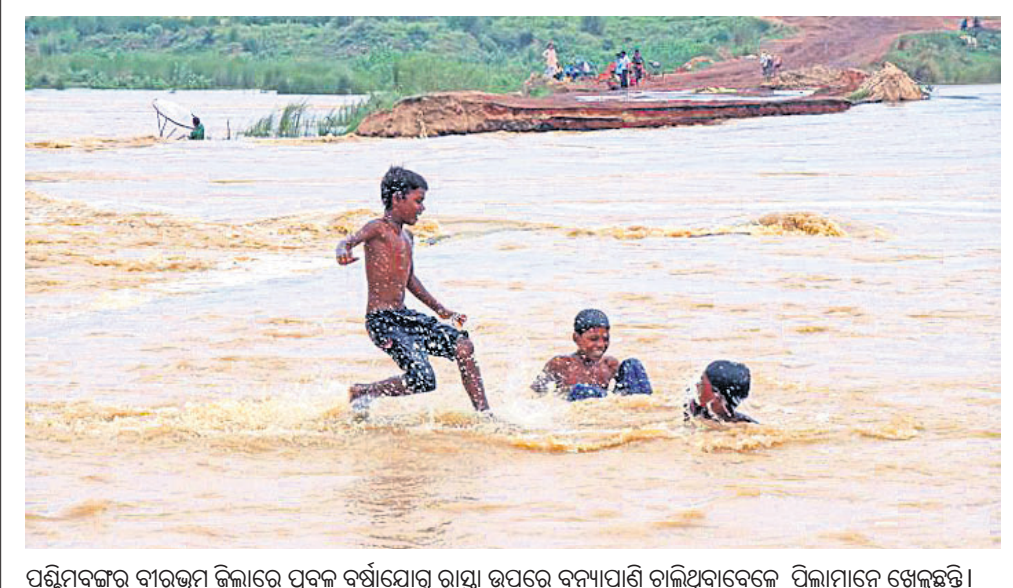
ପଶ୍ଚିମବଙ୍ଗର ବାରିଭୁମ୍ ଜିଲ୍ଲାରେ ପ୍ରବଳ ବର୍ଷାଯୋଗୁଁ ରାସ୍ତା ଉପରେ ବନ୍ୟାପାଣି ଚାଲିଥିବାବେଳେ ପିଲାମାନେ ଖେଳୁଛନ୍ତି।

ନୂଆଦିଲ୍ଲୀ, ୧୫୬: ଆସପାଠକ ହେବାକୁ ଥିବା ଗୁଜରାଟ ବିଧାନସଭା ନିର୍ବାଚନରେ ଆମ୍ ଆଦମୀ ପାର୍ଟି (ଏଏପି) ସବୁ ଆସନରେ ପ୍ରାର୍ଥୀ ଦେବ ବୋଲି ଘୋଷଣା କରିଛନ୍ତି।