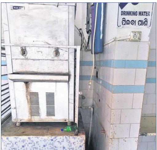
ସ୍ୱାସ୍ଥ୍ୟକେନ୍ଦ୍ର ପରିସରରେ ଲାଗିଥିବା ଓଡ଼ିଆ ଫିଲ୍ଟର ।

୧୦ଟି ଡାକ୍ତର ପଦବୀ ମଧ୍ୟରୁ ଚୋଡ଼ିସିନ୍, ସର୍ଜି, ପେଡ଼ିଆଟ୍ରିକ ଭଳି ବହୁ ଗୁରୁତ୍ୱପୂର୍ଣ୍ଣ ବିଭାଗରେ ଡାକ୍ତର ନାହାନ୍ତି। ସେହିପରି ୧୧ ଖୁପଦର୍ଯ୍ୟପଦବୀ ମଧ୍ୟରୁ ୩ଟି ଏବଂ ୪ ସହାୟକ (ଆଟେଣ୍ଡାଣ୍ଟ) ସମେତ ଗୋଟିଏ ପାର୍ମିସିସ୍ ପଦବୀ ଖାଲିପଡ଼ିଛି। ଫଳରେ ଉପଯୁକ୍ତ