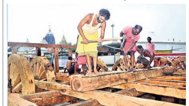
ନନ୍ଦିଘୋଷ ରଥରେ ଗରବରା କାଠ ଲଗାଯାଇଛି ।

ପୁରୀ ଅଫିସ୍, ୧୫୬: ରଥଖଳାରେ ସୋମବାର ତିନି ରଥର ପଞ୍ଚଦଶାରେ କଣ୍ଠାବାଡ଼ିଆ କାର୍ଯ୍ୟ ଶେଷ ହୋଇଛି। ପଞ୍ଚଦଶା କଣ୍ଠା ବାଡ଼ିଆ ପରେ ଦଣ୍ଡାଭୁକ୍ତିକର ମଧ୍ୟଭାଗର ବୁଲପଟେ ୨ଟି ଗରବରା ପିଟି କରାଯାଇଛି। ଗରବରା ପିଟି ପୂର୍ବରୁ ଦଣ୍ଡା ସହ ଗରବରା ସଂଯୋଗ ଘ୍ରାଣରେ ବିଶ୍ୱ କରାଯିବା ପରେ କମାରସେବକମାନେ କଣ୍ଠା ବାଡ଼ିକ ସେଟ୍ କରିଥିଲେ। ଏହାପରେ ତିନି ରଥର ବୁଲଟି ଲେଖାଏ ପୋଲ ଗଢ଼ା ପିଟି ହୋଇ ଚାରି ନାହାଳା ଉଠିବ। ତାଳଧୁଳ ଓ ନନ୍ଦିଘୋଷ ରଥର ୨ଟି ଲେଖାଏ ପୋଲ ଗଢ଼ା ଚଳିତ ଶେଷ ହୋଇଛି। ମଙ୍ଗଳବାର ଗଢ଼ା ପିଟି ଆରମ୍ଭ ହେବ। ତିନି ରଥର ପ୍ରଥମ ଭୁଲ୍ ପାଇଁ ୪ଟି ପୋଟଳ ଖସି ଯାଇ ହେବା ସହ ୭ଟି ଯୋଖା ଖୋଦେଇ ସରିଛି। ତିନି ରଥର ୨ଟି ଲେଖାଏ ପୋଟଳ ପାରେଇ, ୭ଟି ଲେଖାଏ ଯୋଖା ଓ ଗୋଟିଏ ଲେଖାଏ ଗାର ପରିଛା ଶେଷ ହୋଇଛି। ପ୍ରତି ରଥ ପାଇଁ ୮ଟି ନାଟଗୋଡ଼ୁ ୪ଟି ଲେଖାଏ ନାଟଗୋଡ଼ୁରେ ରୂପ ଖୋଦେଇ ଶେଷ ପର୍ଯ୍ୟାୟରେ ପହଞ୍ଚିଛି। ଓଖା ଓ କମାର ସେବକମାନେ ରଥ ଉପରି ଭାଗ ପାଇଁ କଣ୍ଠା ନିର୍ମାଣ କରୁଛନ୍ତି। ସୋମବାର ରଥଖଳାରେ ୧୮୮ ଜଣ ସେବକ ନିଯୋଜିତ ଥିଲେ।