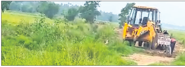
କେସିବି ସାହାଯ୍ୟରେ କାର୍ଯ୍ୟ ଚାଲିଛି ।

ପୁରୀ ଜିଲ୍ଲା ବ୍ରହ୍ମଚରି ବ୍ଲକ୍‌ରେ ମହାପ୍ରାଣୀ କାତୀୟ ଗ୍ରାମୀଣ ନିରୀକ୍ଷିତ କର୍ମନିଯୁକ୍ତି ଯୋଜନା (ଏମ୍‌ଜିଏନ୍‌ଆର୍‌ଇଜିଏସ୍)ର ଅର୍ଥ ଆୟ୍‌ସାତ୍ ପାଇଁ ମସୁଧା ଚାଲିଥିବା ଅଭିଯୋଗ ହୋଇଛି। ଶ୍ରମିକମାନଙ୍କୁ ଗୋଟିଏ ବର୍ଷରେ ୧୦୦ ଦିନର କାମ ଯୋଗାଇଦେବାକୁ ଏମ୍‌ଜିଏନ୍‌ଆର୍‌ଇଜିଏସ୍ କାର୍ଯ୍ୟକାରୀ ହେଉଛି। ତେବେ ଏହି ଯୋଜନାରେ ବ୍ରହ୍ମଚରି ବ୍ଲକ୍ ଅଧୀନ ଆୟପଡ଼ା ପଞ୍ଚାୟତ କାଳୁଡ଼ିଗାଡ଼ିଆ ଗ୍ରାମର ଶ୍ରମିକମାନଙ୍କୁ କାର୍ଯ୍ୟରେ ନିଯୋଜିତ କରାଯିବା ପରିବର୍ତ୍ତେ ମେଣିନ ସାହାଯ୍ୟରେ କାମ କରାଯାଉଛି। ଗ୍ରାମ ଯେଉଁବନ୍ଧ ଉଲଟାକରଣ ପାଇଁ ଏମ୍‌ଜିଏନ୍‌ଆର୍‌ଇଜିଏସ୍‌ରେ ୨୪୧୩୦୦୨୦୦୩/ ଆର୍‌ସି/ ୧୦୪୭୫୯୮୯ ରେ ଅନୁକ୍ରମ ହୋଇ କାର୍ଯ୍ୟଦେଖି ମିଳିଛି। ଏପରିକି, ଏହି ଗ୍ରାମରେ ବହୁ ଶ୍ରମିକ ରହିଛନ୍ତି। ମାତ୍ର ସେମାନଙ୍କୁ କାର୍ଯ୍ୟରେ ନିଯୋଜିତ କରାଯିବା ବଦଳରେ