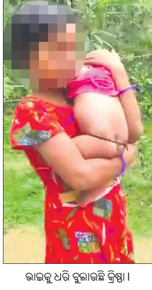
ଭାଇକୁ ଧରି ବୁଲାଇଛି କ୍ରିଷ୍ଣା।

କ୍ରିଷ୍ଣା ଆଖି ଛଳ ଛଳ କରି ଲୁହ ଗଡ଼ାଉଛି। ଦେହମାସର ଭାଇ କ୍ରିଷ୍ଣାଙ୍କୁ କାନ୍ଧି ବେଳେ ସେ ତା' ଭାଇ ପାଇଁ ବଡ଼ମା' ଓ ବଡ଼ବାପାଙ୍କୁ ଠାରୁ ଗାଳି କ୍ରିଷ୍ଣାକୁ ଖୁଆଇଛି। ଭାଇକୁ କାନ୍ଧରେ ପକାଇ ନାନା ବାସ୍ତା ଗାତ ଗାଳ ଶୁଣାଉଛି। ବଡ଼ମା' ଓ ବଡ଼ବାପାଙ୍କ ପାଖରେ ରହୁଥିଲେ ମଧ୍ୟ ମା'ବାପାଙ୍କ କଥା ମନେ ପକାଇ ଗୁମୁରି ଗୁମୁରି କାନ୍ଦୁଛି। ବଡ଼ମା' ଓ ବଡ଼ବାପା ଅଭାବ ଅନାଟନ ମଧ୍ୟରେ ଦିନ କାନ୍ଦୁଥିବା ବେଳେ କ୍ରିଷ୍ଣା ପାଠ ପଢ଼ିବାକୁ ଭଲ ପ୍ରକାଶ କରିଛି। ନିଜେ ପାଠ ପଢ଼ି ଭାଇକୁ ପାଠ ପଢ଼ାଇବା ବୋଲି ସେ କାନ୍ଦି କାନ୍ଦି କହୁଛି।