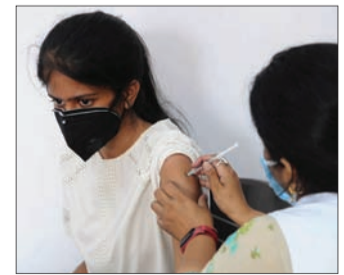
ପାଇଁ ସ୍ୱତନ୍ତ୍ର ଟିକାକରଣ ବ୍ୟବସ୍ଥା କରିବାକୁ ବାରମ୍ବାର ଦାବି ଆସୁଥିଲେ ମଧ୍ୟ ଏନେଇ ଅନୁମୋଦିତ ଘରୋଇ ହସ୍ପିଟାଲରେ ଟିକାକରଣକୁ ନେଇ ଅନେକ ସମୟରେ ସମସ୍ୟା ଦେଖିବାକୁ ମିଳିଛି। ମୁର୍ଦ୍ଦୁକ୍ତି କରି ହୋଇ ନାହିଁ। ସାହିରେ କରାଯାଇଥିବା ଟିକାକେନ୍ଦ୍ରରେ ଅନ୍ୟ ଅଞ୍ଚଳର ଲୋକ ଆସି ଟିକା ନେଉଛନ୍ତି। ହେଲେ ସ୍ଥାନୀୟ

ସ୍ୱତନ୍ତ୍ର ବ୍ୟବସ୍ଥା, ସତେଜନତା ଭୁଲିଯାଇଛି ଟିକା ନେଇଛନ୍ତି। ସେମାନଙ୍କ ମଧ୍ୟରୁ ସହରାଞ୍ଚଳରେ ୩ ଲକ୍ଷ ୪୮ ହଜାର ୮୭୪ ତୋଟ୍ ପ୍ରଦାନ କରାଯାଇଥିବାବେଳେ ଗ୍ରାମାଞ୍ଚଳରେ ୩ ଲକ୍ଷ ୨୫ ହଜାର ୩୩୫ ଟିକା ନେଇଛନ୍ତି। ତେବେ ପ୍ରଥମ ତୋଟ୍ ୫ ଲକ୍ଷ ୭୩ ହଜାର ୮୧ ଜଣ ନେଇଥିବାବେଳେ ଦ୍ୱିତୀୟ ତୋଟ୍ ମାତ୍ର ୧ ଲକ୍ଷ ୮୨୭ ଜଣ ନେଇଛନ୍ତି। ଲୋକମାନେ ଦ୍ୱିତୀୟ ତୋଟ୍ ନେବାପାଇଁ ଟିକାକେନ୍ଦ୍ର ବୁଲିବୁଲି ନିୟାନ୍ତ୍ର ହେଉଥିଲେ ମଧ୍ୟ ଟିକା ପାଇପାରୁ ନାହାନ୍ତି। ସେହିଭଳି ଗତ ୯ ତାରିଖରୁ ବିଦେଶ ଯିବାକୁ ଥିବା ଛାତ୍ରଛାତ୍ରୀଙ୍କ ପାଇଁ ସିଏମ୍‌ସି ପକ୍ଷରୁ ସ୍ୱତନ୍ତ୍ର ବ୍ୟବସ୍ଥା କରାଯାଇଥିବା କୁହାଯାଉଥିଲେ ମଧ୍ୟ ଏଯାବତ୍ କେତେଜଣ ଟିକା ନେଇଣି ସେନେଇ କୌଣସି ତଥ୍ୟ ଦେଇପାରିବେ ନାହିଁ ବୋଲି ସିଏମ୍‌ସିର ମୁଖ୍ୟ କମିଶନର ସୂଚନା ସରକାର କହିଛନ୍ତି। ଏପରି କି ସିଏମ୍‌ସି ପକ୍ଷରୁ ସହରରେ ଲୋକଙ୍କୁ ଟିକା ଦେବା ପାଇଁ କି କି ସ୍ୱତନ୍ତ୍ର ବ୍ୟବସ୍ଥା କରାଯାଇଛି, ସେନେଇ କୌଣସି ସ୍ପଷ୍ଟ ସୂଚନା ମିଳୁନାହିଁ। ବରିଷ୍ଠ ନାଗରିକଙ୍କ