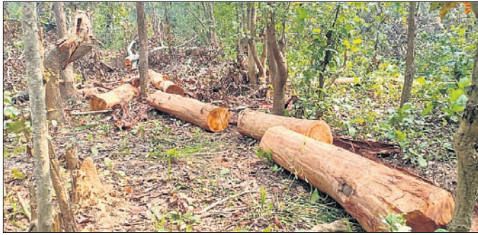
ସମଲପୁର ସଦର ରେଞ୍ଜ ଅଞ୍ଚଳରେ କଟାଯାଇଥିବା ଗଛ।

ସମଲପୁର ବନଖଣ୍ଡରେ ରକ୍ଷିତ ଜମିରୁ ବେଆଇନ ଭାବେ ଗଛକଟା ଚାଲିଛି। ଆବେଦନ କରିଥିବା ଜମିର ଦାବିକ କିସମ ଓ ହାଲ୍ କିସମ ମେଳ ଖାଉ ନ ଥିଲେ ମଧ୍ୟ ବେଆଇନ ଭାବେ ଅନୁମତି ଦିଆଯାଇଛି। ଦାବିକ ଓ ହାଲ୍ କିସମ ସମାନ ହେଲେ ବିଭିନ୍ନ ବିଭାଗ ଚର୍ଚ୍ଚା କରି ଡିଏଫଓ ଗଛ କାଟିବାକୁ ଅନୁମତି ଦେବା ନିୟମ ରହିଛି। ହେଲେ ଏଠାରେ ତାହାର ବ୍ୟତିକ୍ରମ ଦେଖାଦେଇଛି। ୪ବର୍ଷ ଭିତରେ ଏହି ବନଖଣ୍ଡରେ ପ୍ରାୟ ୧ ଲକ୍ଷରୁ ଊର୍ଦ୍ଧ୍ଵ ଗଛ କାଟିବା ପାଇଁ ଅନୁମତି ଦିଆଯାଇଛି, ଯାହା ୧୦ ଲକ୍ଷ ସିଏଫ୍‌ଟିରୁ ଅଧିକ ହେବ ବୋଲି ଅଭିଯୋଗ ହେଉଛି। ମାଟିଆମାନେ ଗଛ କାଟିବା ପାଇଁ ପ୍ରଥମେ ରକ୍ଷିତ ଜମି ମାଲିକଙ୍କ ନାମରେ ଅନୁମତି ନେଉଛନ୍ତି। ପରେ ସେମାନେ ଅନୁମତି ପାଇଥିବା ଗଛ କାଟିବା ସହ ଜମି ନିକଟ ଜଙ୍ଗଲରେ ଥିବା ମୂଲ୍ୟବାନ ଗଛ କାଟି ନେଉଛନ୍ତି। ଏଥିରେ ପ୍ରାୟ ୧୦ କୋଟି ଟଙ୍କାର କାରବାର ହୋଇଥିବା ଅଭିଯୋଗ ହେଉଛି। ଏଭଳି ଲକ୍ଷାଧିକ ଗଛ ବିହାର, ଝାଡ଼ଖଣ୍ଡ, କଳିକତା, ଛତିଶଗଡ଼, ମଧ୍ୟପ୍ରଦେଶ ସମେତ ରାଜ୍ୟରେକଳା, ଭଦ୍ରକ, କଟକ, ଭୁବନେଶ୍ଵର, ଅନୁଗୋଳ ଆଦି ଜିଲ୍ଲାକୁ ଚୋରା ଚାଲାଣ ହେଉଛି। ଏଥିରେ ଝାଡ଼ଖଣ୍ଡ ଓ ରାଜରକେଲାର