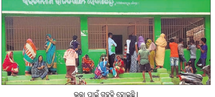
ଭଉ ପାଇଁ ବଣ୍ଟନ ହୋଇଛି।

ମହିଳାଙ୍କ କୌଣସି ପରିଚୟ ମିଳିପାରି ନ ଥିଲା। ତେବେ ଏହି ମୃତ୍ୟୁକୁ ନେଇ କେହି ଆନାରେ ଅଭିଯୋଗ ନ କରିବାକୁ ପୋଲିସ ଅପମୃତ୍ୟୁ ମାମଲା ରୁକ୍ କରିଥିଲା। କିନ୍ତୁ ବ୍ୟବହାର ରିପୋର୍ଟରେ ହତ୍ୟା ସ୍ଵଭାବରୁ ପୋଲିସ ଘଟଣାରେ ଅଡ଼େଇ ବର୍ଷ ପରେ ଅର୍ଥାତ୍ ୨୦୧୫ ଜାନୁଆରୀ ୧୧ରେ ଏକ ହତ୍ୟା ମାମଲା (ନଂ. ୧୨/୧୫) ରୁକ୍ କରିଥିଲା। ହେଲେ ତଦନ୍ତରେ ଶିଳ୍ପକତା ଯୋଗୁ ମହିଳାଙ୍କ ପରିଚୟ ଓ ରହସ୍ୟ ଉନ୍ନେତ ହୋଇପାରି ନ ଥିଲା। ଫଳରେ କ୍ରମଶଃ ହତ୍ୟା ମାମଲାଟି ଫାଇଲ୍ ଭିତରେ ବନ୍ଦ ହୋଇଯାଇଥିଲା। ନିକଟରେ ଅନୁଷ୍ଠିତ ସମାକ୍ଷା ବୈଠକରେ ତିସପି ଉପାଶିକର ଦାସଙ୍କ ନଜରକୁ ଏହି ମାମଲା ଆସିବା ପରେ ଏହାର ପୁନଃ ତଦନ୍ତ ପାଇଁ ସେ ନିର୍ଦ୍ଦେଶ ଦେଇଥିଲେ। ତାଙ୍କ ନିର୍ଦ୍ଦେଶ ଆଧାରରେ ଚନ୍ଦ୍ରକା ଥାନା ଅଧିକାରୀଙ୍କ ନେତୃତ୍ଵରେ ଏକ ସ୍ଵତନ୍ତ୍ର ଟିମ୍ ଗଠନ କରାଯାଇ ପୋଷ୍ଟର ମରାଯାଇଛି। ମହିଳାଙ୍କ ସମ୍ପର୍କରେ କୌଣସି ଖବର ପାଇଲେ ଥାନା ଅଧିକାରୀଙ୍କ ମୋବାଇଲ ନଂ. ୮୨୮୦୩୩୮୩୨୩୩, ୯୪୩୮୮୪୯୯୯୯ ଓ ଜୋର୍ ସଫ୍ଟିକୃ ୮୨୮୦୩୩୮୨୯୨ ନଂରେ ସୂଚନା ଦେବାକୁ ପୋଲିସ ପକ୍ଷରୁ ଅନୁରୋଧ କରାଯାଇଛି।