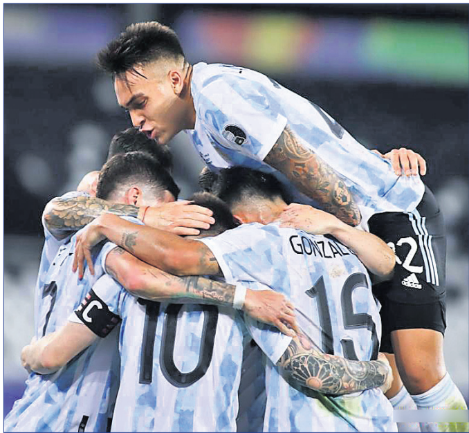
ଚିଲି ବିପକ୍ଷ ମ୍ୟାଚ୍ରେ ଖୁସି ପୂର୍ଣ୍ଣରେ ଆର୍ଜେଣ୍ଟିନା ଦଳର ଖେଳାଳିମାନେ ।

ଦକ୍ଷିଣ ଆମେରିକାର ସର୍ବବୃହତ୍ ପୁରୁଷ ଫୁଟବଲ ଟୁର୍ନାମେଣ୍ଟ କୋପା ଆମେରିକାରେ ଲିଓନେଲ ମେସିଙ୍କ ଆର୍ଜେଣ୍ଟିନା ଟ୍ରାଉ ଅଭିଯାନ ଆରମ୍ଭ କରିଛି । ମେସିଙ୍କ ଜବରଦସ୍ତ ପ୍ରଦର୍ଶନ ସତ୍ତ୍ୱେ ଗ୍ରୁପ୍ ବିରେ ଆର୍ଜେଣ୍ଟିନା ଚିଲି ବିପକ୍ଷ ଏହି ମ୍ୟାଚ୍ ତ୍ର ରଖିଛି । ୩୩ତମ ମିନିଟ୍ରେ ମେସିଙ୍କ ଫ୍ରିକିକ୍ କରିଆରେ ଆର୍ଜେଣ୍ଟିନା ପ୍ରଥମ ଗୋଲ ଖୋର କରିଥିଲା । ଗ୍ଲାନାୟ ନିଲଟୋନ ସାନ୍ତୋସ ସ୍ତ୍ରାୟମ୍ରେ ଅନୁଷ୍ଠିତ ଏହି ସଂଘର୍ଷପୂର୍ଣ୍ଣ ମ୍ୟାଚ୍ରେ କିରଦତ୍ତା ପୁରୁଷଲ ଡିଏଗୋ ମାରାଡୋନାଙ୍କୁ ଶ୍ରଦ୍ଧାଞ୍ଜଳି ଛାପନ କରାଯାଇଥିଲା । ମାରାଡୋନା ଗତ ନଭେମ୍ବରରେ ମାତ୍ର ୬୦ ବର୍ଷ ବୟସରେ ପ୍ରାଣ ହରାଇଥିଲେ ।