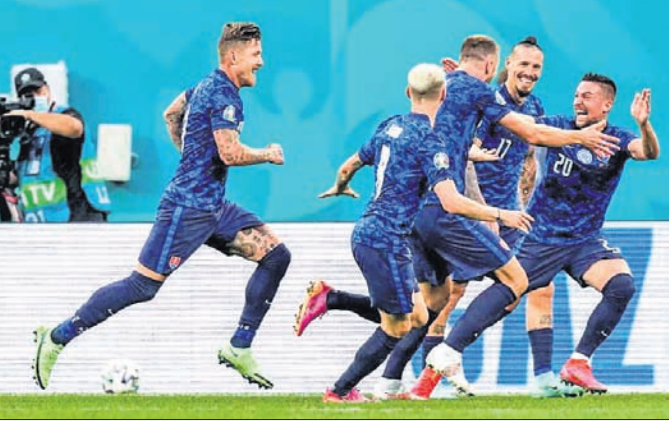
ପୋଲାଣ୍ଡ ବିପକ୍ଷରେ ବିପକ୍ଷ ଗୋଲ ଖୋର କରିବା ପରେ ସ୍ପୋର୍ଟାକିଆ ଦଳର ଖେଳାଳିମାନେ ।

ୟୁରୋକପ୍ ପୁରୁଷଲରେ ସ୍ପୋର୍ଟାକିଆ ବିଜୟ ସହ ଅଭିଯାନ ଆରମ୍ଭ କରିଛି । ଗ୍ଲାନାୟ କ୍ରେସୋଭାଲ୍ ଷ୍ଟାଡିୟମରେ ସୋମବାର ଖେଳାଯାଇଥିବା ମ୍ୟାଚ୍ରେ ସ୍ପୋର୍ଟାକିଆ ୨-୧ ଗୋଲରେ ପୋଲାଣ୍ଡକୁ ପରାସ୍ତ କରିଛି । ଏଥିସହ ସ୍ପୋର୍ଟାକିଆ ୩ ପଏଣ୍ଟ ହାସଲ କରି ଗ୍ରୁପ୍ ଇଂର ଶୀର୍ଷ ଗ୍ଲାନ ଅଧିକାର କରିଛି । ସାରା ମ୍ୟାଚ୍ରେ ଜବରଦସ୍ତ ସଂଘର୍ଷ ଦେଖିବାକୁ ମିଳିଥିଲା ।