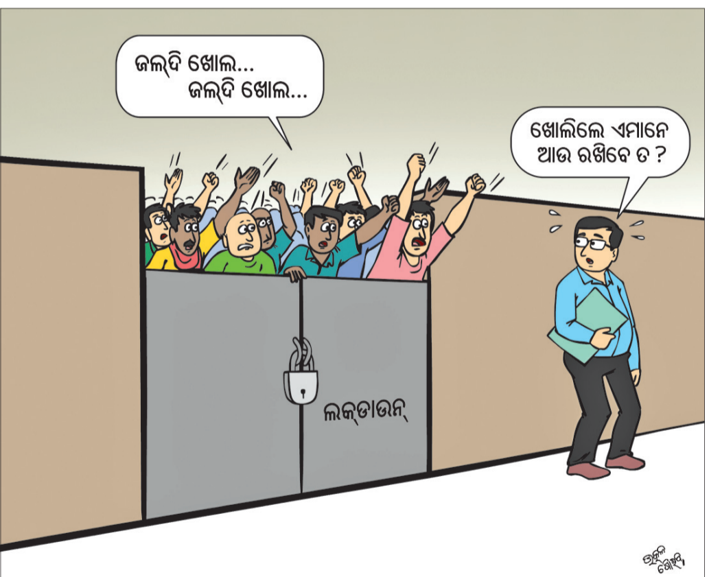
ଜଲ୍ଲି ଖୋଲ... ଜଲ୍ଲି ଖୋଲ... ଖୋଲିଲେ ଏମାନେ ଆଉ ରଖିବେ ତ ?