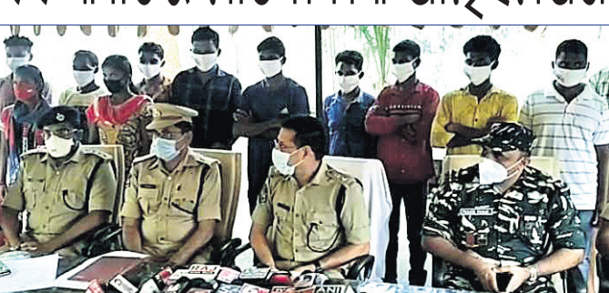
ଆତ୍ମ ସମର୍ପଣ କରିଥିବା ମାଓବାଦୀ ।

ମାଲକାନଗିରି, ୧୫.୬(ଡି.ଏନ.ଏ.) ମାଲକାନଗିରି ସାମାଜିକ ତେଲଙ୍ଗାନା ରାଜ୍ୟର ଭଦ୍ରାପି କଡାଗୁଡ଼ୁଟି ଜିଲ୍ଲା ଏସ୍ପି ଏସ୍ପି ସିଆରପିଏସ୍-୧୪୧ ବାଗାଲିୟନ୍ କମାଣ୍ଡାଣ୍ଟ ନିକଟରେ ମଙ୍ଗଳବାର ୩ ମହିଳାଙ୍କ ସହ ୧୯ ମିଲିସିଆ କ୍ୟାଡର ଆତ୍ମବାଦୀଙ୍କ ଆତ୍ମସମର୍ପଣ କରାଯାଇଛି । ଏହି ମିଲିସିଆମାନେ ସେମାନଙ୍କ ମାଓବାଦୀଙ୍କୁ ଆତ୍ମସମର୍ପଣ କରିଛନ୍ତି । ଏମାନେ ତେରୁଲାଇ ଏରିୟା କମିଟିରେ କାର୍ଯ୍ୟ କରୁଥିଲେ । ଏମାନେ ମାଓବାଦୀ କାର୍ଯ୍ୟ କଳାପରେ ଲିପ୍ତ ରହି କ୍ୟାଡର ମାଓବାଦୀଙ୍କୁ ପୋଲିସ୍ ରାଟିଓସ୍ ସମ୍ପର୍କରେ ସୂଚନା ଦେବା ସହ ବିଭିନ୍ନ ବୈଠକରେ ଲୋକମାନଙ୍କୁ