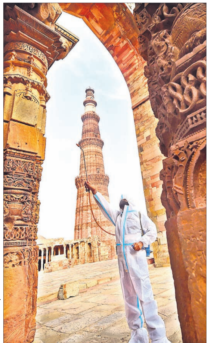
ସର୍ବସାଧାରଣଙ୍କ ପାଇଁ ଖୋଲାଯିବା ପୂର୍ବରୁ ନୂଆଦିଲ୍ଲୀସ୍ଥିତ କୁତବ୍ ମିନାର କମ୍ପ୍ଲେକ୍ସକୁ ମଙ୍ଗଳବାର ବିଶୋଧନ କରାଯାଇଛି।

ଜାମିନ ପ୍ରଦାନ କରିଛନ୍ତି। ଏହାପରେ ଅଭିଯୁକ୍ତମାନଙ୍କୁ ସେମାନଙ୍କ ପାଦପୋଷି ଦାଖଲ କରିବାକୁ ଏବଂ ମାମଲାରେ ବ୍ୟାପାର ସୃଷ୍ଟି ହେବା ଭଳି କାର୍ଯ୍ୟ ନ କରିବାକୁ ନିର୍ଦ୍ଦେଶ ଦେଇଛନ୍ତି। ଖଣ୍ଡପୀଠ କହିଛନ୍ତି, ଯୁବପିଏ ଧାରା ୧୫, ୧୬ କିମ୍ବା ୧୮ ଅନୁସାରେ ଅପରାଧ ବିଚାରଣା ହେବା ଭଳି କୌଣସି କାର୍ଯ୍ୟ ଏମାନେ କରିନାହାନ୍ତି। ଆତଙ୍କବାଦ ନିରୋଧୀ ଆନ୍ଦଳ ଯୁବପିଏରେ ଉଲ୍ଲେଖ କରାଯାଇଥିବା ସଂଜ୍ଞାଗତ ଶବ୍ଦ ଓ ବ୍ୟବହାରକୁ ବ୍ୟବହାର କରିବା ସମୟରେ କୋର୍ଟ ମଧ୍ୟ ସତର୍କ ହେବା ଜରୁରୀ। ଏପରି କି ପାରମ୍ପରିକ ବର୍ଦ୍ଧନ ଅପରାଧ ମଧ୍ୟ ଆତଙ୍କବାଦଠାରୁ ଭିନ୍ନ। ଏହି ବିଷୟ ନ ରୁକ୍ଷିତ ଯୁବପିଏ ଆନ୍ଦଳ ବଳରେ ଆନ୍ଦଳଗତ କାର୍ଯ୍ୟାନୁଷ୍ଠାନ ନିଆଯିବା ଅନୁଚିତ। ଶାନ୍ତିପୂର୍ଣ୍ଣ ଉପାୟରେ ବିନା ଅସ୍ତ୍ରରେ ବିଶୋଭ କରିବା ସମ୍ବିଧାନ ଅନୁଚ୍ଛେଦ ୧୯(୧) (ବି) ଅନୁସାରେ ଏକ ମୌଳିକ ଅଧିକାର। ସମ୍ବିଧାନ ପ୍ରଦାନ ବିଶୋଭ ଅଧିକାର ଓ ଆତଙ୍କବାଦୀ କାର୍ଯ୍ୟକଳାପ ପୃଷ୍ଠା-୪