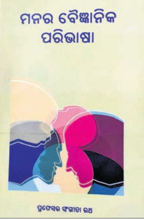
ମାନର ବୈଜ୍ଞାନିକ ପରିଭାଷା ପ୍ରତ୍ୟେକ ବ୍ୟାପାର ଉପ

ଲେଖକ: ପ୍ର. ସଂଗୀତା ରଥ ପ୍ରକାଶକ: ବୁକ୍‌ମେନ୍, କଟକ ପ୍ରଥମ ପ୍ରକାଶ: ୨୦୧୮, ମୂଲ୍ୟ: ଟ.୧୫୦/- ମୋଟ ୧୭ଟି ମନୋବୈଜ୍ଞାନିକ ନିବନ୍ଧକୁ ନେଇ ଆଲୋଚ୍ୟ ନିବନ୍ଧ ଗ୍ରନ୍ଥକ ପରିଚିତ। ଗ୍ରନ୍ଥକାରରେ ଥିବା ଗବ୍ୟଲେଖ 'କଥା ଦି' ପଦ'ରେ ଲେଖିକା ଗ୍ରନ୍ଥକ ନିବନ୍ଧଗୁଡ଼ିକର ପ୍ରାସଙ୍ଗିକତା ଓ ବିଶେଷତ୍ୱକୁ ଅତି ସରଳ ଭାବେ ବିଶ୍ଳେଷଣ କରିଛନ୍ତି। ତାଙ୍କ ବିଚାରରେ ମଣିଷର ମନ ତିର ରହସ୍ୟମୟ ଓ ଏହା ଶରୀରକୁ ନାନା ଭାବେ ପ୍ରଭାବିତ କରିଥାଏ। ମନକୁ ବୁଝିପାରିଲେ ଜୀବନର ନାନା ଜଟିଳ ସମସ୍ୟାର ସମାଧାନ ସହଜ ହୋଇଥାଏ। ବାର୍ଦ୍ଧକ୍ୟ ସହିତ ଶରୀର ନୁହେଁ, ମନ କିପରି ଅଧିକ ସଂଶ୍ଳିଷ୍ଟ, ତା'ର ବିଶ୍ଳେଷଣ କରାଯାଇଛି 'ବାର୍ଦ୍ଧକ୍ୟ: ଶାରୀରିକ ନୁହେଁ ମାନସିକ' ନିବନ୍ଧରେ। ସେହିପରି ଆତ୍ମହତ୍ୟା ଭଳି ଗୁରୁତର ସମସ୍ୟାକୁ ନେଇ ମନସ୍ତତ୍ତ୍ୱର ଅବଧାରଣାକୁ ଲେଖିକା 'ସାହାଯ୍ୟ ପାଇଁ ନିବେଦନ'ରେ ବ୍ୟାଖ୍ୟା କରିଛନ୍ତି। ଅବସାଦଗ୍ରସ୍ତ ବ୍ୟକ୍ତି ଆତ୍ମହତ୍ୟା ପୂର୍ବରୁ ଅନ୍ୟମାନଙ୍କର ସାହାଯ୍ୟ ପାଇବାକୁ ଚାହେଁ, ଯାହା ସାଧାରଣତଃ ଅଣଦେଖା ହେବାକୁ ମୁଣ୍ଡୁ ହିଁ ଅବସାଦିତ ବ୍ୟକ୍ତିର ପରିଣତି ହୋଇଥାଏ। ଏହି ପ୍ରସଙ୍ଗରେ ଗ୍ରନ୍ଥକ 'ମାନସିକ ଅବସାଦକୁ ପୂଜି ଆତ୍ମହତ୍ୟା କି ?' ନିବନ୍ଧ ଚାପୁର୍ଯ୍ୟପୂର୍ଣ୍ଣ ମନେହୁଏ। ଗ୍ରନ୍ଥକର ଗୁଣିତ 'ମାନସିକ ଚାପର ନିୟନ୍ତ୍ରଣ', 'ମନ ଓ ଶରୀର: ଭିନ୍ନ ଅଥବା ଅଭିନ୍ନ', 'ରୋଗ, ରୋଗୀ ଓ ଚିକିତ୍ସା ବିଜ୍ଞାନ', 'ସୁଖ ଏକ ଅନ୍ତର୍ନିହିତ ମାନସିକ ପ୍ରକ୍ରିୟା', 'ସମଲିଙ୍ଗୀ ଯୌନ ସମ୍ପର୍କ: ଏକ ମନସ୍ତତ୍ତ୍ୱିକ ବିଶ୍ଳେଷଣ', 'ନାରୀର ସୌନ୍ଦର୍ଯ୍ୟ ସତେଜନତା: ମନୋବୈଜ୍ଞାନିକ ବିଚାର', 'ପ୍ରେମ ଏକ ଜୈବ ରାସାୟନିକ ପ୍ରକ୍ରିୟା' ଓ 'ପୁଲିହୀନ ବିଶ୍ୱାସ ଓ ବିଜ୍ଞାନ' ଆଦି ନିବନ୍ଧ କେବଳ ଶିକ୍ଷଣୀୟ ହୋଇ ନାହିଁ, ପରିବେଷଣଗତ ସୌକର୍ଯ୍ୟ ଯୋଗୁଁ ପାଠକାୟ ଶ୍ରଦ୍ଧାର ଭାଙ୍ଗନ ହୋଇପାରିଛି।