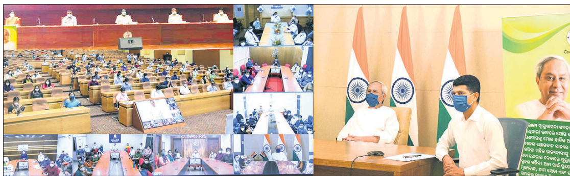
ମୁଖ୍ୟମନ୍ତ୍ରୀ ନବୀନ ପଟ୍ଟନାୟକ ରୂପସାଧାରଣ ଭିଡିଓ କନ୍ଫରେନ୍ସରେ ନବ ନିଯୁକ୍ତ ଡାକ୍ତରମାନଙ୍କ ସହ କଥା ହେଉଛନ୍ତି। ନିକଟରେ ୫-ଟି ସରକାରୀ ଡାକ୍ତରଖାନା ଖୋଲିବାକୁ ଯୋଜନା କରାଯାଇଛି।

ରାଜ୍ୟ ସରକାର ସ୍ୱାସ୍ଥ୍ୟ କ୍ଷେତ୍ରକୁ ପ୍ରାଥମିକତା ଦେଉଛନ୍ତି। ସେଥିପାଇଁ ସ୍ୱାସ୍ଥ୍ୟ ଭିତ୍ତିକ କ୍ଷେତ୍ରରେ ୮,୫୦୦କୋଟି ଟଙ୍କା ବିନିଯୋଗ କରାଯାଉଛି। ଓଡ଼ିଶା ପ୍ରଶାସନିକ ସେବା ଆୟୋଗ(ଓପିଏସ୍‌ସି) ଦ୍ୱାରା ନବନିଯୁକ୍ତ ୭୮୬ ଡାକ୍ତରଙ୍କ ସହ ଭିଡିଓ କନ୍ଫରେନ୍ସରେ ଆଲୋଚନା ବେଳେ ମୁଖ୍ୟମନ୍ତ୍ରୀ ନବୀନ ପଟ୍ଟନାୟକ ଏହା କହିଛନ୍ତି। ମୁଖ୍ୟମନ୍ତ୍ରୀ କହିଛନ୍ତି, ସ୍ୱାସ୍ଥ୍ୟ ବ୍ୟବସ୍ଥାକୁ ସୁଦୃଢ଼ କରିବାକୁ ଗତ କିଛିବର୍ଷ ଭିତରେ ବହୁ ସଂଖ୍ୟାରେ ସ୍ୱାସ୍ଥ୍ୟ କର୍ମୀ ନିଯୁକ୍ତ ହୋଇଛନ୍ତି। ନରୋନା ମହାମାରୀ ବେଳେ ଡାକ୍ତରମାନଙ୍କ ଭୂମିକାକୁ ପ୍ରଶଂସା କରି ମୁଖ୍ୟମନ୍ତ୍ରୀ କହିଛନ୍ତି, ସମାଜରେ ଡାକ୍ତରମାନଙ୍କର ସ୍ୱତନ୍ତ୍ର ସମ୍ମାନ ରହିଛି। କିନ୍ତୁ ପୂର୍ଣ୍ଣ ସମୟରେ ଲୋକମାନେ ଡାକ୍ତରଙ୍କୁ ଭଗବାନ ମନେକରନ୍ତି। କରୋନା ସମୟରେ ଗତ ଦେଢ଼ବର୍ଷ ହେବ ଡାକ୍ତରମାନେ ଆତ୍ମ ଧାତ୍ତ୍ୱରେ କରୋନା ଯୋଦ୍ଧା ଭାବେ କାର୍ଯ୍ୟ କରୁଛନ୍ତି। ଏଥିପାଇଁ ମୁଖ୍ୟମନ୍ତ୍ରୀ ଡାକ୍ତର ଗୋଷ୍ଠୀକୁ ପ୍ରଶଂସା କରିଛନ୍ତି। ଜନସାଧାରଣଙ୍କ ସେବାକୁ ବାଧିଥିବା ନବନିଯୁକ୍ତ ଡାକ୍ତରମାନଙ୍କୁ ମୁଖ୍ୟମନ୍ତ୍ରୀ ସ୍ୱାଗତ କରିଛନ୍ତି। ଦୀର୍ଘ ବର୍ଷ କଠିନ