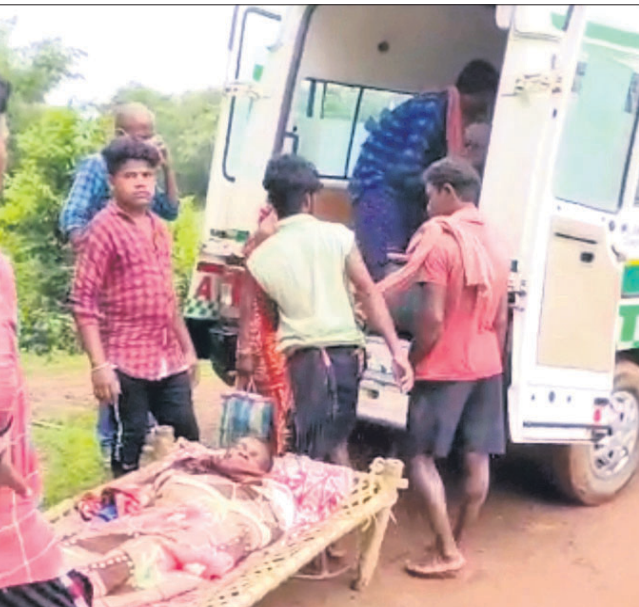
ଅସୁସ୍ଥ ଦାଶିନଙ୍କୁ ଆୟୁର୍ଲାଭୁ ପର୍ଯ୍ୟନ୍ତ ନିଆଯାଇଛି।

ବାଲେଶ୍ଵର ଜିଲ୍ଲା ଖଜରା ବ୍ଲକ ସାରତାଳ ପଞ୍ଚାୟତ ଅଧୀନ ବାରାକୁଟି ଆସିବାସୀ ସାହିକୁ ବନ୍ଧୁ ଦାବି ପରେ ମଧ୍ୟ ଯାତାୟତ ଉପଯୋଗୀ ରାସ୍ତାଟିଏ ନିର୍ମାଣ ହୋଇପାରିନାହିଁ । ଫଳରେ ଏବେ ସାମାନ୍ୟ ବର୍ଷା ପରେ ଗ୍ରାମବାସୀଙ୍କୁ ବୁର୍ଦ୍ଧା ଭୋଗିବାକୁ ପଡୁଛି। ଗାଁରେ କାହାର ଦେହ ଖରାପ ହେଲେ ଆୟୁର୍ଲାଭୁଟିଏ ଆସିବାକୁ ନାହିଁ। ଲୋକମାନେ ରୋଗୀଙ୍କୁ ୨୫-୩୦ ପର୍ଯ୍ୟନ୍ତ ଖଟିଆରେ ବେକି ଚେକି ପୋଲିସ ପ୍ରମିଳାଙ୍କ ଦିଅର, ଯାଆ, ପୁରୁଣା ଓ ଝିଆରୀଙ୍କ ନାଁରେ ମାମଲା ରୁଜୁ କରିଛନ୍ତି।