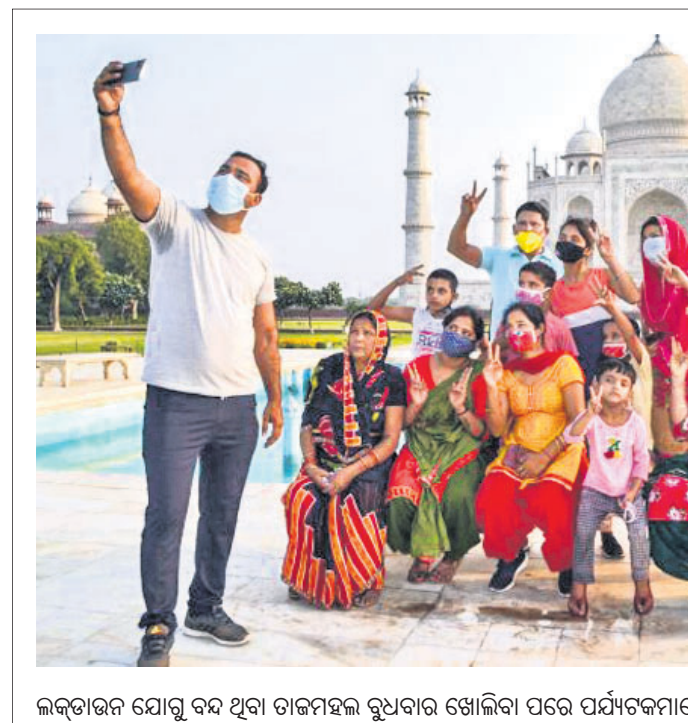
ଲକ୍ଷ୍ନୋର ଯୋଗୁଁ ବନ୍ଦ ଥିବା ତାଜମହଲ ରୂପବାର ଖୋଲିବା ପରେ ପର୍ଯ୍ୟଟକମାନେ ସେଲଫି ନେଉଛନ୍ତି।

ନୂଆଦିଲ୍ଲୀ, ୧୬/୬: କରୋନା ଚିକିତ୍ସା କୋଭିଡ଼ରେ 'କାଫ୍ ସିରମ୍' ଥିବା ନେଇ ସୋସିଆଲ ମିଡିଆରେ ବିଭିନ୍ନ ପୋଷ୍ଟ ହେଉଥିବାବେଳେ କେନ୍ଦ୍ର ସରକାର ଏହା ଉପରେ ସ୍ପଷ୍ଟୀକରଣ ରଖିଛନ୍ତି। କୋଭିଡ଼ରେ କାଫ୍ ସିରମ୍ ନ ଥିବା ଏବଂ ଏ ନେଇ ମିଥ୍ୟା ପ୍ରଚାର କରାଯାଉଥିବା କେନ୍ଦ୍ର କହିଛି। ଏହି ଭୀତିରେ ୨୦ ଦିନରୁ କମ୍ ବୟସ ବାହୁରୀର ଜମାଟ ବାଧିଥିବା ରକ୍ତ ରହିଥିବା ନେଇ କଂଗ୍ରେସ ପୁଣ୍ୟପାତ୍ର ଗୌରବ ପାଠ୍ଟା କୁଇଟ୍ କରିଥିଲେ। ଜବାବରେ କେନ୍ଦ୍ର ସରକାର କହିଛନ୍ତି, ନବଜାତ ବାହୁରୀ ସିରମକୁ କେବଳ ଭୂତାଣୁ କୋଷିକାର ବିକାଶ ପାଇଁ ବ୍ୟବହାର କରାଯାଏ। ପୋଲିଓ, ରେବିଜ୍, ଇନ୍‌ଫୁଏନ୍ସା ଆଦି ଚିକା ପାଇଁ ଭେରୋ କୋଷିକା କୋଷିକା ବ୍ୟବହାର ହେଉଛି। ଏହି କୋଷିକା ବିକଶିତ ହେବାପରେ ତାହାକୁ ପାଣି, ରାସାୟନିକ ପଦାର୍ଥ ଦ୍ୱାରା ପରିଷ୍କାର କରାଯାଏ। ଯାହାକୁ ବ୍ୟବହାର କରାଯାଏ। ବାରମ୍ବାର ଧୂଆଁପାନ ସେଥିରୁ କାଫ୍ ସିରମକୁ ସମ୍ପୂର୍ଣ୍ଣ ହଟାଇଦିଆଯାଏ। ଭୀତିରେ ପ୍ରଭୃତିର ଅନ୍ତିମ ପର୍ଯ୍ୟାୟରେ କୋଣସି କାଫ୍ ସିରମ୍ ସେଥିରେ ରହି ନ ଥାଏ। ଭୀତିରେ ପ୍ରଭୃତିବେଳେ ଭୂତାଣୁ କୋଷିକାର ବିକାଶ ପାଇଁ କାଫ୍ ସିରମ୍ ବ୍ୟବହୃତ ହେଉଥିଲେ ହେଁ ସାଧ୍ୟ-କୋଭି-୨ ସେଲ୍ ଗ୍ରୋଥ୍ ପାଇଁ ଏହାକୁ ଉପଯୋଗ କରାଯାଇ ନ ଥିବା ଏବଂ ଏଥିରେ କେବଳ ନିଷ୍ପତ୍ତି ଭୂତାଣୁ ପାଇଁ ବ୍ୟବହାର କରାଯାଏ। ପୋଲିଓ, ରେବିଜ୍, ଇନ୍‌ଫୁଏନ୍ସା ଆଦି ଚିକା ପାଇଁ