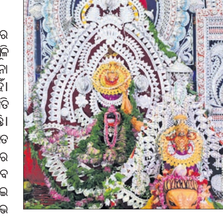
ସମ୍ବଲପୁର ଝାଡୁଆପଡ଼ା ଲୋକନାଥ ବାବା ଓ ମାତା ପାର୍ବତୀଙ୍କ ଯୁଗଳମୂର୍ତ୍ତି ।

ସମ୍ବଲପୁରର ପ୍ରସିଦ୍ଧ ଶୀତଳଷଷ୍ଠୀ ଯାତ୍ରାରେ ଶିବପାର୍ବତୀଙ୍କ ପ୍ରାନ୍ତପୁରୁଷର ବିବାହ ଓ ଗୋଧୁଳି ଲଗ୍ନରେ କନ୍ୟା ବିବାହ ନୀତି ସମ୍ପନ୍ନ ହୋଇଛି । କରୋନା ମହାମାରୀ ଯୋଗୁ ନଗର ପରିକ୍ରମା କରାଯାଇ ନାହିଁ । ମନ୍ଦିର ପରିସରକୁ ସୁରକ୍ଷିତ ମଣ୍ଡପରେ ଦେବଦମ୍ପତି ବିଷ୍ଣୁଙ୍କ ହୋଇ ଭକ୍ତମାନଙ୍କୁ ଦର୍ଶନ ଦେଇଛନ୍ତି । ଜଗନ୍ନାଥନୀ ମାତା ପାର୍ବତୀ ସ୍ୱର୍ଣ୍ଣ ଅଳଙ୍କାରରେ ଭୂଷିତ ହୋଇ ପାଳକସ୍ତ୍ର ପରିଧାନ ପୂର୍ବକ ନବବଧୂ ବେଶରେ ସିନ୍ଧୁ ଉପରେ ଉପବିଷ୍ଣୁ ହୋଇଥିଲେ । ମହାଦେବ ମଧ୍ୟ ଗୌପ୍ୟ ଓ ସ୍ୱର୍ଣ୍ଣ ଅଳଙ୍କାରରେ ଆଭୂଷଣ ହୋଇ ସମ୍ବଲପୁରୀ ପାଳକସ୍ତ୍ର ପରିଧାନ କରି ବାହନ ବୃଷଭ ଉପରେ ଆରୁହ ହୋଇଥିଲେ । ଶିବପାର୍ବତୀଙ୍କ ଏହି ମନୋଲୋଭା ଯୁଗଳମୂର୍ତ୍ତି ଦର୍ଶନ କଲେ ମୋକ୍ଷ ପ୍ରାପ୍ତି ମିଳିଥାଏ ବୋଲି ବିଶ୍ୱାସ କରି ଭକ୍ତମାନେ ଦର୍ଶନ କରିଛନ୍ତି । ଝାଡୁଆପଡ଼ା ଲୋକନାଥ ବାବାଙ୍କ ମହାଆଳତି ରୂପରେ ପୂର୍ବାହ୍ନି ୧୦ଟାରେ ହୋଇଥିଲା । ଏହାପରେ ଭକ୍ତମାନେ ଯୁଗଳମୂର୍ତ୍ତି ଦର୍ଶନ କରିଥିଲେ । ସେହିପରି ନନ୍ଦପଡ଼ା ବନବରାଜ ବାଲୁକେଶ୍ୱର ବାବା, ପୂର୍ବପଡ଼ା ଗାନ୍ଧେଶ୍ୱର ବାବା, ବଡ଼ବଜାର ଶୀତଳେଶ୍ୱର ବାବା, ଠାକୁରପଡ଼ା ରୁଦ୍ରେଶ୍ୱର ବାବା ଓ ବାଲିବନ୍ଧା ସୋମନାଥ ବାବାଙ୍କ