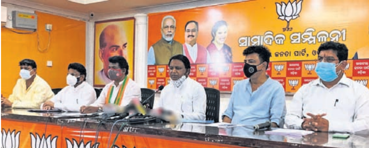
ଖବରଦାତା ସମ୍ମିଳନୀରେ ଭାଜପା କର୍ମକର୍ତ୍ତା।

ରାଜ୍ୟର କୋଭିଡ଼ ମହାମାରୀ ସମୟରେ ରାଜ୍ୟ ତଥା କେନ୍ଦ୍ର ଅର୍ଥନୀତିରେ ରାଜସ୍ୱ ବୃଦ୍ଧି, ଇସ୍ତାତ ଶିଳ୍ପରେ ପ୍ରତିଯୋଗିତାକୁ ସମର୍ଥନ ରଖିବା ସହ ସ୍ଥାନୀୟ ଅଞ୍ଚଳରେ ରୋଜଗାର ସୃଷ୍ଟି କରିବା ପାଇଁ ଓଡ଼ିଶା ସରକାର ଏମ୍‌ଏମ୍‌ଡିଆର ଆଇ ଆରୁଆରେ ରାଜ୍ୟର ଖଣି ଅଞ୍ଚଳରେ ପଡ଼ି ରହିଥିବା ୧୦ ହଜାର କୋଟି ଟଙ୍କା ମୂଲ୍ୟର ଲୁହାପଥରକୁ ବ୍ୟବହାର ବିକ୍ରି କରିବା ପାଇଁ ଭାଜପା ଦାବି କରିଛି। ଏ ପରିସ୍ଥିତିରେ ଭାଜପା ବିଧାୟକମାନେ ମୁଖ୍ୟମନ୍ତ୍ରୀ ନବୀନ ପଟ୍ଟନାୟକ, କେନ୍ଦ୍ର କୋଇଲା ଓ ଖଣି ମନ୍ତ୍ରୀ ପ୍ରହଲ୍ଲାଦ ଘୋଷା ଏବଂ କେନ୍ଦ୍ର ପୋଟୋଲିୟମ ମନ୍ତ୍ରୀ ଧର୍ମେନ୍ଦ୍ର ପ୍ରଧାନଙ୍କୁ ଚିଠି ଲେଖି ହସ୍ତକ୍ଷେପ କରିବାକୁ ଅନୁରୋଧ