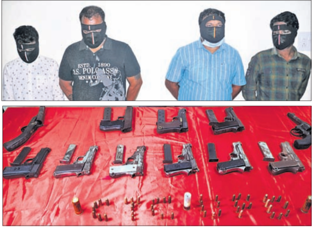
ଗିରଫ ୪ ଅଭିଯୁକ୍ତ । ଜବତ ବନ୍ଧୁକ, ମାଗାଜିନ୍ ଓ ଗୁଳି ।

କଟକ ଅଫିସ୍, ୧୬/୬ ଓଡ଼ିଶା ପାଲଟିଛି ଚୋରୀ ବନ୍ଧୁକର ଭଣ୍ଡାର । ଗ୍ୟାଙ୍ଗ୍ସ୍ତର ଧଳାଧଳା ଗୁଳି ଗୋଳାପ ଧାରାରେ ଖୋଳାଗୁଳି କରୁଛନ୍ତି । ଏହାପରେ ୧୧ ବନ୍ଧୁକ, ୪୧ ଗୁଳି ଜବତ କରାଯାଇଛି । ଏହାପରେ ୪ ଗିରଫ କରାଯାଇଛି । କଟକ ଅଫିସ୍, ୧୬/୬ ଓଡ଼ିଶା ପାଲଟିଛି ଚୋରୀ ବନ୍ଧୁକର ଭଣ୍ଡାର । ଗ୍ୟାଙ୍ଗ୍ସ୍ତର ଧଳାଧଳା ଗୁଳି ଗୋଳାପ ଧାରାରେ ଖୋଳାଗୁଳି କରୁଛନ୍ତି । ଏହାପରେ ୧୧ ବନ୍ଧୁକ, ୪୧ ଗୁଳି ଜବତ କରାଯାଇଛି । ଏହାପରେ ୪ ଗିରଫ କରାଯାଇଛି ।