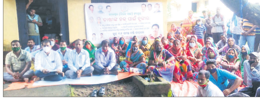
ନାମ୍ପୋ ସେବା ସମବାୟ ସମିତି ସମ୍ପୂର୍ଣ୍ଣରେ ଗଞ୍ଜାଳ ଧାରଣା।