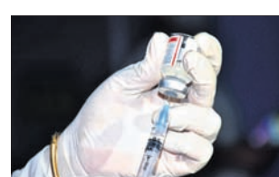
ନେବାକୁ ଅନୁମତି ମିଳିବ। ତେବେ ଟିକା ଦେବାବେଳେ ସମସ୍ତ ତଥ୍ୟକୁ ଭଲ ଭାବେ ଯାଞ୍ଚ କରିବା ପାଇଁ କୁହାଯାଇଛି। ଏହି ଟିକାକରଣ ସୁଦ୍ଧା ଅଗଷ୍ଟ ୩୧ ତାରିଖ ପର୍ଯ୍ୟନ୍ତ ଚାଲି ରହିବ ବୋଲି ବିଭାଗ ପକ୍ଷରୁ ସମସ୍ତ ଜିଲ୍ଲାପାଳଙ୍କୁ ଚିଠି ଲେଖି ଜଣାଇ ଦିଆଯାଇଛି।

ଭୁବନେଶ୍ୱର, ୧୭।୬ (ଭୁବନେ): ପାଠ ପଢ଼ିବା, ଚାକିରି ଓ ଟୋକିଓ ଅଲିମ୍ପିକ୍‌ସରେ ଯୋଗଦେବା ପାଇଁ ବିଦେଶ ଯିବାକୁ ଥିବା ଲୋକଙ୍କୁ ଦ୍ୱିତୀୟ ଡୋଜ୍ କୋଭିଡ଼ ଟିକାକରଣ ନିମନ୍ତେ ରାଜ୍ୟ ସରକାର ବିଭିନ୍ନ ପଦକ୍ଷେପ ନେଇଛନ୍ତି। ଅତିରିକ୍ତ ଜନସ୍ୱାସ୍ଥ୍ୟ ଅଧିକାରୀ କିଛି ଅତିରିକ୍ତ ସହାୟତା ଜନସ୍ୱାସ୍ଥ୍ୟ ଅଧିକାରୀ ସେବାୟତମାନେ ମାଝ ପିନ୍ଧି ନ ଥିଲେ। ଶୋଭାଯାତ୍ରୀରେ ଚେଲିଶି ବାଜା, ରୋଶି ବାରଣ୍ଡା ଥିବାବେଳେ ବହୁ ଜୋରସୋରରେ କରାଯାଇଥିବା ବୁଝାକା ମହଲରେ ନାସସର କରାଯାଇଛି।