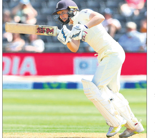
ଶର୍ ଖେଳିବା ଅବସରରେ ହିଅର ନାଉଟା।

ଭାରତ ଓ ଇଂଲଣ୍ଡ ମଧ୍ୟରେ ଏକମାତ୍ର ମହିଳା କ୍ରିକେଟ୍ ଚେସ୍ ମ୍ୟାଚ୍ ରୁଧିରୀ ଆରମ୍ଭ ହୋଇଛି। ପାଖାପାଖି ୬ ବର୍ଷ ବ୍ୟବଧାନରେ ଭାରତୀୟ ମହିଳା ଏକ ଚେସ୍ ମ୍ୟାଚ୍ ଖେଳିବା ସୁଯୋଗ ପାଇଛନ୍ତି। ଏଥିରେ ଭାରତର ୫ ଖେଳାଳି ଦାସ୍ତି ଶର୍ମା, ପୂଜା ବସୁକାର, ଶେଫାଳି ବର୍ମା, ସ୍ନେହ ରାଣା ଓ ତାନିୟା ଭଟ୍ଟିଆ ଚେସ୍ କ୍ୟାରିୟର ଆରମ୍ଭ କରିଛନ୍ତି। ସେହିପରି ଇଂଲଣ୍ଡ ପକ୍ଷରୁ ସୋଫିଆ ଡକ୍ଲେଲ କ୍ୟାରିୟର ପ୍ରଥମ ଚେସ୍ ଖେଳିଛନ୍ତି। ପ୍ରଥମ ଦିବସ ଖେଳ ଶେଷ ବେଳକୁ ଇଂଲଣ୍ଡ ୬ ଉଇକେଟ୍ ହରାଇ ୨୬୯ ରନ ସଂଗ୍ରହ କରିଛି। ଓପନର ଗାମ୍ ବିନାଶ ଓ ଅଧିନାୟିକା ହିଅର ନାଉଟା ପ୍ରଭାବୀ ବ୍ୟାଟିଂ କରି ଇଂଲଣ୍ଡକୁ ସମ୍ମାନଜନକ ସ୍ଥିତିରେ ପହଞ୍ଚାଇଛନ୍ତି। ନାଉଟା ୯୫