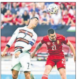
ପର୍‌ଓର୍ ୨୦୦୪ ପରଠାରୁ ପଞ୍ଚମ ୟୁରୋପିଆନ୍ ଚାମ୍ପିୟନଶିପ୍ ଖେଳୁଛନ୍ତି। ମାଲକେଲ ପ୍ଲାଟିନି ଓ ରୋନାଲ୍ଡୋ ସମାନ ୯ଟି ଗୋଲ କରି ଏହି ତୁର୍ନାମେଷ୍ଟରେ ପ୍ରବେଶ କରିଥିଲେ। ଏବେ ରୋନାଲ୍ଡୋ ୧୧ ଗୋଲ ଖୋଲ କରି ଆଗରେ ରହିଛନ୍ତି। ୩୬ ବର୍ଷୀୟ ରୋନାଲ୍ଡୋ ଏକମାତ୍ର ଖେଳାଳି ଭାବେ କ୍ରମାଗତ ୫ଟି ୟୁରୋ କପ୍ରେ ଗୋଲ ଖୋଲ କରିବାରେ ଗୌରବ ଅର୍ଜନ କରିଛନ୍ତି।

ରୋନାଲ୍ଡୋଙ୍କ ରେକର୍ଡ ବୁଦାପେଷ୍ଟ, ୧୬/୬: ଅଧିନାୟକ କ୍ରିଷ୍ଟିଆନୋ ରୋନାଲ୍ଡୋଙ୍କ ତତ୍କାଳୀନ ବଳରେ ପର୍ଯ୍ୟୁତ ଯୁଗୀନାୟକ ବିପ୍ଲବ କରି ଖେଳିଥିଲେ। ତୁର୍ନାମେଷ୍ଟର ପଞ୍ଚମ ଦିବସରେ ପୁରା ଷ୍ଟାଡିୟମରେ ଏହି ମ୍ୟାଚ ଖେଳାଯାଇଥିଲା। ପୁଣ୍ୟ ସ୍ଥଳରେ ୬୭,୨୧୫ ଦର୍ଶକ ଉପସ୍ଥିତ ଥିଲେ ଓ ଏମାନଙ୍କ ମଧ୍ୟରେ ଅଧିକାଂଶ ପ୍ରଶଂସକ ହଜେକରା ଥିଲେ। ୧୦ଟି ଦେଶ ମଧ୍ୟରୁ ହଜେକରା ଏକମାତ୍ର ଦେଶ ଯେଉଁଠି ପୁରା ଷ୍ଟାଡିୟମରେ ମ୍ୟାଚ୍ ଆୟୋଜନ ହେଉଛି। ପୁରା ଷ୍ଟାଡିୟମରେ ରୋନାଲ୍ଡୋଙ୍କ ପ୍ରଦର୍ଶନ ଐତିହାସିକ ଥିଲା। ୟୁରୋପିଆନ୍ ଚାମ୍ପିୟନଶିପ୍ରେ ରୋନାଲ୍ଡୋ ସର୍ବୋଚ୍ଚ କ୍ୟାରିୟର ଗୋଲ ସେଇ ଡିପେଣ୍ଡର ଚାମ୍ପିୟନ ପର୍ଯ୍ୟୁତକୁ ଅଗ୍ରଣୀ କରାଇଥିଲେ। ମ୍ୟାଚରେ ପର୍ଯ୍ୟୁତ ସମ୍ପୂର୍ଣ୍ଣରୂପେ ପ୍ରାଧାନ୍ୟ ବିପ୍ଳବ କରି ଖେଳିଥିଲେ। ତୁର୍ନାମେଷ୍ଟର ପଞ୍ଚମ ଦିବସରେ ପୁରା ଷ୍ଟାଡିୟମରେ ଏହି ମ୍ୟାଚ ଖେଳାଯାଇଥିଲା। ପୁଣ୍ୟ ସ୍ଥଳରେ ୬୭,୨୧୫ ଦର୍ଶକ ଉପସ୍ଥିତ ଥିଲେ ଓ ଏମାନଙ୍କ ମଧ୍ୟରେ ଅଧିକାଂଶ ପ୍ରଶଂସକ ହଜେକରା ଥିଲେ। ୧୦ଟି ଦେଶ ମଧ୍ୟରୁ ହଜେକରା ଏକମାତ୍ର ଦେଶ ଯେଉଁଠି ପୁରା ଷ୍ଟାଡିୟମରେ ମ୍ୟାଚ୍ ଆୟୋଜନ ହେଉଛି। ପୁରା ଷ୍ଟାଡିୟମରେ ରୋନାଲ୍ଡୋଙ୍କ ପ୍ରଦର୍ଶନ ଐତିହାସିକ ଥିଲା। ୟୁରୋପିଆନ୍ ଚାମ୍ପିୟନଶିପ୍ରେ ରୋନାଲ୍ଡୋ ସର୍ବୋଚ୍ଚ କ୍ୟାରିୟର ଗୋଲ ସେଇ ଡିପେଣ୍ଡର ଚାମ୍ପିୟନ ପର୍ଯ୍ୟୁତକୁ ଅଗ୍ରଣୀ କରାଇଥିଲେ। ବଲ୍ ପଛେକନ, ପାସ ଓ ପାସ୍ ଆକ୍ରମଣରେ ଜର୍ମାନୀ ଫ୍ରାନ୍ସଠାରୁ ଯଥେଷ୍ଟ ଆଗରେ ଥିଲା। ଉଭୟ ଦଳ ଏକାଧିକ ସୁଯୋଗ ହାସଲ କରିଥିଲେ। ଜର୍ମାନୀ ଅଧିକ ସୁଯୋଗ ହାତଛଡ଼ା କରିଥିଲା। ଜର୍ମାନୀର ଲଲକେ ଗୁଣ୍ଡୋଗା ପ୍ରଥମାର୍ଦ୍ଧରେ ଏକ ନିଶ୍ଚିତ ଗୋଲ ଦଳ ଏକାଧିକ ସୁଯୋଗ ହାସଲ କରିଥିଲେ। ତେବେ ଏହା ପୋଷ୍ଟରେ ଉଦ୍ଧାସ୍ତ ହୋଇଥିଲା। ଜର୍ମାନୀର ଲଲକେ ଗୁଣ୍ଡୋଗା ପ୍ରଥମାର୍ଦ୍ଧରେ ଏକ ନିଶ୍ଚିତ ଗୋଲ ଦଳ ଏକାଧିକ ସୁଯୋଗ ହାସଲ କରିଥିଲେ। ତେବେ ଏହା ପୋଷ୍ଟରେ ଉଦ୍ଧାସ୍ତ ହୋଇଥିଲା।