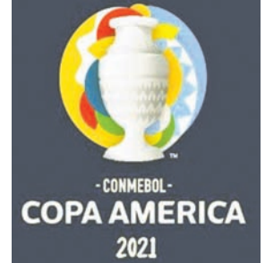
କରିବେ ବୋଲି କନମେବୋଲ ତରଫରୁ କୁହାଯାଇଛି। ଠିକ୍ ସେହିପରି ରୁରୁବାର

ଚଳିତ କୋପା ଆମେରିକା ଫୁଟବଲ ତୁର୍ନାମେଷ୍ଟରେ ଏକ ସ୍ୱାନିଶ୍ ରେଫରି କ୍ରିକୁ ମ୍ୟାଚ୍ ପରିଚାଳନା କରିବେ। ଏ ନେଇ ୟୁରୋପ ଓ ଦକ୍ଷିଣ ଆମେରିକା ଫୁଟବଲ ପ୍ରଶାସନର ବୁଲ୍ ସର୍ବୋଚ୍ଚ ସଂସ୍ଥା ୟୁନିୟନ ଅଫ୍ ୟୁରୋପିଆନ୍ ଫୁଟବଲ ଆସୋସିଏଶନ (ୟୁଏଏଫଏ) ଓ କନମେବୋଲ ମଧ୍ୟରେ ଏକ ଚୁକ୍ତି ହୋଇଛି। ପ୍ରଥମଥର ପାଇଁ କୋପା ଆମେରିକା ମ୍ୟାଚ୍ରେ ୟୁରୋପିଆନ୍ କ୍ରିକୁ କାର୍ଯ୍ୟ କରିବେ ବୋଲି କନମେବୋଲ ତରଫରୁ କୁହାଯାଇଛି। ଠିକ୍ ସେହିପରି ରୁରୁବାର