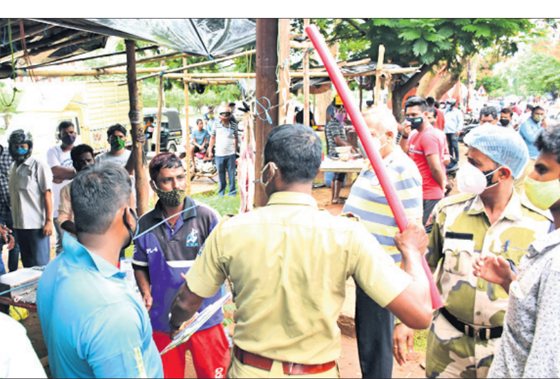
କାତାୟ ରାଜପଥ ପାର୍ଶ୍ୱ ନୂଆପଲ୍ଲୀ ଆମିଷ ବଜାରରେ ଜଣେ ମାଂସ ବ୍ୟବସାୟୀଙ୍କୁ ପୋଲିସ୍ ପଢ଼ୁଛି।

ସଂକ୍ରମଣ ଏହାକୁ କୋଭିଡ଼ କଟକଣା ଲାଗୁ କରାଯାଇଛି। ଏହାକୁ ଉଲ୍ଲଙ୍ଘନ କରୁଥିବା ଅମାନ୍ୟାତ୍ୟ ଉପରେ କର୍ମଚାରୀଙ୍କୁ ପୋଲିସ୍ କାର୍ଯ୍ୟାନୁଷ୍ଠାନ ନେଇଛି। ଗୁଧବାର ପୋଲିସ୍ ଯାତ୍ରା, ବଜାର ସମେତ ବିଭିନ୍ନ ଛକ ଓ ଟେକ୍ ପାଖରେ ଯାତ୍ରାବେଳେ ୬୭୮ଜଣ ଉଲ୍ଲଙ୍ଘନକାରୀ ଧରାପଡ଼ି କରିମାନା ଗଣିଛନ୍ତି। ସେମାନଙ୍କଠାରୁ ୮୦ ହଜାର ୯୦୦ ଟଙ୍କା ଜରିମାନା ଆଦାୟ କରାଯାଇଥିବା କର୍ମଚାରୀଙ୍କୁ ପୋଲିସ୍ ପକ୍ଷରୁ ସୂଚନା ଦିଆଯାଇଛି।