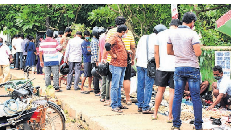
ରଘୁନାଥ ଛକରେ ମାଛ କିଣିବାକୁ ଲୋକେ ଧାଡ଼ି ଲଗାଇଛନ୍ତି।