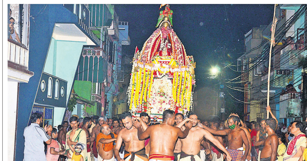
ପୁରୀ: ପଞ୍ଚମହାବେଦଙ୍କ ମଧ୍ୟରୁ ଜୟେଶ୍ୱର ମହାଦେବଙ୍କୁ ସେବକମାନେ ଗୁଆଲି ଯାତ୍ରାରେ ଶ୍ରୀମନ୍ଦିରକୁ ବୋହଇଲେ ନେଉଛନ୍ତି।