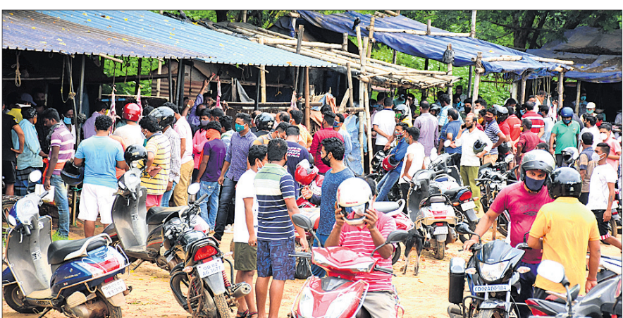
ହାଇଦେବ୍ ଛକ କୁଆଖାଇ ବ୍ରିକ୍ ପାର୍ଶ୍ୱ ମଟର୍ ମାର୍କେଟରେ ଅସମ୍ଭବ ଭିଡ଼।