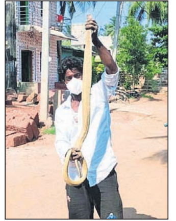
ଡମ୍ବରଧର ଏକ ନାଗକୁ ଉଦ୍ଧାର କରିଛନ୍ତି।

ଆଖପାଖ ଅଞ୍ଚଳ ପାହାଡ଼ିଆ ଏବଂ ଜଙ୍ଗଲିଆ ହୋଇଥିବାରୁ ପ୍ରତ୍ୟେକ ସମୟରେ ସାପ ଧରିବା ପାଇଁ ଅନେକ ଜଙ୍ଗଲରେ ମଧ୍ୟ ଛାଡ଼ିଛନ୍ତି। ସାପ ଧରିବା ଏବେ ତାଙ୍କର ନିଶା ପାଲଟିଯାଇଛି। ଯେତେ ବିଷଧର ସାପ ହେଲେ ମଧ୍ୟ ସେ ତାକୁ ଅତି ସହଜରେ କାଟୁନି ଧରିବାର ସାମର୍ଥ୍ୟ। ନିରାକାରପୁର ସମେତ ଏହାର