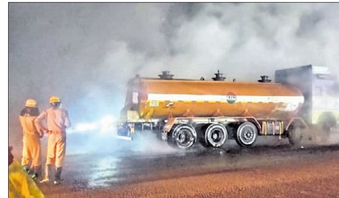
ଅଗ୍ନିଶମ କର୍ମଚାରୀମାନେ ଟ୍ୟାଙ୍କର ଉପରକୁ ପାଣି ସ୍ତ୍ରୋ କରୁଛନ୍ତି।