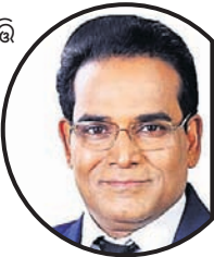
ବିବିଏସ୍ ଦ୍ୱାଦଶ ଫଳ ମୂଲ୍ୟାୟନ ସତ୍ୟପାଠ ପ୍ରସଙ୍ଗ

ଭୁବନେଶ୍ୱର, ୧୭।୬ ଦେଶରେ କୋଭିଡ୍ ସଂକ୍ରମଣ ଯୋଗୁଁ ଶିକ୍ଷା ବ୍ୟବସ୍ଥା ବେଶ୍ ପ୍ରଭାବିତ ହୋଇଛି। ୨୦୧୯-୨୧ ଶିକ୍ଷାବର୍ଷର କେନ୍ଦ୍ରୀୟ ପାଠପଢ଼ାଠାରୁ ଆରମ୍ଭ କରି ପରୀକ୍ଷାଫଳକୁ ନେଇ ଏବେବି ଚିନ୍ତିତ ରହିଛନ୍ତି। ଏଭଳି ସ୍ଥିତିରେ ପୁସ୍ତିକାକୋର୍ସ୍ ନିର୍ଦ୍ଦେଶକ୍ରମେ ଗୁରୁବାର ଛାତ୍ରାଛାତ୍ରୀଙ୍କ ପରୀକ୍ଷାଫଳକୁ ମୂଲ୍ୟାୟନ କିପରି ରହିବ ସେନେଇ ବିବେଚନା ପାଇଁ ସମସ୍ତଙ୍କୁ ସତର୍କ କରିବାକୁ କରାଯାଇଛି।