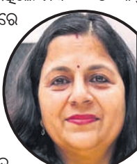
ଶୀଘ୍ର ଫଳ ପ୍ରକାଶ ପାଉ

ଭୁବନେଶ୍ୱର, ୧୭।୬ ଶୀଘ୍ର ଫଳ ପ୍ରକାଶ ପାଉ ବୋଲି ସମସ୍ତଙ୍କୁ ଅନୁରୋଧ କରାଯାଇଛି। ଶୀଘ୍ର ଫଳ ପ୍ରକାଶ ପାଉ ବୋଲି ସମସ୍ତଙ୍କୁ ଅନୁରୋଧ କରାଯାଇଛି।