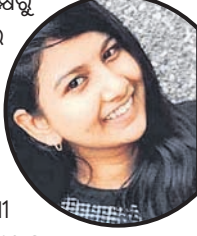
ଏଣ୍ଟ୍ରୀ ପାଇଁ ସମୟ ମିଳିବ

ଭୁବନେଶ୍ୱର, ୧୭।୬ ଏଣ୍ଟ୍ରୀ ପାଇଁ ସମୟ ମିଳିବ ବୋଲି ସମସ୍ତଙ୍କୁ ଅନୁରୋଧ କରାଯାଇଛି। ଏଣ୍ଟ୍ରୀ ପାଇଁ ସମୟ ମିଳିବ ବୋଲି ସମସ୍ତଙ୍କୁ ଅନୁରୋଧ କରାଯାଇଛି।