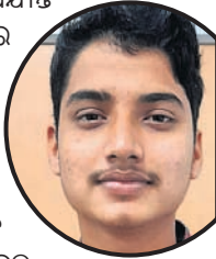
ପିଲାଙ୍କ ଭବିଷ୍ୟତକୁ ଚିନ୍ତା କରାଯାଉ

ଭୁବନେଶ୍ୱର, ୧୭।୬ ପିଲାଙ୍କ ଭବିଷ୍ୟତକୁ ଚିନ୍ତା କରାଯାଉ ବୋଲି ସମସ୍ତଙ୍କୁ ଅନୁରୋଧ କରାଯାଇଛି। ପିଲାଙ୍କ ଭବିଷ୍ୟତକୁ ଚିନ୍ତା କରାଯାଉ ବୋଲି ସମସ୍ତଙ୍କୁ ଅନୁରୋଧ କରାଯାଇଛି।