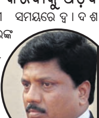
ନିଷ୍ପତ୍ତିକୁ ଗ୍ରହଣ କରିବାକୁ ପଡ଼ିବ

ଭୁବନେଶ୍ୱର, ୧୭।୬ ନିଷ୍ପତ୍ତିକୁ ଗ୍ରହଣ କରିବାକୁ ପଡ଼ିବ ବୋଲି ସମସ୍ତଙ୍କୁ ଅନୁରୋଧ କରାଯାଇଛି। ନିଷ୍ପତ୍ତିକୁ ଗ୍ରହଣ କରିବାକୁ ପଡ଼ିବ ବୋଲି ସମସ୍ତଙ୍କୁ ଅନୁରୋଧ କରାଯାଇଛି।