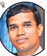
ଦୁଇ ଦୂର ହୋଇଛି

ଭୁବନେଶ୍ୱର, ୧୭।୬ ଦୁଇ ଦୂର ହୋଇଛି ବୋଲି ସମସ୍ତଙ୍କୁ ଅନୁରୋଧ କରାଯାଇଛି। ଦୁଇ ଦୂର ହୋଇଛି ବୋଲି ସମସ୍ତଙ୍କୁ ଅନୁରୋଧ କରାଯାଇଛି।