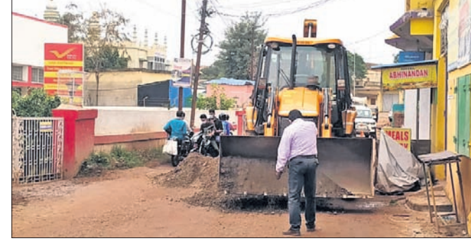
ପୋଷ୍ଟ ଅଫିସ୍ ରାସ୍ତା ମରାମତି କରାଯାଇଛି।

ରାସ୍ତା ଶୋଚନୀୟ ହୋଇପଡ଼ିଥିଲା। ଏବେକାର ଗତ ୧୬ ତାରିଖରେ 'ଧରତ୍ରୀ'ରେ ନିଶାସନ ହୋଇ ପାଉଁ ନ ଥିବାରୁ ରାସ୍ତାରେ କୃତ୍ରିମ ହ୍ରଦ ଭୂମି ସୃଷ୍ଟି ହେବା ସହ ଲୋକଙ୍କ ଘରେ ପାଣି ପଶିଥିବା ନିଜର ରହିଛି। ଦୁଇ ଓ ଚାରିକିଆ ଯାନ ଚଳାଚଳ ପାଇଁ ପୋଷ୍ଟ ଅଫିସ୍ ଛକକୁ ଗନ୍ଧପୁର (ପ୍ରସ୍ଥା), କୋର୍ଟ ଦେଇ ରେଳବାଇ କଲୋନୀ ଦେଇ ଯାତାୟାତ କରୁଛନ୍ତି। ଅଣାପାଣିରୁ ରାସ୍ତା ପାଇଁ ଗ୍ରାମିକ ଗାମ ହେବାରୁ ଲୋକେ ହଲବାଣି ହେଉଛନ୍ତି। ଉକ୍ତ ସ୍ଥାନରେ ଗ୍ରାମିକ ନିୟନ୍ତ୍ରଣ ପାଇଁ ପୋଲିସ୍ ପୂର୍ବଦିନ କରାଯିବାରୁ ରାସ୍ତାରେ ଭାରିପାତ ଚଳାଚଳ କରିବାକୁ ପାଇଁ ସାଧାରଣରେ ଦାବି ହେଉଛି।