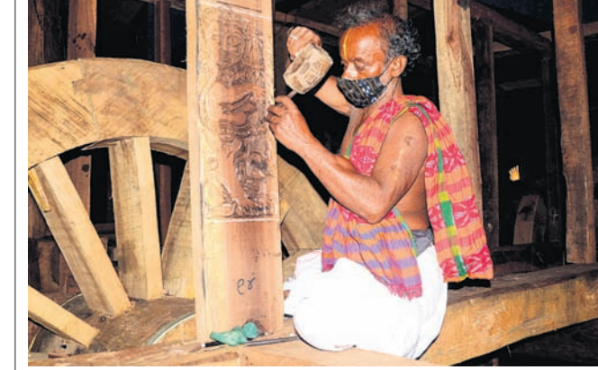
ରଥ ପଟାଗୁଜରେ ଜଣେ ସେବକ ରୂପ ଖୋଦେଇ କରୁଛନ୍ତି ।

ପୁରୀ ଅର୍ପିତ, ୧୭୬୬: ଚାଳଧିକ ଓ ନନ୍ଦିଘୋଷ ରଥରେ ଗୁରୁବାର ଆଉ ଦୁଇଟି ଦେଖାଏ ଛନ୍ଦା ଗଢ଼ନ ପଡ଼ିଛି ।