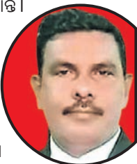
ଫଳଠାରୁ ମାର୍କ ପ୍ରତିଶତ ବଡ଼

ଭୁବନେଶ୍ୱର, ୧୭।୬ ଫଳଠାରୁ ମାର୍କ ପ୍ରତିଶତ ବଡ଼ ବୋଲି ସମସ୍ତଙ୍କୁ ଅନୁରୋଧ କରାଯାଇଛି। ଫଳଠାରୁ ମାର୍କ ପ୍ରତିଶତ ବଡ଼ ବୋଲି ସମସ୍ତଙ୍କୁ ଅନୁରୋଧ କରାଯାଇଛି।