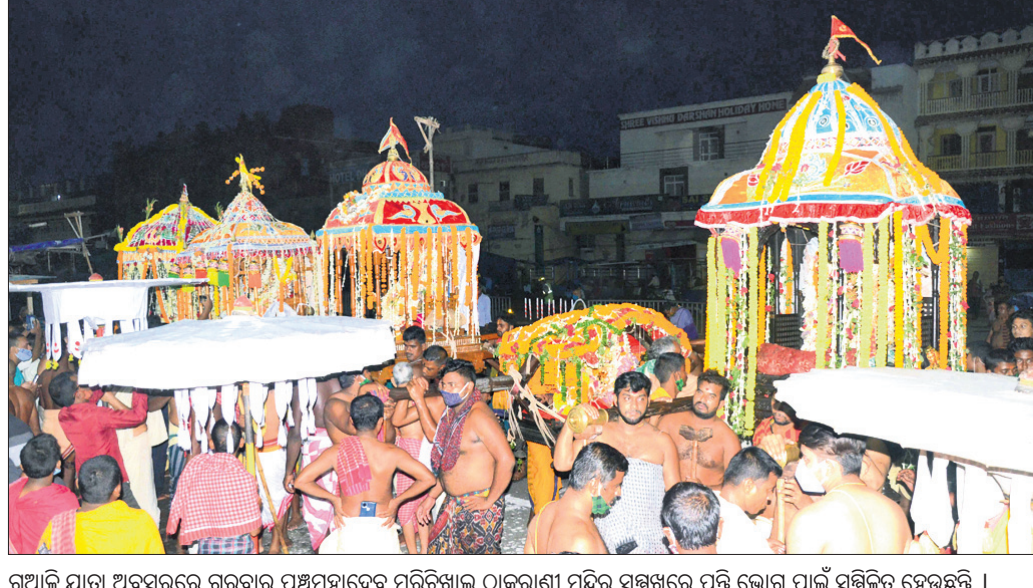
ଗୁଆଳି ଯାତ୍ରା ଅବସରରେ ଗୁରୁବାର ପଞ୍ଚମହାଦେବ ମରିଚିଆଳ ଠାକୁରାଣୀ ମନ୍ଦିର ସମ୍ମୁଖରେ ପଡ଼ି ଭୋଗ ପାଇଁ ସଜ୍ଜିତ ହେଉଛନ୍ତି ।

ସର୍ବାଧିକ ୨.୨୮ କୋଟି, ଉତ୍କଳରେ ୩୫ ଲକ୍ଷ ୮୧ ହଜାର, ମୟୂରଭଞ୍ଜରେ ୨୫ ଲକ୍ଷ ୯ ହଜାର, ଜଗତସିଂହପୁରରେ ୨୫ ଲକ୍ଷ ୯୯ ହଜାର ଡ଼ୋଲର ୨୧ ଲକ୍ଷ ୮୮ ହଜାର ଟଙ୍କା ପୁରାତନ ଛାତ୍ରାଛାତ୍ରୀମାନେ ପ୍ରଦାନ କରିଛନ୍ତି ।