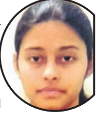
ଭବିଷ୍ୟତକୁ ଦେଖି ନିଷ୍ପତ୍ତି ନିଆଯାଉ

ଭୁବନେଶ୍ୱର, ୧୭।୬ ଭବିଷ୍ୟତକୁ ଦେଖି ନିଷ୍ପତ୍ତି ନିଆଯାଉ ବୋଲି ସମସ୍ତଙ୍କୁ ଅନୁରୋଧ କରାଯାଇଛି। ଭବିଷ୍ୟତକୁ ଦେଖି ନିଷ୍ପତ୍ତି ନିଆଯାଉ ବୋଲି ସମସ୍ତଙ୍କୁ ଅନୁରୋଧ କରାଯାଇଛି।