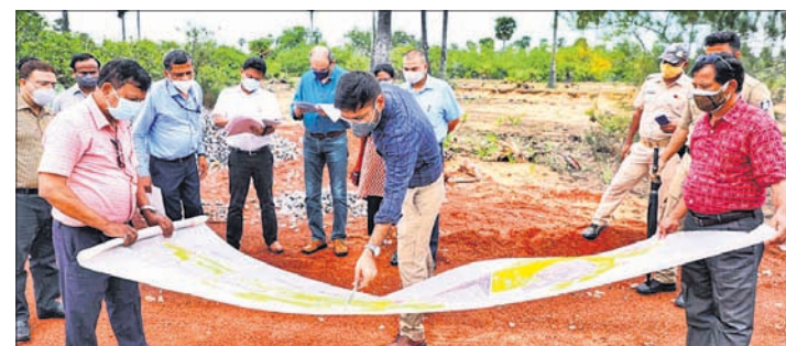
ପ୍ରସ୍ତାବିତ ସ୍ଥାନ ଦେଖିଲା କେନ୍ଦ୍ରୀୟ ଟିମ୍

ଭୁବନେଶ୍ୱର, ୧୭।୬ ପ୍ରସ୍ତାବିତ ସ୍ଥାନ ଦେଖିଲା କେନ୍ଦ୍ରୀୟ ଟିମ୍ ବୋଲି ସମସ୍ତଙ୍କୁ ଅନୁରୋଧ କରାଯାଇଛି। ପ୍ରସ୍ତାବିତ ସ୍ଥାନ ଦେଖିଲା କେନ୍ଦ୍ରୀୟ ଟିମ୍ ବୋଲି ସମସ୍ତଙ୍କୁ ଅନୁରୋଧ କରାଯାଇଛି।