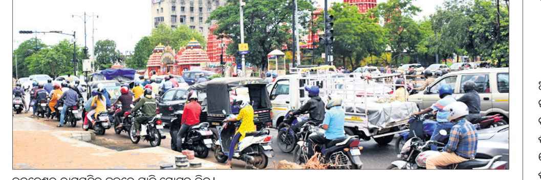
ଭୁବନେଶ୍ୱର ରାମମନ୍ଦିର ଛକରେ ଗାଡ଼ି ମୋଟର ଭିଡ଼।