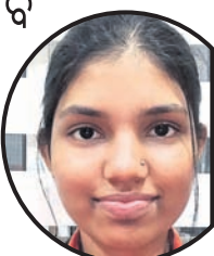
ବିଲମ୍ବ ହେଲେ ବି ସ୍ୱାଗତଯୋଗ୍ୟ

ଭୁବନେଶ୍ୱର, ୧୭।୬ ବିଲମ୍ବ ହେଲେ ବି ସ୍ୱାଗତଯୋଗ୍ୟ ବୋଲି ସମସ୍ତଙ୍କୁ ଅନୁରୋଧ କରାଯାଇଛି। ବିଲମ୍ବ ହେଲେ ବି ସ୍ୱାଗତଯୋଗ୍ୟ ବୋଲି ସମସ୍ତଙ୍କୁ ଅନୁରୋଧ କରାଯାଇଛି।