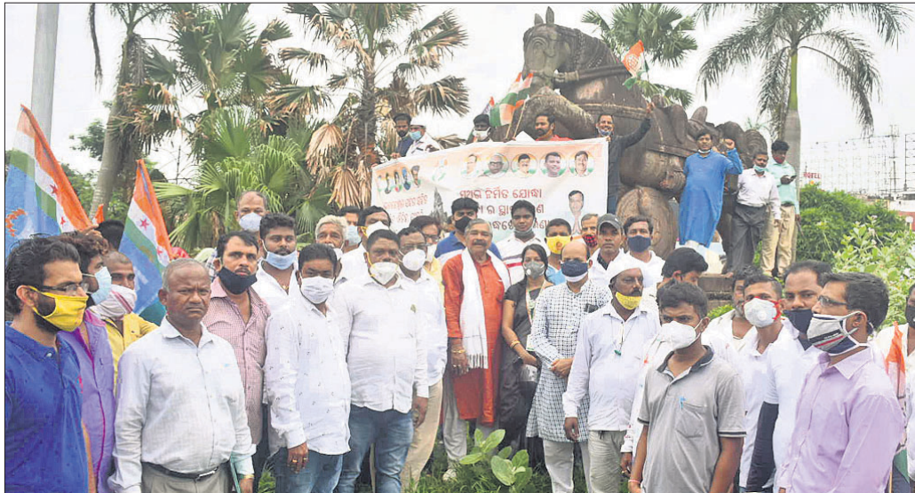
କଂଗ୍ରେସ ପକ୍ଷରୁ ଭୁବନେଶ୍ୱରର ମାଷ୍ଟରକ୍ୟାଣ୍ଟିନ୍ ଛକସ୍ଥିତ ଘୋଡ଼ା ଓ ଯୋଦ୍ଧା ପ୍ରତିମୁକ୍ତି ନିକଟରେ ଦିଆଯାଇଥିବା ଆରଣ୍ୟ।

କଲିମେଳା, ୧୮.୬ (ଡି.ଏନ୍.ଏ.): ମାଲକାନଗିରି ଜିଲ୍ଲା କଲିମେଳା ଅଞ୍ଚଳର ୬ ଜଣ ଆଦିବାସୀ ଶ୍ରମିକ ଦାଦନ ଖଟିବା ପାଇଁ ଆକ୍ରମଣ ପ୍ରଦେଶ ଯାଇ ଯେତେବେଳେ ଏକ ଘରୋଇ କମ୍ପାନୀରେ କାମ କରୁଥିଲେ।