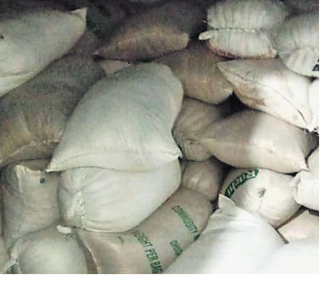
ବିକ୍ରି ହୋଇ ପାଉ ନ ଥିବା ଧାନ।

ଧାନ ବିକ୍ରି ପାଇଁ ନାମ ପଞ୍ଜୀକରଣ କରିଥିଲେ। ହେଲେ ଟୋକନ ଆସିନି।