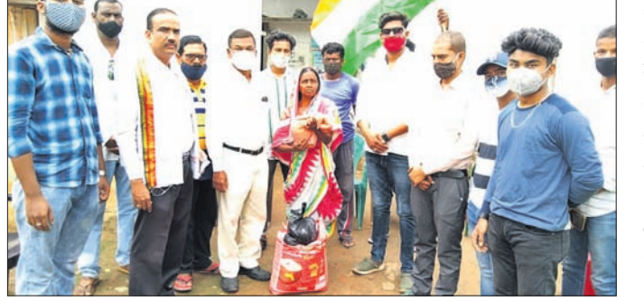
କଂଗ୍ରେସ ପକ୍ଷରୁ ରାଶନ ସାମଗ୍ରୀ ବଣ୍ଟନ କରାଯାଇଛି।

ପାରି ନ ଥିବା କହିଛନ୍ତି। ଟାଟେଟ୍ ପକ୍ଷରେ ୨୭୭୭ ଚାଷୀଙ୍କ ଟୋକନ ଆସି ନ ଥିବା କହିଛନ୍ତି।