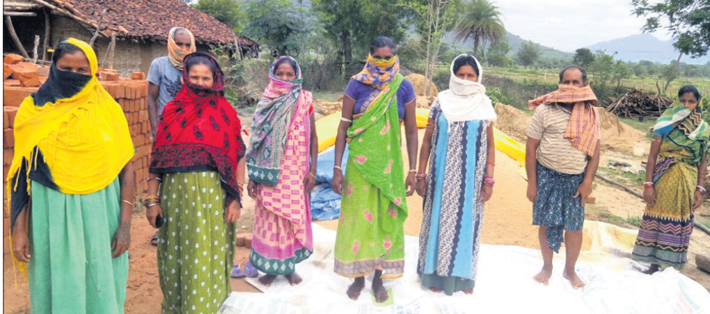
ଧାନ ବିକ୍ରି କରି ନ ପାରିଥିବା ଗୋଲାମୁଣ୍ଡା ଚାଷୀ।

କଳାହାଣ୍ଡି ଜିଲ୍ଲା କୁନାଗଡ଼ ବ୍ଲକ୍ ଗୋଲାମୁଣ୍ଡାରେ ଧାନର ଅଭାବ ବିକ୍ରି ଦେଖିବାକୁ ମିଳିଛି। ଏଠାରେ କେତେକ ଚାଷୀଙ୍କ ମଞ୍ଡି ଖୋଲିବା ପୂର୍ବରୁ ଟୋକନ ଲାସ୍ ହୋଇଥିବାବେଳେ ଆଉ କେତେକ ଚାଷୀଙ୍କ ଟୋକନ ଚଳିତବର୍ଷ ଆସି ନାହିଁ।