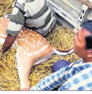
ଉଦ୍ଧାର ହରିଣକୁ ଅଭୟାରଣ୍ୟରେ ଛାଡ଼ିବାକୁ ନିଆଯାଇଛି।

ନୂଆପଡ଼ା ଜିଲ୍ଲା କୋମନା ବ୍ଲକ୍ କୁରେଶ୍ୱର ପଞ୍ଚାୟତର ଉଦ୍ଧାର ହରିଣ ଚିକିତ୍ସା ପରେ ଅଭୟାରଣ୍ୟରେ ଛଡ଼ାଗଲା।