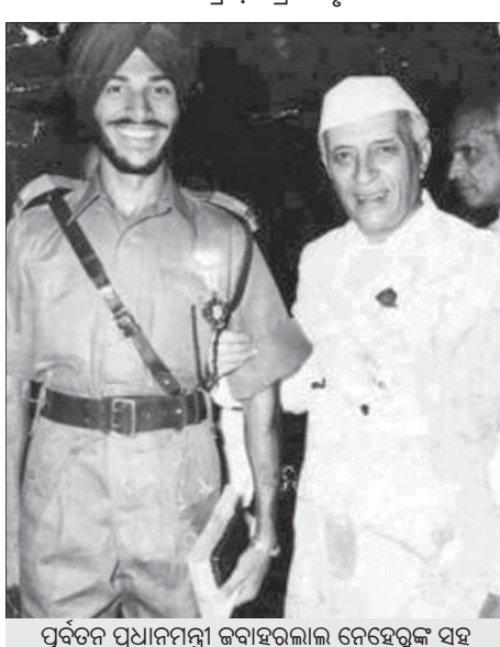
ପୂର୍ବତନ ପ୍ରଧାନମନ୍ତ୍ରୀ ଜବାହରଲାଲ ନେହେରୁଙ୍କ ସହ ଏକ ବିଶେଷ ମୁହୂର୍ତ୍ତରେ।