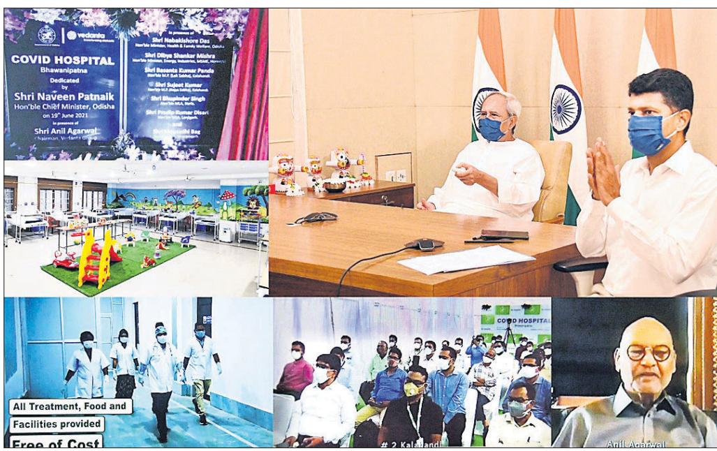
ଶନିବାର ଭିଡିଓ କନ୍ଫରେନ୍ସ କରିଆରେ ଭବନୀପାଟଣାଠାରେ ୨୦୦ ଶଯ୍ୟା ବିଶିଷ୍ଟ କୋଭିଡ୍ ହସ୍ପିଟାଲ ଉଦ୍ଘାଟନ ଅବସରରେ ଉପସ୍ଥିତ ମୁଖ୍ୟମନ୍ତ୍ରୀ ନବୀନ ପଟ୍ଟନାୟକ ଓ ଅନ୍ୟ ଅତିଥିମାନେ।

କରୋନା ମୃତ୍ୟୁ ୩,୫୫୦କୁ ବୃଦ୍ଧି ଆଉ ୩,୪୨୭ ସଂକ୍ରମିତ, ୪୨ ମୃତ। କରୋନା ମୃତ୍ୟୁ ୩,୫୫୦କୁ ବୃଦ୍ଧି ଆଉ ୩,୪୨୭ ସଂକ୍ରମିତ, ୪୨ ମୃତ। କରୋନା ମୃତ୍ୟୁ ୩,୫୫୦କୁ ବୃଦ୍ଧି ଆଉ ୩,୪୨୭ ସଂକ୍ରମିତ, ୪୨ ମୃତ।