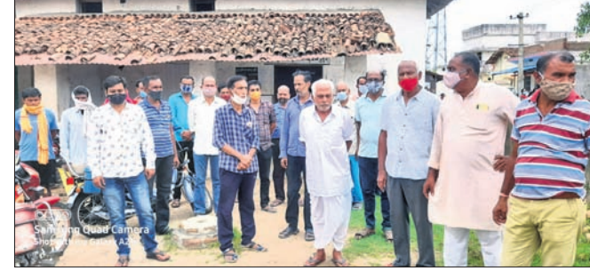
ଚାଷୀମାନେ ତୁଳନା ସମବାୟ ସମିତି ଘେରିଛନ୍ତି।