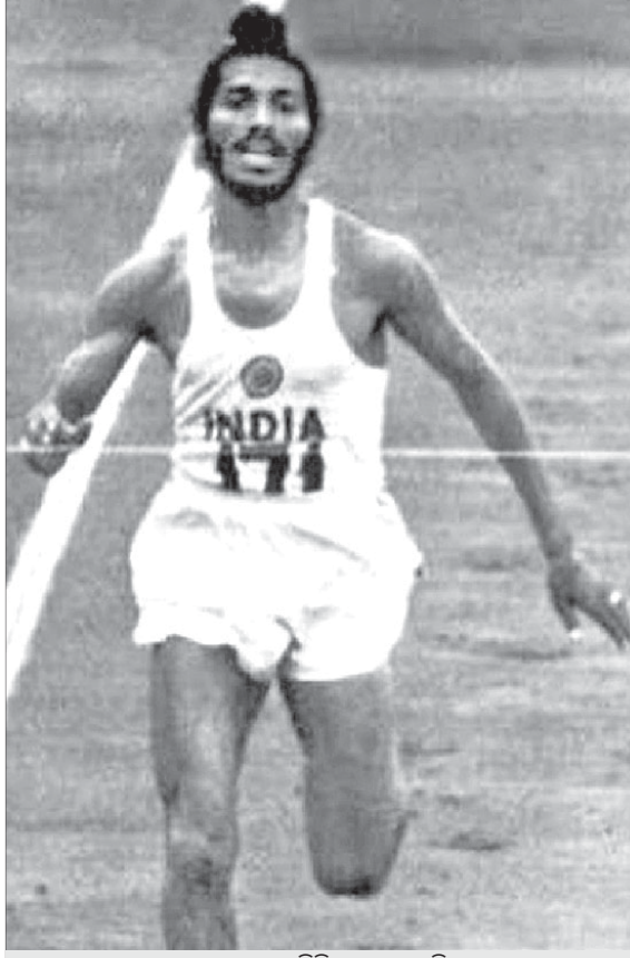
୧୯୬୦ ରୋମ୍ ଅଲିମ୍ପିକ୍ସ ଟ୍ରାକ୍ରେ ମିଲ୍ଖା।

ମୁକ୍ତିଲାଭ କରିବ ବୋଲି ସେ କହିଥିଲେ। ଦେଶ ବିଭାଜନ ବେଳେ ହୋଇଥିବା ଦଙ୍ଗାରେ ସେ ପାକିସ୍ତାନରେ ଥିବା ନାଥାପୁରଠାରେ ରହୁଥିଲେ।