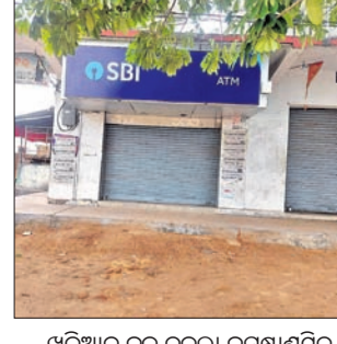
ଖଡ଼ିଆଳ ବ୍ଲକ୍ ତୁଳନା ସମବାୟ ସମିତିରେ ଏଟିଏମ୍ ଅଟଳ ହୋଇ ପଡ଼ିଛି।

ନୂଆପଡ଼ା ଜିଲ୍ଲା ଖଡ଼ିଆଳ ବ୍ଲକ୍ ତୁଳନା ସମବାୟ ସମିତିରେ ପଞ୍ଜୀକୃତ କରିଥିବା ପ୍ରାୟ ୨୭୭୭ ଚାଷୀଙ୍କ ଟୋକନ ଆସି ନାହିଁ।