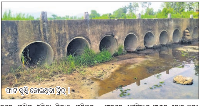
ପୀଟ ସୃଷ୍ଟି ହୋଇଥିବା ବ୍ରିଜ୍।

ବରଗଡ଼ ଜିଲ୍ଲା ପାଇକପାଳ ବ୍ଲକ୍ ମାଣ୍ଡୋସିଲ ଗ୍ରାମପଞ୍ଚାୟତର ତୁମ୍ବେରବାହାଲ ନଦୀ ବ୍ରିଜ୍ରେ ଏକ ପୀଟ ସୃଷ୍ଟି ହୋଇଥିବାବେଳେ ଗମନାଗମନରେ ବିପଦ ଆଶଙ୍କା ରହିଛି।