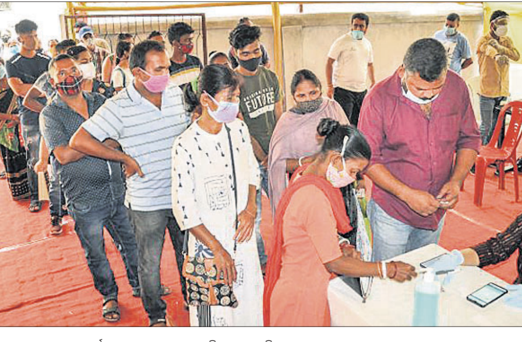
ଆସାମର ରୁଆହାଟ୍ ଅନ୍ତର୍ଗତ ବେଲଗୋଲୀଠାରେ ଏକ ଟିକାକେନ୍ଦ୍ରରେ ହିତାଧିକାରୀଙ୍କୁ ଡୋସ୍ ଲାଗିଲା

ନୂଆଦିଲ୍ଲୀ, ୨୧୨ ସୋମବାରଠାରୁ କେନ୍ଦ୍ର ସରକାରଙ୍କ ନୂଆ ଟିକାକରଣ ନୀତି କାର୍ଯ୍ୟକାରୀ ହୋଇଥିବାବେଳେ ପ୍ରଥମ ଦିନରେ ୪୭ ଲକ୍ଷରୁ ଊର୍ଦ୍ଧ୍ୱ ହିତାଧିକାରୀ କୋଭିଡ୍-୧୯ ଟିକା ନେଇଛନ୍ତି । ଟିକାକରଣ ଆରମ୍ଭ ହେବା ଦିନରୁ ଇତିମଧ୍ୟରେ ଏହା ସର୍ବାଧିକ ଅପରାହ୍ ୪୮୮୦୦ ଟିକା ନେଇଛନ୍ତି ।