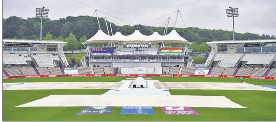
ସାଉଥାସ୍ତନର ରୋକ୍ ବାଉଲ୍ ଗ୍ରାଉଣ୍ଡରେ ଚତୁର୍ଥ ଦିନରେ ବର୍ଷା ରାଜୁତି।

ସାଉଥାସ୍ତନ, ୨୧।୬ ସ୍ଥାନୀୟ ରୋକ ଓଭାଲ ଗ୍ରାଉଣ୍ଡରେ ଭାରତ ଓ ଚୀନ ମଧ୍ୟରେ ଚାଳିଥିବା ବିଶ୍ୱ ଚେଷ୍ଟା ଚାମ୍ପିୟନଶିପ୍ (ଡବ୍ଲ୍ୟୁସିସି) ଫାଇନାଲ ମ୍ୟାଚ୍‌ରେ ବର୍ଷା ଖଳନାୟକ ସାଜିଛି। ପ୍ରଥମ ଦିବସ ଭଳି ଚତୁର୍ଥ ଦିବସରେ ଖେଳ ମଧ୍ୟ ବର୍ଷା ଯୋଗୁ ସମ୍ପୂର୍ଣ୍ଣ ଭାବେ ଧୋଇଯାଇଛି। ସକାଳୁ ବର୍ଷା ଆରମ୍ଭ ହୋଇଥିଲା ଓ ସନ୍ଧ୍ୟା ପର୍ଯ୍ୟନ୍ତ ବନ୍ଦ ହୋଇ ନ