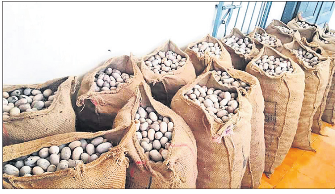
ବାଜିରିପୋଷି ଚସର ସମବାୟ ସମିତିରେ ବିକ୍ରି ନ ହୋଇ ରହିଥିବା ଚସର।