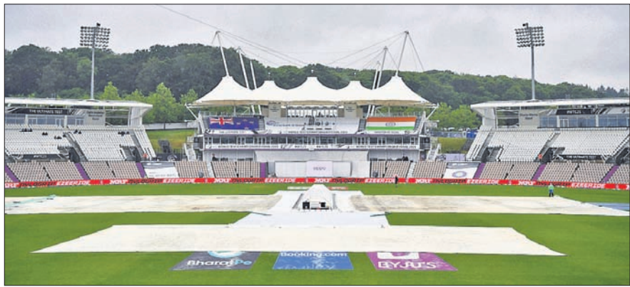
ସାଉଥାମପ୍ଟନର ରୋଲ୍ ବାଉଲ୍ ଗ୍ରାଉଣ୍ଡରେ ଚତୁର୍ଥ ଦିନରେ ବର୍ଷାର ରାଜୁତି।