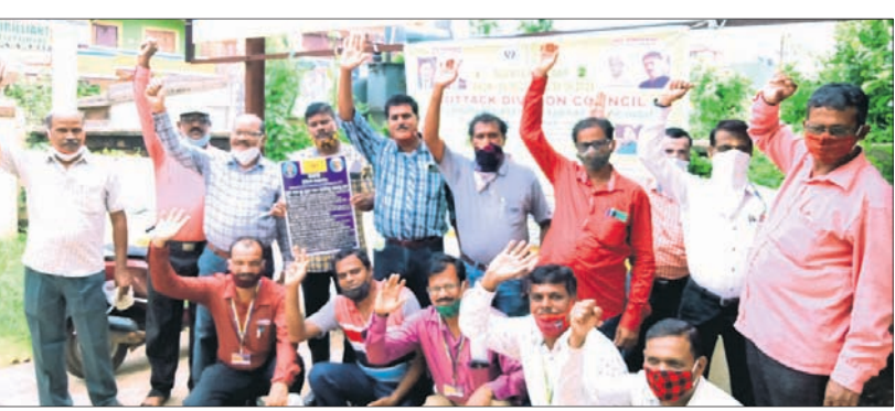
ଜୀବନବାମୀ ଅଭିକର୍ତ୍ତାମାନେ ଧାରଣା ଦେଇଛନ୍ତି।