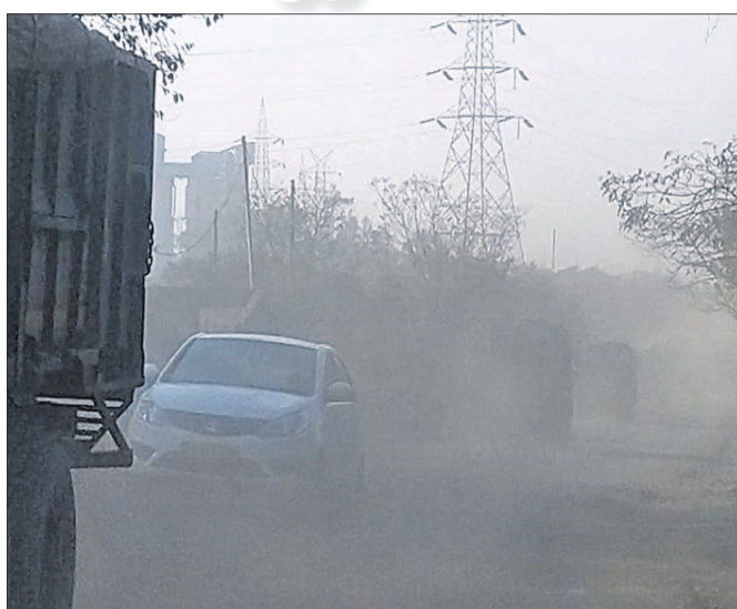
ତାଳଚେର ସହର ଦେଇ ଯାଇଥିବା ୫୩୩୦. କାତାୟ ରାଜପଥରେ କୋଇଲା ଧୂଳି ଓ ଧୂଆଁ ଲୁହୁଡ଼ି ଛାମୁ ସୃଷ୍ଟି କରୁଛି।