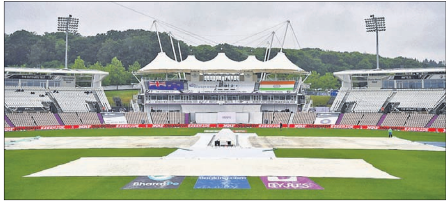
ସାଉଥାମପଟନର ରୋଲ୍ ବାଉଲ୍ ଗ୍ରାଉଣ୍ଡରେ ଚତୁର୍ଥ ଦିନରେ ବର୍ଷାର ରାଜୁତି