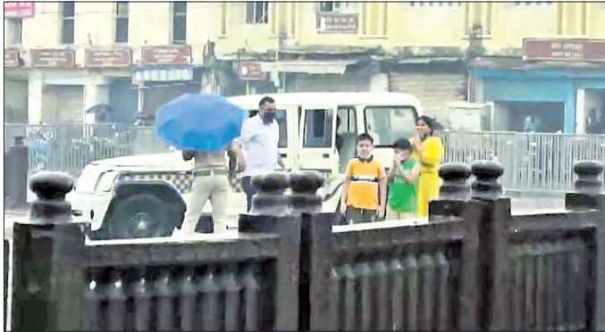
କଟକଟା ଉଲ୍ଲଙ୍ଘନ କରି ଜଣେ ଅଧିକାରୀ ଅରୁଣପୁର ଆଗରେ ଗାଡ଼ି ରଖିଛନ୍ତି ।

କରୋନା କଟକଟା ଲାଗି ଶ୍ରୀମନ୍ଦିର ଦର୍ଶନ ବନ୍ଦ ରହି ଚତୁଃପାର୍ଶ୍ୱ ବ୍ୟାପାରିକେତ ପକାଇ କଡ଼ାକଡ଼ି ଟେକି ଚାଲିଥିବାବେଳେ ସୁରକ୍ଷା କରାଯାଇ ପାରେ ନାହିଁ । ଏକ ଅଭାବନୀୟ ଦୃଶ୍ୟ ଦେଖିବାକୁ ମିଳିଛି । ସୁରକ୍ଷା ବଳୟ ଭାଙ୍ଗି ଏକ ଚାରିଚକିଆ ଯାନ ଅରୁଣପୁର ନିକଟରେ ପହଞ୍ଚିଛି । ସମ୍ପୂର୍ଣ୍ଣ ଗାଡ଼ିରେ କେହି ଜଣେ ଅଧିକାରୀ ନିଜ ପରିବାର ସହ ଆସି ଅରୁଣପୁର ନିକଟରେ ଗାଡ଼ି ରଖି ପଡ଼ିତପାଦନକୁ ଦର୍ଶନ କରିଛନ୍ତି । ଅରୁଣପୁର ନିକଟକୁ ଉଆଇପି ଓ ଭିଜିଆଇପିକ ଗାଡ଼ି ଆସୁ ନ ଥିବାବେଳେ ସମ୍ପୂର୍ଣ୍ଣ ଅଧିକାରୀଙ୍କ ଗାଡ଼ି କିଭଳି ଭାବେ ଗଲା ସେନେଇ ପରିବାର ଗାଡ଼ିକୁ ଓହ୍ଲାଇ ଅରୁଣପୁର ଯାଆରଣରେ ପ୍ରଶ୍ନ ଉଠୁଛି । ସେହିଭଳି ଚାରିଚକିଆ ଯାନକୁ ଅରୁଣପୁର ପର୍ଯ୍ୟନ୍ତ ଆସିବାକୁ କିଏ ଅନୁମତି ଦେଲେ ଓ ଦାୟିତ୍ୱରେ ଥିବା ପୋଲିସ୍ ଅଧିକାରୀ ଏବଂ କର୍ମଚାରୀମାନେ କାହିଁକି ଅଟକାଇଲେ ନାହିଁ ବୋଲି ପ୍ରଶ୍ନ ହେଉଛି । ଘଟଣା ଅନୁଯାୟୀ, ମଙ୍ଗଳବାର ସକାଳ ୧୧ଟା ୩୦ ମିନିଟ୍ରେ ପୋଲିସ୍