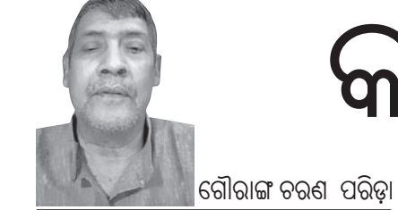
ରୌରାଜ ଚରଣ ପରିଡ଼ା

କି ରୋନା ମହାମାରୀରେ ମୃତ୍ୟୁସଂଖ୍ୟାକୁ ନେଇ ଏବେ ସବୁଠି ବେଶ ଚର୍ଚ୍ଚା । ଏ ସଂଖ୍ୟା ନେଇ ସରକାର ହିସାବ ଠିକ୍ ନୁହେଁ ବୋଲି ଅନେକେ ଅଭିଯୋଗ ଥାନ୍ତି । ଶୁଣାନରେ ଶବ ସଜ୍ଜାର ଏବଂ ନଦୀରେ ଭାସି ଯାଉଥିବା ମୃତକଙ୍କ ଦୃଶ୍ୟ ଏ ଅଭିଯୋଗର ଆଧାର ବୋଲି କୁହାଯାଉଛି । ଏ ପ୍ରଶ୍ନ ମଧ୍ୟ ଆସିଲାଣି, ଯେଉଁଠି ମଲା ମଣିଷକ ଠିକ୍ ହିସାବ ଦିଆଯାଇପାରୁନି, ସେଠି ନାଗରିକଙ୍କ ପରିଚୟପତ୍ର ଲୋଡ଼ିବା କେତେଦୂର ଦରକାର ! ଏବେ ଖାଲି ଏକ ଅଭିଯୋଗର ପ୍ରଶ୍ନ ନୁହେଁ, ଏହା ବି ଏକ ଆବେଗର ପ୍ରଶ୍ନ । ବିହାର ସରକାର ସମ୍ପ୍ରତି କରୋନା ମୃତ୍ୟୁର ଏକ ସଂଖ୍ୟାଧିତ ତାଲିକା ଦେଲେଣି । ପୂର୍ବରୁ ଯେତିକି ମୃତକଙ୍କ ସଂଖ୍ୟା ଥିଲା, ଏଥିରେ ଆଉ ଚାରି ହଜାର ଅଧିକ ବଢ଼ିଛି । ଏହା ସେଠାରେ ଏକ ସ୍ୱତନ୍ତ୍ର ଅତିବହୁ ଜଣାପଡ଼ିଛି । ପ୍ରକାଶପାଠକ କି, ମୃତକଙ୍କ ପୁନଃ ଗଣନା କରିବାକୁ ପାଟଣା ଉଚ୍ଚ ନ୍ୟାୟାଳୟ ବିହାର ସରକାରଙ୍କୁ ନିର୍ଦ୍ଦେଶ ଦେଇଥିଲେ । ଗଙ୍ଗାନଦୀରେ ଭାସୁଥିବା ଶବ ଶବ ଶବଙ୍କ ପରିଚୟ ପାଇଁ ଏକ ଜନସଂଘୀ ମାମଲା କୋର୍ଟରେ ଦାଖଲ ହୋଇଥିଲା । ଭାରତରେ କରୋନା ସଂକ୍ରମଣ ସଂଖ୍ୟା ଏବଂ ତଜନିତ ମୃତ୍ୟୁ ପୃଥକପାରି ବି ନକରରେ ଅଛି । କାରଣ କରୋନା ମହାମାରୀର ପ୍ରଭାବ କୌଣସି ନିର୍ଦ୍ଦେଶ ଅଞ୍ଚଳରେ ସାମାନ୍ୟ ନୁହେଁ, ହୋଇ ବି ପାରିବନି । କାରଣ ଏହା ଏକ ବିଶ୍ୱ ମହାମାରୀ । ସ୍ୱୟଂ ଚାଳିତ ଶବ ସଜ୍ଜା ଖବରକାରକର ଏକ ରିପୋର୍ଟରେ କୁହାଯାଇଛି, ଭାରତରେ କରୋନା ସଂକ୍ରମଣ ଓ ମୃତକଙ୍କ ସଂଖ୍ୟା ଭାରତର ସରକାରୀ ହିସାବଠାରୁ କମି ଅଧିକ । ସଂକ୍ରମଣର ସଂଖ୍ୟା ଏଠି ପ୍ରାୟ ତାଳିକା କୋଟି ଏବଂ ମୃତ୍ୟୁସଂଖ୍ୟା ବୟାଳିକ ଲକ୍ଷ ହୋଇପାରେ । ରିପୋର୍ଟରେ ଏ କଥା ବି ଅଛି, ଭାରତର ଗ୍ରାମାଞ୍ଚଳରେ କରୋନାରେ ମୃତ୍ୟୁବରଣ କରୁଥିବା ଲୋକଙ୍କ ସଂଖ୍ୟା ହିସାବକୁ ନିଆ ଯାଇପାରୁନି । ଗାଁ ଲୋକ ନିଜ ଆତ୍ମୀୟଙ୍କ ଦେହାନ୍ତ କରୋନାରେ ହୋଇଛି ବୋଲି କହିବାକୁ ଭୟ ଆଉ ଲଜା ଅନୁଭବ କରୁଛନ୍ତି । ଭାରତରେ ପ୍ରାୟ ସାତେ ଛ' ଲକ୍ଷ ଗାଁ ଅଛି । ଦେଶର ସବୁଠି ଭାଗ ଲୋକ