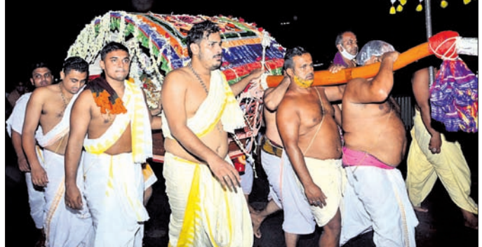
ମହାପ୍ରଭୁଙ୍କ ବିବାହ ପରେ ସେବାୟତମାନେ ଶ୍ରୀମନ୍ଦିରକୁ ଗୁଆଲି ଯାତ୍ରାରେ ନେଇଛନ୍ତି ।

ଶ୍ରୀମନ୍ଦିରରେ ମଙ୍ଗଳବାର ମହାପ୍ରଭୁଙ୍କ ଚମ୍ପକ ଦ୍ୱାଦଶୀ ନୀତି ଅର୍ଥାତ୍ ନବବିବାହିତ ଦେବ ଦମ୍ପତିଙ୍କ ନଗର ପରିକ୍ରମା ବା ଗୁଆଲି ଯାତ୍ରା ସମ୍ପନ୍ନ ହୋଇଛି । ଶ୍ରୀମନ୍ଦିରରେ ମହାପ୍ରଭୁଙ୍କ ସକାଳ ଧୂପ ଓ ଭୋଗମଣ୍ଡପ ଭୋଗ ନୀତି ବଢ଼ିବା ପରେ ଭିତରେ ଆଲଟରନାଟି ହୋଇଥିଲା । ପରେ ତିନି ବାଡ଼ରେ ମହାସ୍ନାନ ନୀତି ବଢ଼ି ନୂଆଲୁଗା ଲାଗି ହୋଇଥିଲା । ଘରୁଆରୀ ଘାରଠାରୁ ପୂଜାପଞ୍ଚା, ପତି ମହାପାତ୍ର ଓ ପୂର୍ବରତ୍ନ ଚନ୍ଦନ ବିଜେ କରାଯାଇ ଶ୍ରୀମନ୍ଦିରକୁ ଶ୍ରୀଅଙ୍ଗରେ ସର୍ବାଙ୍ଗ ଲାଗି ନୀତି କରିଥିଲେ । ପରେ ବେଶ ବଢ଼ି ମହାହୂସ୍ତୁ ହୋଇଥିଲା । ଧୂପ ସାରି ପାଣିପିତୁଣ୍ଡା ପରେ ନବବିବାହିତ ବରକନ୍ୟା ଲକ୍ଷ୍ମୀ ବା ରଞ୍ଜିଣୀ ଓ ମଦନମୋହନ ଭିତରକୁ ବିଜେ ହୋଇଥିଲେ । ଭିତରେ ବନ୍ଦନା ଆପରାଧକ ମାମଲା ଥିବା ଜଣାପଡ଼ିଛି ।