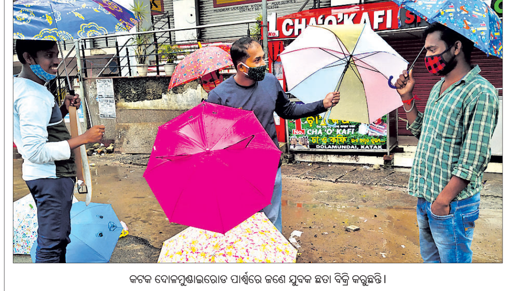
କଟକ ବୋଲିପୁଲ୍‌ଲୋଡ଼ରେ ପାର୍ଶ୍ୱରେ କଣେ ଯୁବକ ଛତା ବିକ୍ରି କରୁଛନ୍ତି।

ମଧ୍ୟରେ କ୍ରୀଡା ପ୍ରତି ଆଗ୍ରହ ରହିଛି। ସ୍ଥାନୀୟ ଅଞ୍ଚଳର ବହୁ କୋଲି ରାଜ୍ୟ ତଥା ଦେଶର ଚେକ ରଖିଛନ୍ତି।