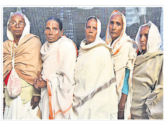
ଅଧିକାଂଶ ବିଧବା ଦିବସ ପାଳନ କରୁଥିବା ମହିଳାମାନଙ୍କୁ ଏକାଠି ମଣିଷ କରିବା ସେମାନଙ୍କ ପକ୍ଷେ କଷ୍ଟକର ହୋଇପଡ଼ୁଛି। ତେଣୁ ଏଭଳି ମୈତ୍ରୀତ୍ୱ ଉପରେ ଆଲୋଚନା କରାଯାଇଥିଲା।

ସାଥୀ ବିନା ଜୀବନ ଶବ୍ଦରେ ଅବସ୍ଥାନ। ସେହି ଅନୁଭୂତି ଦୁଃଖକୁ ଆଜ୍ଞାପନ ବୋଧି ଚାଲିଥିବା ଜଣେ ମହିଳାଙ୍କ ବର୍ତ୍ତମାନ ଓ ଭବିଷ୍ୟତ ସ୍ୱରୂପ, ସହଜ କରିବା ଉଦ୍ଦେଶ୍ୟରେ ପ୍ରତିବର୍ଷ ଜୁନ୍ ୨୩ରେ ପାଳନ ହୋଇଥାଏ ଅନ୍ତର୍ଜାତୀୟ ବିଧବା ଦିବସ।