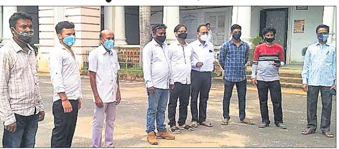
ଗାନ୍ଧିଜୀଙ୍କ ଫଟୋକୁ ନେଇ ପ୍ରତିବାଦ ।

ଦେଶାନ୍ତ ଅଫିସ, ୨୨।୬ ଦେଶାନ୍ତ ମଧ୍ୟରୁ ବସନ୍ତାନ୍ତ ନିକଟସ୍ଥ ଗାନ୍ଧିଜୀଙ୍କ ପାଟେରିରେ ଅଙ୍କାଯାଇଥିବା ଗାନ୍ଧିଜୀଙ୍କ ବିକୃତ ଫଟୋଟିକୁ ନେଇ ତୀବ୍ର ପ୍ରତିକ୍ରିୟା ପ୍ରକାଶ ପାଇଛି । ଆଇନକାରୀ ପ୍ରକାଶତନ୍ତ୍ର ରାଉତଙ୍କ ନେତୃତ୍ୱରେ ଥିବା ଫୋରମ୍ ସଦସ୍ୟମାନେ ଏ ସଂକ୍ରାନ୍ତରେ ଜିଲ୍ଲାପାଳ ଦୃଷ୍ଟି ଆକର୍ଷଣ କରିଛନ୍ତି । ପାଟେରିରେ ଗାନ୍ଧିଜୀଙ୍କ ଅର୍ଦ୍ଧ ଅଙ୍କିତ ଚିତ୍ରକୁ ହଟାଇ ଦୂରତ ପହଞ୍ଚାଇବା ପାଇଁ ଆକାମ୍ବୁକ ଦାବି କରାଯାଇଛି । ଏ ଦିଗରେ ସ୍ଥିର କାର୍ଯ୍ୟପଦ୍ଧା ଗ୍ରହଣ କରାଯିବ ବୋଲି ଜିଲ୍ଲାପାଳ ପ୍ରତିଶ୍ରୁତି ଦେଇଥିବା ଜଣାପଡ଼ିଛି ।