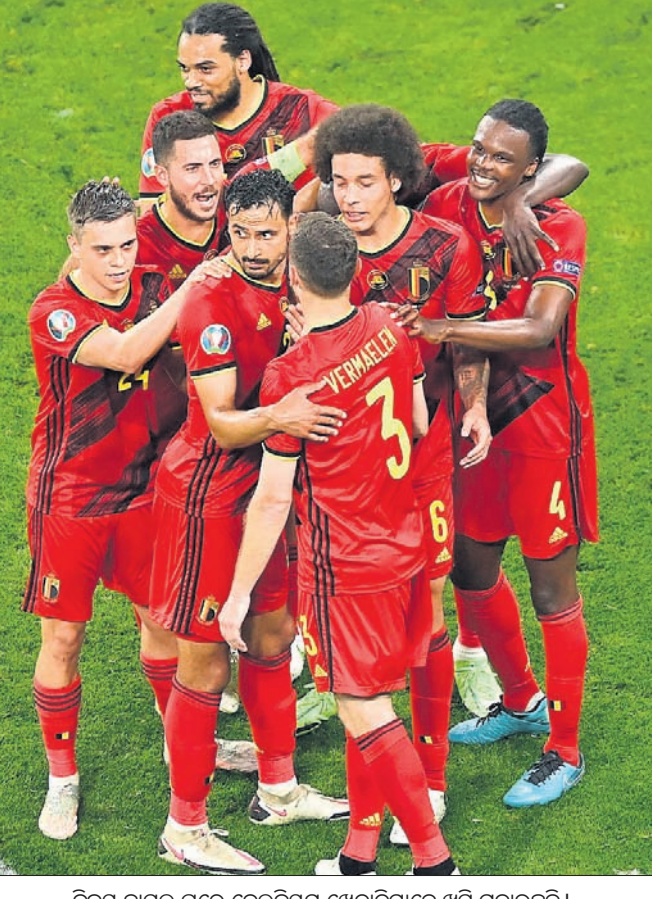
ବିଜୟ ହାସଲ ପରେ ବେଲ୍‌ଜିୟମ ଖେଳାଳିମାନେ ଖୁସି ମନାଉଛନ୍ତି।

ଏ ଓ ଗ୍ରୁପ୍ ବି'ରେ ସବୁ ମ୍ୟାଚ୍ ଜିତି ୯ ପଏଣ୍ଟ ହାସଲ କରି ନକ୍‌ଆଉଟ୍ ପର୍ଯ୍ୟାୟରେ ପ୍ରବେଶ କରିଛନ୍ତି। ଅନ୍ୟପଟେ ପରାଜୟ ସହ ଫିନ୍‌ଲ୍ୟାଣ୍ଡ ୩ଟି ମ୍ୟାଚ୍ ଖେଳି ଗୋଟିଏ ବିଜୟ ଓ ଦୁଇଟି ପରାଜୟ ସହ ୩ ପଏଣ୍ଟ ହାସଲ କରି ଚାଲିକାର ତୃତୀୟ ସ୍ଥାନରେ ରହିଛି। ଏବେ ଫିନ୍‌ଲ୍ୟାଣ୍ଡ ନକ୍ ଆଉଟକୁ ଉଠିବାର ସମ୍ଭାବନା କମ୍ ରହିଛି। ବିଜିତ ଗ୍ରୁପ୍ରେ ତୃତୀୟ ସ୍ଥାନ ଅଧିକାର କରିବାକୁ ଥିବା ଶ୍ରେଷ୍ଠ ଦଳଗୁଡ଼ିକ ମଧ୍ୟ ନକ୍ ଆଉଟ୍ ପ୍ରବେଶ କରିବେ। ଫିନ୍‌ଲ୍ୟାଣ୍ଡ ବିପକ୍ଷରେ ବେଲ୍‌ଜିୟମ