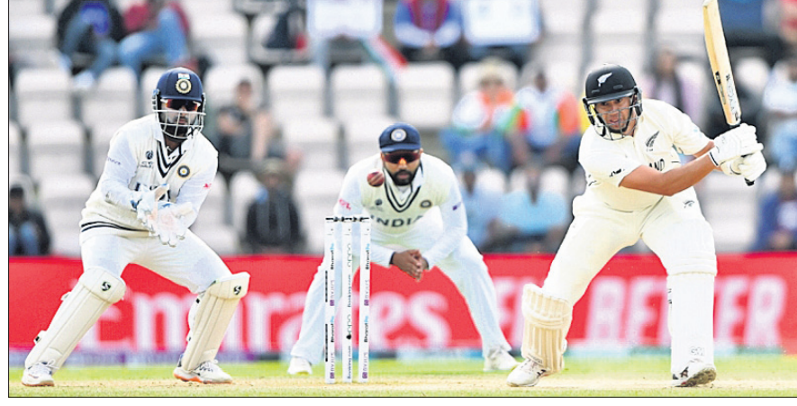
ଏକଦିନୀୟ ଟେଷ୍ଟ ମ୍ୟାଚରେ ଖେଳୁଥିବା ଖିଳାଳୀମାନଙ୍କର ଚିତ୍ର।