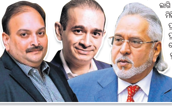
ମେହୁଲ ଚୋକ୍ଷି, ନୀରବ ମୋଦି ଏବଂ ବିଜୟ ମାଲ୍ୟା ।

ମାଲ୍ୟାଗୁଡ଼ିକରେ ସମ୍ପୂର୍ଣ୍ଣ ଶେୟାର ବିକ୍ରି ୧୩୫୭ କୋଟି ଟଙ୍କା ଆଦାୟ କରିଛନ୍ତି। ଜବତ ସମ୍ପତ୍ତି ବିକ୍ରିରୁ ୯୦୪୧ କୋଟି ଟଙ୍କା ବ୍ୟାଙ୍କ ଫେରିପାଇବେ। ଏହି ଅଭିଯୁକ୍ତ ବ୍ୟକ୍ତିଗଣଙ୍କ ଜାଲ୍ କମ୍ପାନୀ ଦ୍ୱାରା ବ୍ୟାଙ୍କଗୁଡ଼ିକର ଅର୍ଥକୁ ହେରଫେର କରିବାକୁ ସମ୍ଭାବ୍ୟ ହୋଇଥିବା ତଦନ୍ତରୁ ସାମ୍ବାଦ୍ୟ ଆସିଛି। ପ୍ରତ୍ୟର୍ପଣ ଲାଗି ସେମାନେ ରହୁଥିବା ବେଶ୍ଚୁଡ଼ିକ ଅନୁରୋଧ କରାଯାଇଥିବା ଇଡି ପୂର୍ବରୁ ବେଲି। ଉଲ୍ଲେଖଯୋଗ୍ୟ, ମାଲ୍ୟା ଏବଂ ମୋଦି ଲଣ୍ଡନରେ ରହୁଥିବା ବେଳେ ଚୋକ୍ଷି ଆଷ୍ଟ୍ରେଲିଆରେ ରହୁଛନ୍ତି। ବ୍ରିଟେନ ସୁପ୍ରିମକୋର୍ଟରେ ଆବେଦନ କରିବା ଲାଗି ମାଲ୍ୟାଙ୍କୁ ଅନୁମତି ମିଳିନାହିଁ। ତାଙ୍କର ଭାରତ ପ୍ରତ୍ୟର୍ପଣ ନେଇ ଏକ ପ୍ରକାର ବୃତ୍ତାନ୍ତ ହୋଇଛି। ସେହିଭଳି ନୀରବ ମୋଦିଙ୍କ ପ୍ରତ୍ୟର୍ପଣ ପ୍ରକ୍ରିୟା ଶେଷ ପର୍ଯ୍ୟାୟରେ ରହିଛି। ଏହାବଦ୍ଧ ପ୍ରତ୍ୟର୍ପଣ ମାମଲା ବିରୋଧରେ ଚୋକ୍ଷି ଆଷ୍ଟ୍ରେଲିଆରେ ଅ।। ଇ ନ ଗ ତ ମାମଲା ଲଢ଼ୁଛନ୍ତି।