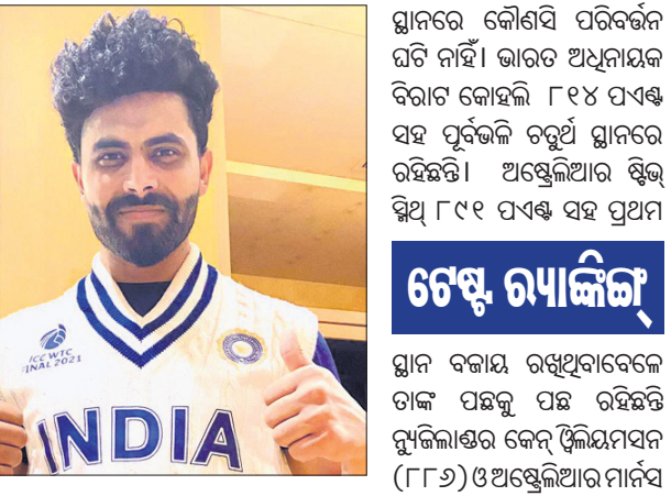
ଘ୍ନାନେଶ୍ୱର କୌଣସି ପରିବର୍ତ୍ତନ ଘଟି ନାହିଁ। ଭାରତ ଅଧିନାୟକ ବିରାଟ କୋହଲି ୮୧୪ ପଏଣ୍ଟ ସହ ପୂର୍ବଭଳି ଚତୁର୍ଥ ଘ୍ନାନେଶ୍ୱର ରହିଛନ୍ତି। ଅଷ୍ଟ୍ରେଲିଆର ଷ୍ଟିଭ୍ ସ୍ମିଥ ୮୯୧ ପଏଣ୍ଟ ସହ ପ୍ରଥମ

ଦେଶ ପ୍ରକାଶିତ ଆଇସିସି ଟେଷ୍ଟ ର୍ୟାଙ୍କିଂରେ ଫେଡ୍ରେସନ୍ର କାସନ ହୋଇଛନ୍ତି। ଭାରତର ରବୀନ୍ଦ୍ର ଜାଡେଜା ବିଶ୍ୱର ନୟର ଓଡ଼ିଆ ଅଲ୍ରାଉଣ୍ଡର ହୋଇଛନ୍ତି। ହୋଇଛନ୍ତି (୩୪୪)କଠାକୁ ଜାତେଜା ୨ ପଏଣ୍ଟ ଆଗରେ ରହିଛନ୍ତି। ଇଂଲଣ୍ଡ ଅଲ୍ରାଉଣ୍ଡର ସେନ୍ସିଟିଭ୍ ଷ୍ଟେସ୍ ୩୭୭ ପଏଣ୍ଟ ସହ ଦ୍ୱିତୀୟ ଘ୍ନାନେଶ୍ୱର ଅଛନ୍ତି। ଅନ୍ୟ ଜଣେ ଭାରତୀୟ ରବିଚନ୍ଦ୍ରନ ଅଶ୍ୱିନ ୩୫୩ ପଏଣ୍ଟ ସହ ଚତୁର୍ଥ ଘ୍ନାନେଶ୍ୱର କରିଛନ୍ତି। ତାଙ୍କ ପଛରୁ ବ୍ୟାଟ୍ସମ୍ୟାନ ଶକିବ ଅଲ୍ ହସନ (୩୩୮) ରହିଛନ୍ତି। ବୋଲିଂ ର୍ୟାଙ୍କିଂରେ କିରୁ ଅଶ୍ୱିନ