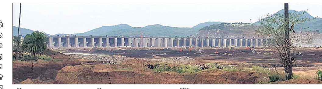
ଉଦିରା ସାଗର ତ୍ୟାମ୍ ପ୍ରକଳ୍ପର ଅଞ୍ଚଳ ଶୁଖିଲା ପଡ଼ିଛି ।

ଅନ୍ୟପକ୍ଷରେ ଭୁବନ ଗୋଦାବରୀରେ ଗଢ଼ିଥିବା ପାଣିକୁ ନିଷ୍କାସନ କରା ନ ଗଲେ ଛତିଶଗଡ଼ ପରେ ମାଲକାନଗିରି ଜିଲ୍ଲାରେ ମୋଟୁ ଅଞ୍ଚଳରେ ବ୍ୟାପକ କ୍ଷତି ଘଟିବ।