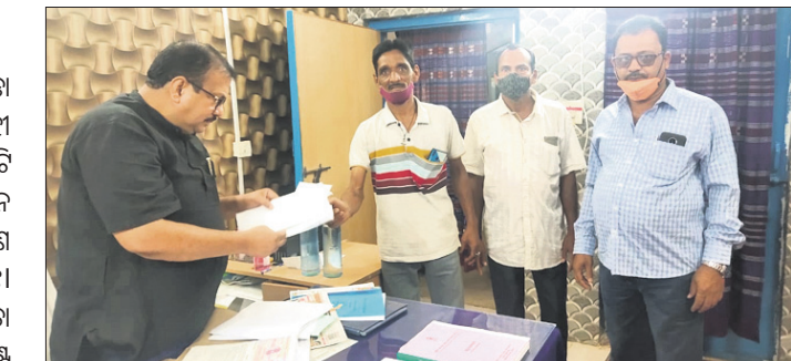
ପୌର ନିର୍ବାହୀ ଅଧିକାରୀ ଦାବିପତ୍ର ଗ୍ରହଣ କରୁଛନ୍ତି।