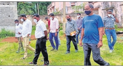
ବିଦ୍ୟାଳୟରେ ଜିଲ୍ଲାପାଳ ବୁଲି ଦେଖିଛନ୍ତି ।