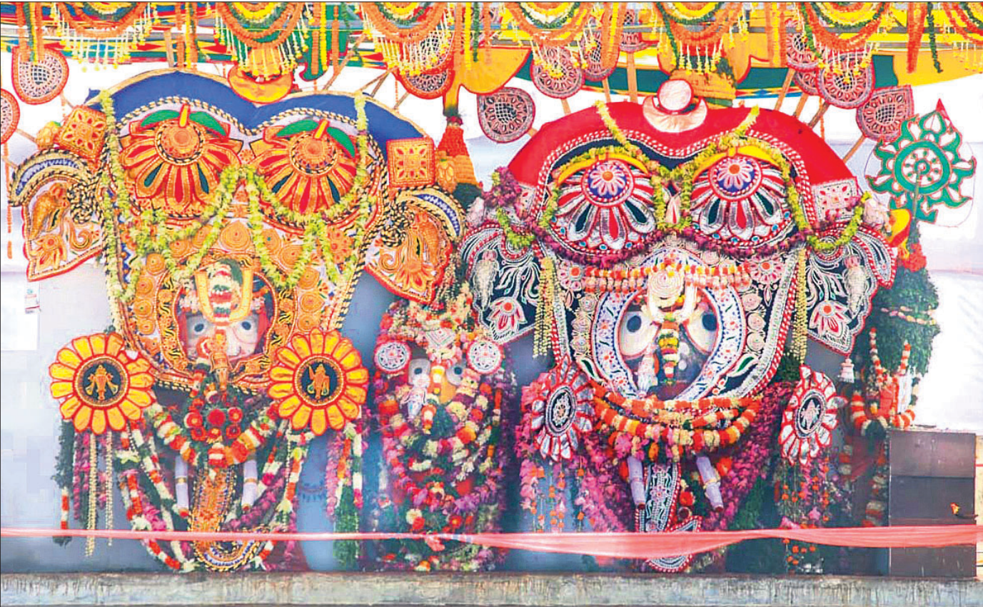
ପବିତ୍ର ବେଦସ୍ନାନ ପୂର୍ଣ୍ଣିମା ଅବସରରେ ଗୁରୁବାର ସ୍ନାନମଣ୍ଡପରେ ମହାପ୍ରଭୁଙ୍କ ହାତୀବେଶ।