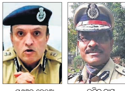
ସମସ୍ତ କେଠ଼ି ଲଳିତ ଦାସ

ଭୁବନେଶ୍ୱର, ୨୪।୬(ବୁଧବେଳା) ଅଧିକାରୀ ଉପାଧିରେ ପରିବର୍ତ୍ତନ ବିଭାଗ କମିଶନର ଭାବେ ନିଯୁକ୍ତ କରାଯାଇଛନ୍ତି। ପୋଲିସ୍ ଓ ଗୃହ ନିର୍ମାଣ (ଓଏସ୍‌ପିଏସ୍‌ଡି) ବିଭାଗରୁ ପଦାଧିକାରୀ ଭାବେ ନିଯୁକ୍ତ କରାଯାଇଛନ୍ତି। ପୂର୍ବରୁ ଗୃହ ବିଭାଗର ସ୍ୱତନ୍ତ୍ର ଅଧିକାରୀ (ଓଏସ୍‌ଡି) ଭାବେ ଅବସ୍ଥାପିତ କରାଯାଇଥିବା ଉପାଧିରେ ପରିବର୍ତ୍ତନ କମିଶନର ଭାବେ ନିଯୁକ୍ତ କରାଯାଇଛନ୍ତି। ପୂର୍ବରୁ ଗୃହ ବିଭାଗର ସ୍ୱତନ୍ତ୍ର ଅଧିକାରୀ (ଓଏସ୍‌ଡି) ଭାବେ ଅବସ୍ଥାପିତ କରାଯାଇଥିବା ଉପାଧିରେ ପରିବର୍ତ୍ତନ କମିଶନର ଭାବେ ନିଯୁକ୍ତ କରାଯାଇଛନ୍ତି। ପୂର୍ବରୁ ଗୃହ ବିଭାଗର ସ୍ୱତନ୍ତ୍ର ଅଧିକାରୀ (ଓଏସ୍‌ଡି) ଭାବେ ଅବସ୍ଥାପିତ କରାଯାଇଥିବା ଉପାଧିରେ ପରିବର୍ତ୍ତନ କମିଶନର ଭାବେ ନିଯୁକ୍ତ କରାଯାଇଛନ୍ତି।