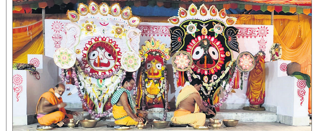
ସ୍ୱାମୀପୂର୍ଣ୍ଣିମା ଅବସରରେ ଦେଶାନ୍ତରୀଣ ବଳରାମ ମନ୍ଦିରରେ ଶ୍ରୀଜୀଉଙ୍କ ସୁନାବେଶ (ଉପର) । ଅନୁଗୋଳ ଶୈଳଶ୍ରୀକ୍ଷେତ୍ରରେ ତିନିଠାକୁରଙ୍କ ହାତୀ ବେଶ।