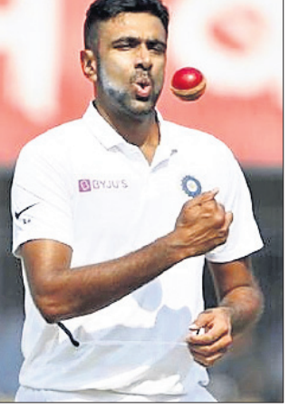
କରିଥିଲା। ଡବ୍ଲୁଟିସିରେ ସେ ୪ଥର ୫ ଉଇକେଟ ସଫଳତା ହାସଲ କରିଛନ୍ତି। ଗୋଟିଏ ଇନିଂସରେ ୧୪୫ ରନ ଦେଇ ୭ ଉଇକେଟ ହାସଲ କରିବା ତାଙ୍କର ଶ୍ରେଷ୍ଠ ପ୍ରଦର୍ଶନ ଥିଲା। ଗୋଟିଏ ଶତକ ହାସଲ କରିବା ସହ ସେ ମୋଟ ଉପରେ ୩୨୪ ରନ ମଧ୍ୟ ସଂଗ୍ରହ କରିଛନ୍ତି। ଏହି କ୍ରମରେ ଅଷ୍ଟ୍ରେଲିଆ ଦୁଇ ବୋଲର ପ୍ୟାଟ୍ କୁମିନ୍ ୧୪ ଚେଷ୍ଟାରେ

୭୦ ଉଇକେଟ ହାସଲ କରି ଦ୍ୱିତୀୟ ସ୍ଥାନରେ ରହିଛନ୍ତି। ସେହିପରି ଇଂଲଣ୍ଡ ଦୁଇ ବୋଲର ଷ୍ଟୁଆର୍ଟ ବ୍ରଡ ୧୭ ଚେଷ୍ଟାରେ ୬୯ ଉଇକେଟ ହାସଲ କରି ଦ୍ୱିତୀୟ ସ୍ଥାନରେ ରହିଛନ୍ତି। ନ୍ୟୁଜିଲାଣ୍ଡ ଦୁଇ ବୋଲର ଟିମ୍ ସୋଡିଓ ଅଷ୍ଟ୍ରେଲିଆ ଷ୍ଟିନର ନାଥନ ଲିନ୍ନ ଉଭୟ ୫୬ଟି ଲେଖାଏ ଉଇକେଟ ହାସଲ କରି ଚତୁର୍ଥ ସ୍ଥାନରେ ରହିଛନ୍ତି। ଅଶ୍ୱିନ ଚେଷ୍ଟାରେ ଭାରତର ଚତୁର୍ଥ ସର୍ବାଧିକ ଉଇକେଟ ହାସଲକାରୀ ବୋଲର ସାବ୍ୟସ୍ତ ହୋଇଛନ୍ତି। ୨୫ ଓ ୩୦ ଉଇକେଟ ନେବାର ସେ ଦୁଇତମ ବୋଲର ବିବେଚିତ ହୋଇଛନ୍ତି। ସେହିପରି ଅଷ୍ଟ୍ରେଲିଆର ମାର୍ଟିନ୍ ଲାଫ୍ଟସନ ସର୍ବାଧିକ ରନ ସଂଗ୍ରହ କରି (୧୩ ମ୍ୟାଚ୍ରେ ୧୬୬୫ ରନ) ବ୍ୟାଟିଂ ଚାଳିକାର ଶୀର୍ଷରେ ରହିଛନ୍ତି। ଭାରତର ଅଭିଜ୍ଞ ରାହାନେ ୧୮ ମ୍ୟାଚ୍ରେ ୧୧୭୪ ରନ ସଂଗ୍ରହ କରି ଚାଳିକାର ପଞ୍ଚମ ସ୍ଥାନରେ ରହିଛନ୍ତି। ଇଂଲଣ୍ଡର କେନ୍ ବ୍ଲୁଇ (୨୦ ମ୍ୟାଚ୍ରେ ୧୬୬୦ ରନ), ଅଷ୍ଟ୍ରେଲିଆର ଷ୍ଟିଭ୍ ବ୍ଲିଥ୍ (୧୩ ମ୍ୟାଚ୍ରେ ୧୩୪୧ ରନ) ଓ ଇଂଲଣ୍ଡର ବେନ୍ ଷ୍ଟୋକ୍ସ (୧୭ ମ୍ୟାଚ୍ରେ ୧୩୩୪ ରନ) ଯଥାକ୍ରମେ ଦ୍ୱିତୀୟ, ତୃତୀୟ ଓ ଚତୁର୍ଥ ସ୍ଥାନରେ ରହିଛନ୍ତି।