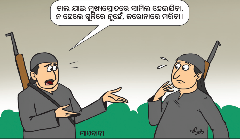
ଗାଲ ଯାଇ ମୁଖ୍ୟସ୍ତ୍ରୋତରେ ସାମିଲ ହେଇଯିବା, ନ ହେଲେ ଗୁଳିରେ ନୁହେଁ, କରୋନାରେ ମରିବ।

ସେମାନେ ନିକଟ ଡ୍ରାମା ମହାବିଦ୍ୟାଳୟରେ ଅନୁଲାଇନ୍‌ରେ ପରୀକ୍ଷା ଦେଇପାରିବେ। ପରୀକ୍ଷା ପୂର୍ବରୁ ଏକ ମନ୍ତ୍ରୀ ସଭା କାର୍ଯ୍ୟକ୍ରମ ବିଷୟରେ ଯୋଜନା କରାଯାଇଛି।