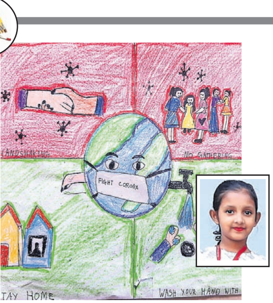
ପ୍ରତିଲିପି ମୁହୁଳି, କ୍ଲାସ୍-୪, କେଜି ଆଇଏନ୍ ଏସ୍, ଚିଲିକା