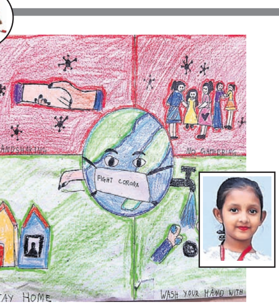
ପ୍ରତିଲିପି ମୁହୁଲି, କ୍ଲାସ୍-୪, କେଜି ଆଇଏନ୍ ଏସ୍, ଚିଲିକା