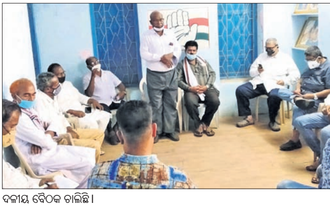
ଦକାୟ ବୈଠକ ଚାଲିଛି।

କନ୍ଦପୁର, ୨୫।୬।(ବି.ପ୍ର.)- ଧ୍ୟାନ ଅଭାବୀ ବିକ୍ରି ଏବଂ ମଣ୍ଡିରେ ବ୍ୟାପକ ଅନିୟମିତତା ପ୍ରତିବାଦରେ ୨୯ରେ କଂଗ୍ରେସ କାଠାୟ ରାସ୍ତା ଅବରୋଧ କରିବ। କନ୍ଦପୁରସ୍ଥିତ କଂଗ୍ରେସ ଭବନରେ ଦଳ ପକ୍ଷରୁ ଅନୁଷ୍ଠିତ ବୈଠକରେ ନିଷ୍ପତ୍ତି ନିଆଯାଇଛି। ଧ୍ୟାନ ଅଭାବୀ ବିକ୍ରି ଏବଂ ଖୁନ୍ ଶାନ୍ତ ରବି ମଣ୍ଡିରୁ ଧ୍ୟାନ ଉଠାଇବା ପାଇଁ ସରକାରଙ୍କ ଉପରେ ଗପ ସୃଷ୍ଟି କରିବା ଉଦ୍ଦେଶ୍ୟରେ ୨୯ରେ କନ୍ଦପୁର, ବୋରିଗୁଣା, କୋରାପୁଟ ଏବଂ ସେମିଲିଗୁଡ଼ାରେ ଧ୍ୟାନ ଲାଗାଇ ରାଜପଥ