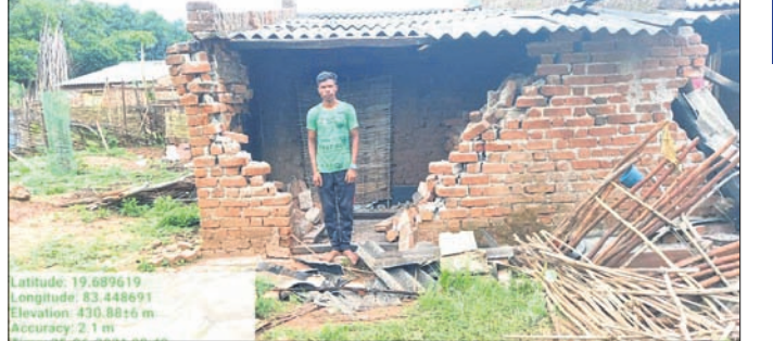
ହାତୀ ଭାଙ୍ଗିଦେଇଥିବା ଘର।