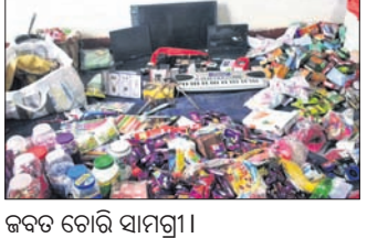
ଜବତ ଚୋରି ସାମଗ୍ରୀ।