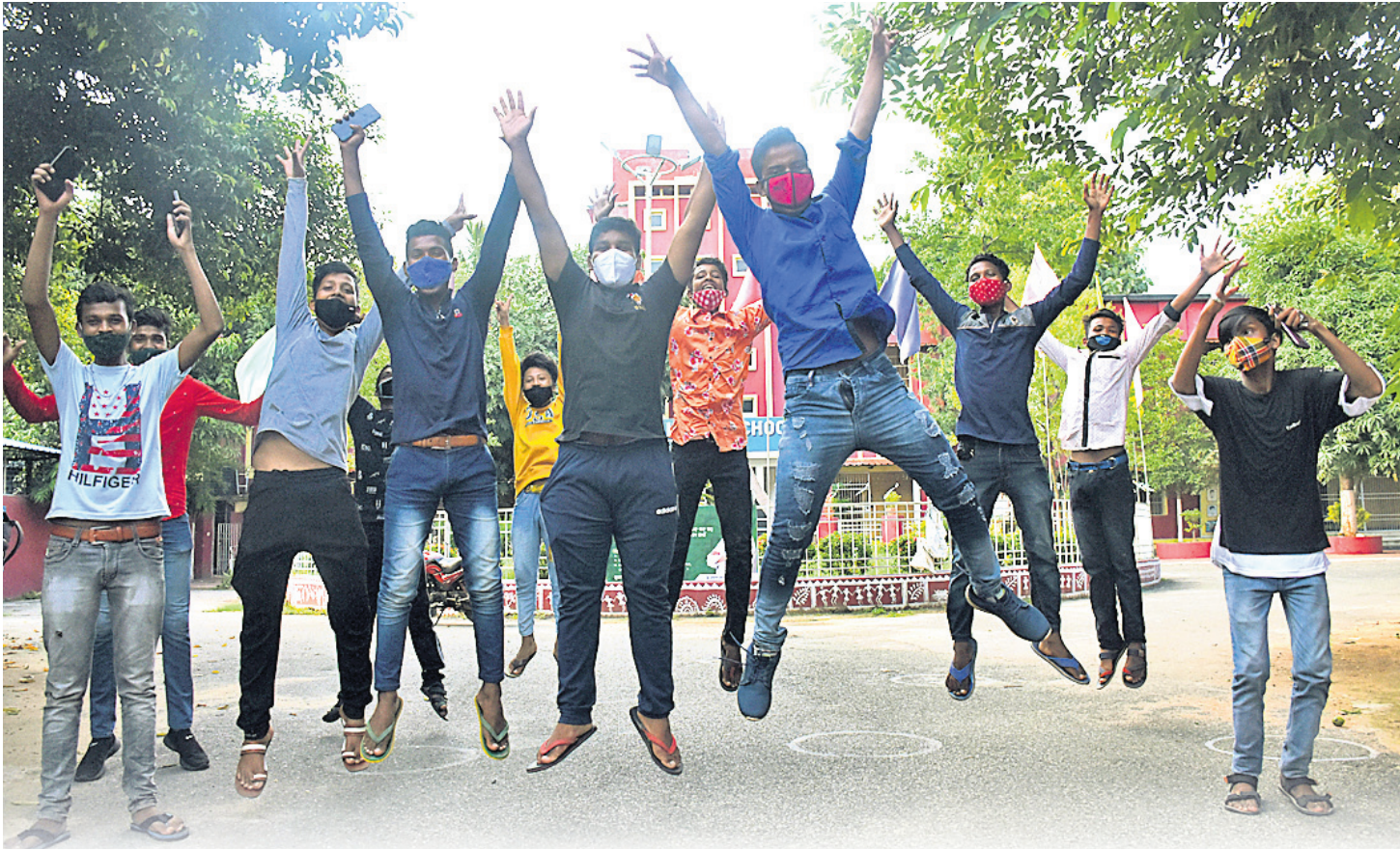
ପରୀକ୍ଷାଫଳ ଜାଣିବା ପରେ ଭୁବନେଶ୍ଵର କ୍ୟାମ୍ପସ୍‌ର ଛାତ୍ରଛାତ୍ରୀମାନେ ଖୁସି ମନାଉଛନ୍ତି।

ମହାମାରୀ କରୋନା ଯୋଗୁ ଚଳିତବର୍ଷ ମାଧ୍ୟମିକ ଶିକ୍ଷା ବୋର୍ଡ ଦ୍ଵାରା ପରିଚାଳିତ ମାଟ୍ରିକ ପରୀକ୍ଷା ସମ୍ପର୍କ ହୋଇପାରି ନ ଥିଲା। ବିକଳ ବ୍ୟବସ୍ଥା ଭାବେ ସରକାରଙ୍କ ଦ୍ଵାରା ଗଠିତ କମିଟି ମୂଲ୍ୟାୟନ ପଦ୍ଧତି ବାହାର କରିଥିଲା। ତଦନୁଯାୟୀ ଶୁକ୍ରବାର ପ୍ରକାଶ ପାଇଛି ପରୀକ୍ଷାଫଳ। ପ୍ରଥମଥର ପାଇଁ ବିନା ପରୀକ୍ଷାରେ ପ୍ରକାଶ ପାଇଥିବା ଫଳକୁ ନେଇ ଛାତ୍ରଛାତ୍ରୀ, ଅଭିଭାବକ, ଶିକ୍ଷାବିତମାନେ ଭିନ୍ନ ଭିନ୍ନ ମତପୋଷଣ କରିଛନ୍ତି। ଅନେକ ଛାତ୍ରଛାତ୍ରୀ ଖୁସି ବ୍ୟକ୍ତ କରିଥିବାବେଳେ ବହୁ ମେଧାବୀ ନିରାଶ ହୋଇଛନ୍ତି। ସ୍ଥିତି ସ୍ଵାଭାବିକ ହେଲେ ପରୀକ୍ଷା ଦେବାର ବ୍ୟବସ୍ଥା ଥିବାରୁ ଅସଦ୍‌ବୃଷ୍ଟ ଛାତ୍ରଛାତ୍ରୀଙ୍କୁ ଆଶ୍ଵସ୍ତି ମିଳିଛି।