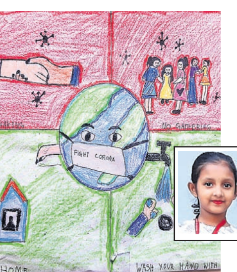
ପ୍ରତିଲିପି ମୁହୁଲି, କ୍ଲାସ୍-୪, କେଜି ଆଇଏନ୍ ଏସ୍, ତିଳିକା