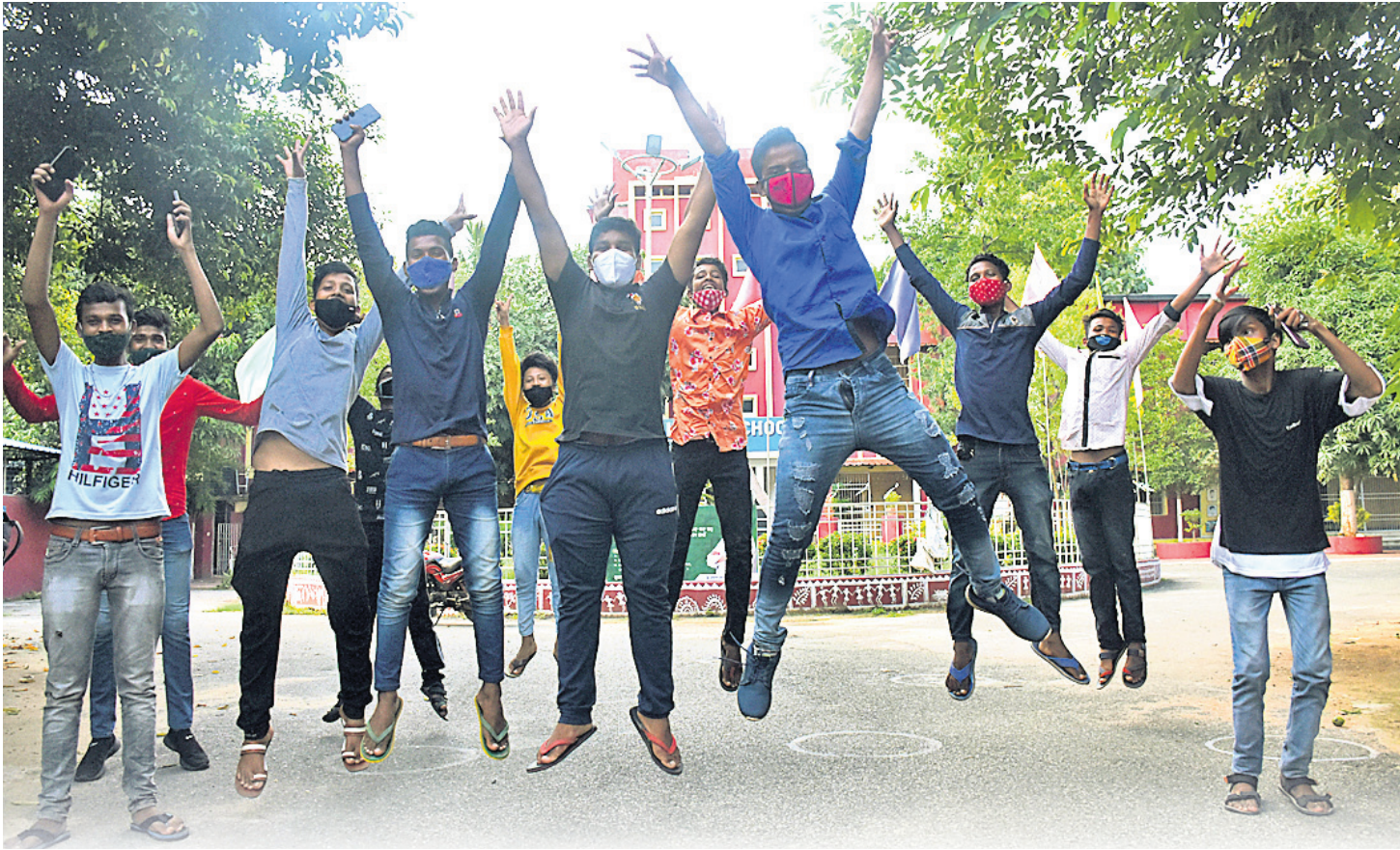
ପରୀକ୍ଷାଫଳ ଜାଣିବା ପରେ ଭୁବନେଶ୍ୱର କ୍ୟାମ୍ପସ୍‌ର ଛାତ୍ରଛାତ୍ରୀମାନେ ଖୁସି ମନାଉଛନ୍ତି।

ମହାମାରୀ କରୋନା ଯୋଗୁ ଚଳିତବର୍ଷ ମାଧ୍ୟମିକ ଶିକ୍ଷା ବୋର୍ଡ ଦ୍ୱାରା ପରିଚାଳିତ ମାଟ୍ରିକ ପରୀକ୍ଷା ସମ୍ପର୍କ ହୋଇପାରି ନ ଥିଲା। ବିକଳ ବ୍ୟବସ୍ଥା ଭାବେ ସରକାରଙ୍କ ଦ୍ୱାରା ଗଠିତ କମିଟି ମୂଲ୍ୟାୟନ ପଦ୍ଧତି ବାହାର କରିଥିଲା। ତଦନୁଯାୟୀ ଶୁକ୍ରବାର ପ୍ରକାଶ ପାଇଛି ପରୀକ୍ଷାଫଳ ପ୍ରଥମଥର ପାଇଁ ବିନା ପରୀକ୍ଷାରେ ପ୍ରକାଶ ପାଇଥିବା ଫଳକୁ ନେଇ ଛାତ୍ରଛାତ୍ରୀ, ଅଭିଭାବକ, ଶିକ୍ଷାବିତମାନେ ଭିନ୍ନ ଭିନ୍ନ ମତପୋଷଣ କରିଛନ୍ତି। ଅନେକ ଛାତ୍ରଛାତ୍ରୀ ଖୁସି ବ୍ୟକ୍ତ କରିଥିବାବେଳେ ବହୁ ମେଧାବୀ ନିରାଶ ହୋଇଛନ୍ତି। ସ୍ଥିତି ସ୍ୱାଭାବିକ ହେଲେ ପରୀକ୍ଷା ଦେବାର ବ୍ୟବସ୍ଥା ଥିବାରୁ ଅସଦ୍‌ବୃଷ୍ଟି ଛାତ୍ରଛାତ୍ରୀଙ୍କୁ ଆଶ୍ୱସ୍ତି ମିଳିଛି।