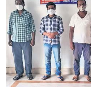
କାଳିମେଳା ଓ ଚିତ୍ରକୋଣ୍ଡା ଅଞ୍ଚଳରୁ ଗିରଫ କ୍ୱାକ୍ ଓ ସେମାନଙ୍କଠାରୁ ଜବତ ଔଷଧ।

ସରକାର ଲୋକଙ୍କ ସ୍ୱାସ୍ଥ୍ୟସେବା ଲାଗି ବହୁ ଯୋଜନା କାର୍ଯ୍ୟକାରୀ କରୁଛନ୍ତି। ସମସ୍ତେ ଯେପରି ସ୍ୱାସ୍ଥ୍ୟସେବା ପାଇବେ ସେଥିପ୍ରତି ଗୁରୁତ୍ୱ ଦେଉଛନ୍ତି। ମାତ୍ର ଆଦିବାସୀ ଅଧିକ ଅଞ୍ଚଳରେ ଠିକ୍ ରୂପେ ସ୍ୱାସ୍ଥ୍ୟସେବା ପହଞ୍ଚୁନାହିଁ। ସ୍ୱାସ୍ଥ୍ୟସେବା ସୁବିଧା ନେବାକୁ ମଧ୍ୟ ଲୋକେ ଗ୍ରାମାଞ୍ଚଳରେ ଥିବା ଆଶାକର୍ମୀ, ଅଜ୍ଞାନସ୍ଥିତି କର୍ମୀ, ଏସନମ୍ କଳ୍ପନାରେ ନ ପହଞ୍ଚୁ କ୍ୱାକ୍ନାମକ ପାଖକୁ ଯାଉଛନ୍ତି। ଏହାର ସୁଯୋଗ ଗ୍ରାମାଞ୍ଚଳର କ୍ୱାକ୍ନାମେ ନେଉଛନ୍ତି। ବିନା ଡାକ୍ତରୀ ଶିକ୍ଷାରେ ସେମାନେ ରୋଗୀଙ୍କ ଜୀବନ ସହ ଖେଳୁଛନ୍ତି। କେତେକ କ୍ଷେତ୍ରରେ ରୋଗୀଙ୍କର ମୃତ୍ୟୁ ହେବା ପରି ନିକିର ମଧ୍ୟ ରହିଛି। ମାଲକାନଗିରି ଜିଲ୍ଲା କାଳିମେଳା ବ୍ଲକ୍ରେ ଏପରି ଅଭିଯୋଗ ହେବା ପରେ ଏସ୍ପିଙ୍କ ନିର୍ଦ୍ଦେଶରେ ବିଭିନ୍ନ ଥାନା ଅଞ୍ଚଳରେ ସ୍ୱାତ୍ୱ ଗଠନ ହୋଇଛି। ତେବେ କାଳିମେଳା ଓ ଚିତ୍ରକୋଣ୍ଡାରେ ପୋଲିସ୍ ଫୋର୍ସ ତନାଘନା ଚଳାଇଛନ୍ତି। ଏଠାରେ ଚର୍ଚ୍ଚା ଜୋର ଧରିଛି। ସାଲ୍ଡିପିକ୍ ଟିମ୍ ଓ ସହାୟୀ କୁକୁର ଦ୍ୱାରା ତଦନ୍ତ କାରି।