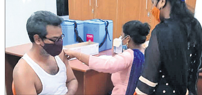
କେନ୍ଦ୍ରାପଡ଼ା ଡାକ୍ତରଖାନାରେ ଚାଲିଛି ଚିକାକରଣ।