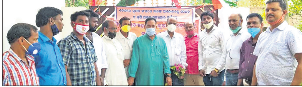
ଆନ୍ଦୋଳନରେ ସାମିଲ ହୋଇଥିବା ଆଇଏନଟିମୁସି ସଦସ୍ୟମାନେ।

ଯାଜପୁର ରୋଡ, ୨୬/୬ (ଡି.ଏନ.ଏ.) ଆଇଏନଟିମୁସି କାର୍ଯ୍ୟକ୍ରମରେ ଯୋଗଦେଇ ଉପସ୍ଥିତ ଥିବା ଆଇଏନଟିମୁସିର ଜିଲ୍ଲା କାର୍ଯ୍ୟକାରୀ କେନ୍ଦ୍ରୀୟ ଟ୍ରେଡ ୟୁନିୟନ ଆକ୍ସନକମିଟି ଅଧ୍ୟକ୍ଷ ଡକ୍ଟର ଅନୁସୂତ ହୋଇଥିଲେ।