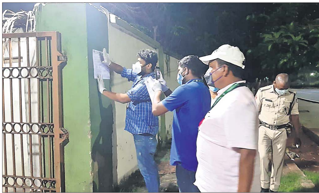
ଏଫଆଇଆରରେ ଯୋଗଦେଇଥିବା କର୍ମଚାରୀଙ୍କୁ ଶନିବାର କର୍ମଦିନେଷ୍ଟ କୋର୍ଟ୍ ନୋଟିସ୍ ଲଗାଯାଇଛି।