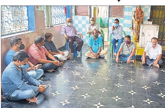
ବୈଠକରେ ଉପସ୍ଥିତ ଆଇନଜୀବୀ ଓ ଅଞ୍ଚଳର ବୁଦ୍ଧିଜୀବୀମାନେ।

ଗୁଣପୁର, ୨୬।୬(ଡି.ଏ.ଏ.ଏ.): ଆଜ୍ଞା ପ୍ରଦେଶର ନେତୃତ୍ୱରେ ବ୍ୟାପକ ନିର୍ମାଣକୁ ତ୍ରିଭୁବନାଳ ନିକଟରେ ଆଜ୍ଞାକୁ ସମ୍ଭବ କରାଯାଇଛି। ଏହାକୁ ନେଇ ରାୟଗଡ଼ା ଜିଲ୍ଲା ଗୁଣପୁର ଅଞ୍ଚଳବାସୀଙ୍କ ମଧ୍ୟରେ ଚାନ୍ଦ୍ର ଅପରୋଷ ପ୍ରକାଶ ପାଇଛି। ଏହି ବିଷୟକୁ ନେଇ ସ୍ଥାନୀୟ ଭେକେଟେଣ୍ଡର ମନ୍ଦିର ପ୍ରାଙ୍ଗଣରେ ଶନିବାର ଏକ ବୈଠକ ଅନୁଷ୍ଠିତ ହୋଇଥିଲା। ଏଥିରେ ରାଜ୍ୟ ସରକାରଙ୍କ ଅପାରଗତାକୁ ଦାୟୀ କରାଯାଇଛି।