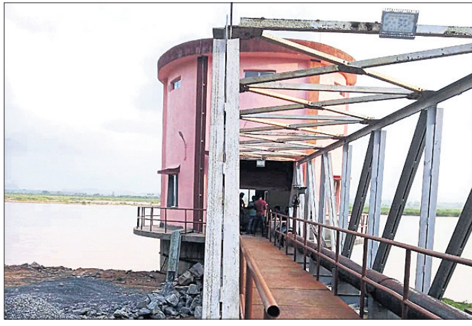
ବ୍ରାହ୍ମଣୀ ନଦୀର କୁମୁଡ଼ିରେ ଥିବା ସୁକିନ୍ଦର ପ୍ରଥମ ମେଘା ଜଳ ପ୍ରକଳ୍ପ।