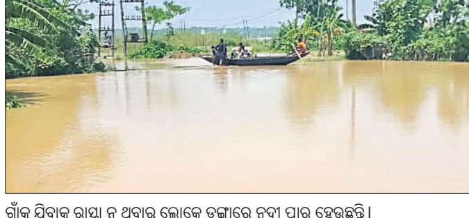
ଗାଁକୁ ଯିବାକୁ ରାସ୍ତା ନ ଥିବାରୁ ଲୋକେ ଡଙ୍ଗାରେ ନଦୀ ପାର ହେଉଛନ୍ତି।

ସାଧାରଣତଃ ଦୀର୍ଘ ଦଶନ୍ଧି ଅତିକ୍ରମ ପରେ ମଧ୍ୟ ଅନେକ ଲୋକ ମୌଳିକ ସୁବିଧା ପାଇବାକୁ ବହୁତ ହେଉଛନ୍ତି। ଲୋକମାନଙ୍କର ଉନ୍ନତି ପାଇଁ କେନ୍ଦ୍ର ଓ ରାଜ୍ୟ ସରକାର କୋଟି କୋଟି ଟଙ୍କା ଖର୍ଚ୍ଚ କରୁଛନ୍ତି। ଶିକ୍ଷା, ସ୍ୱାସ୍ଥ୍ୟ, ଗମନାଗମନର ମୌଳିକ ଆବଶ୍ୟକତାକୁ ମେଣ୍ଟାଇବାକୁ ଚେଷ୍ଟା ହେଉଛି। କିନ୍ତୁ ଏହା କେତେଦୂର କାର୍ଯ୍ୟକାରୀ ହେଉଛି, ତାହା ଦେଖିବାକୁ କାହାରି ଆଗ୍ରହ ନାହିଁ। ଲୋକମାନେ ଆବାହନୀୟ କାଳରୁ ଯେମିତି ଜଳବନ୍ଦୀ ଥିଲେ ସେମିତି ଏବେ ବି ରହିଛନ୍ତି। ଏକଲି ଏକ ଅଞ୍ଚଳ ହେଉଛି କେନ୍ଦ୍ରାପଡ଼ା ଜିଲ୍ଲା ଆଲି ରାସ୍ତାରେ ପାଣି ଜମିବା ଦ୍ୱାରା ଯାତାୟତ କରିବା ଫଳରେ ଚର୍ମ ରୋଗ ଥିବାର ହେଉଥିବା ଗ୍ରାମବାସୀ କହିଛନ୍ତି। ଛୋଟ ପିଲା ଓ ବୃତ୍ତାନ୍ତ ଏହି ବାଟ ଦେଇ ଯିବା କଷ୍ଟ ସାଧ୍ୟ ହୋଇ ପଡୁଛି। ତେଣୁ ଉକ୍ତ ଗାଁରୁ ଜଳ ନିଷ୍କାସନର ବ୍ୟବସ୍ଥା କରିବାକୁ ସ୍ଥାନୀୟ ବାସିନ୍ଦା ପ୍ରଶ୍ନାସନ ନିକଟରେ ଦାବି କରିଛନ୍ତି।