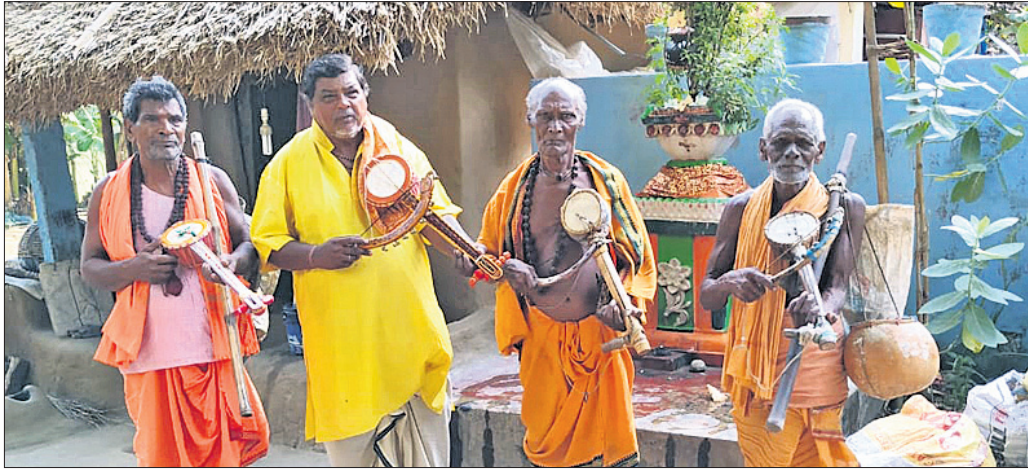
ଜିଲାର କେନ୍ଦ୍ରୀୟ କଳାକାରମାନେ।

ଗାଁଗଣ୍ଡାରେ ଆଉ କେନ୍ଦ୍ରର ସ୍ୱର ଶୁଣୁ ନାହିଁ। ରାତି ଅନିଦ୍ରା ହୋଇ କେହି ପାଲ ଦାସକାଠିଆ ଦେଖୁନାହାନ୍ତି। କଣ୍ଠେଇ ଲୋକକଳା ବିଲ୍ଡିଂ ହେବାକୁ ଦୁର୍ଘଟଣା କଳାକାରଙ୍କୁ ଗତ ୪ ମାସ ହେବ ଭଙ୍ଗା ବି ମିଳୁନାହିଁ। ଫଳରେ ସେହି ପରିବାର ସଦସ୍ୟମାନେ ଭୋକ ଉପାସରେ ଦିନ କାନ୍ଦୁଥିବା ଅଭିଯୋଗ ହୋଇଛି।