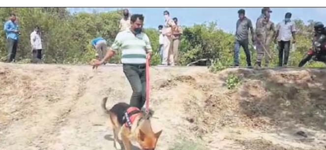
ଘଟଣାସ୍ଥଳରେ ପୋଲିସ୍ ଓ ସହାୟୀ କୁକୁରର ତଦନ୍ତ କାରି।

କେନ୍ଦ୍ରାପଡ଼ା ଜିଲ୍ଲା ମହାକାଳପଡ଼ା ବ୍ଲକ୍ କମ୍ପ୍ୟୁଟର ସାମୂହିକ ଥାନା ଅଧୀନ କମ୍ପ୍ୟୁଟର ପଞ୍ଚାୟତ କଣ୍ଠରାପାଟିଆ ଗ୍ରାମ ସଂଲଗ୍ନ ପୁଟା କୋରି ପାଖରେ ଜଣେ ମହିଳାଙ୍କୁ ଶୁକ୍ରବାର ରାତିରେ ଗଳାକାଟି ହତ୍ୟା କରାଯାଇଛି। ମୃତଦେହ ପଡ଼ିଥିବା ସ୍ଥାନଠାରୁ ଅଳ୍ପ ଦୂର ଛାଣା ଜଙ୍ଗଲରେ ତାଙ୍କ ୨ବର୍ଷର ଶିଶୁପୁତ୍ରକୁ ମୃତ୍ୟୁ ଅବସ୍ଥାରେ ଉଦ୍ଧାର କରାଯାଇଛି। ଉକ୍ତ ଶିଶୁର ମୁଣ୍ଡକୁ ପଥରରେ ଛେଦି ହତ୍ୟା କରିବାକୁ ଉଦ୍ୟମ କରାଯାଇଥିବା ପରିପାତ୍ରିକ ସ୍ଥିତିରୁ ସ୍ପଷ୍ଟ ହୋଇଛି। ଗୁରୁତର ଅବସ୍ଥାରେ ତାଙ୍କୁ ପ୍ରଥମେ କେନ୍ଦ୍ରାପଡ଼ା ଜିଲ୍ଲା ଡାକ୍ତରଖାନାରେ ଭର୍ତ୍ତି କରାଯାଇଥିଲା। ଅବସ୍ଥା ଗୁରୁତର ଥିବାରୁ କଟକ ବଡ଼ ଡାକ୍ତରଖାନାକୁ ସ୍ଥାନାନ୍ତର କରାଯାଇଛି। ଘଟଣାସ୍ଥଳରୁ ପୋଲିସ୍ ମଦ ସୋଡ଼ାଲ, ଗ୍ଲୁସ୍, ଗ୍ଲୋବ୍, ଛୁରି, ଗାଞ୍ଜା ଇତ୍ୟାଦି ଜବତ କରିଛି। ଏହା ଏକ ସୁପରିକଳ୍ପିତ ହତ୍ୟାକାଣ୍ଡ ବୋଲି ପୋଲିସ୍ ପ୍ରାଥମିକ ତଦନ୍ତରୁ ଅନୁମାନ କରାଯାଇଛି। ମୃତ ମହିଳାଙ୍କ ପରିଚୟ ମିଳିନାହିଁ। କେନ୍ଦ୍ରାପଡ଼ା ଏସ୍ପି ମଦକର ସହଯୋଗ ସମ୍ପଦ