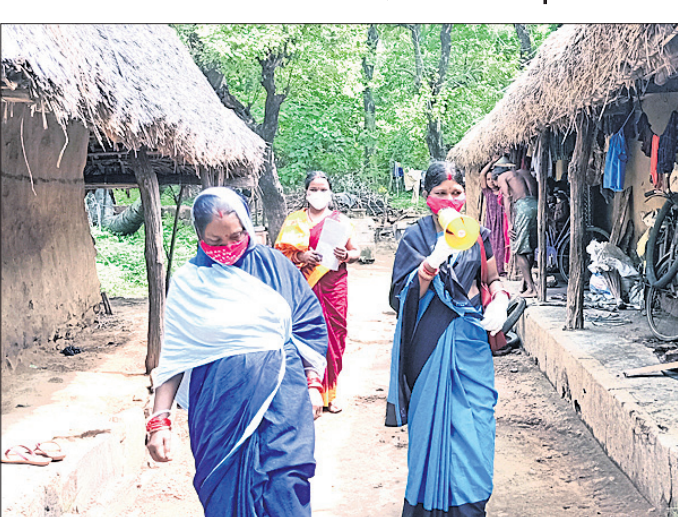
ଆଶା ଓ ଅଜ୍ଞାନତ୍ୱାତି କର୍ମୀ ଲୋକଙ୍କୁ ସଚେତନ କରାଉଛନ୍ତି।