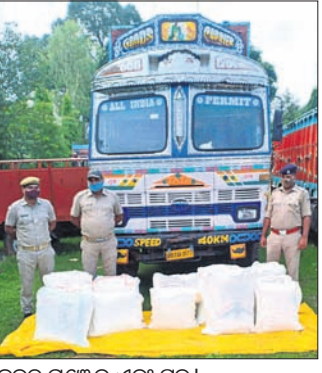
ଜବତ ଗଞ୍ଜେଇ ଏବଂ ଟ୍ରକ୍

ରାୟଗଡ଼ାକୁ ପୁନିଗୁଡ଼ା ଦେଇ ରାଜ୍ୟ ବାହାରକୁ ଚାଲିଗଲା ହେଉଥିବା ଏକ ଗଞ୍ଜେଇ ବୋହେଇ ଟ୍ରକ୍ ବିଷମକଟକ ପୋଲିସ୍ ଜବତ କରିଛି। ସେଥିରୁ ୨୪୦ କେଜି ଗଞ୍ଜେଇ ଜବତ କରାଯାଇଛି।