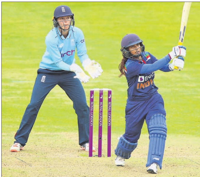
କ୍ୟାରିୟରର ୫୭ତମ ଦିନିକିଆ ଅର୍ଦ୍ଧଶତକ ହାସଲ ଅବସରରେ ମିଥାଲି ରାଜା।

ଭାରତ ବିପକ୍ଷ ପ୍ରଥମ ମହିଳା ଦିନିକିଆ କ୍ରିକେଟ ମ୍ୟାଚ୍ରେ ୯୧ ବଲ୍ ବାକିଥିଲା ଇଂଲଣ୍ଡ ୮ ଉଇକେଟରେ ବିଜୟୀ ହୋଇଛି। ଚ୍ୟୁ ହାରି ପ୍ରଥମେ ବ୍ୟାଟିଂ କରି ଭାରତ ନିର୍ଦ୍ଧାରିତ ୫୦ ଓଭରରେ ୮ ଉଇକେଟ ହରାଇ ୨୦୧ ରନ ସଂଗ୍ରହ କରିଥିଲା। ଜବାବରେ ଇଂଲଣ୍ଡ ୩୪.୫ ଓଭରରେ ୨ ଉଇକେଟ ବିନିମୟରେ ବିଜୟ ଲକ୍ଷ୍ୟ ହାସଲ କରି ନେଇଥିଲା। ଓପନର ଚମିକିମାଟ୍ ୬୭ ଓ ନାତାଲି ସିଭର ୨୪ ରନ କରି ଅପରାଜିତ ରହିଥିଲେ। ଅଧିନାୟିକା ହିଅନ୍ ନାଲଟ ୧୮ ଓ ଲଲରେ ଫ୍ରିନ୍ସିଲ୍-ହିଲ୍ ୧୬ ରନ କରି ମଧ୍ୟାହ୍ନେ ଏକତା ବିଷ୍ଟ ଓ ଡୁଲ୍ଲିଶ ଗୋଷାମାଙ୍କ ଦ୍ୱାରା ଆଉଟ ହୋଇଥିଲେ। ବିଜୟ ସହ ଇଂଲଣ୍ଡ ୩ ମ୍ୟାଚ୍ ବିଷ୍ଟି ସିରିଜରେ ୧-୦ରେ ଅଗ୍ରଣୀ ହୋଇଛି। ବିଷ୍ଟ ପ୍ଲେୟର ଅଫ୍ ଦି ମ୍ୟାଚ୍ ବିବେଚିତ ହୋଇଛନ୍ତି।