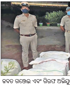
ଜବତ ଗଞ୍ଜେଇ ଏବଂ ଗିରଫ ଅଭିଯୁକ୍ତ ।

୮୦ ବର୍ଷରେ ତତ୍କାଳୀନ ଶାସକ ବକର ନିଷ୍ଠିତ ଯୋଗୁଁ ଇନ୍ଦ୍ରାବତୀ ନଦୀ ପାଣି ତଳ ଅଞ୍ଚଳକୁ ଜଳସେଚନ ଓ ପାନୀୟତା ବଞ୍ଚିତ କରିଛି। ଏହାର ସୁଧାର ପାଇଁ ତତ୍କାଳୀନ ଶାସକ ବକ ବିଭିନ୍ନ ପ୍ରୟାସ କରି ସୁଦୂର ନ ମିଳିବାରୁ ତଳ ପୁଣ୍ୟ ବିଶେଷଭାବେ ଶୁଖାଞ୍ଚଳବାସୀ ଓ ବିପ୍ଳାବିତଙ୍କ ରୋଷର ଶିକାର ହୋଇ ଆସିଛନ୍ତି। ଏତଦଧରେ ମୁଖ୍ୟମନ୍ତ୍ରୀ ତଥା ବେସିନ୍ ମ୍ୟାନେଜର କାର୍ଯ୍ୟାଳୟକୁ ଜୟପୁରକୁ ସ୍ଥାନାନ୍ତର କରିବା ପାଇଁ ନିଷ୍ଠିତ ନିଆଯାଇଛି। ଯାହାର ପରିଣାମ ଆଗାମୀ ତ୍ରିତୀୟା, ପଞ୍ଚାୟତ ଦିବସରେ ଶାସକ ବକ ପାଇଁ ମହଙ୍ଗା ସାଧ୍ୟତା ହେବ ବୋଲି ରାଜନୈତିକ ସମାପ୍ତକ ମତ ପ୍ରକାଶ କରୁଛନ୍ତି। ଇଂଲିନିୟର୍ କ୍ୟାଡର ପୁନର୍ବିନ୍ୟାସ ନାମରେ ୧୯୭୮ରେ ସ୍ଥାପିତ ଏକ କାର୍ଯ୍ୟାଳୟ ଯାହାରକି ବହୁ ଥର ନାମ