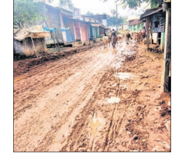
ଅଞ୍ଚଳର ରାସ୍ତା ।

ନବରଙ୍ଗପୁର ଜିଲ୍ଲା ଡେହୁଳିଖୁଣ୍ଟି ବ୍ଲକ୍‌ର ହାତଗଣିତ ରୁଦ୍ଧିତ ବ୍ୟବସାୟିକ କେନ୍ଦ୍ର ମଧ୍ୟରୁ ଅଞ୍ଚଳକୁ ଅନାମଦେ। ଏଠାରେ ଥିବା ବ୍ୟବସାୟ କେନ୍ଦ୍ରକୁ ଦୈନିକ ବୁଲୁ ଚିନୋଟି ଭାରି ଯାନ ଆହୁଛି। ଏଠାରେ ଭାରତୀୟ ସ୍ଵେଚ୍ଛା ବ୍ୟାଙ୍କର ଏକ ଶାଖା ମଧ୍ୟ ରହିଛି। ବ୍ୟାଙ୍କ ତଥା ବଜାରକୁ ଲୋକାବିକା ପାଇଁ ପ୍ରତ୍ୟହ ଶତାଧିକ ଲୋକଙ୍କ ଚଳାପ୍ରକଟ ସହ ଯାନବାହନ ଯାତାୟତ କରୁଛି। କିନ୍ତୁ ଏହି ଗ୍ରାମର ମୁଖ୍ୟ ରାସ୍ତା କର୍ମମାଳ ହୋଇ ରହିଛି। ଲୋକଙ୍କୁ ଯାତାୟତ ପାଇଁ ବହୁ ଅସୁବିଧା ହେଉଛି। ଗାଡ଼ିର ଚକା ବଦି ରାସ୍ତା