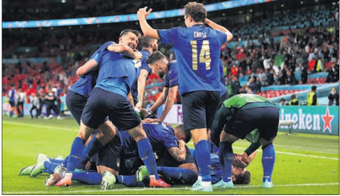
ବିଜୟ ହାସଲ ପରେ ଇଟାଲୀ ଖେଳାଳି ଖୁସି ମନାଉଛନ୍ତି।

ଲଣ୍ଡନ, ୨୭।୬ ଚଳିତ ଯୁରୋକପ୍ ପୁରସ୍କାର ଚୂନାମେଣ୍ଟରେ ଶ୍ରେଷ୍ଠତା ଲଗାଳା କ୍ୱାର୍ଟର ଫାଇନାଲରେ ପ୍ରବେଶ କରିଛି। ରବିବାର ଅନୁଷ୍ଠିତ ରାଉଣ୍ଡ ଅଫ୍ ୧୬ ମ୍ୟାଚ୍ରେ ଇଟାଲୀ ୨-୧ ଗୋଲରେ ଅଷ୍ଟ୍ରିଆକୁ ପରାସ୍ତ କରି କ୍ୱାର୍ଟରକୁ ଉନ୍ନତ ହୋଇଛି। ଏହାପୂର୍ବରୁ ପ୍ରଥମ ମ୍ୟାଚ୍ରେ ତେନିମାକ୍ ୪-୦ ଗୋଲ ଖେଳୁଥିବା ହରାଇ ପ୍ରଥମପଦ ଭାବେ କ୍ୱାର୍ଟର ଫାଇନାଲରେ ପ୍ରବେଶ କରିଥିଲା। ସ୍ଥାନୀୟ ଫ୍ରିଲେ ଷ୍ଟାଡ଼ିୟମରେ ଖେଳାଯାଇଥିବା ଏହି ମ୍ୟାଚ୍ରେ ଅଷ୍ଟ୍ରିଆକୁ ହରାଇବା ପାଇଁ ଇଟାଲୀକୁ କିନ୍ତୁ ଖୁବ୍ ସଫର୍ଯ୍ୟ କରିବାକୁ ପଡ଼ିଥିଲା। ଅତିରିକ୍ତ ସମୟରେ ଇଟାଲୀ ତରଫରୁ ବିଜୟ ଯୁକ୍ତ ଗୋଲ ଦିଆଯାଇଥିଲା। ପ୍ରଥମ ଥର ପାଇଁ ଅଷ୍ଟ୍ରିଆ ଗ୍ରୁପ୍ ପର୍ଯ୍ୟାୟରେ ପ୍ରବେଶ କରିଥିଲା। ଏହାପୂର୍ବରୁ ପ୍ରତିଥର ଅଷ୍ଟ୍ରିଆ ଗ୍ରୁପ୍ ପର୍ଯ୍ୟାୟରେ ପରାସ୍ତ ହୋଇ ଚୂନାମେଣ୍ଟରୁ ବାଦ୍ ପଡ଼ିଆସୁଥିଲା। ଏଥିସହ ଇଟାଲୀ କ୍ରମାଗତ ଦ୍ୱିତୀୟ ବିଜୟ ହାସଲ କରିଛି। ଇଟାଲୀ ପ୍ରଭାବ ଦ୍ୱାରା